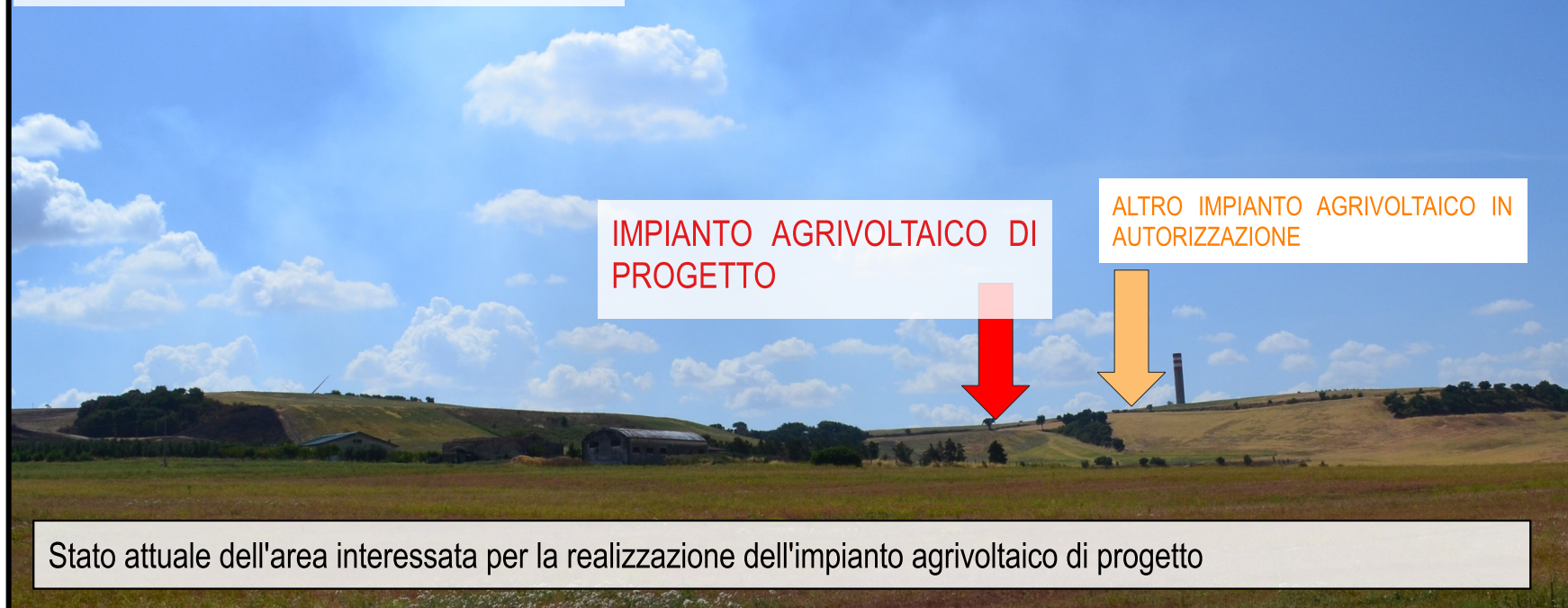
Stato attuale dell'area interessata per la realizzazione dell'impianto agrivoltaico di progetto