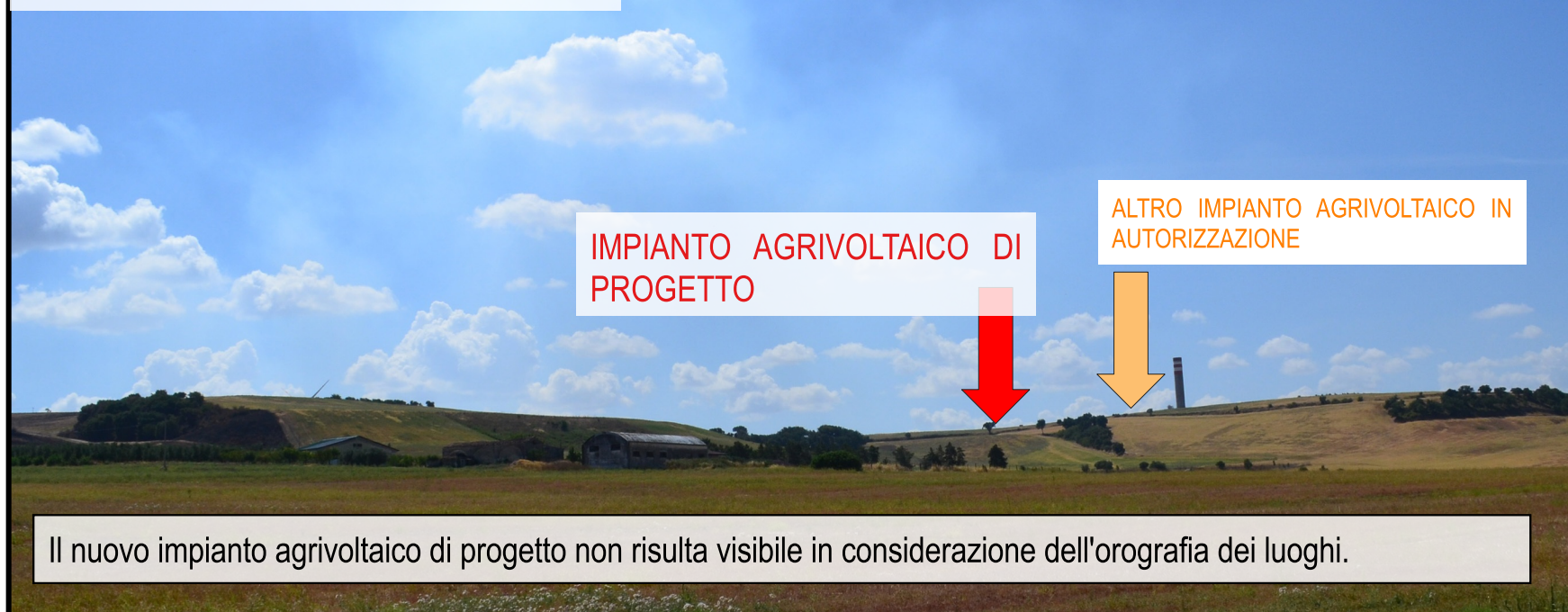
Il nuovo impianto agrivoltaico di progetto non risulta visibile in considerazione dell'orografia dei luoghi.