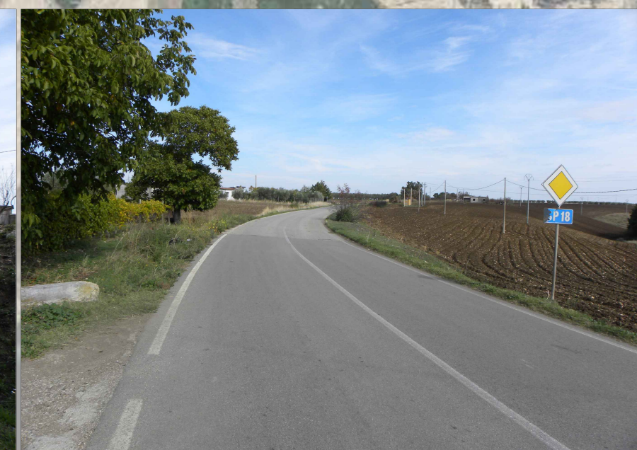
18. Vista da strada SP 18 Ofantina (0,3 Km dalla nuova stazione SE)