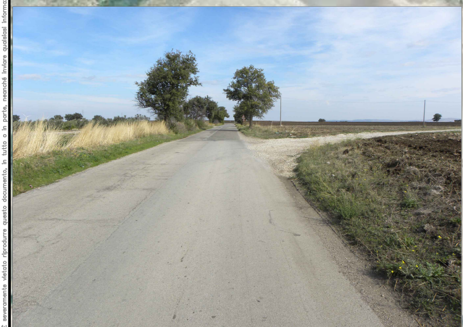
15. Vista da strada SP 18 Ofantina (3,3 Km dalla nuova stazione SE)