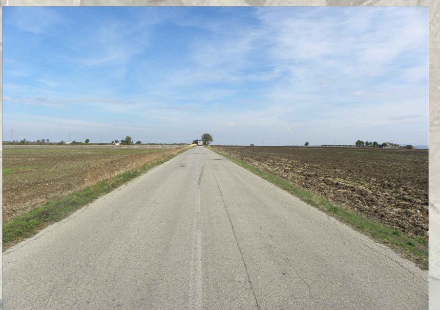
16. Vista da strada SP 18 Ofantina (2,4 Km dalla nuova stazione SE)