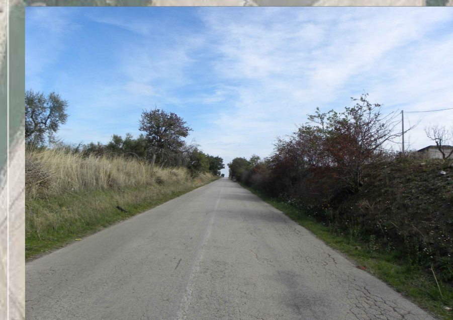
17. Vista da strada SP 18 Ofantina (1,5 Km dalla nuova stazione SE)