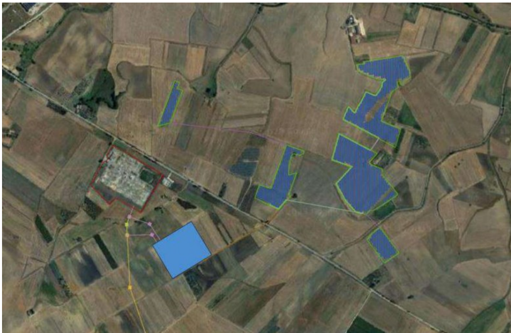
Figura 02: Inquadramento su ortofoto dell'area di ingombro dell'impianto fotovoltaico e del cavidotto