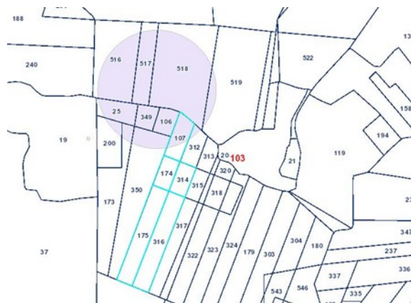
Figura 10: Particolare dell'area con segnalazioni della Carta dei Beni con buffer di 100 m e le particelle interessate dall'impianto

Risulta che l'area con vincolo di Segnalazione della Carta dei Beni con buffer di 100 m sfiora parte dell'impianto relativa al campo 1. L'impianto si estende solo su parte della particella 107.