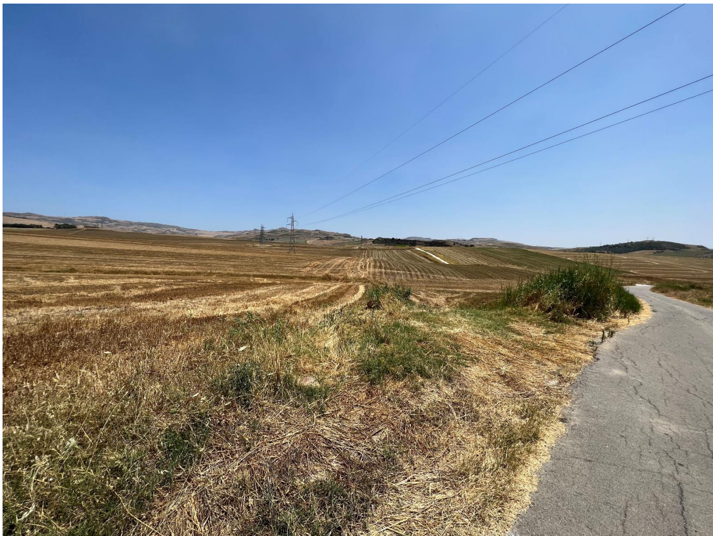
Figura 3_ vista da strada comunale_comune di Sclafani Bagni