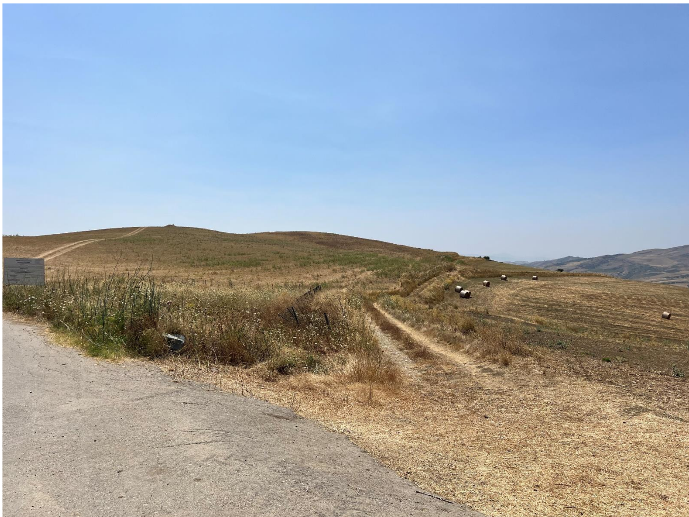
Figura 30_vista da strada interpodereale_comune Polizzi Generosa