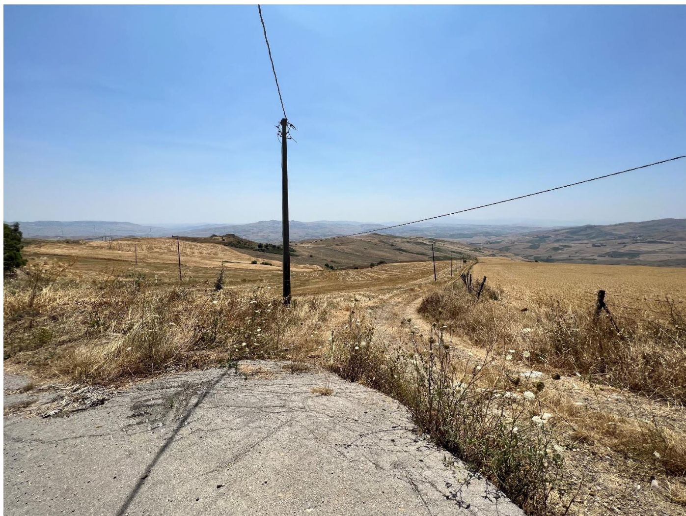
Figura 33_vista da SP64_comune Polizzi Generosa