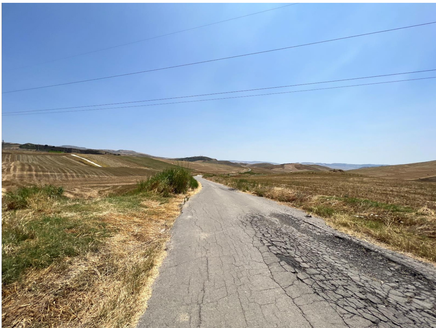
Figura 4 _vista da strada comunale_ comune di Sclafani Bagni