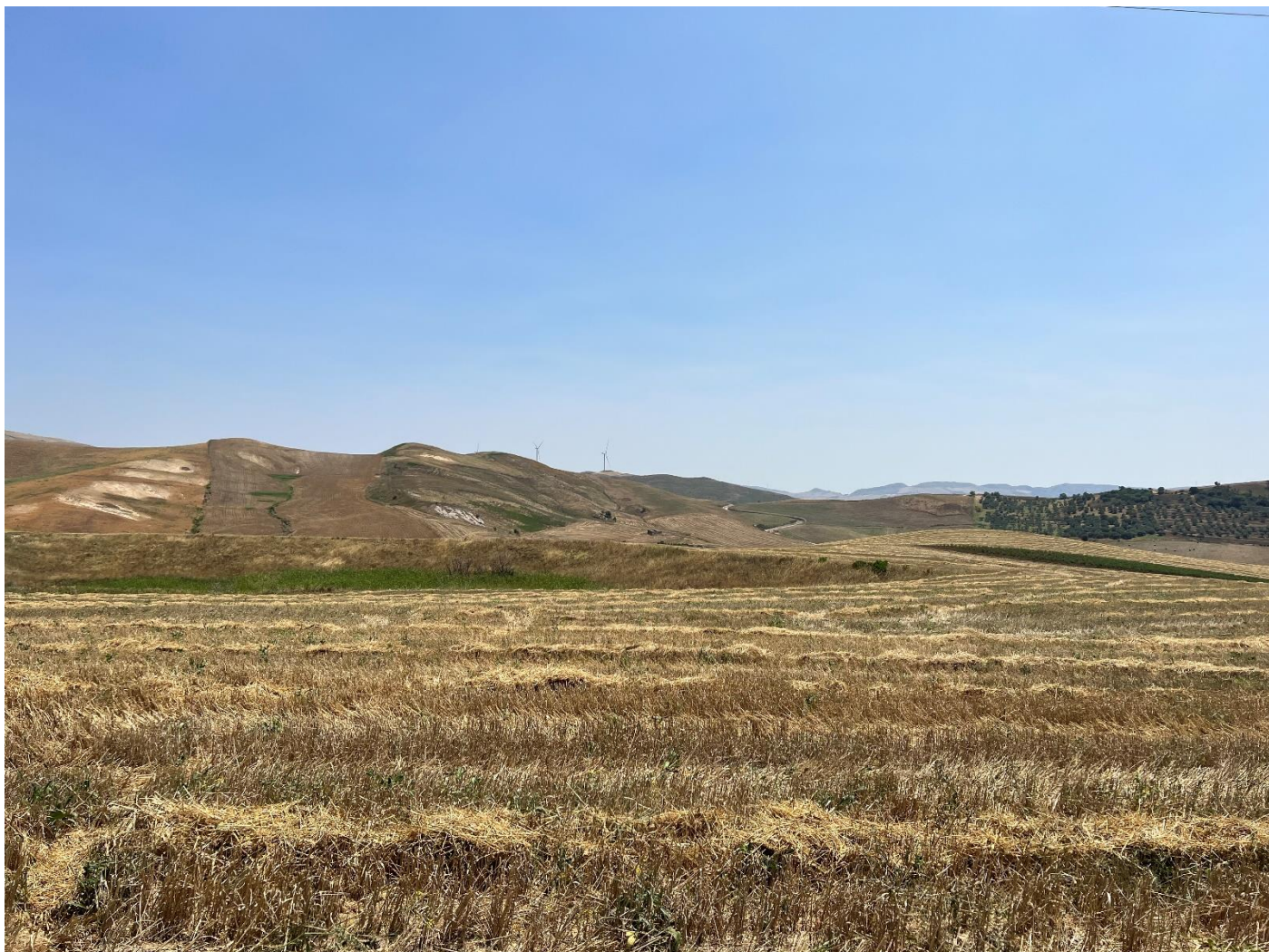
Figura 18_vista da strada interpodereale_comune Polizzi Generosa