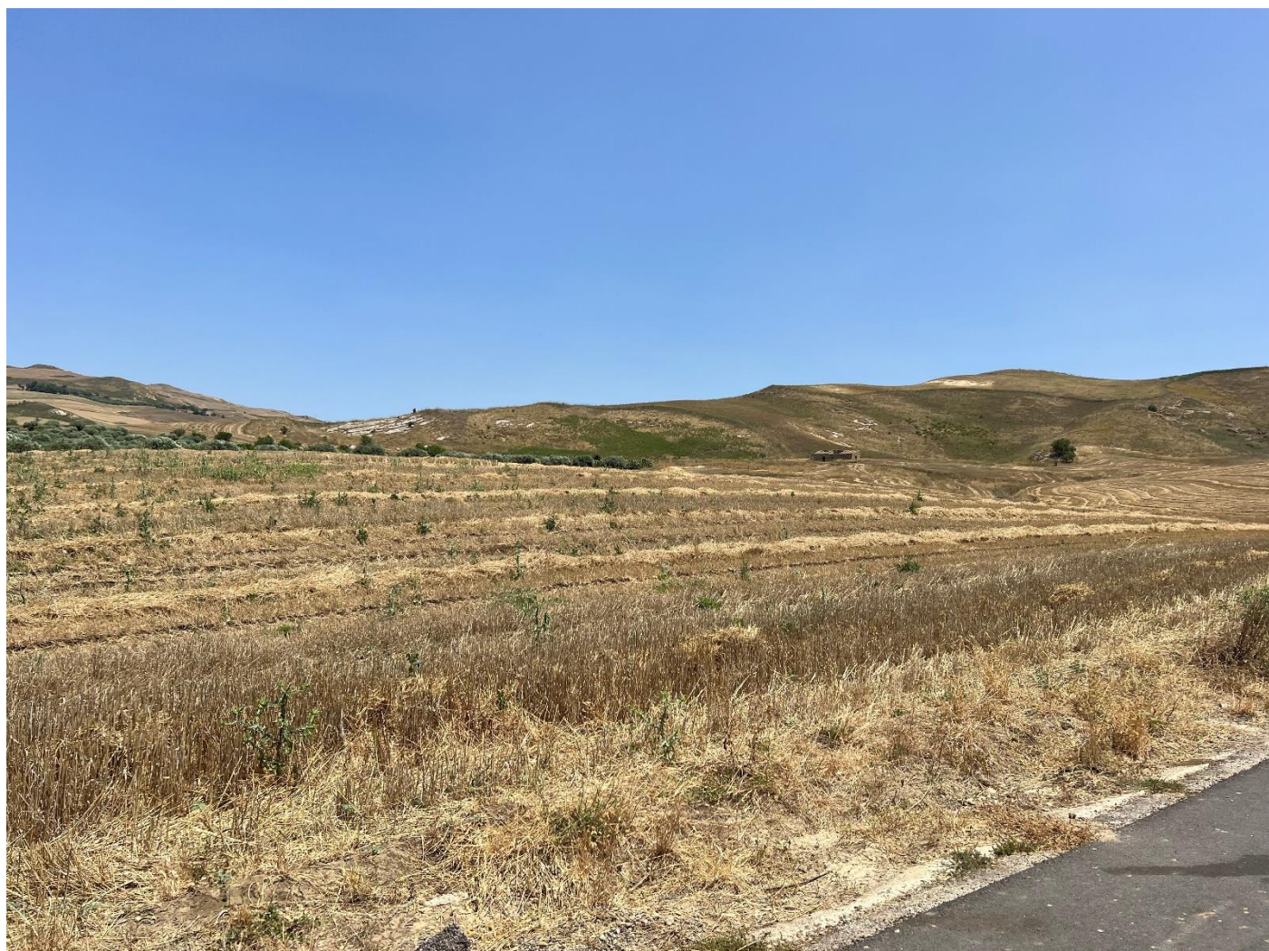
Figura 8_ vista Sda P64_ comune di Polizzi Generosa