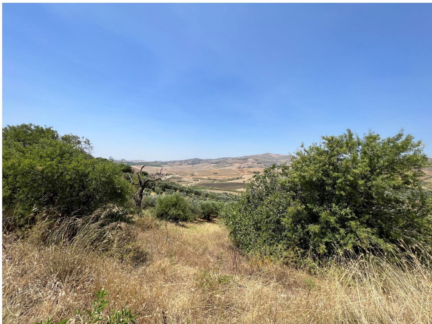
Figura 11_ vista in prossimita' della SP64_ comune di Polizzi Generosa