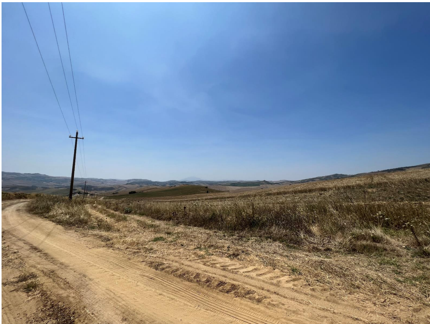
Figura 22_vista da strada interpodereale_comune Polizzi Generosa