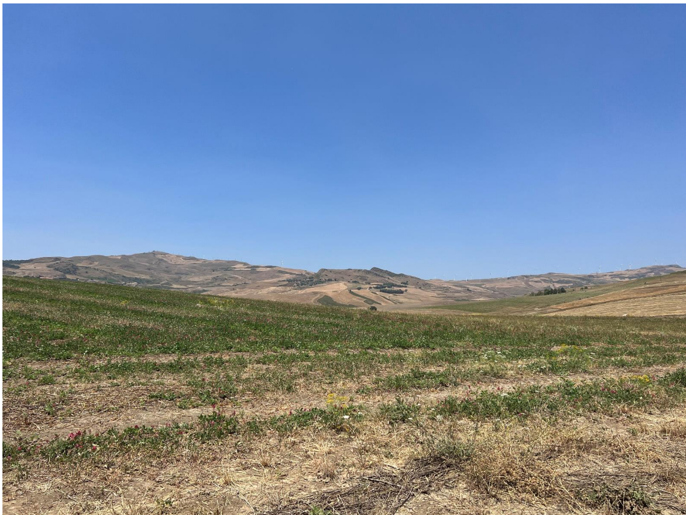
Figura 20_vista da strada interpodereale_comune Polizzi Generosa