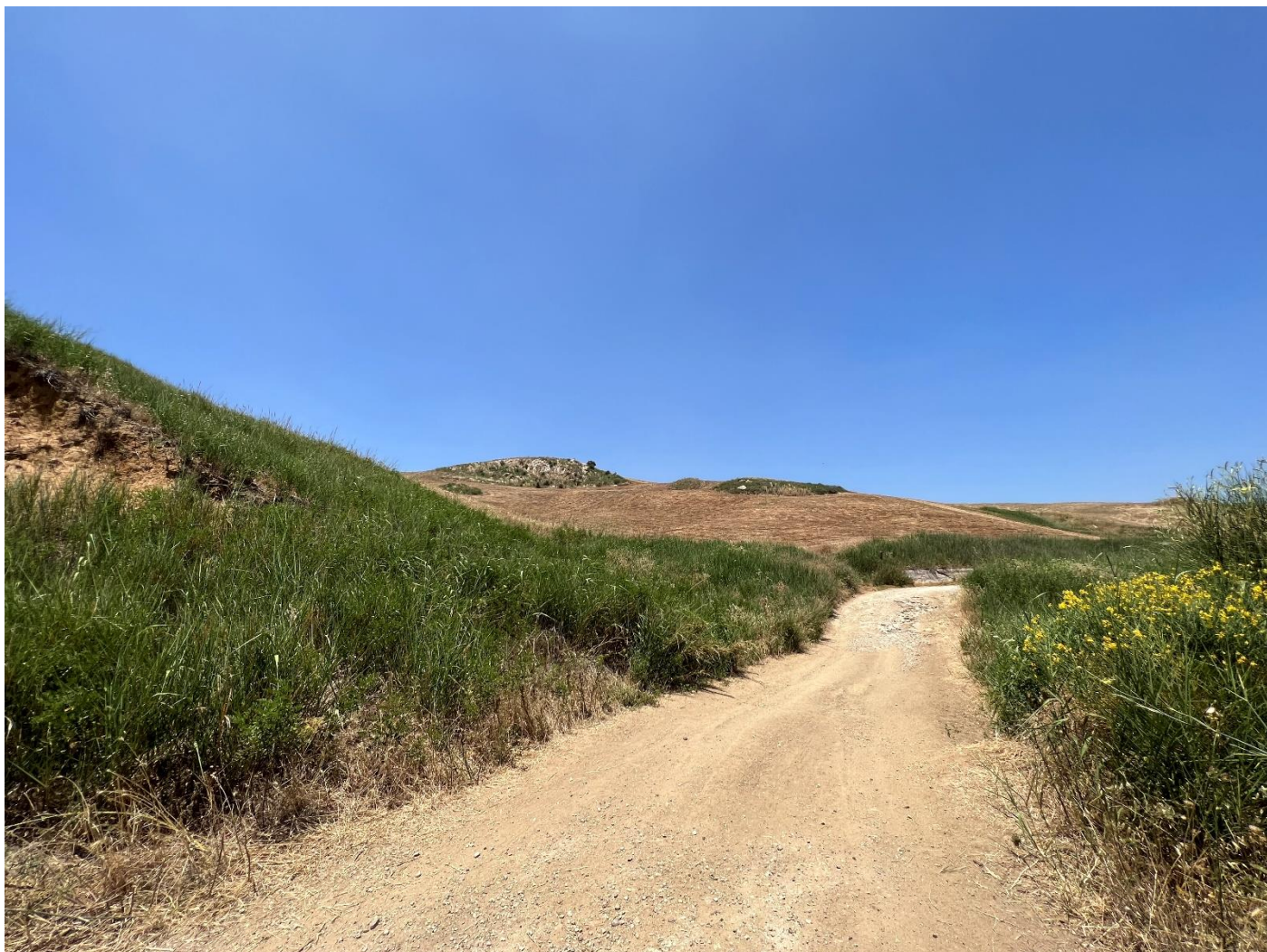
Figura 23_vista da SP64_comune Polizzi Generosa