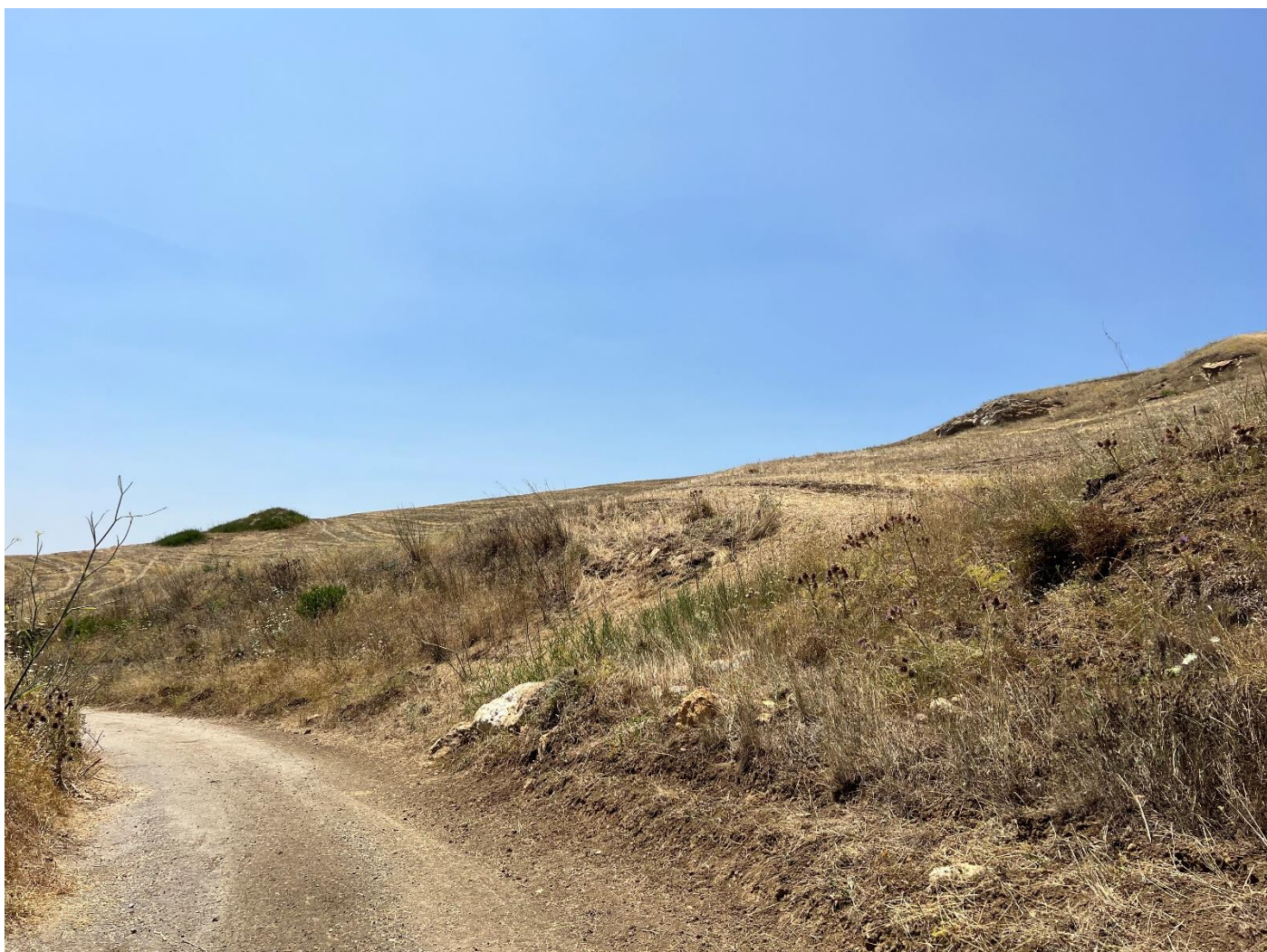
Figura 29_vista da strada interpodereale_comune Polizzi Generosa