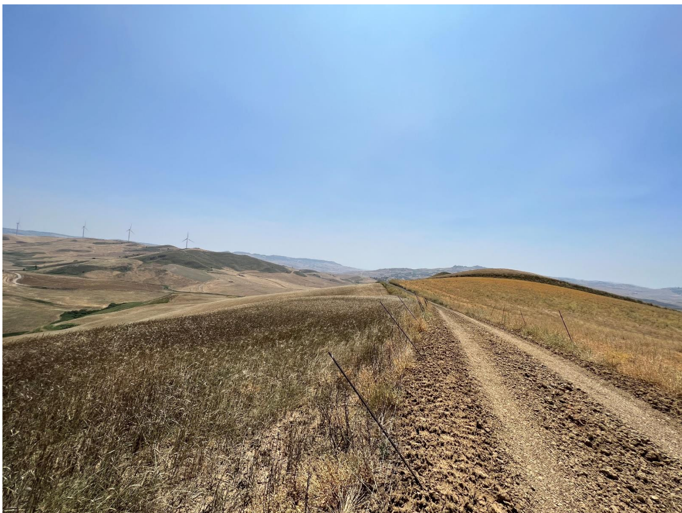
Figura 15_vista da strada interpodereale_comune Polizzi Generosa