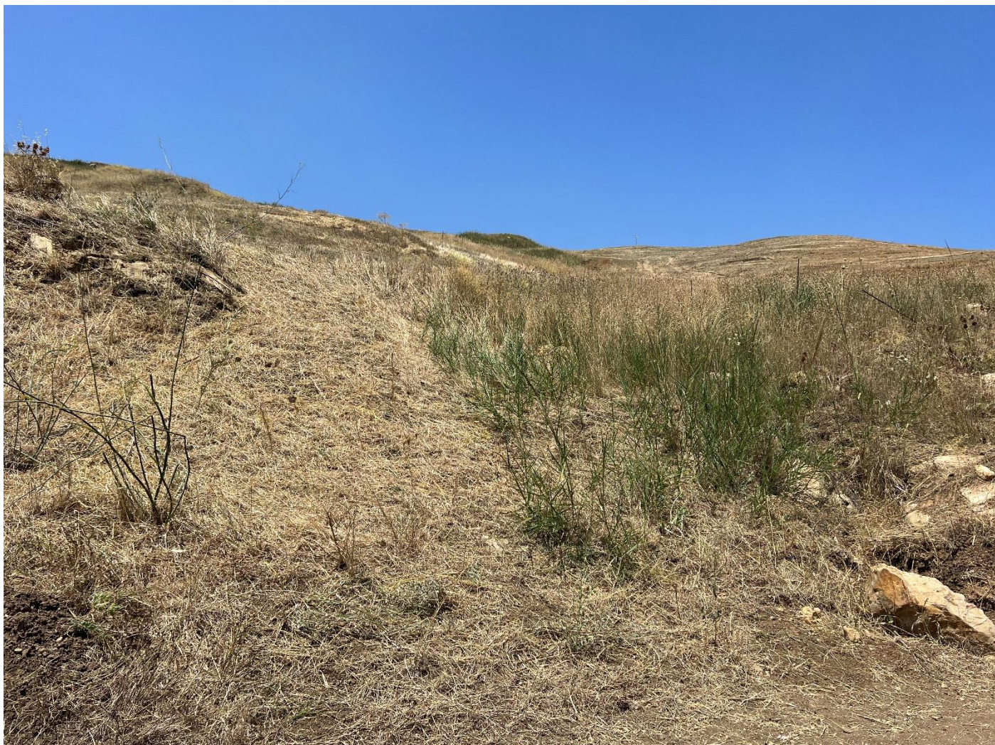
Figura 25_vista da strada interpodereale_comune Polizzi Generosa