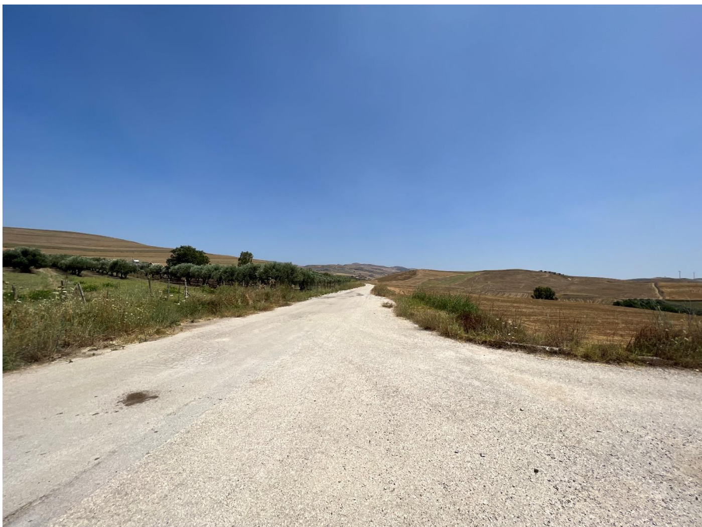
Figura 2_ vista da strada comunale_comune di Sclafani Bagni