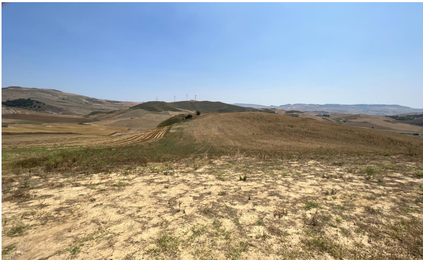
Figura 9_vista da SP64_comune di Polizzi Generosa