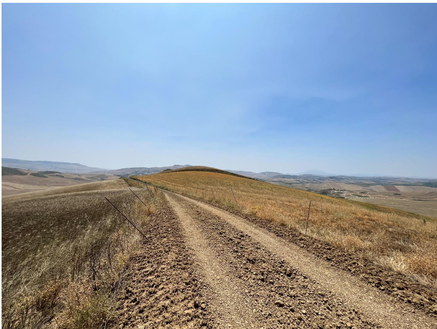
Figura 16_vista da strada interpodereale_comune Polizzi Generosa