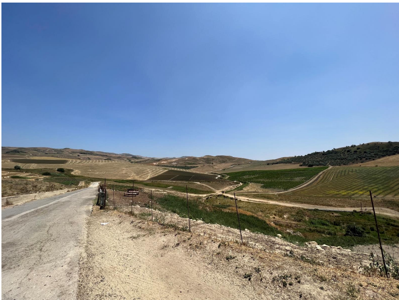
Figura 6_ vista da SP64_(Masseria Verbocundo)_comune di Polizzi Generosa