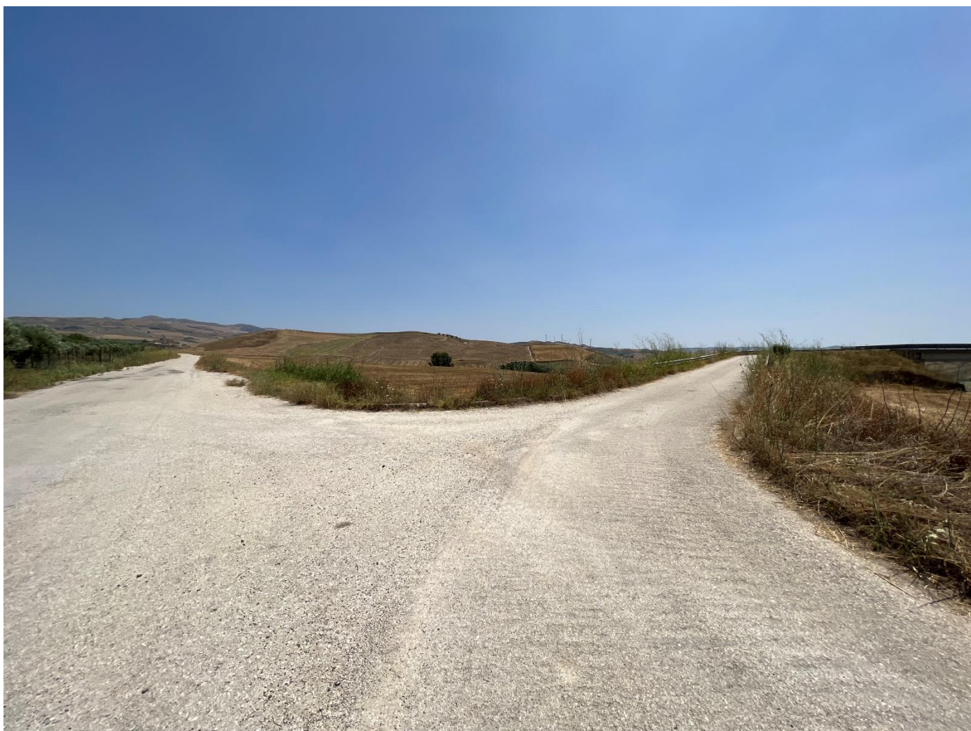
Figura 1_ vista da strada comunale_comune di Sclafani Bagni