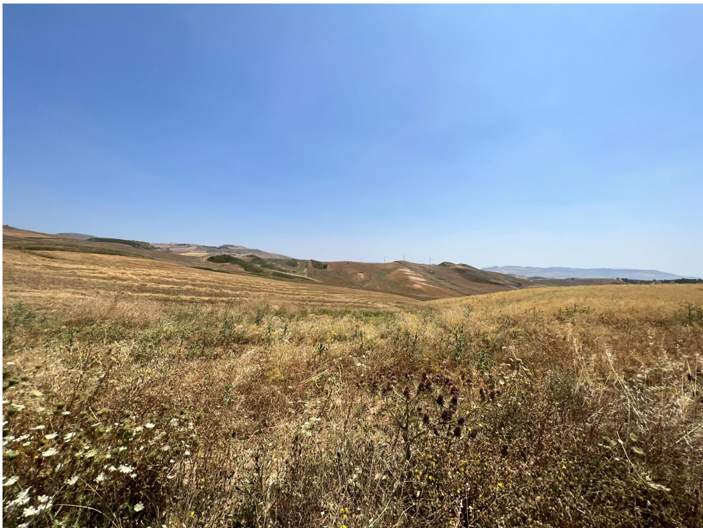
Figura 21_vista da strada interpodereale_comune Polizzi Generosa