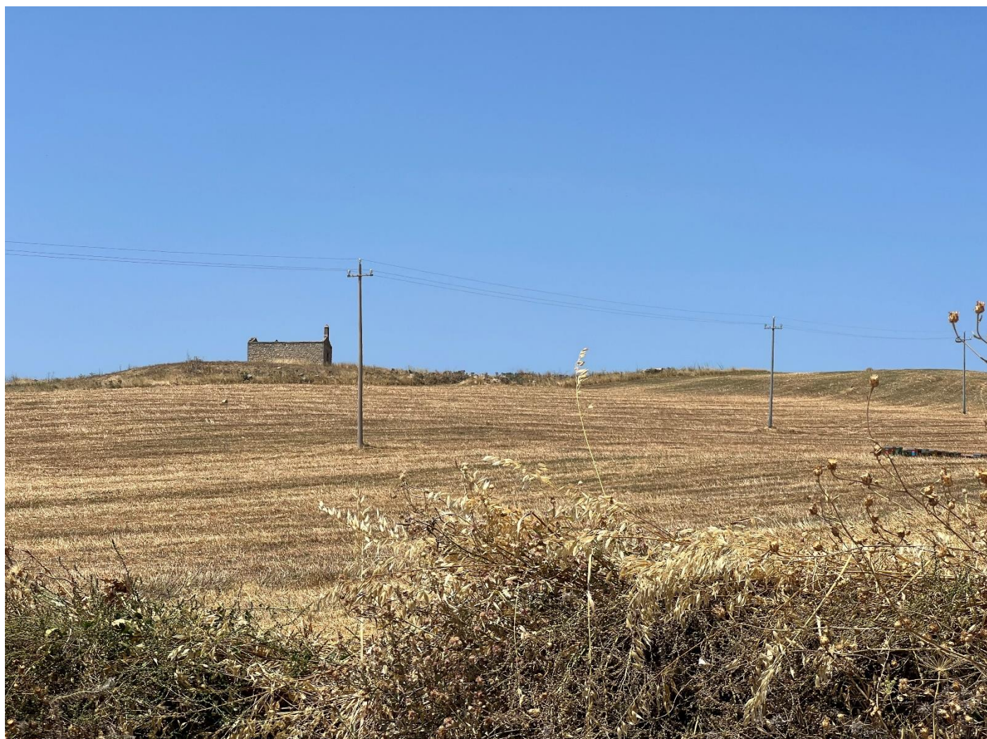
Figura 31_vista da strada interpodereale_comune Polizzi Generosa