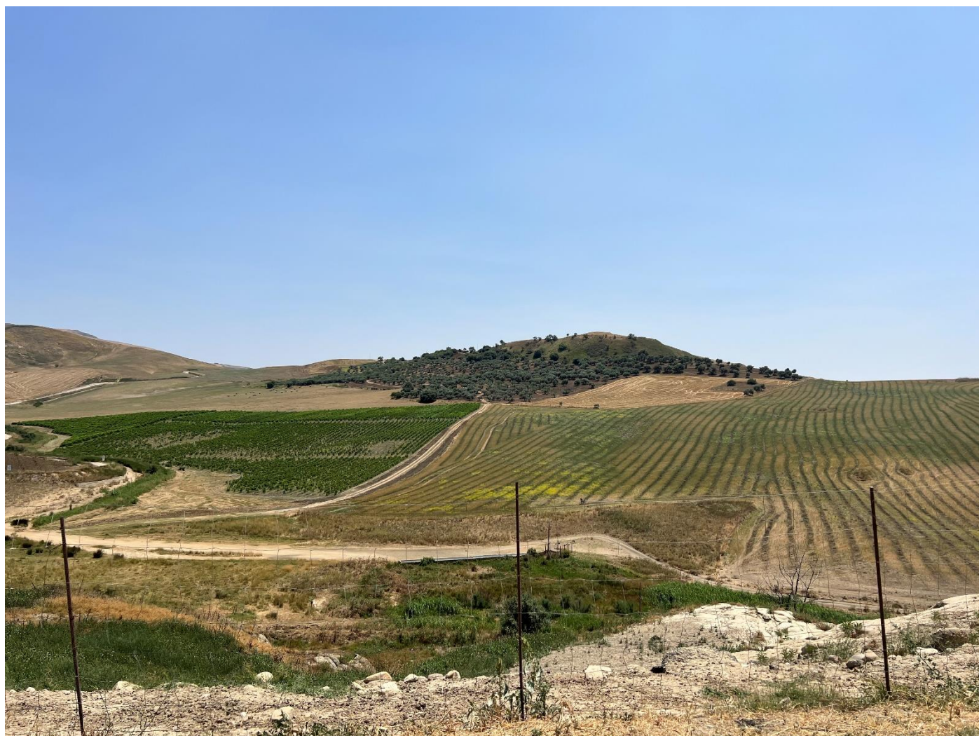
Figura 5_ vista da SP64_(Masseria Verbocundo)_comune di Polizzi Generosa