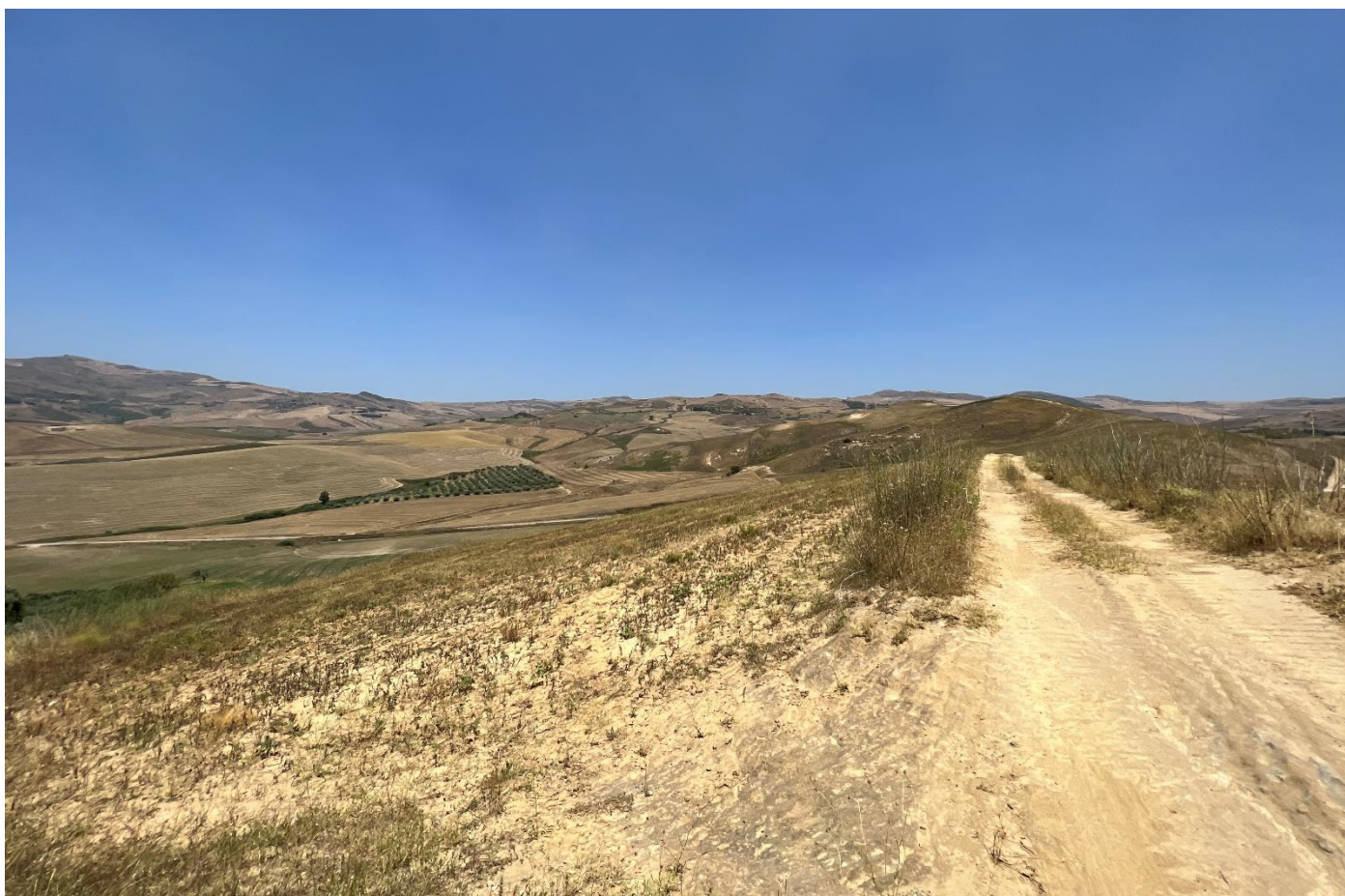
Figura 10_ vista in prossimita' della SP64_ comune di Polizzi Generosa