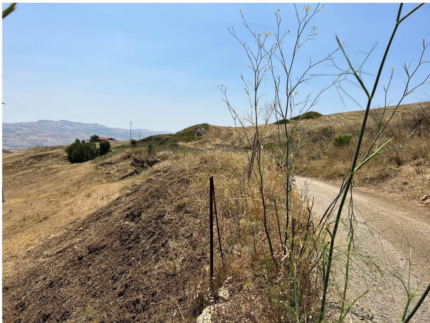
Figura 27_vista da strada interpodereale_comune Polizzi Generosa