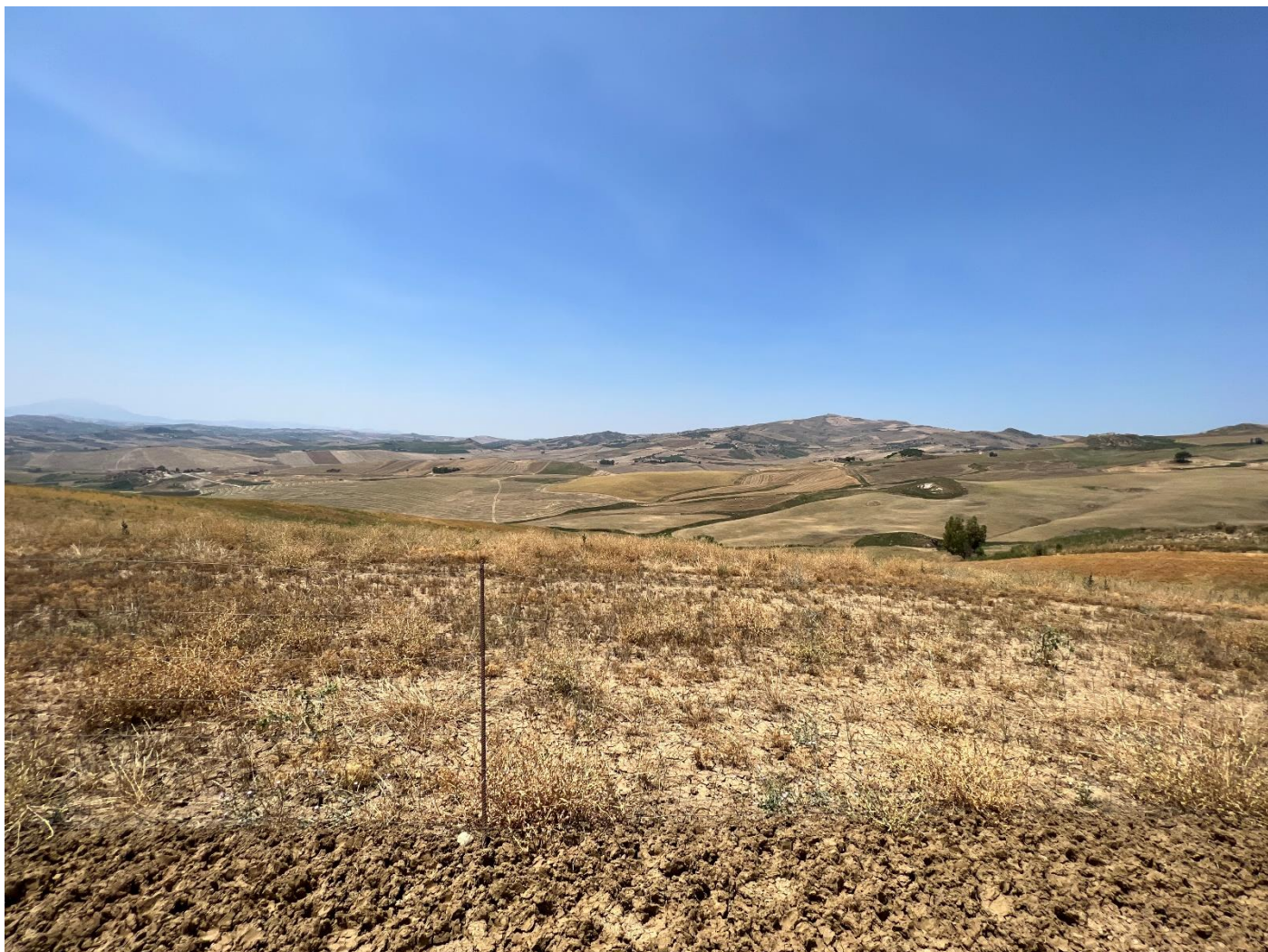
Figura 13_vista da strada interpodereale_comune Polizzi Generosa