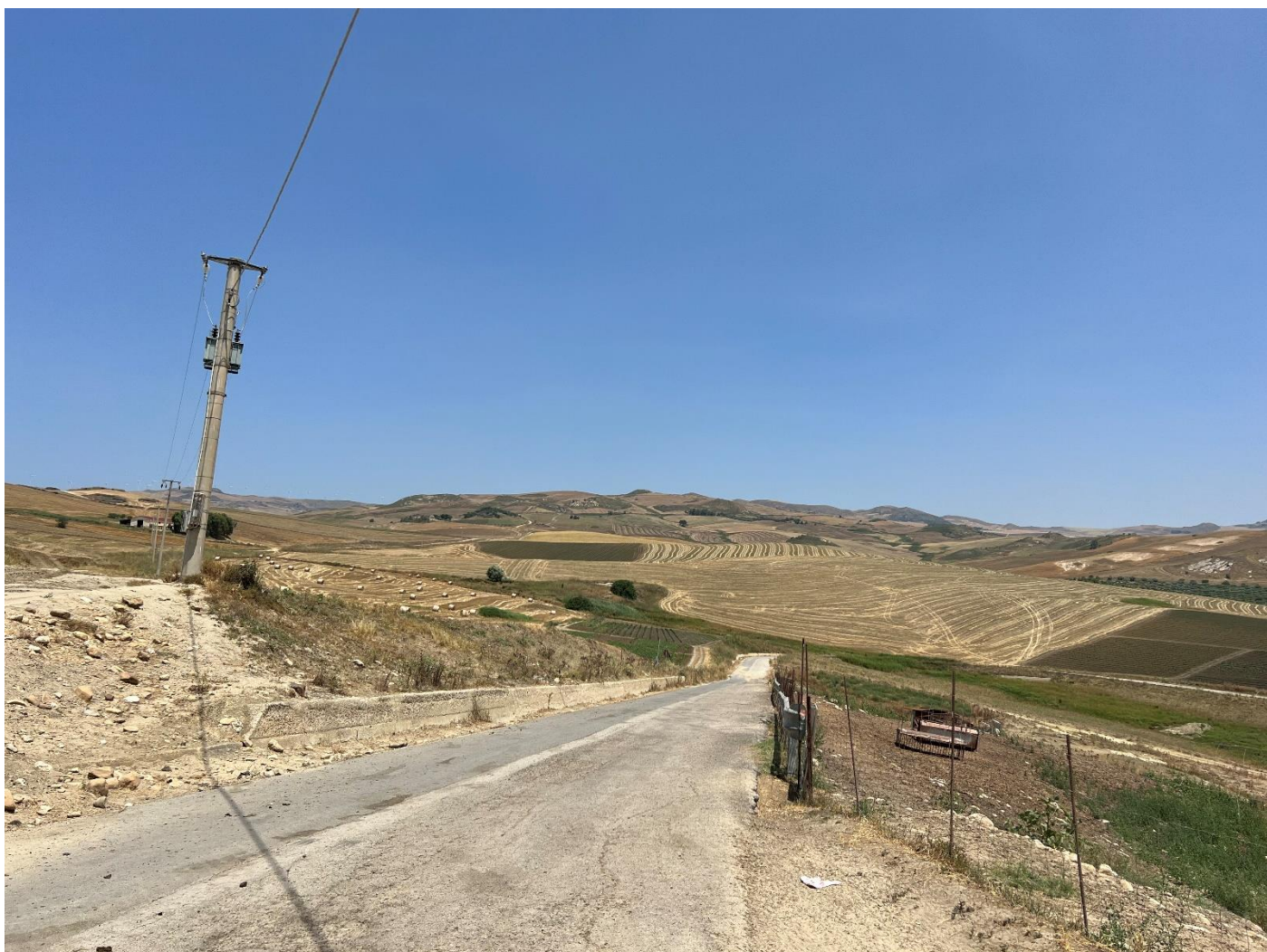
Figura 7_ vista da SP64_(Masseria Verbocundo)_comune di Polizzi Generosa