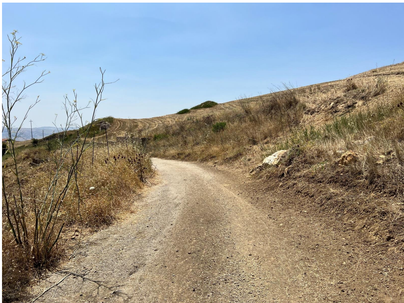
Figura 28_vista da strada interpodereale_comune Polizzi Generosa