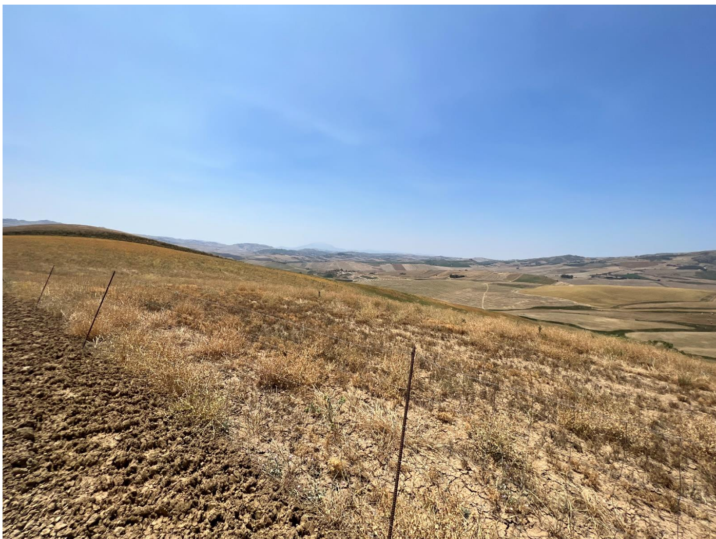
Figura 14_vista da strada interpodereale_comune Polizzi Generosa