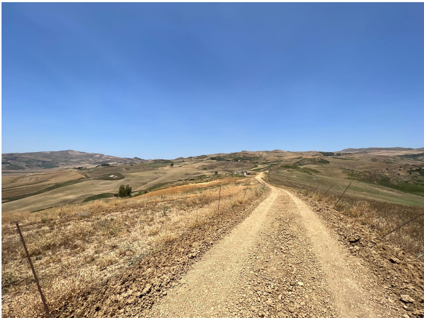
Figura 12_vista da strada interpodereale_comune Polizzi Generosa