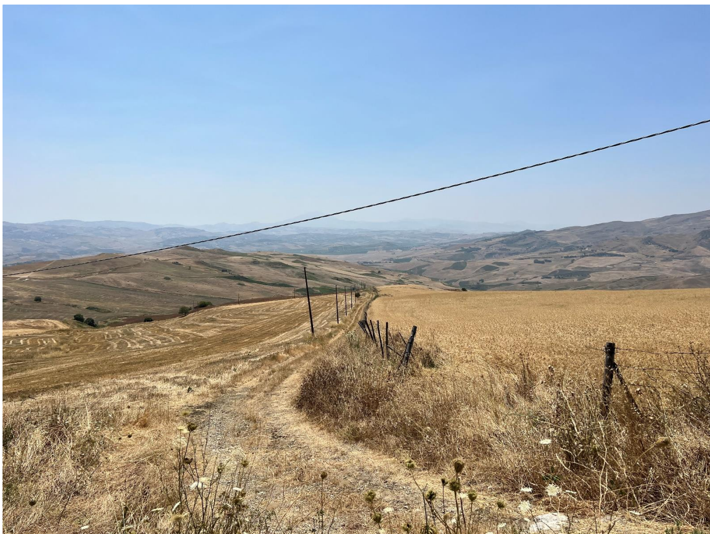
Figura 32_vista da SP64_comune Polizzi Generosa