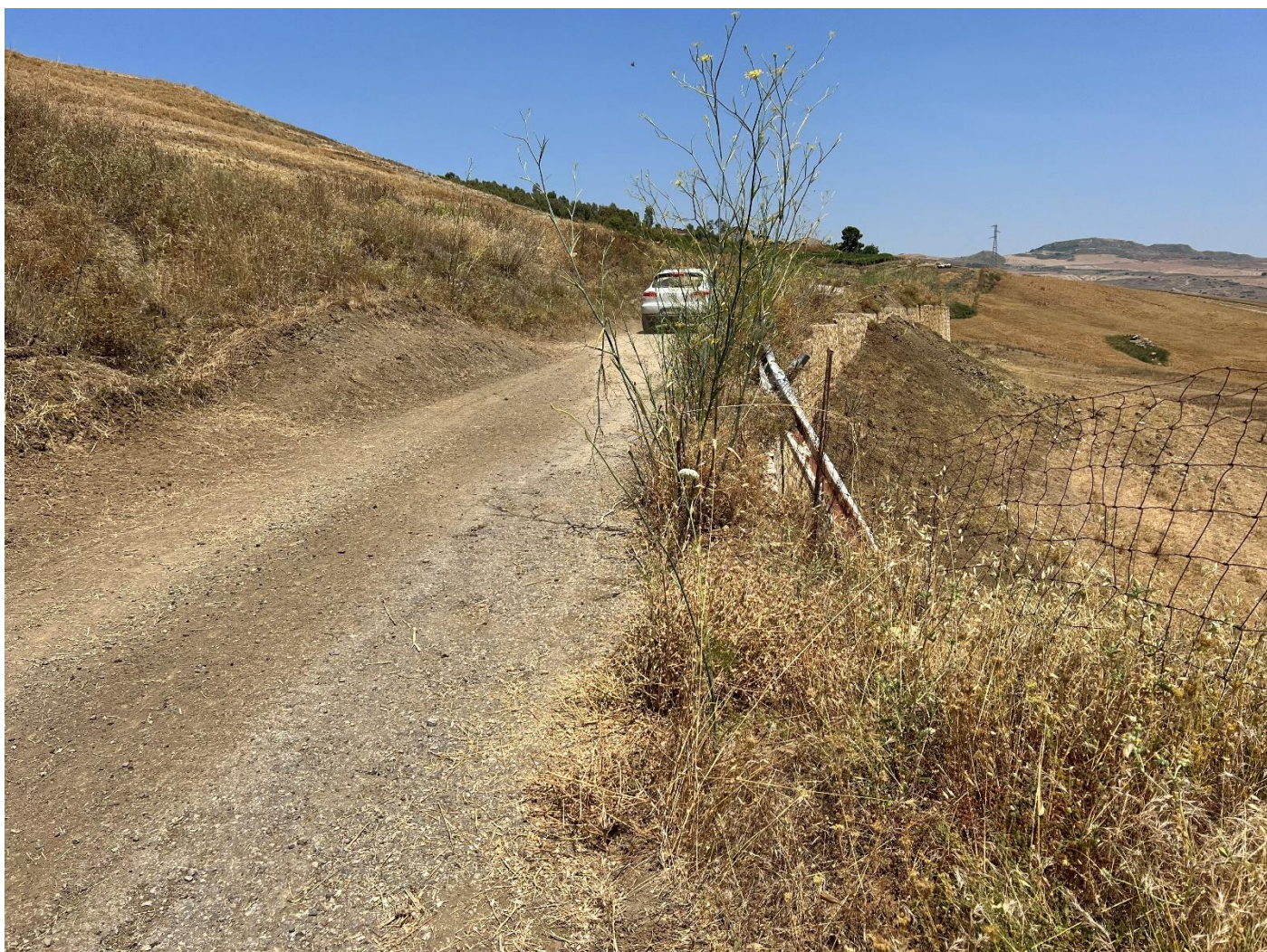
Figura 26_vista da strada interpodereale_comune Polizzi Generosa