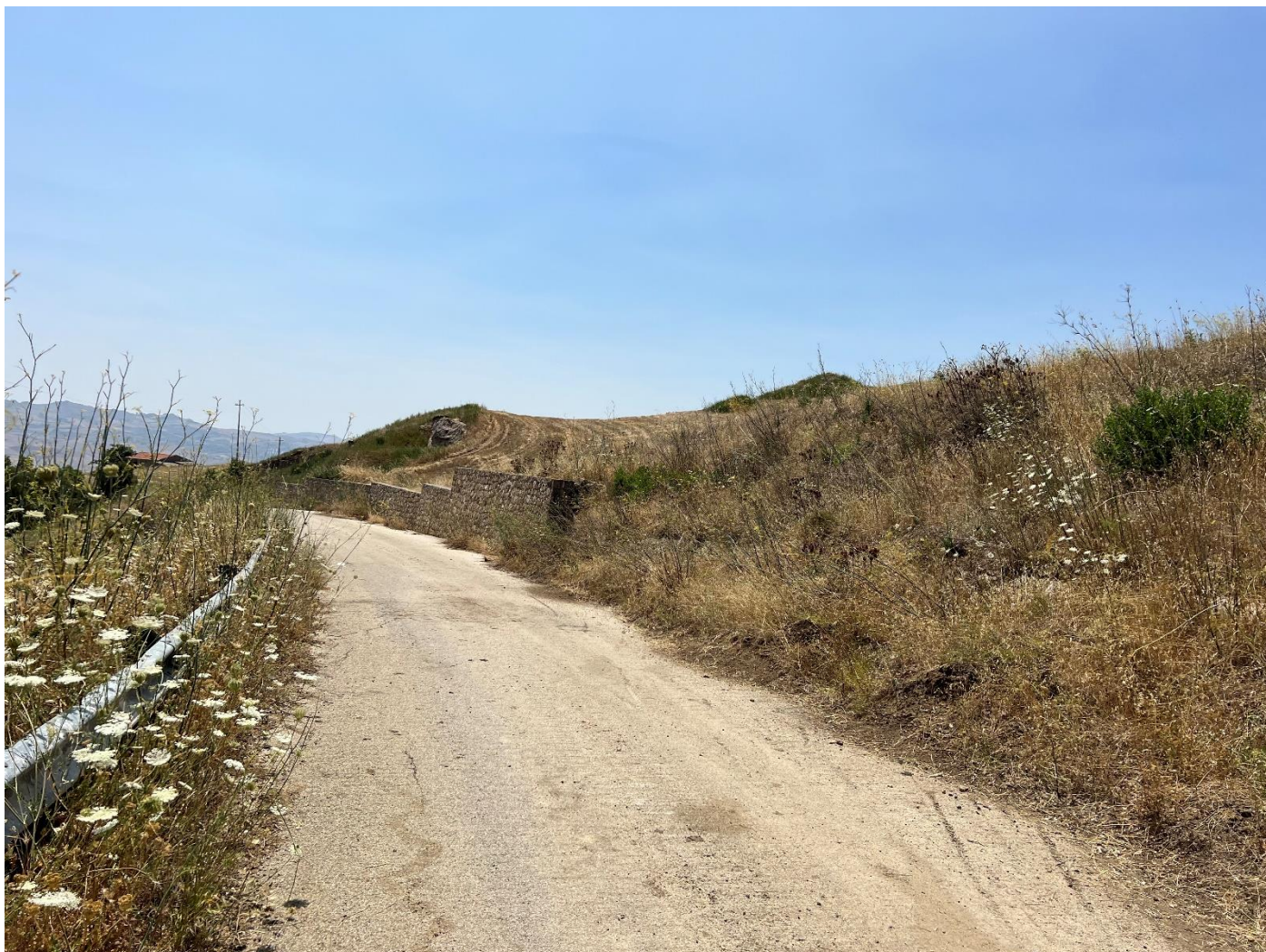
Figura 24_vista da strada interpodereale_comune Polizzi Generosa