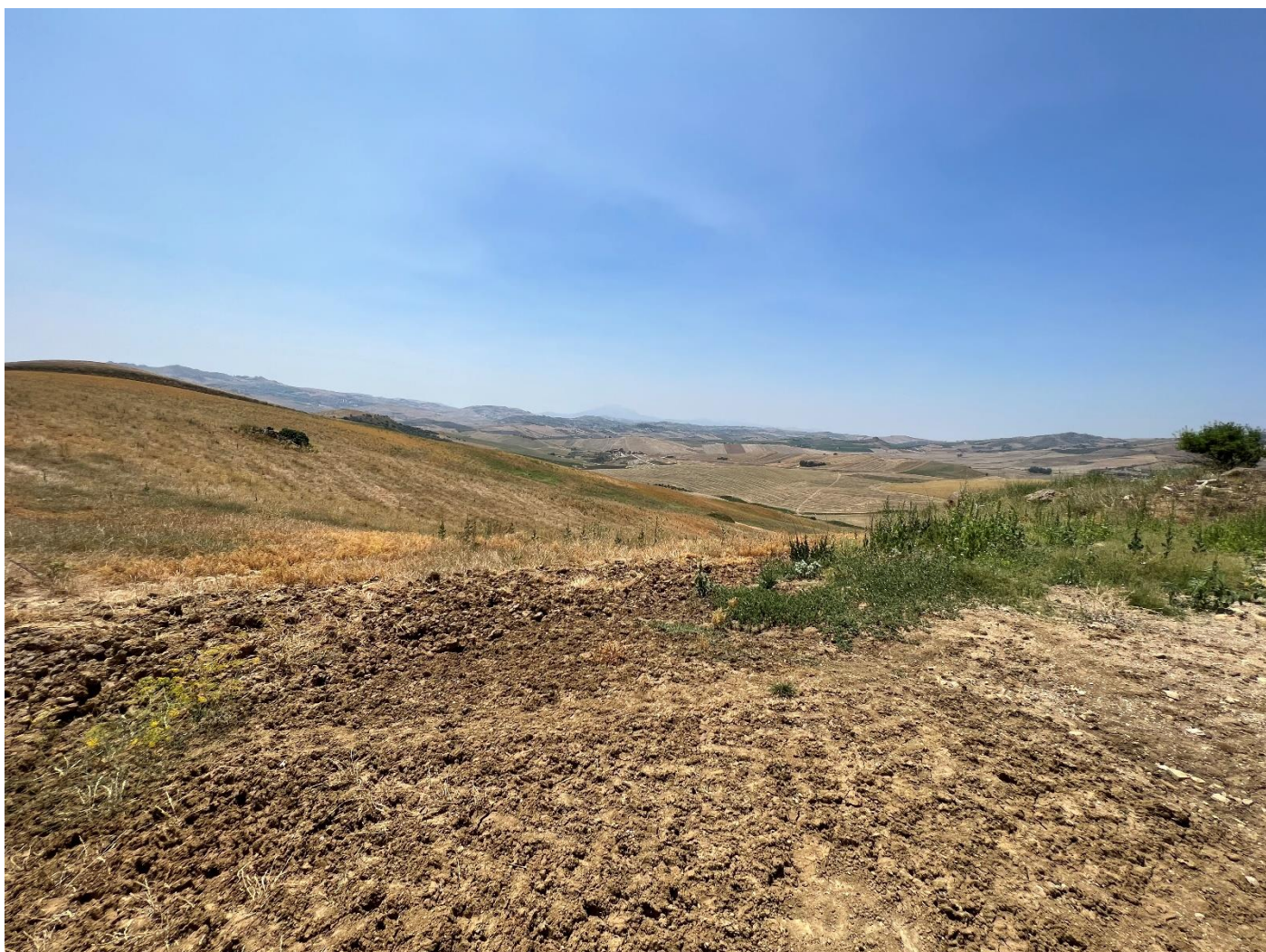
Figura 17_vista da strada interpodereale_comune Polizzi Generosa