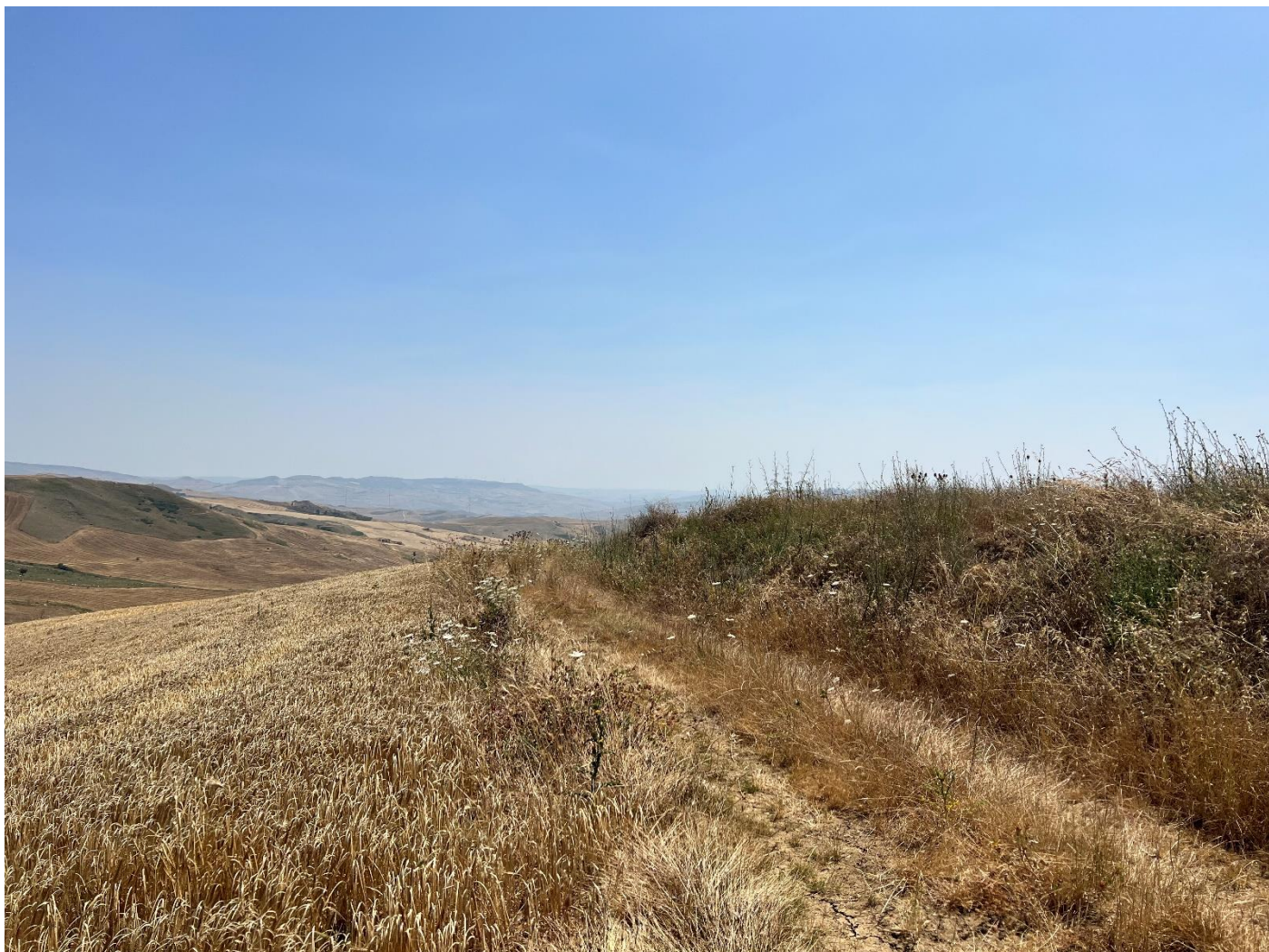
Figura 34_vista da SP64_comune Polizzi Generosa