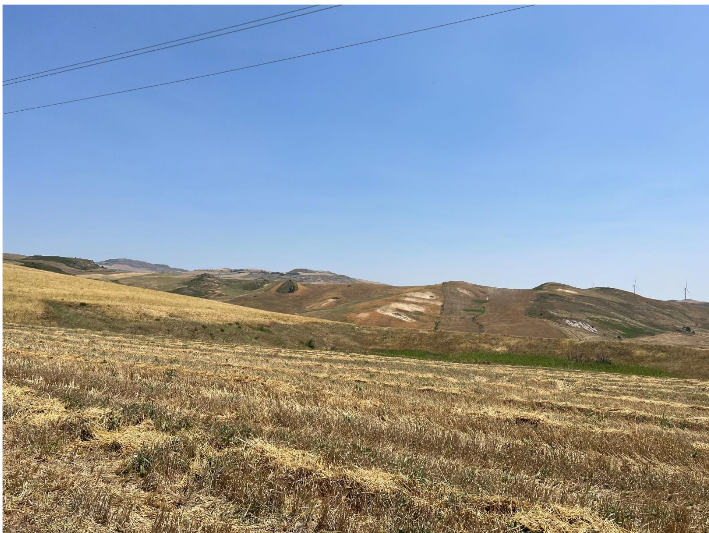
Figura 19_vista da strada interpodereale_comune Polizzi Generosa