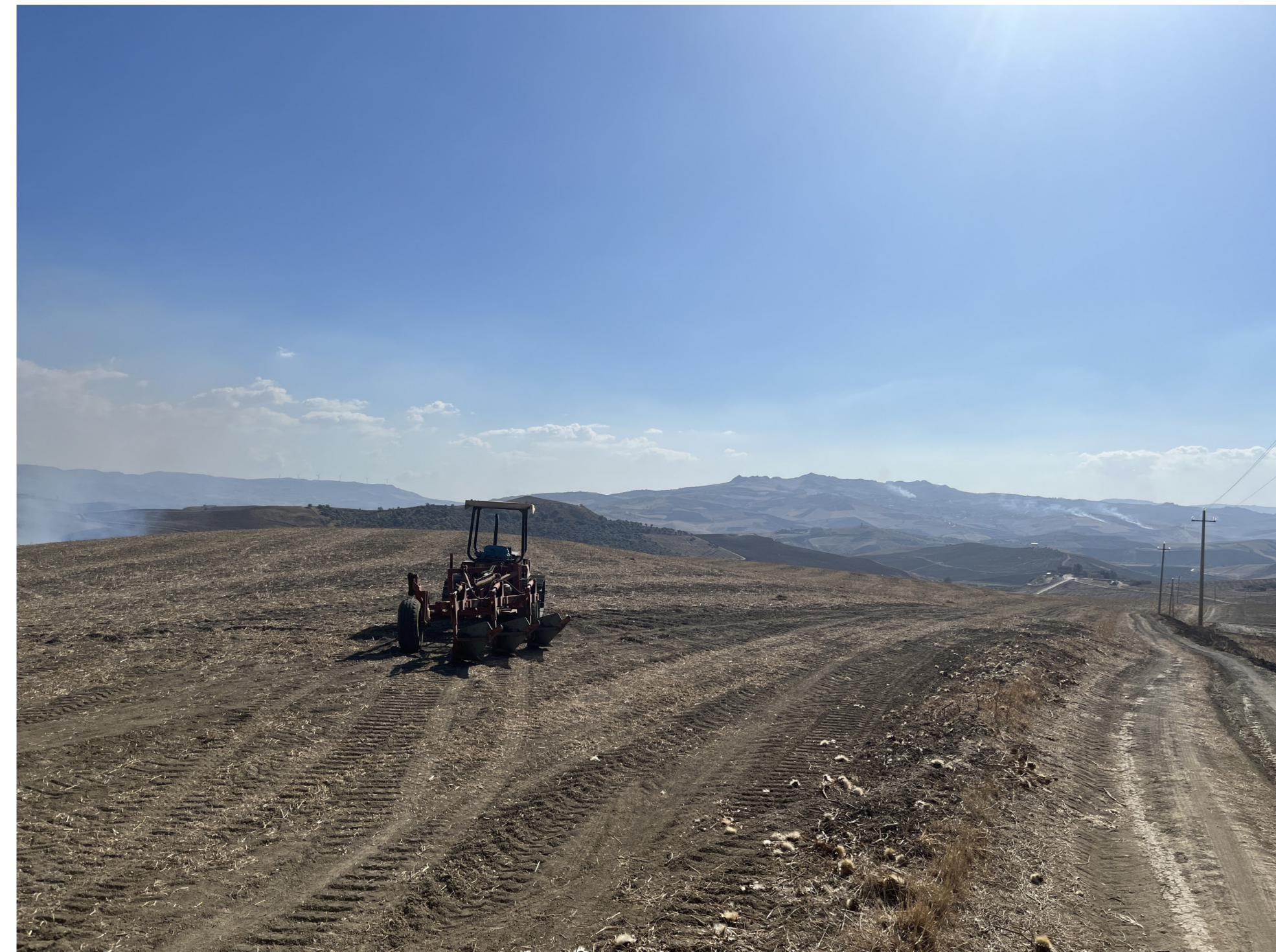
IMG_2390 - Ante operam