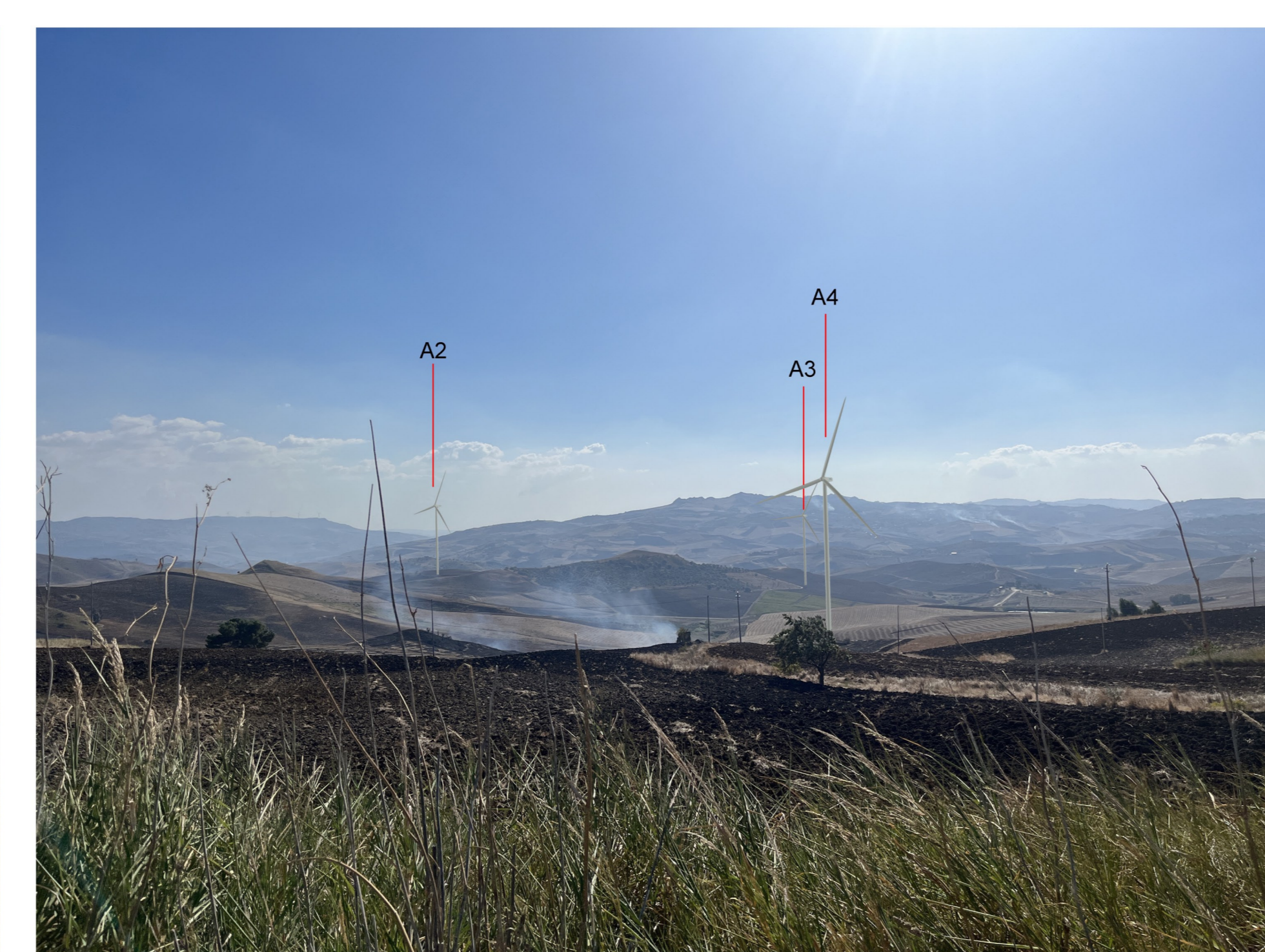
IMG_2392 - Post operam