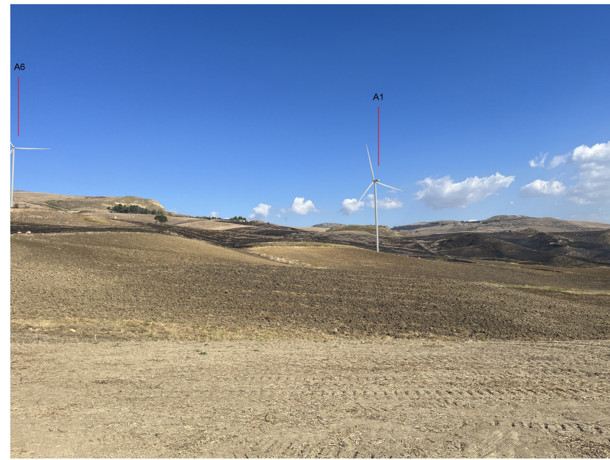
IMG_2385 - Post operam