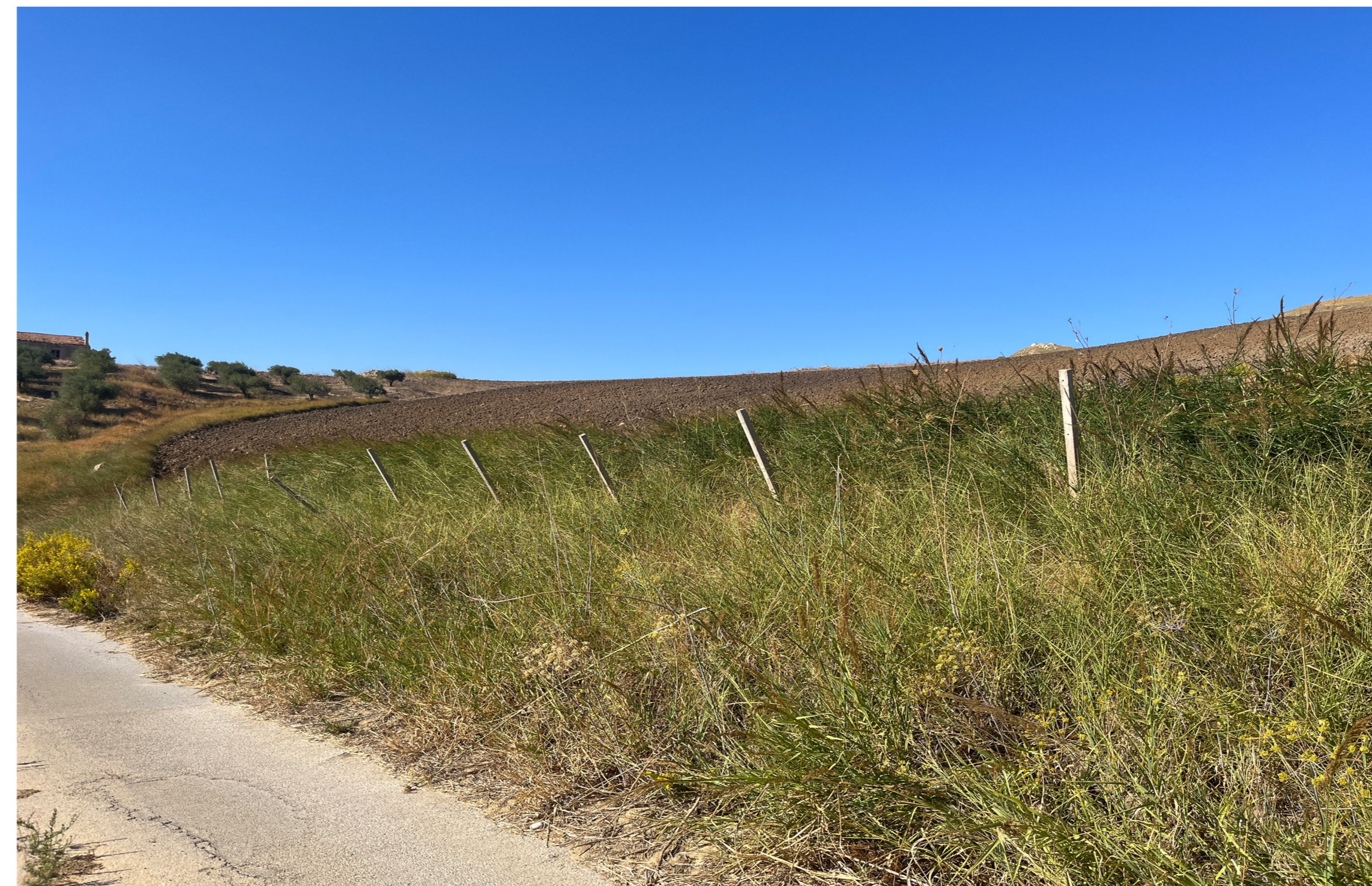
IMG_2395 - Ante operam