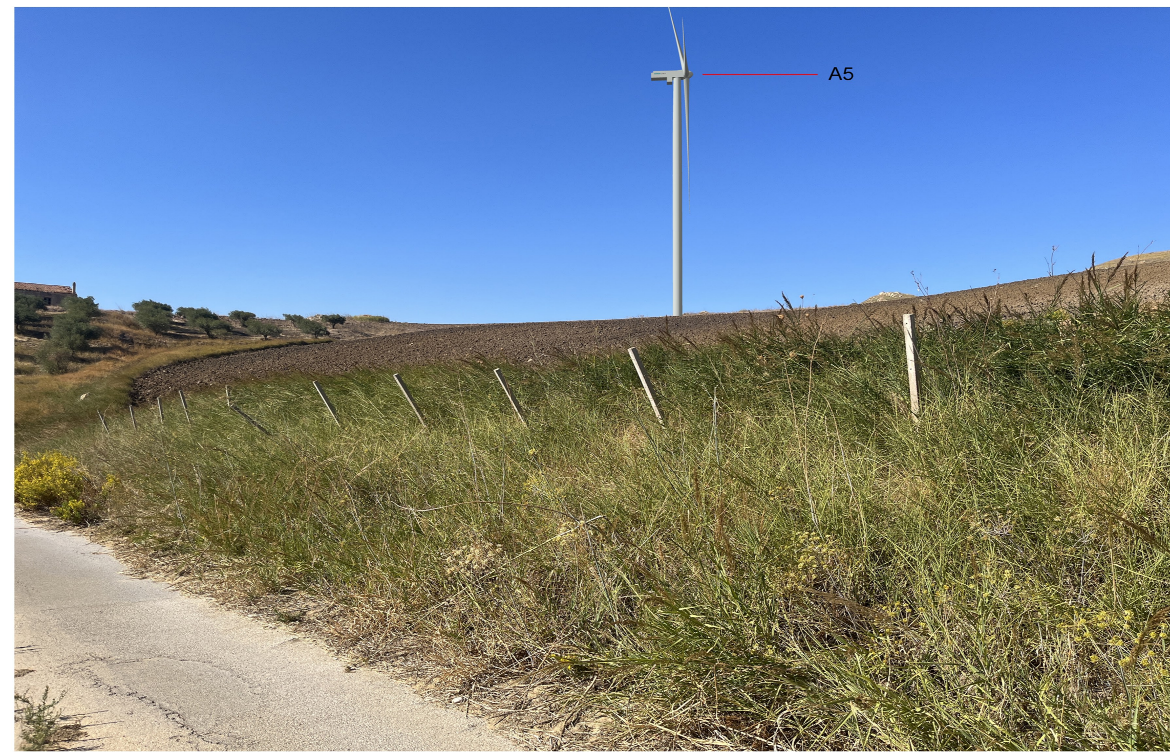
IMG_2395 - Post operam