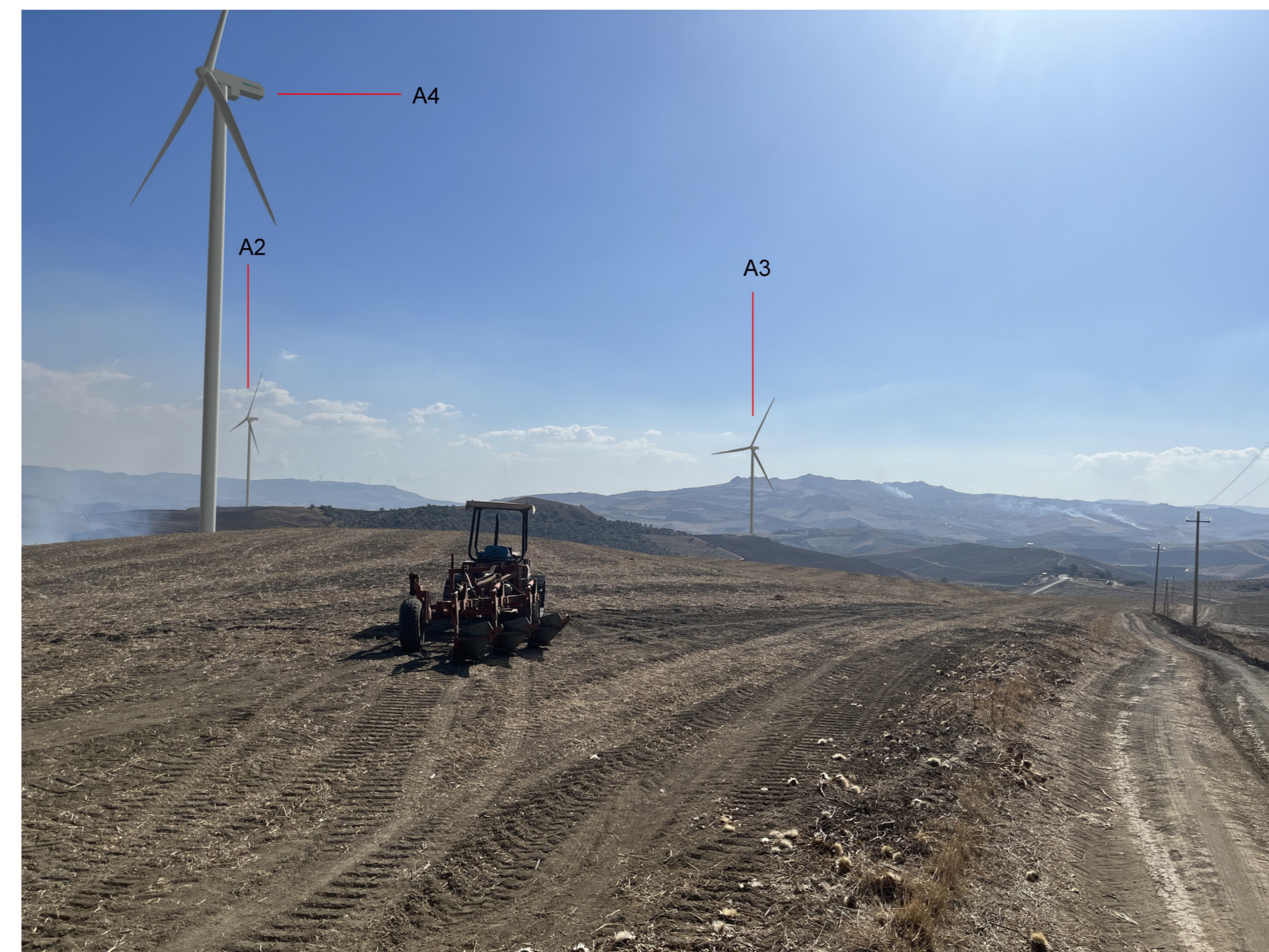
IMG_2390 - Post operam