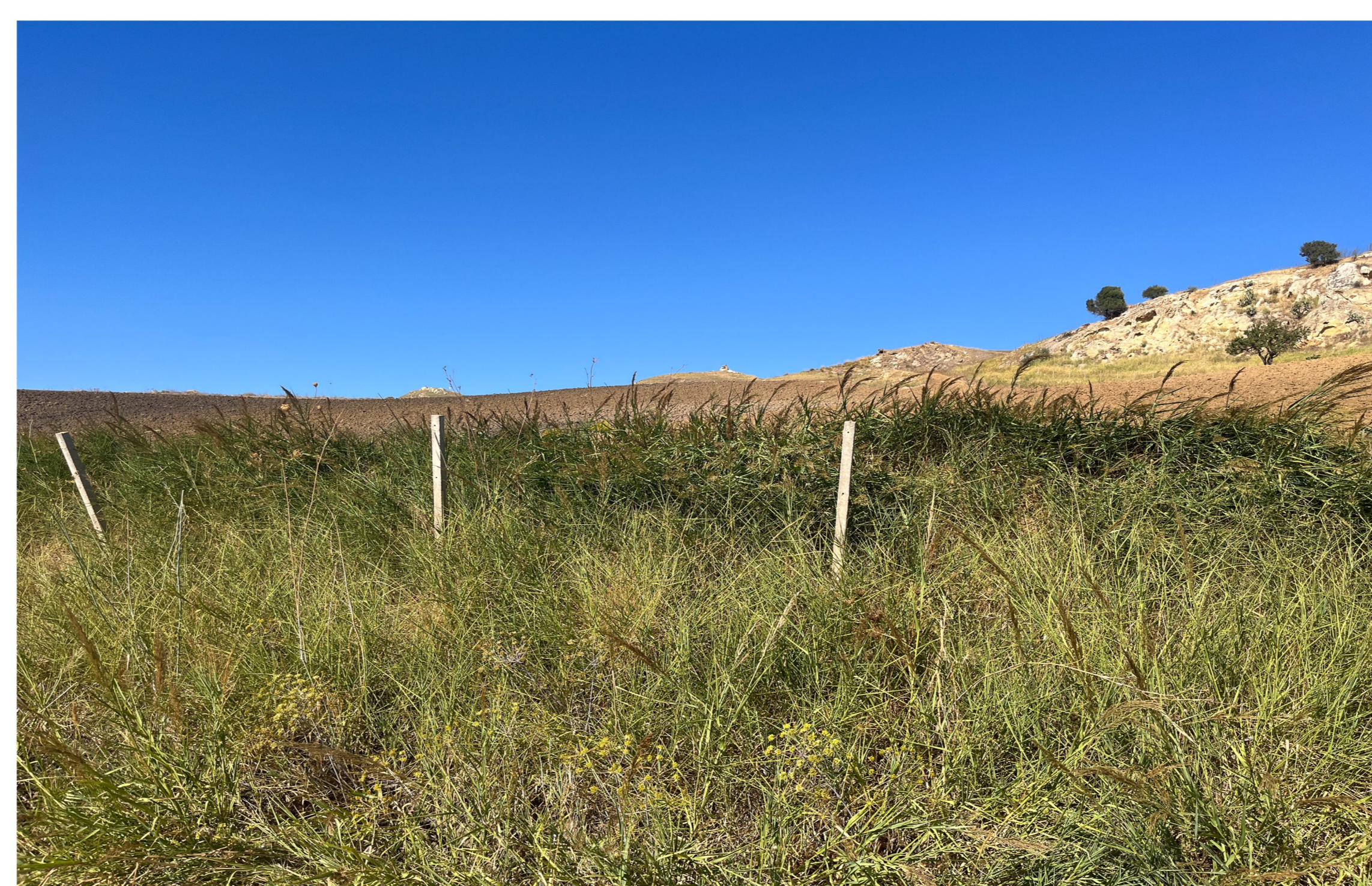
IMG_2396 - Ante operam