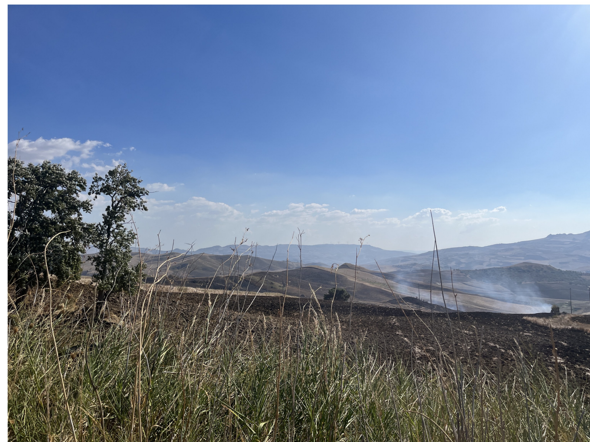
IMG_2391 - Ante operam