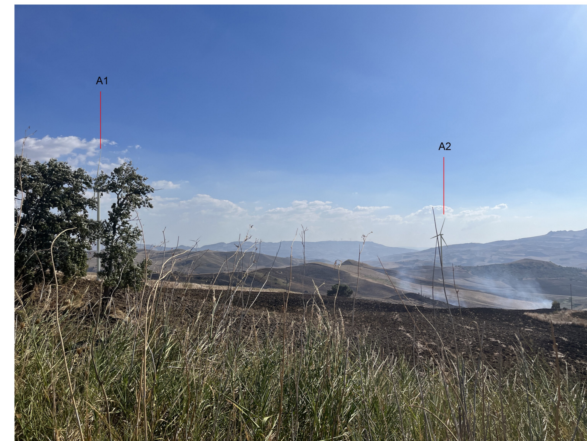
IMG_2391 - Post operam