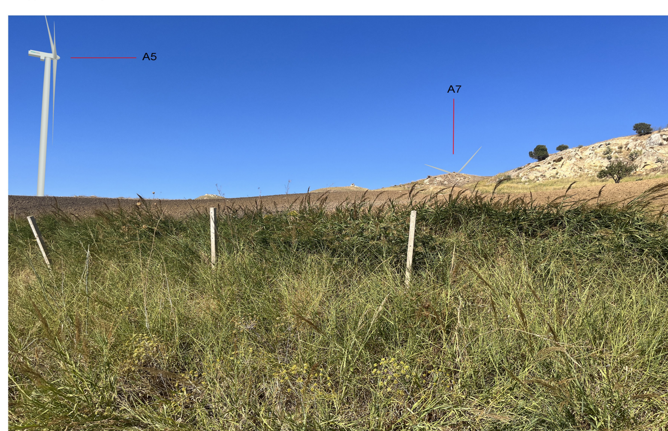
IMG_2396 - Post operam