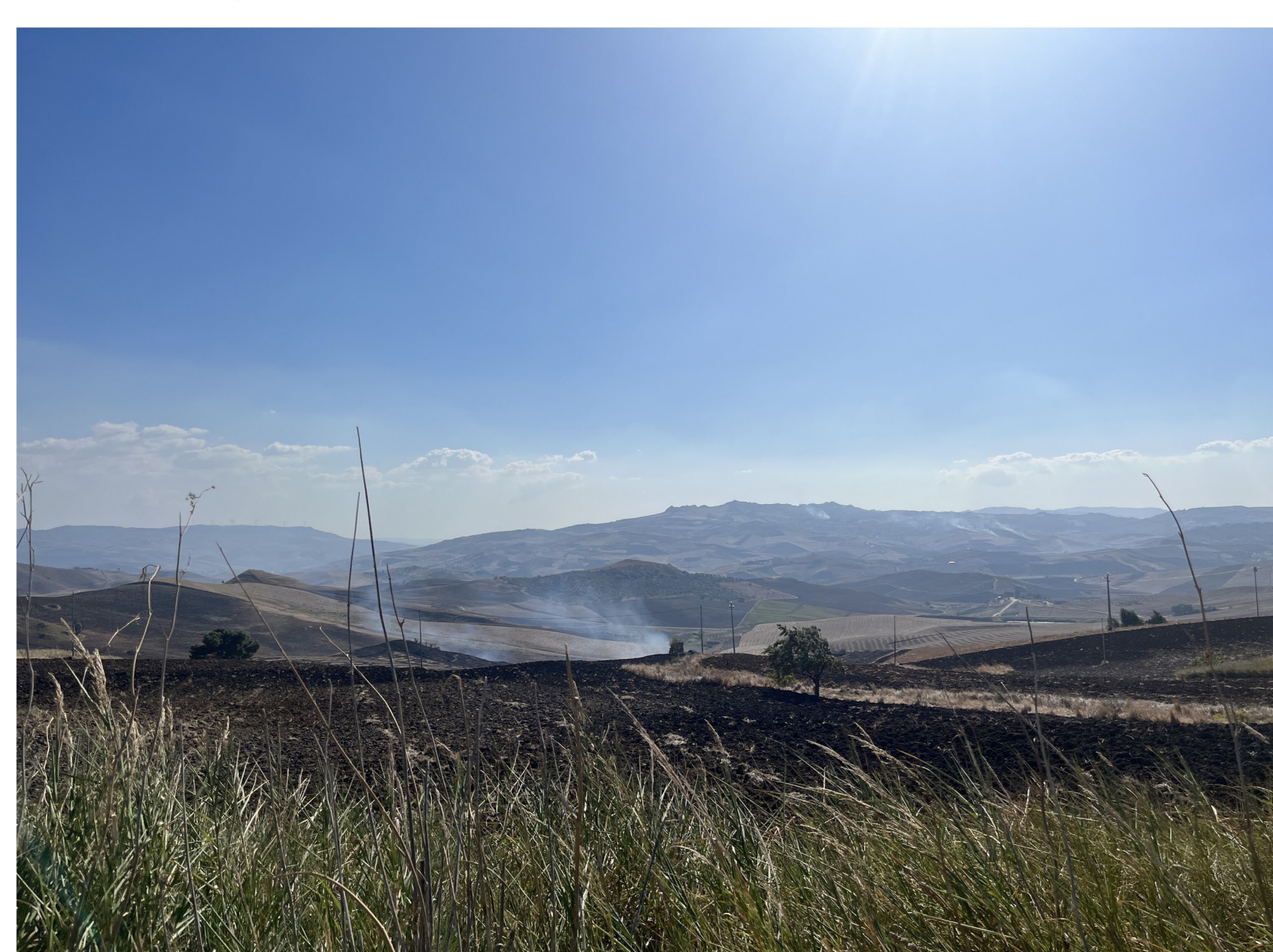
IMG_2392 - Ante operam