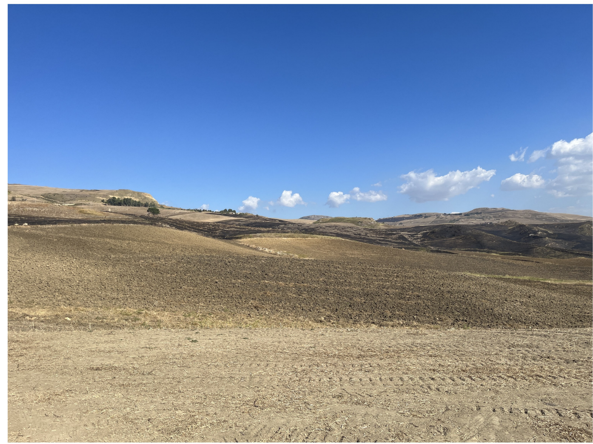
IMG_2385 - Ante operam