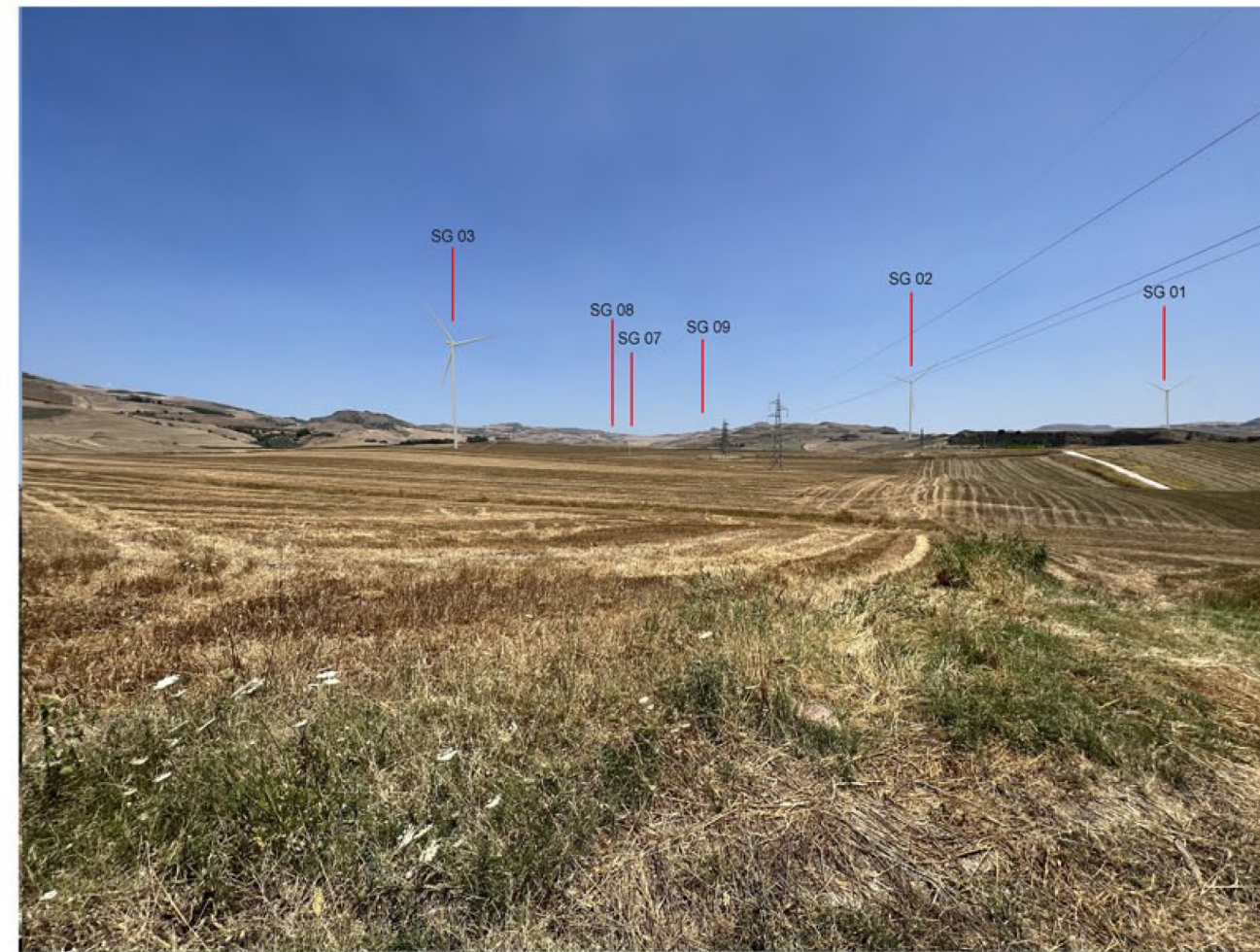
img_9664 - Post operam