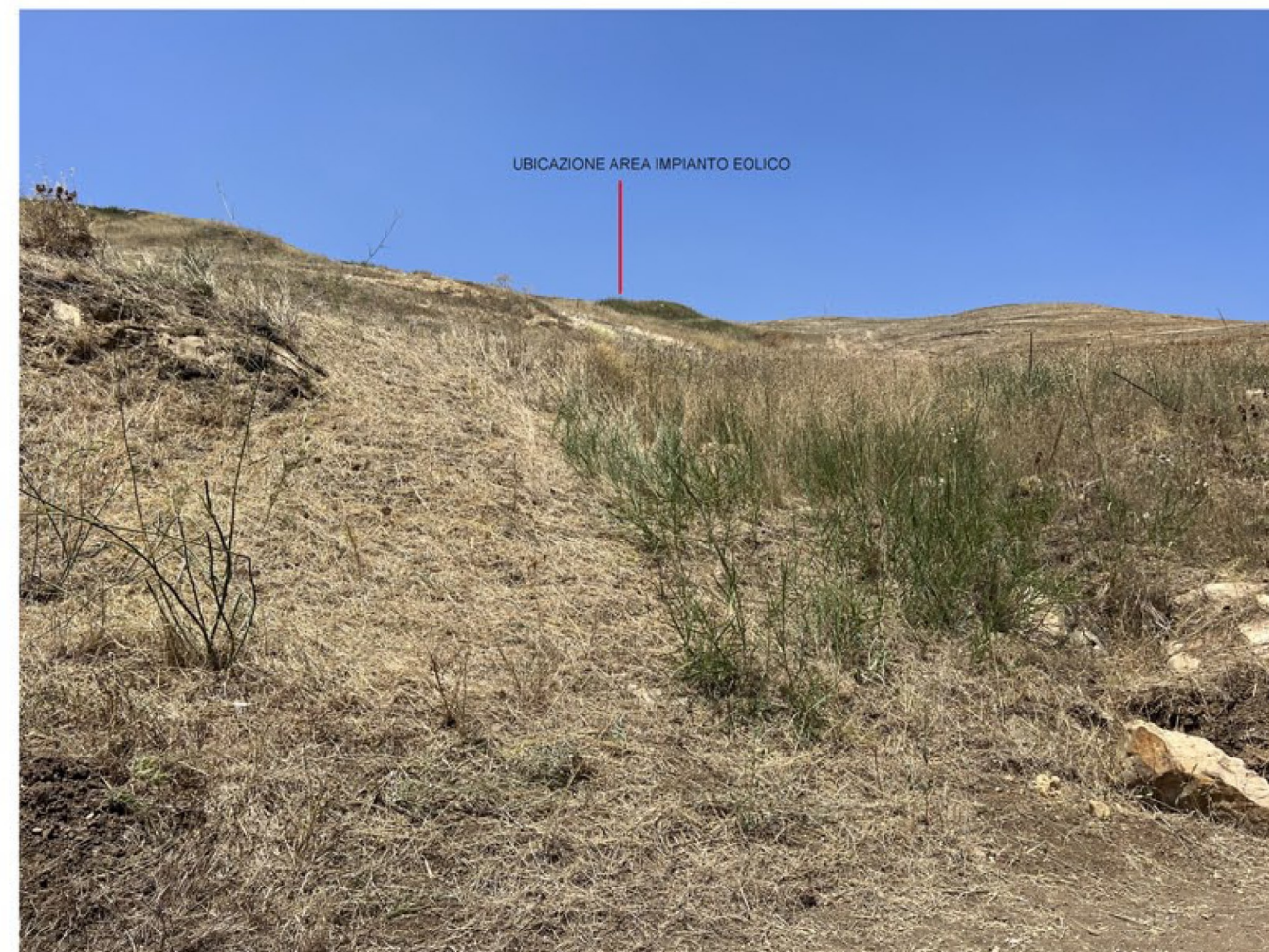
img_9715 - Post operam