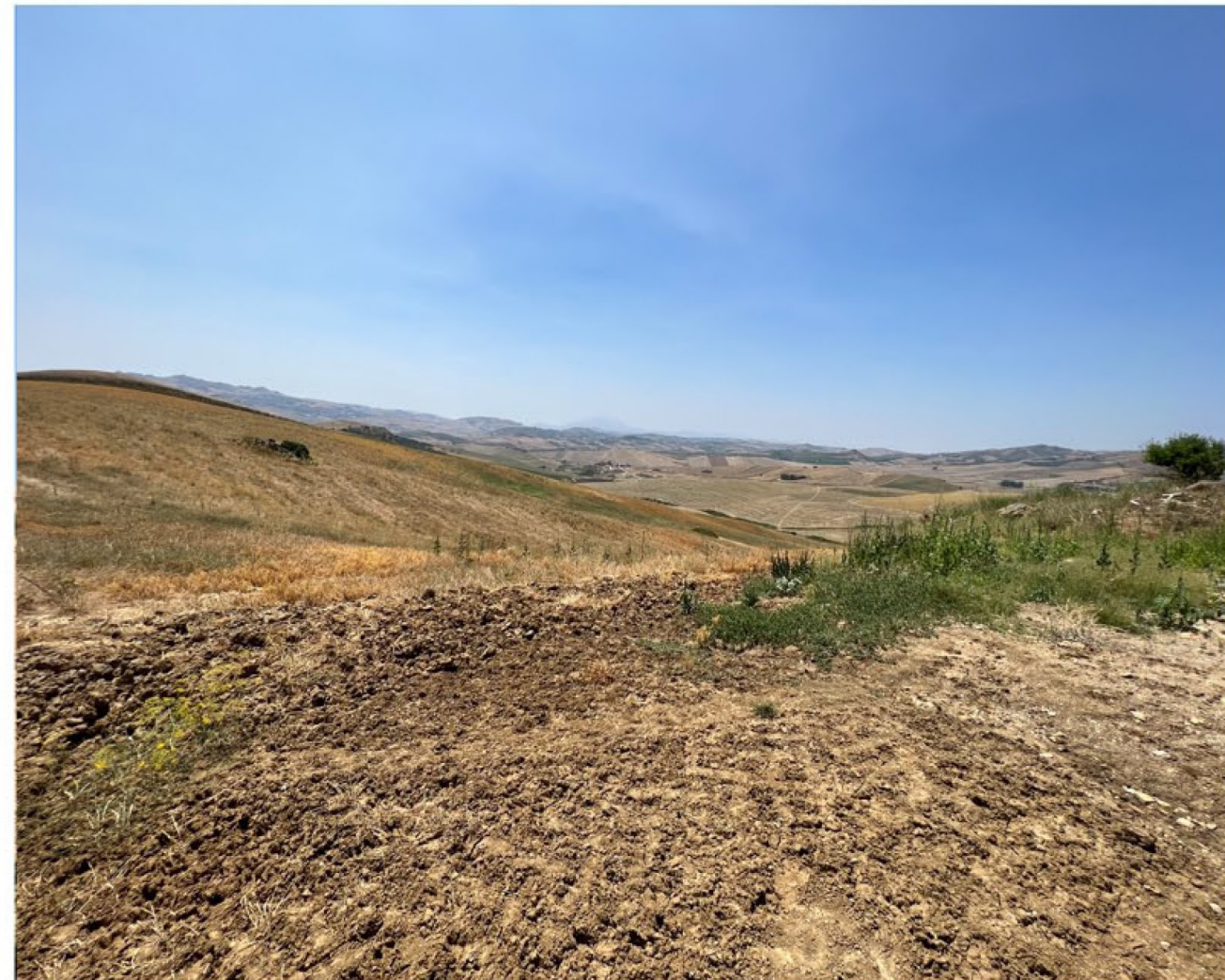
img_9694 - Ante operam