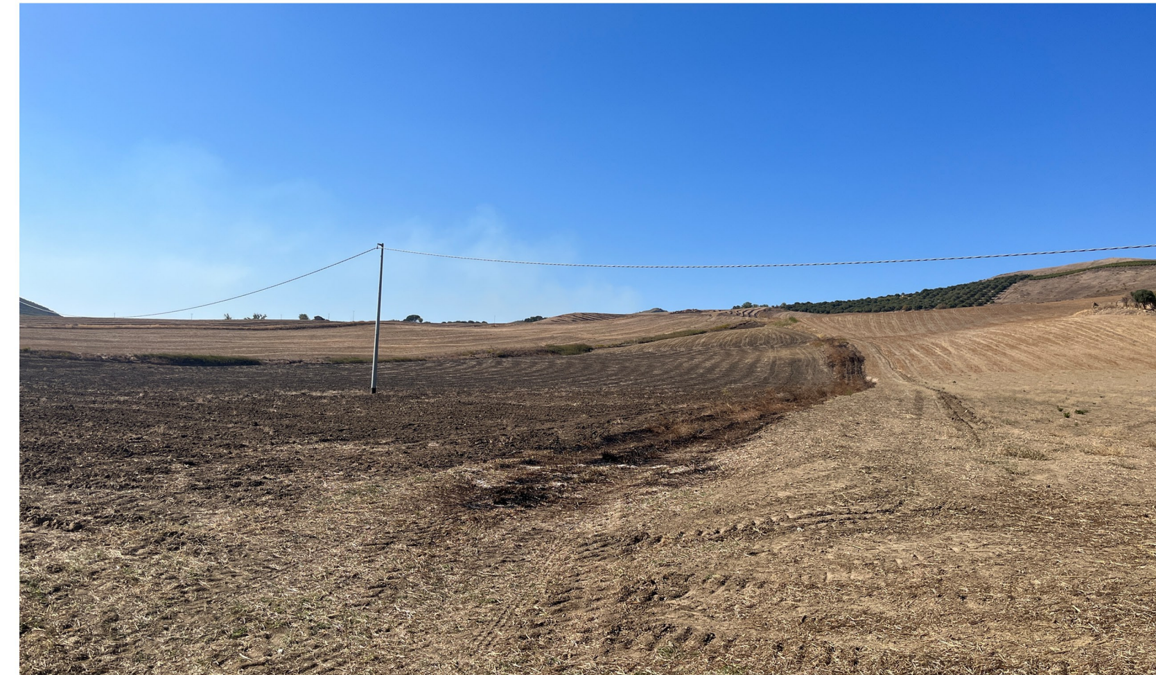
img_2366- Ante operam