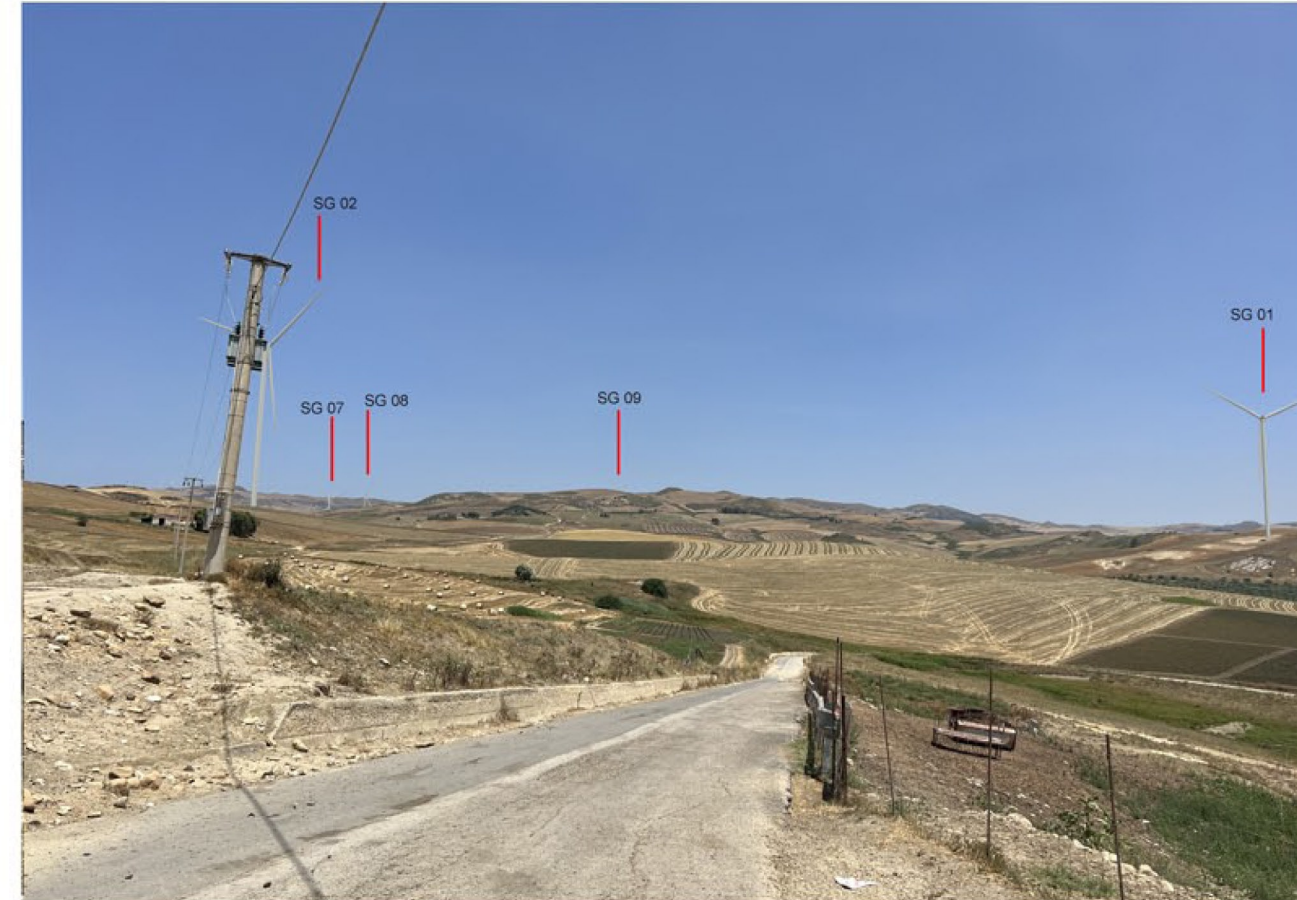
img_9670 - Post operam