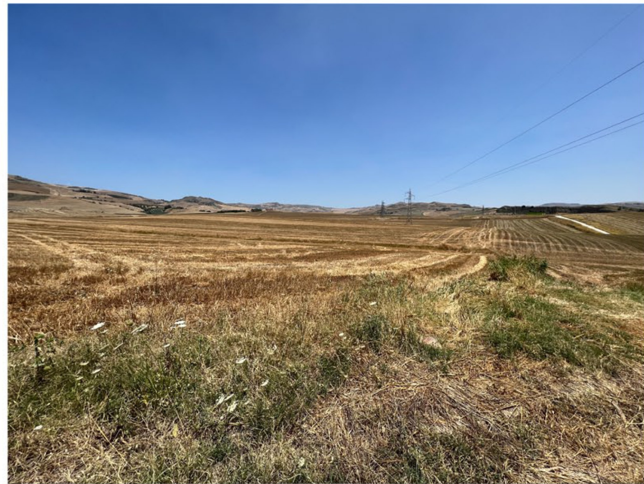
img_9664 - Ante operam