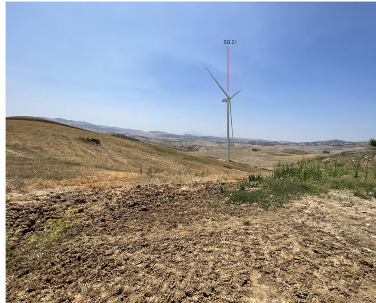
img_9694 - Post operam