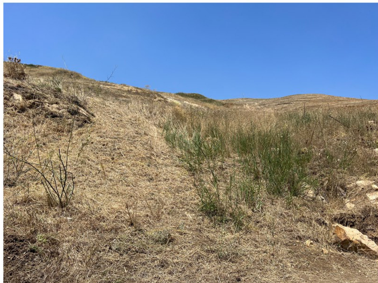
img_9715 - Ante operam