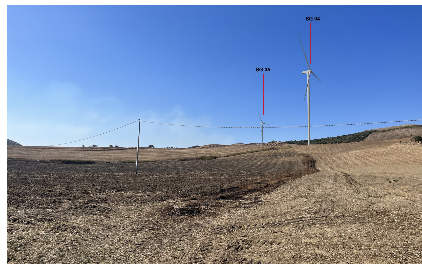
img_2366- Post operam