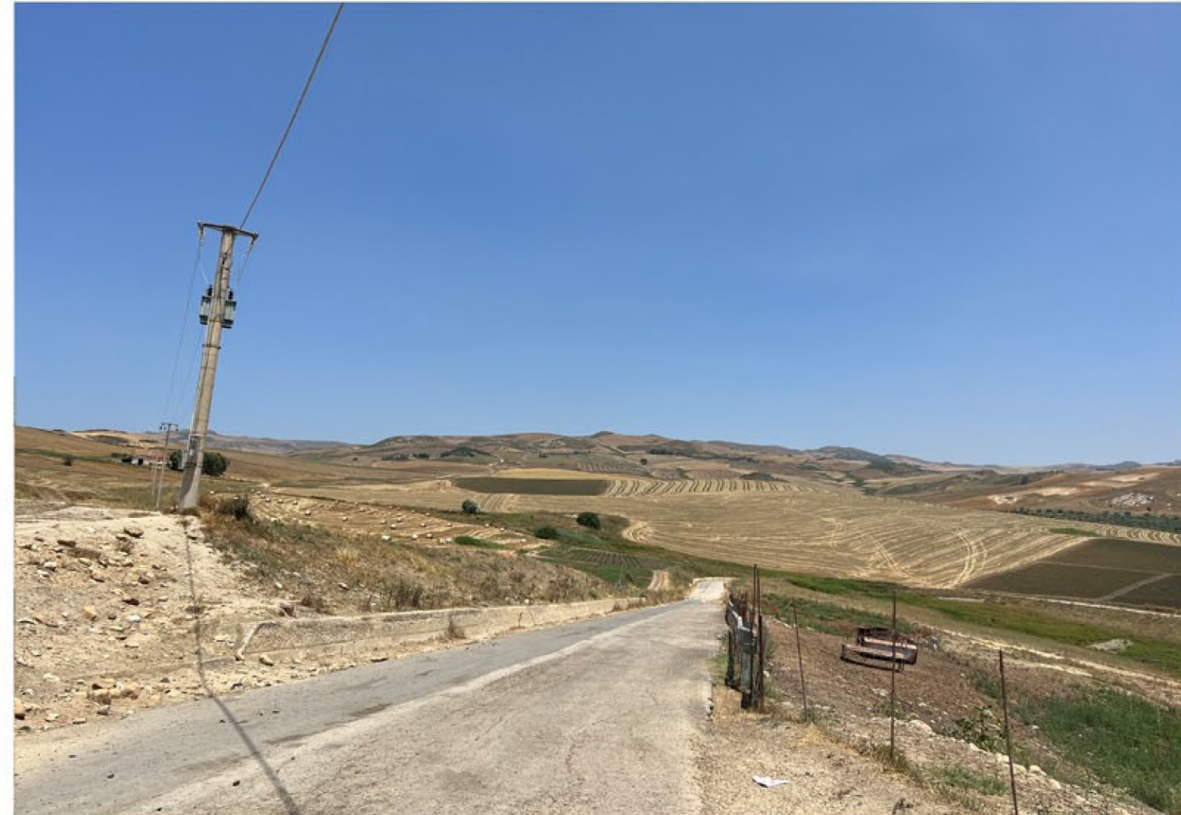
img_9670 - Ante operam