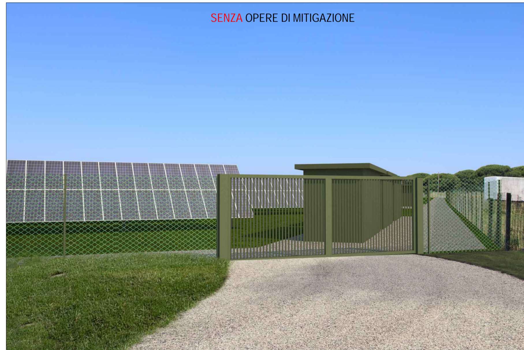
SENZA OPERE DI MITIGAZIONE