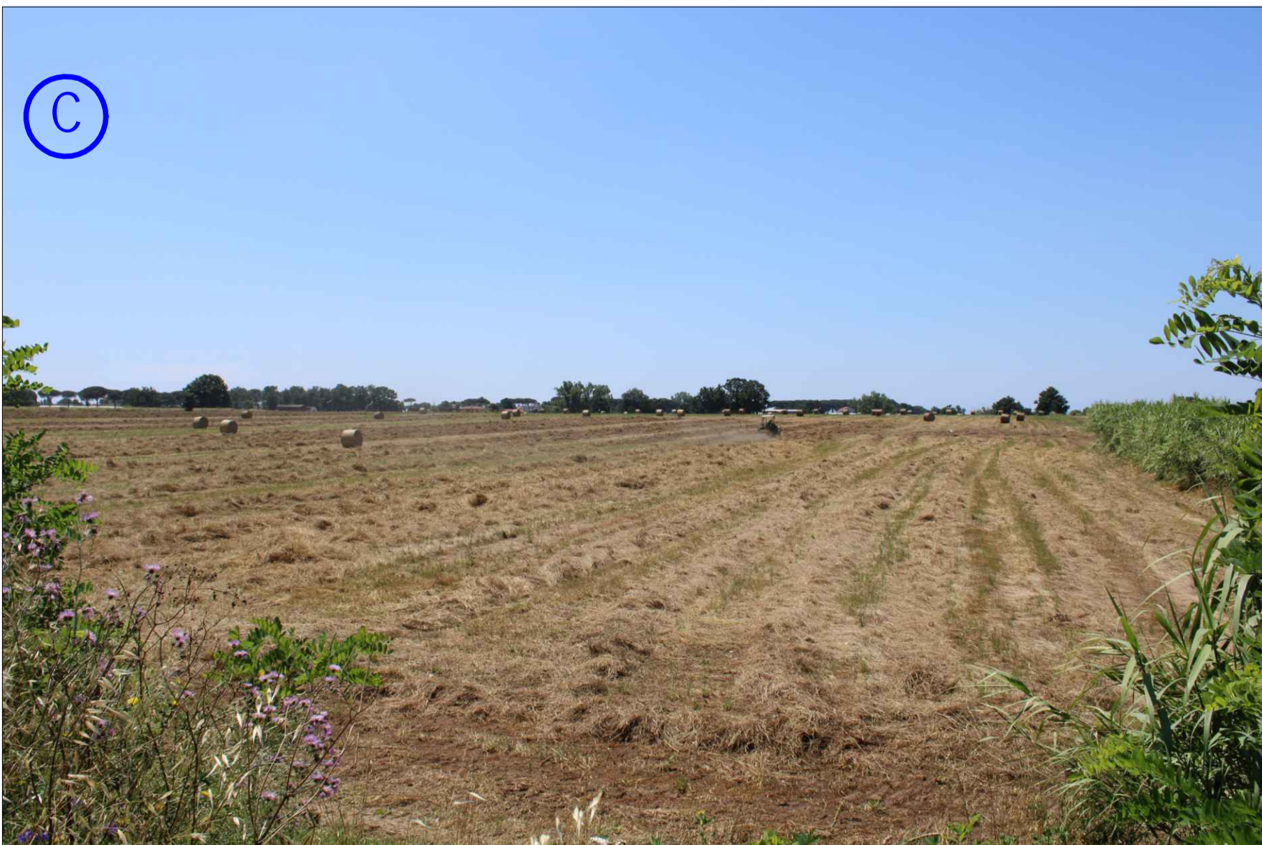
SENZA OPERE DI MITIGAZIONE