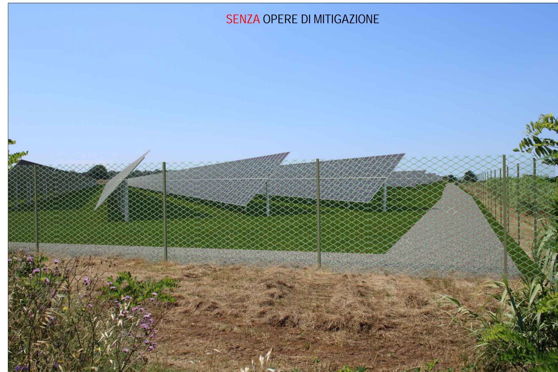
SENZA OPERE DI MITIGAZIONE