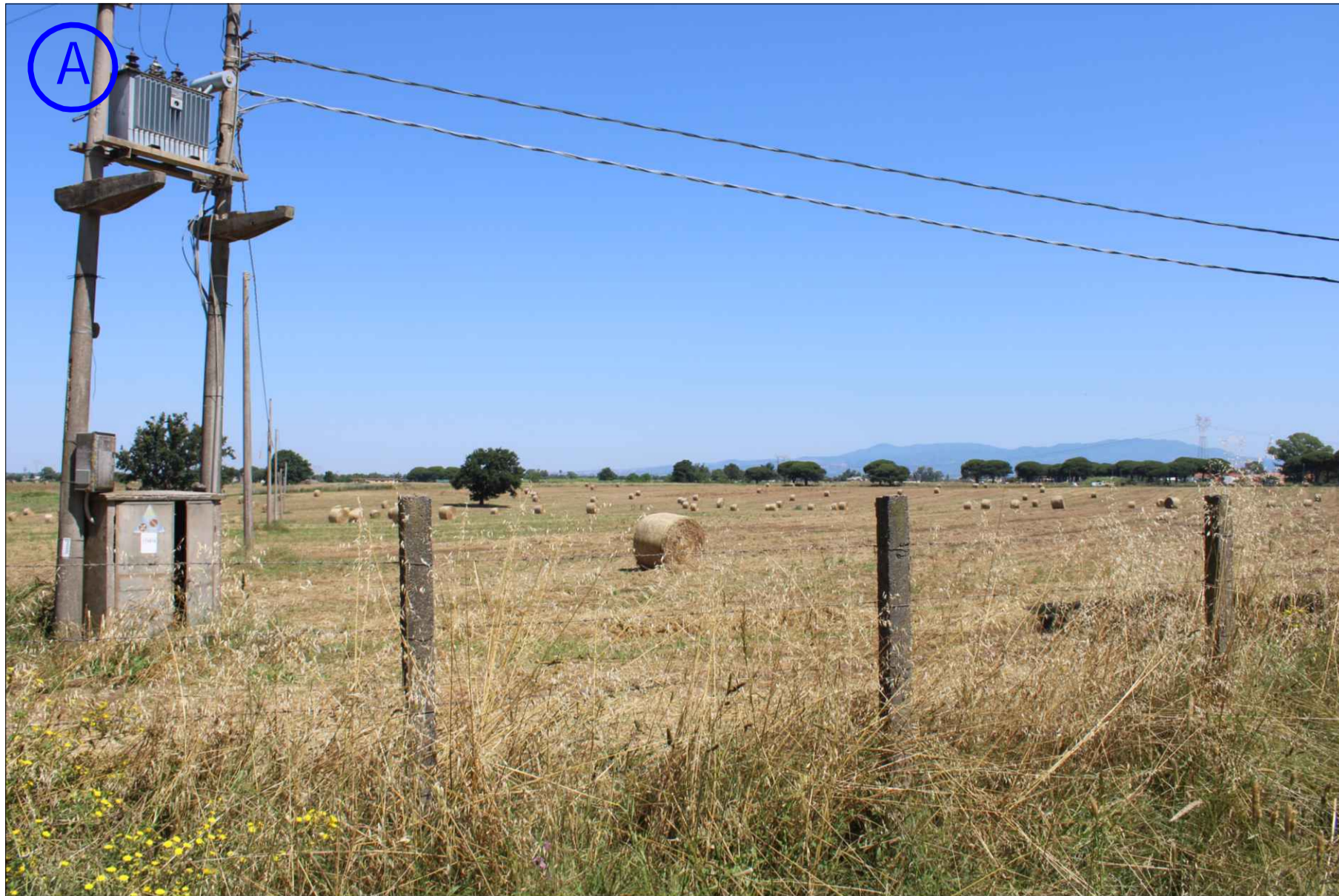
STATO DI FATTO (ANTE-OPERAM)