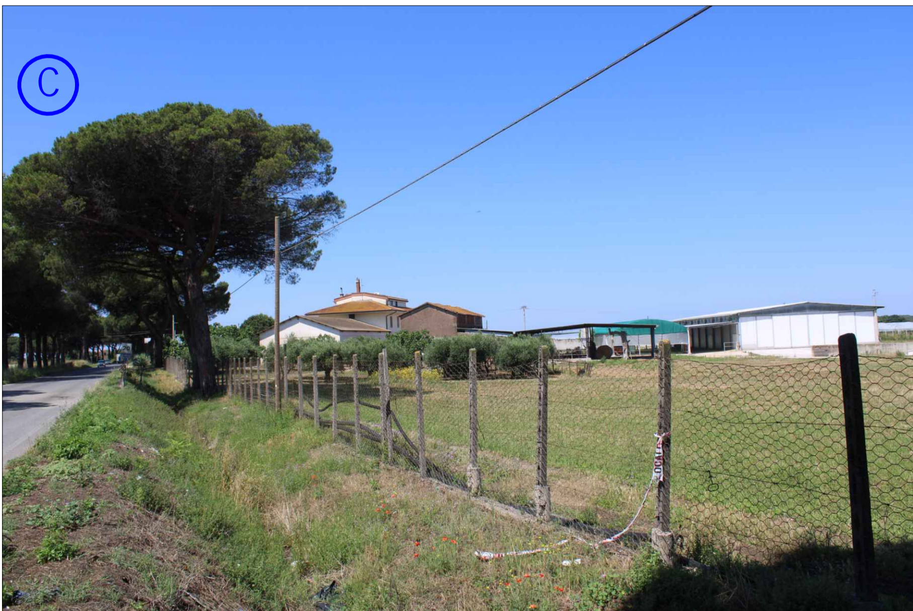
SENZA OPERE DI MITIGAZIONE