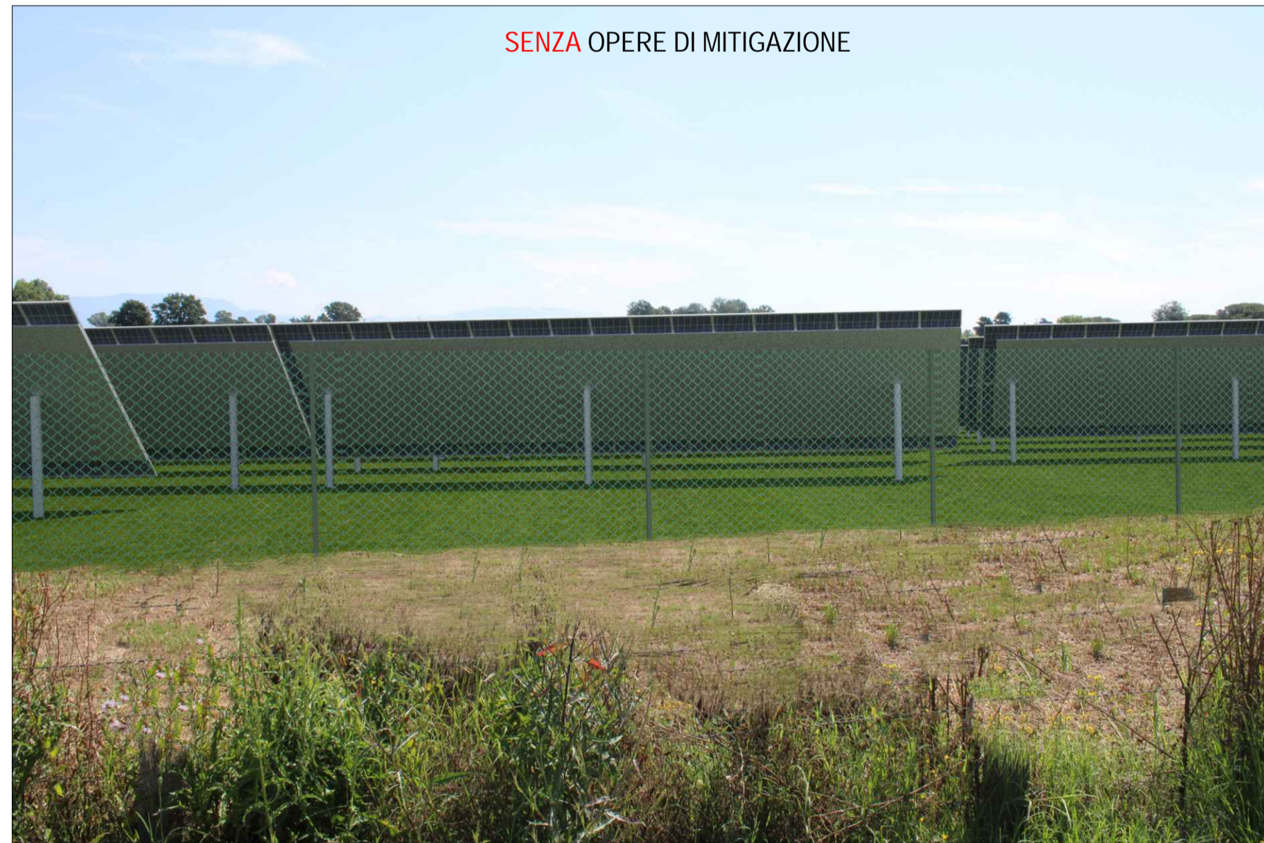
SENZA OPERE DI MITIGAZIONE