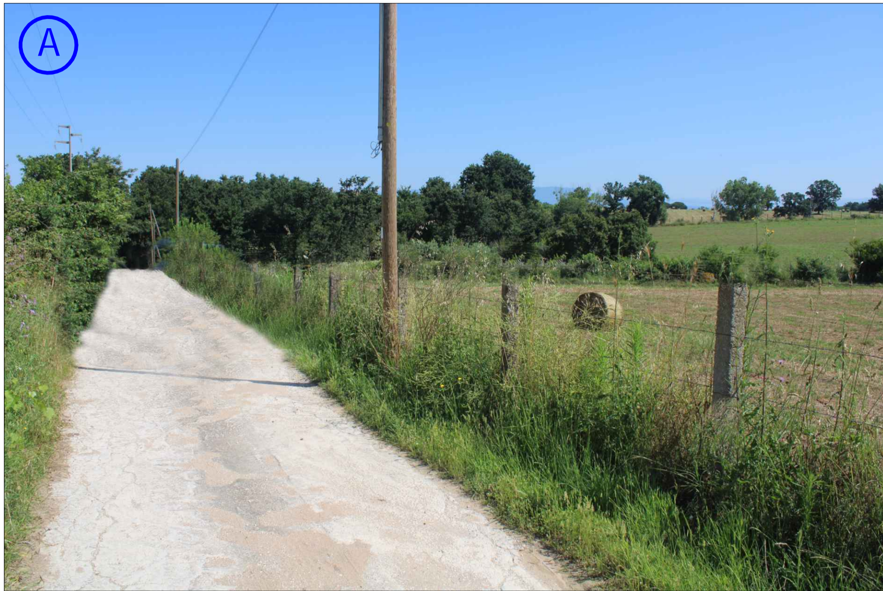
STATO DI FATTO (ANTE-OPERAM)