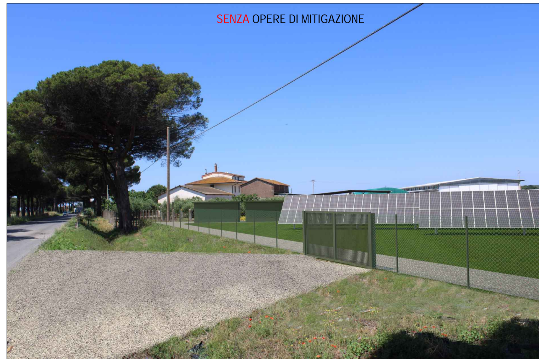
SENZA OPERE DI MITIGAZIONE