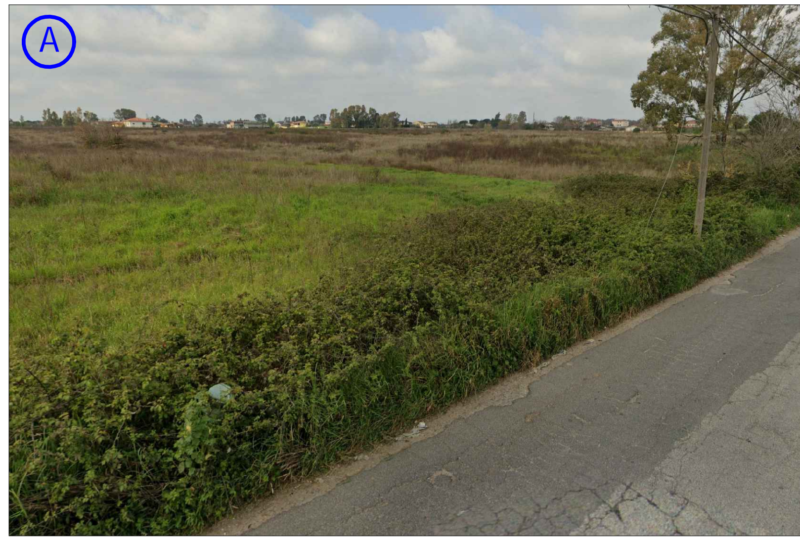
STATO DI FATTO (ANTE-OPERAM)