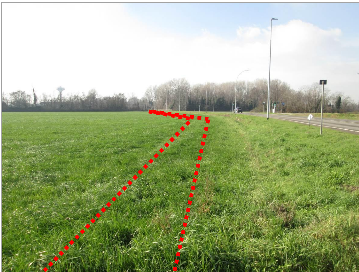
Figura 15 - Secondo tratto in affiancamento di via Reiss Romoli – vista d’insieme, da est