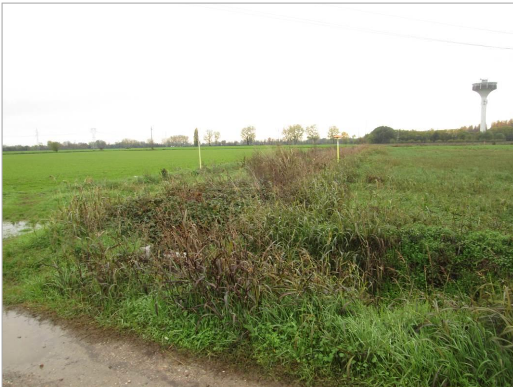
Figura 2 – Il fosso irriguo con la contigua viabilità interpodereale a cui si affianca il tracciato del collegamento elettrico; si osservano le paline segnaletiche del metanodotto sottopassato con la TOC 1b