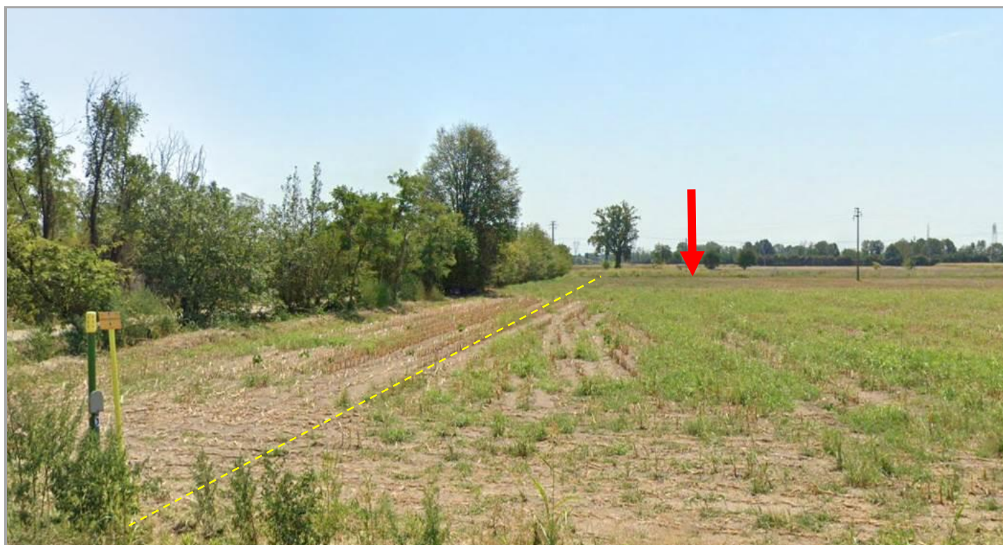
Figura 4 - TOC n. 1b: superamento del tracciato del Metanodotto SNAM (linea gialla), del fontanile Oliva e della contigua strada vicinale dei Boschi – La freccia indica il punto di imbocco della TOC 1b