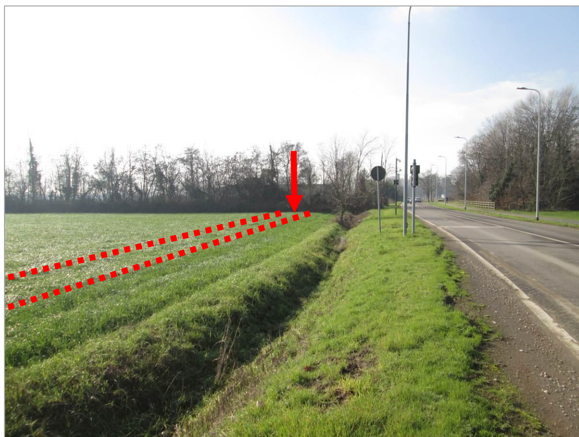
Figura 14 - Secondo tratto in affiancamento di via Reiss Romoli, uscita della TOC n.2, vista da est