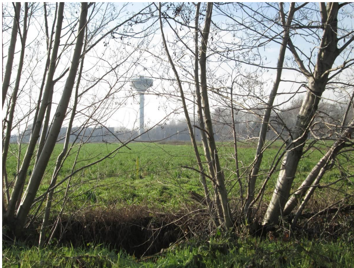
Figura 7 - Fontanile Oliva, sottopassato con la TOC n.1b