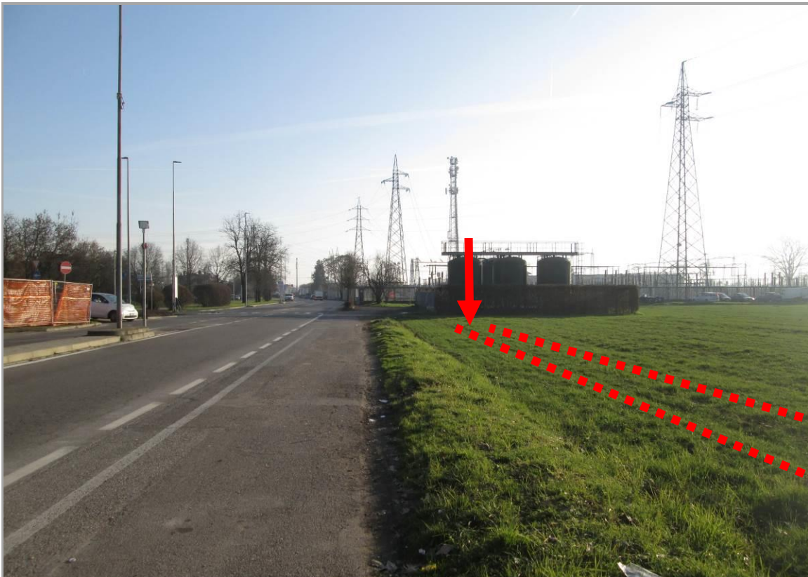
Figura 32 - Ingresso TOC n. 6, che sottopassa via Edison e si approssima all'ingresso nella S.E. Baggio