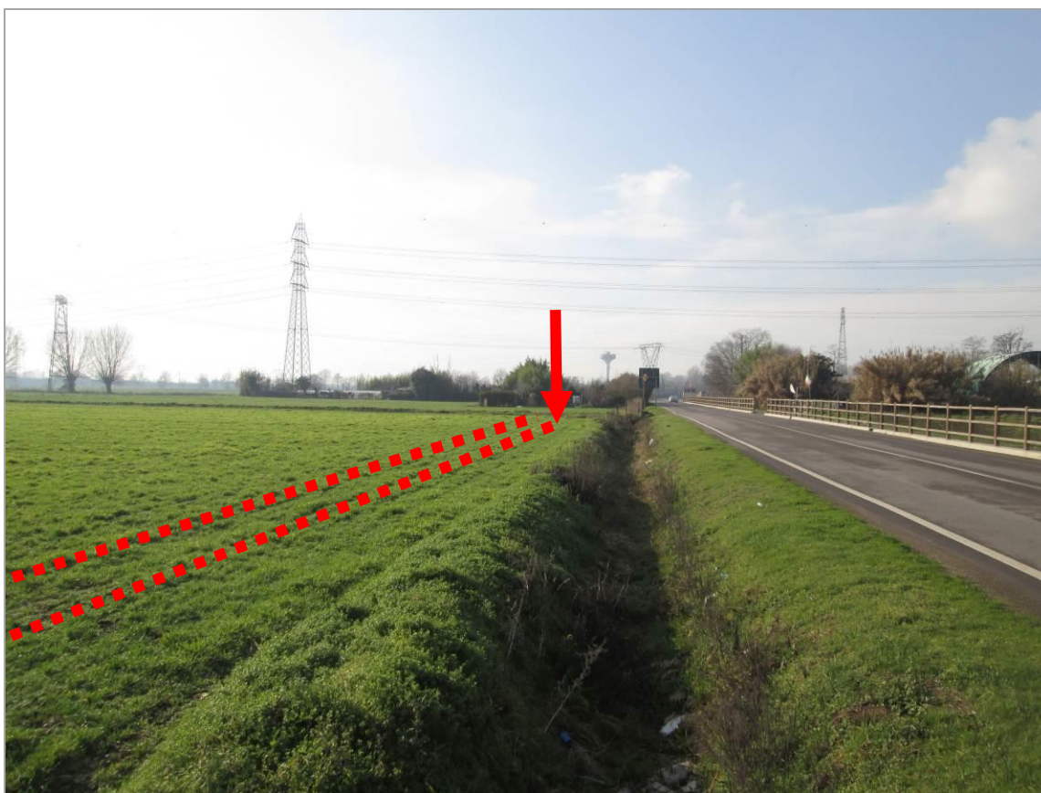
Figura 19 - Uscita della TOC n. 3 e terzo tratto in affiancamento di via Reiss Romoli