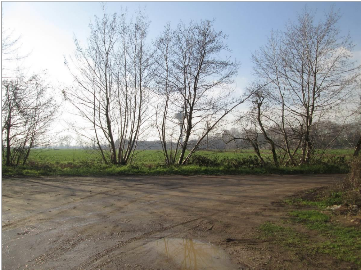
Figura 6 - Strada vicinale dei Boschi e fontanile Oliva, sottopassati con la TOC n.1b