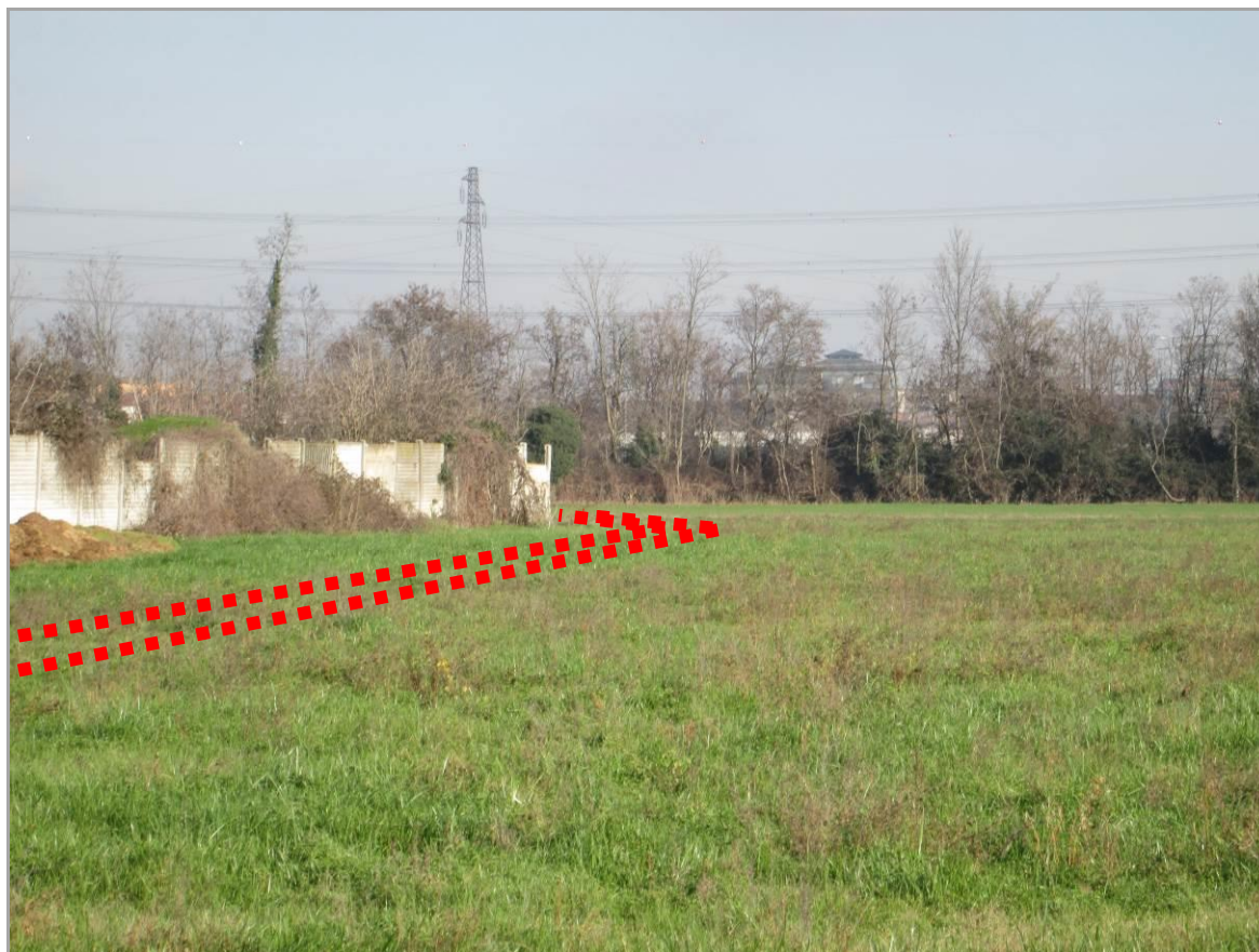
Figura 10 - Tratto in avvicinamento a via Reiss Romoli