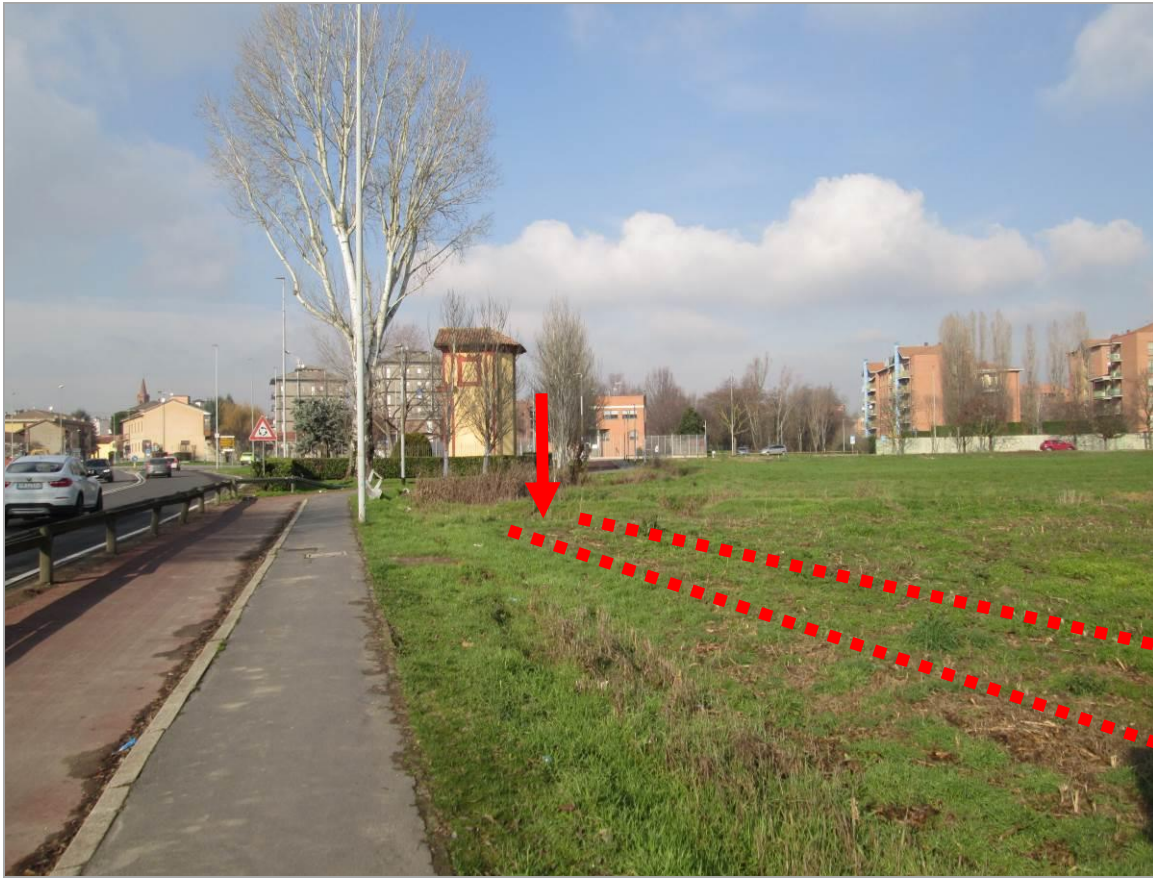
Figura 23 - Uscita TOC. 4, vista da sud