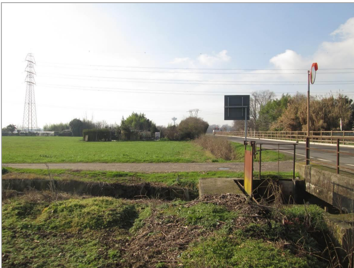
Figura 18 - Zona ad orti, strada vicinale e fontanile Olonella attraversati con TOC n. 3