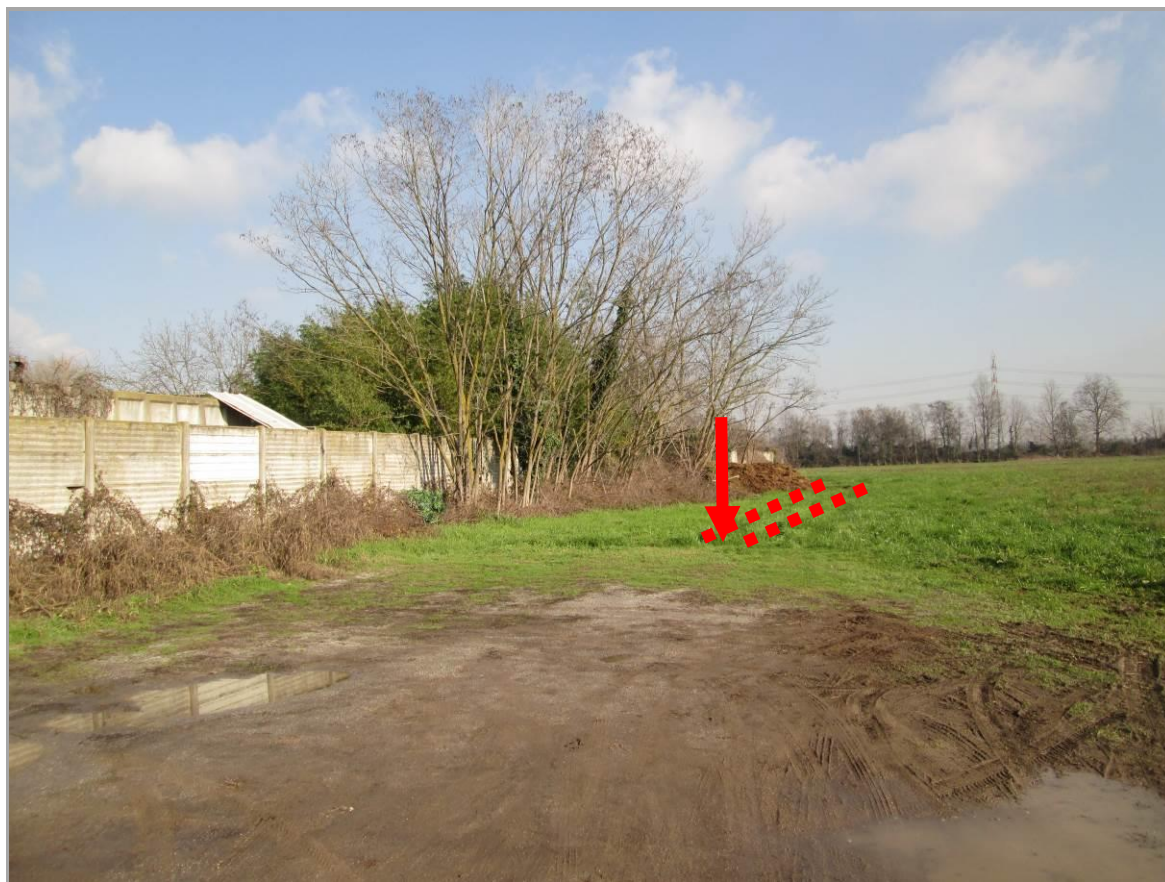
Figura 9 - Dall'uscita della TOC n. 1b verso via Reiss Romoli