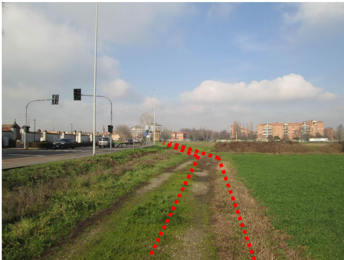
Figura 25 - Attraversamento fosso irriguo, vista da sud