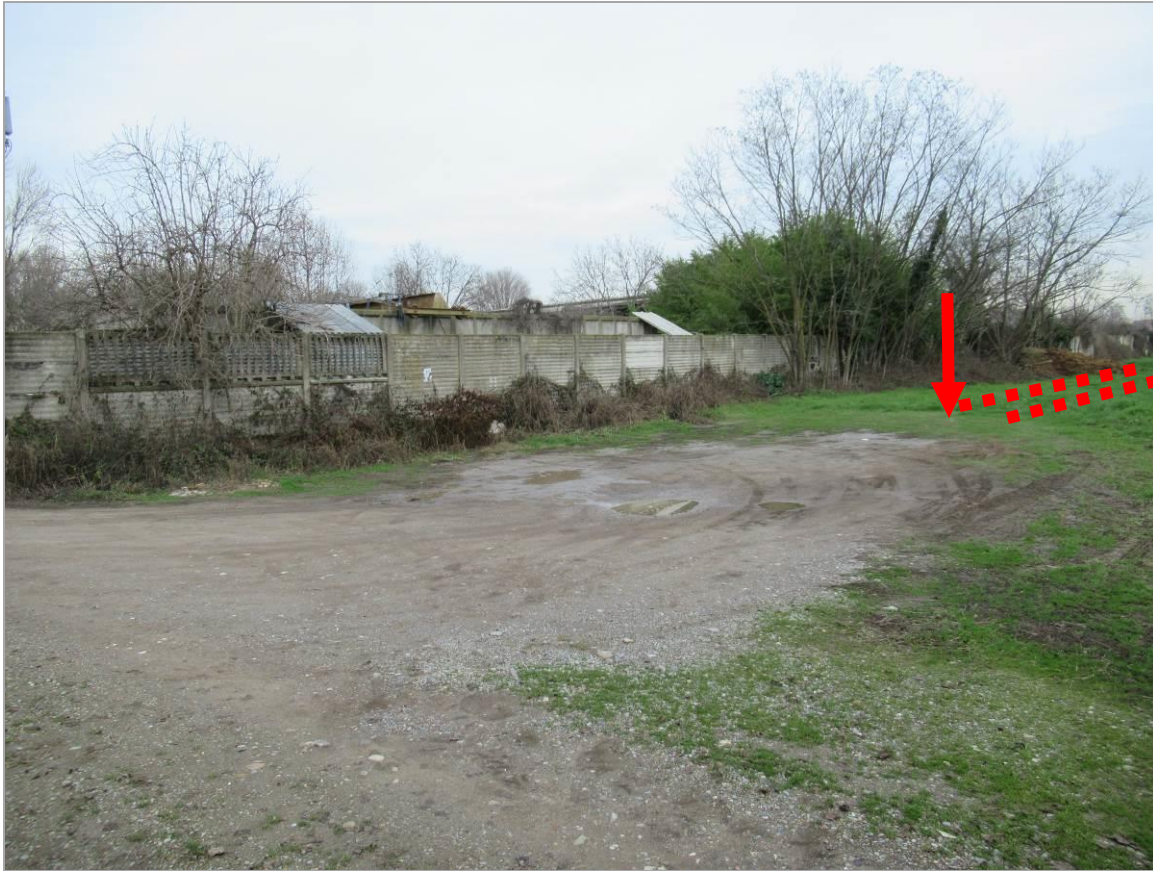
Figura 5 - Uscita della TOC n.1b e prosieguo delle due linee