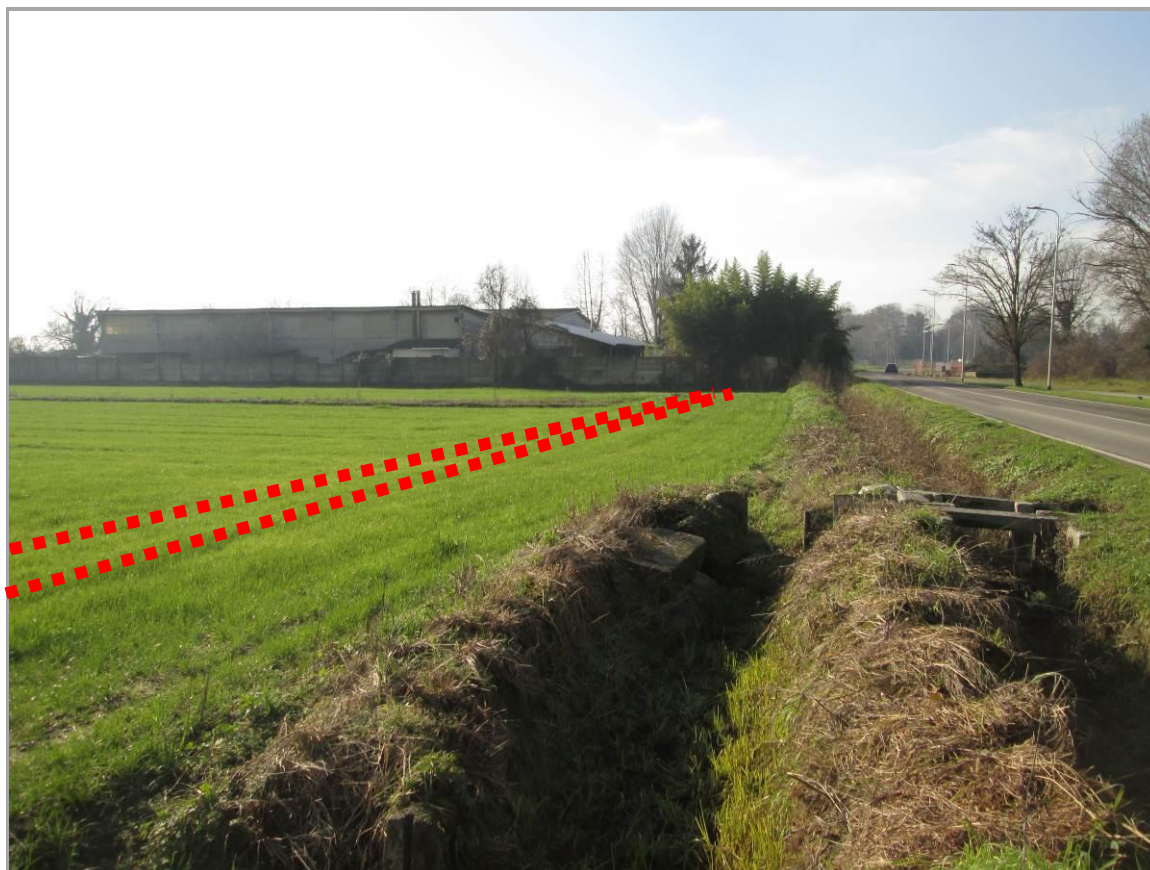
Figura 12 - Primo tratto in affiancamento di via Reiss Romoli, in avvicinamento all'ingresso della TOC n. 2, vista da est