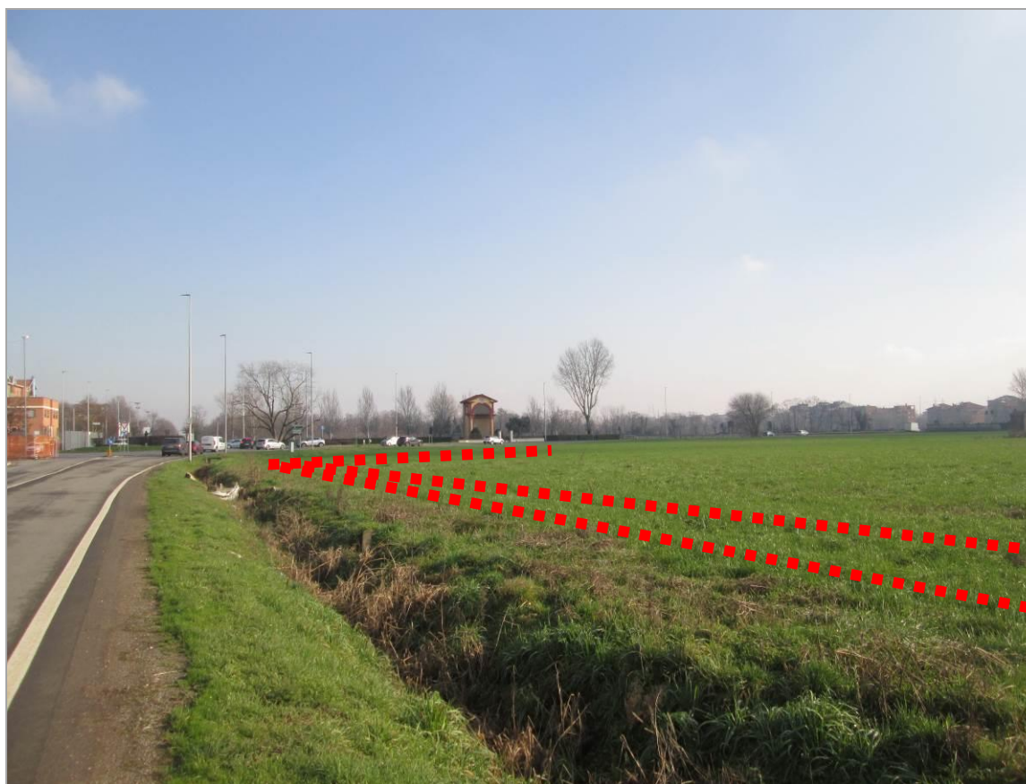
Figura 20 - Terzo tratto in affiancamento di via Reiss Romoli – vista d'insieme, da est