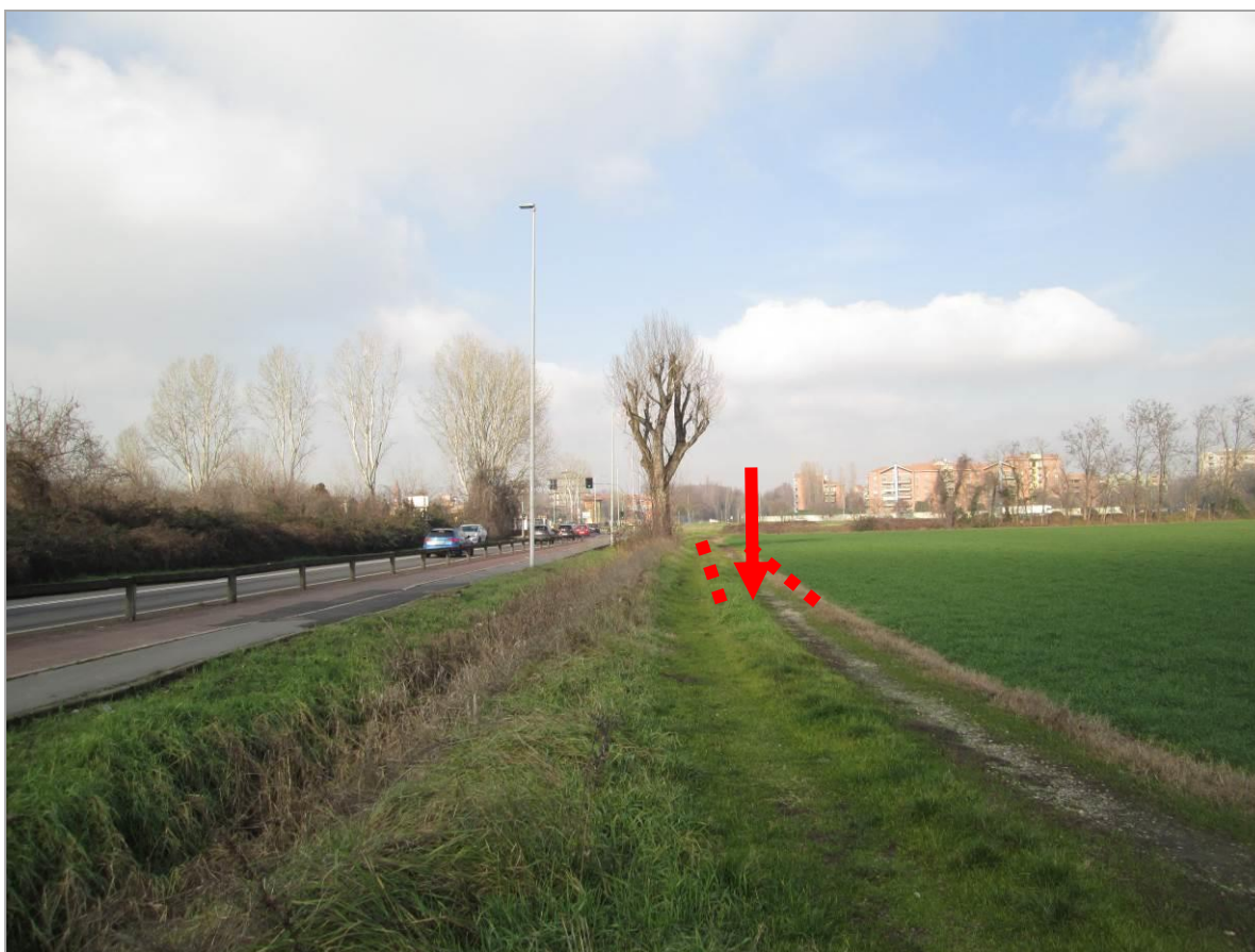
Figura 27 - Secondo tratto in affiancamento di via Edison, vista da sud – con indicazione del punto di imbocco della TOC n. 5