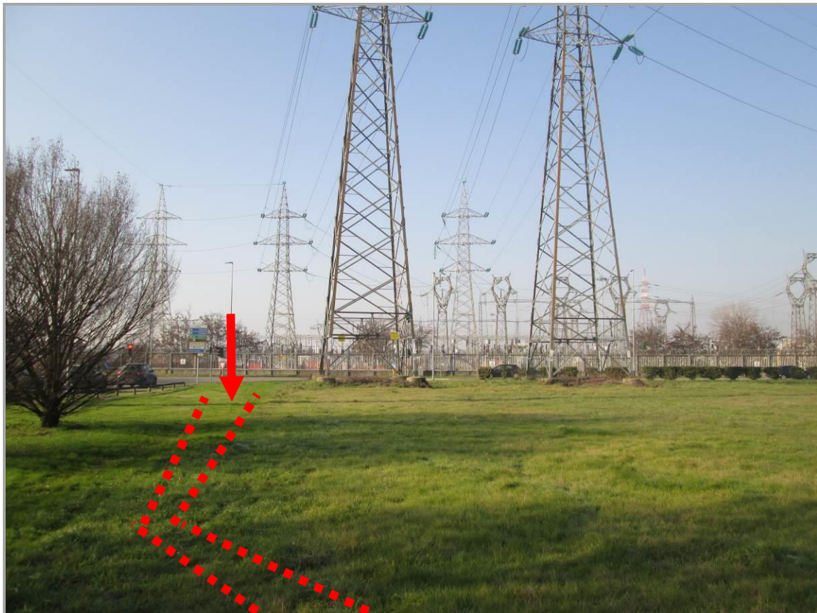
Figura 34 - Ingresso TOC N. 7 in ingresso alla S.E. Baggio