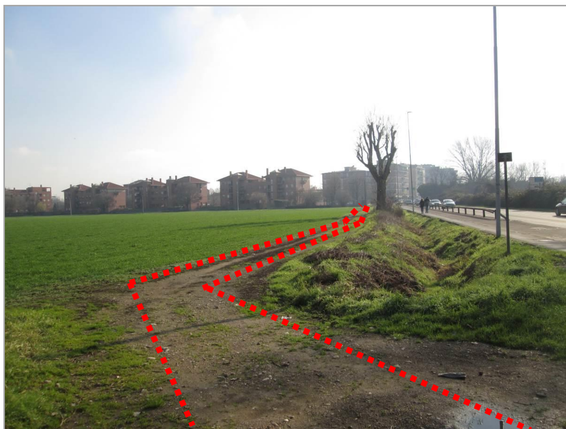
Figura 26 - Secondo tratto in affiancamento di via Edison, vista da nord