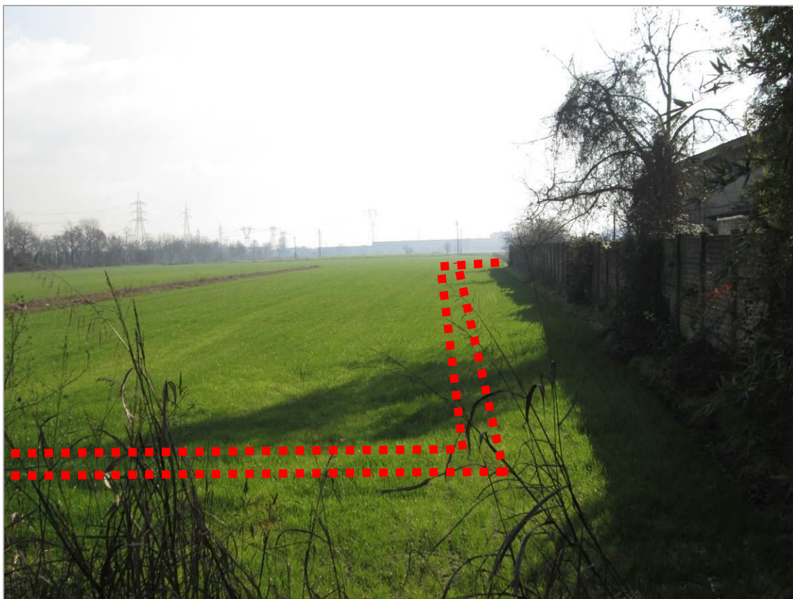
Figura 11 - Tratto in avvicinamento e poi affiancamento a via Reiss Romoli