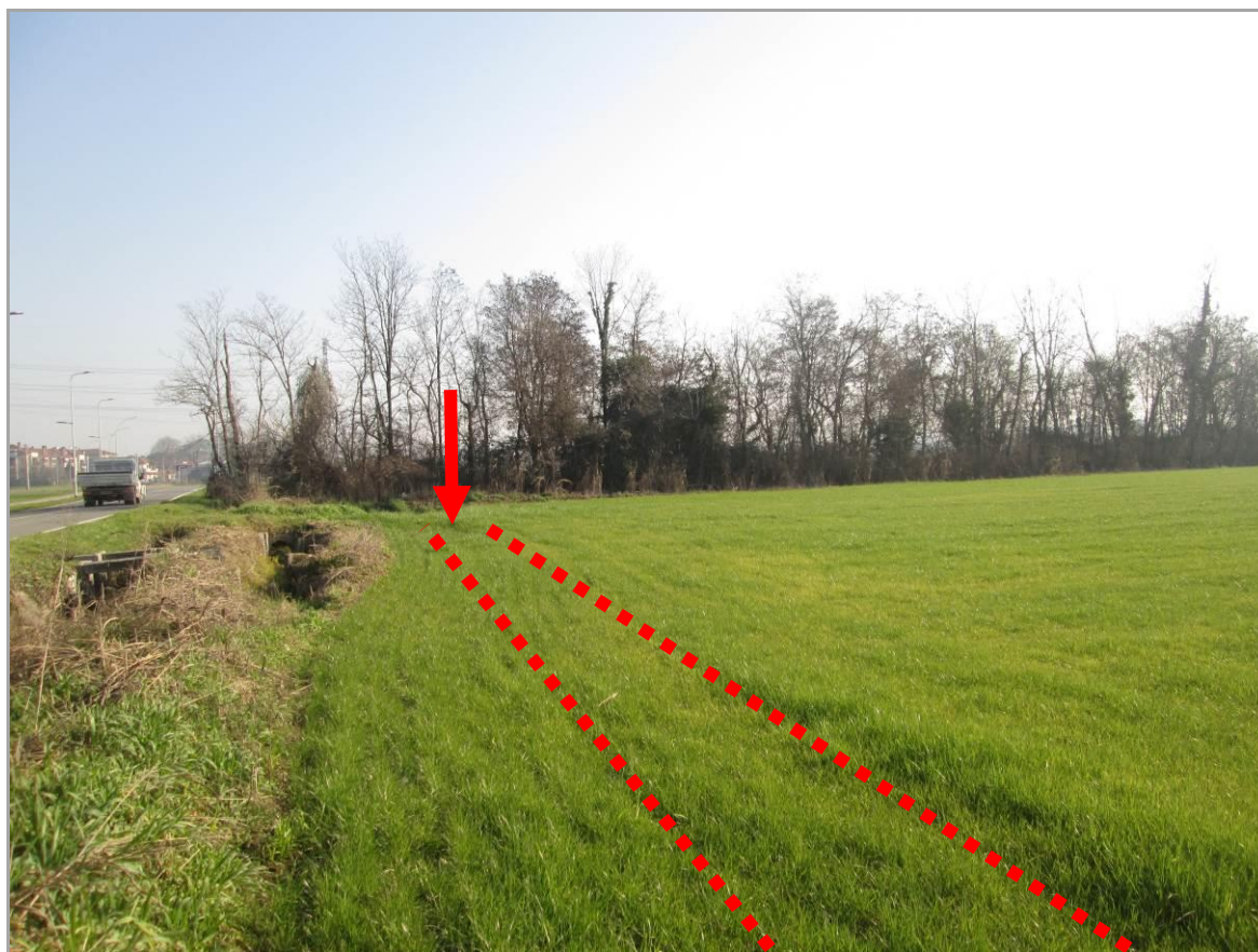
Figura 13 - Ingresso TOC n. 2, in attraversamento del fontanile Marcione, vista da ovest