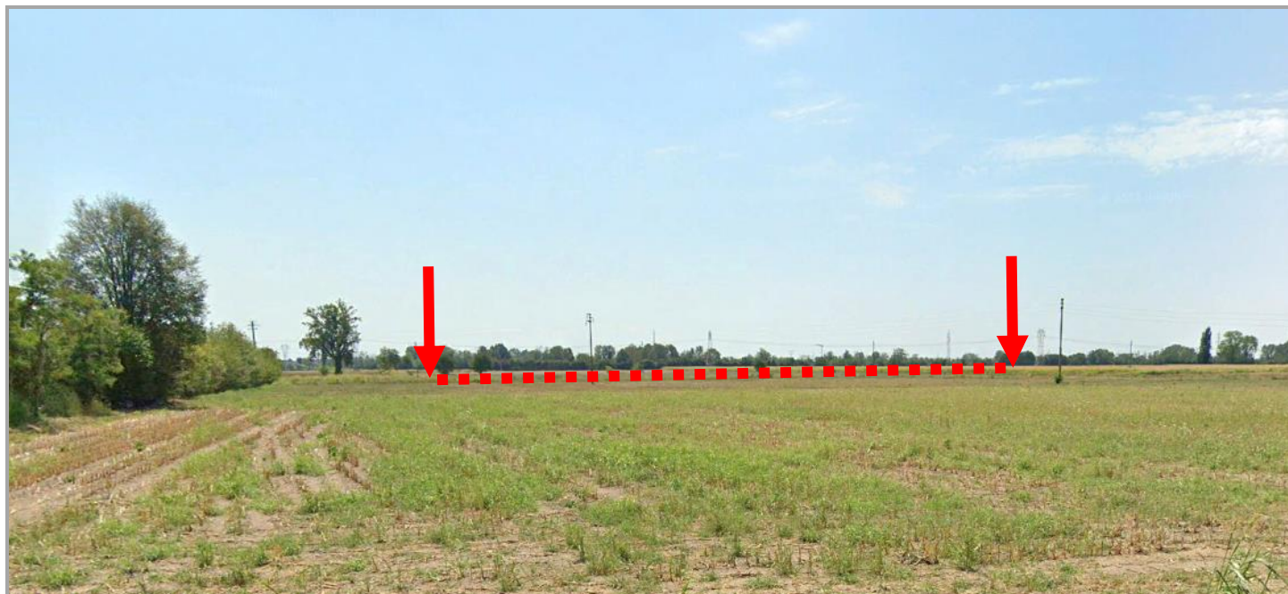
Figura 3 - Tratto in uscita dall'area Microsoft – Tratto in trincea con il termine TOC 1a e inizio TOC 1b