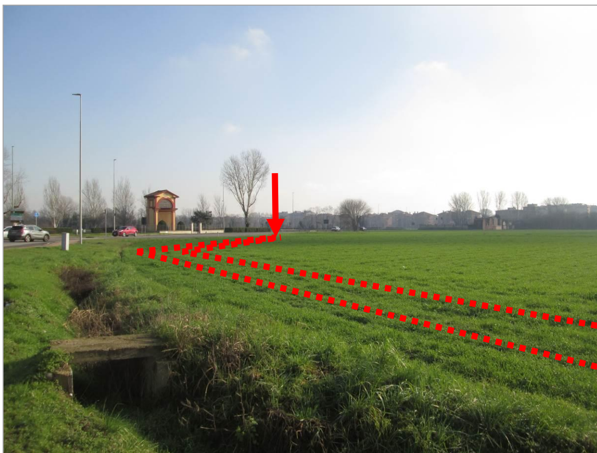
Figura 21 - Terzo tratto in affiancamento di via Reiss Romoli, in avvicinamento alla TOC n. 4– vista da est