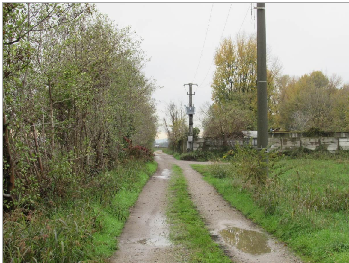
Figura 8 - Strada vicinale dei Boschi, sulla sinistra il fontanile Oliva, sottopassati con la TOC n.1b