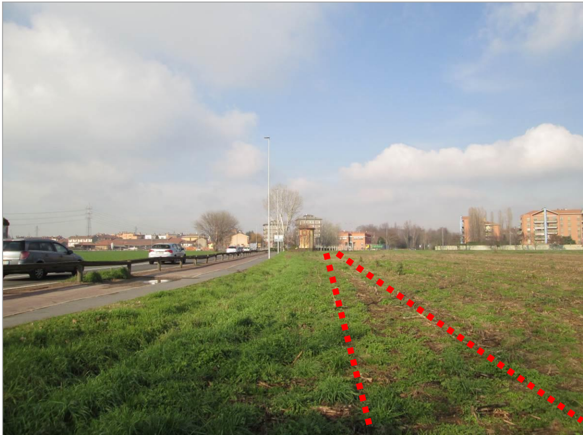
Figura 24 - Primo tratto in affiancamento di via Edison, vista da sud