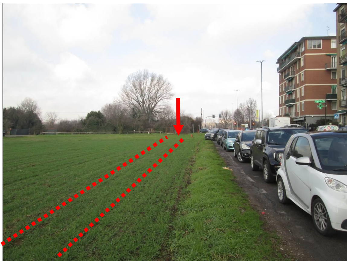
Figura 30 - Uscita della TOC n. 5 e successivo tratto in affiancamento di via Edison, vista sud