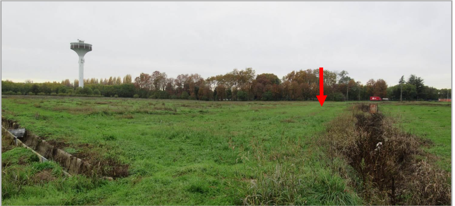
Figura 1 - Vista dell'area Microsoft dal margine sud-est con localizzazione del punto di attacco della TOC n. 1a in uscita dall'area del Data Center

Di seguito viene presentata una documentazione fotografica relativa del tracciato di progetto, seguendo un percorso che parte dall'area della Sottostazione Microsoft fino all'ingresso nella Stazione Elettrica Baggio di Terna.