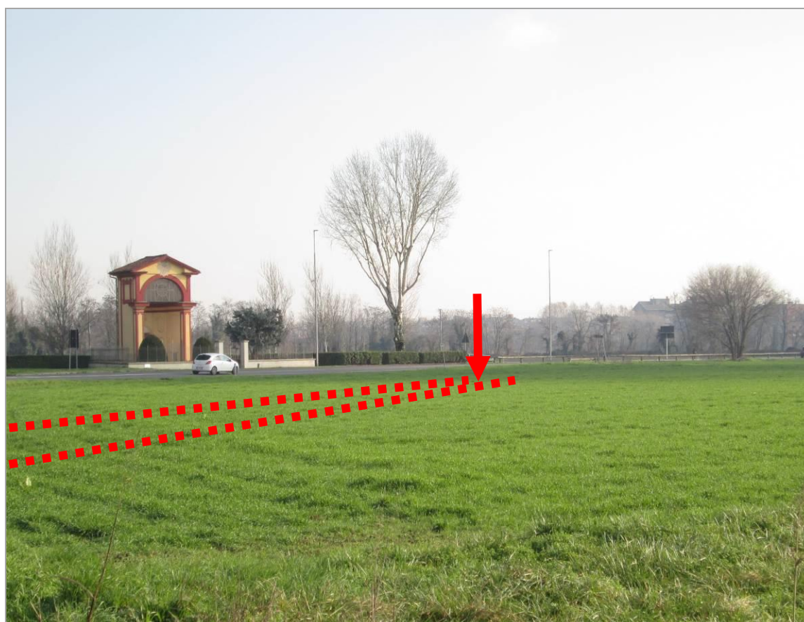
Figura 22 - Ingresso TOC n. 4, in attraversamento di via Edison