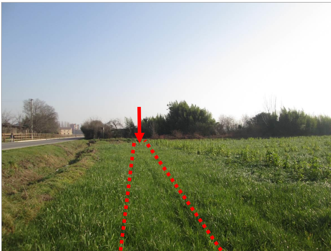
Figura 17 - Ingresso della TOC n. 3, in attraversamento del fontanile Rilè, di una zona a orti, del fontanile Olonella e della contigua strada vicinale