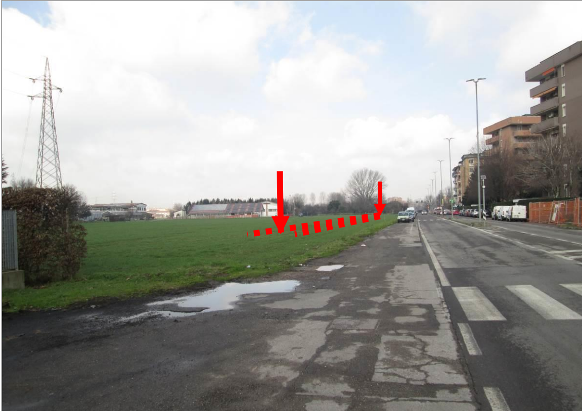
Figura 31 – Vista d'insieme del tratto in affiancamento di via Edison, tra l'uscita della TOC n. 5 e l'ingresso della TOC n. 6, vista sud