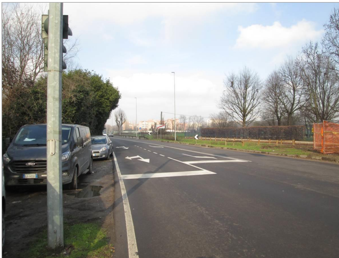
Figura 29 - Vista di via Edison nel tratto in cui è sottopassata dalla TOC n. 5