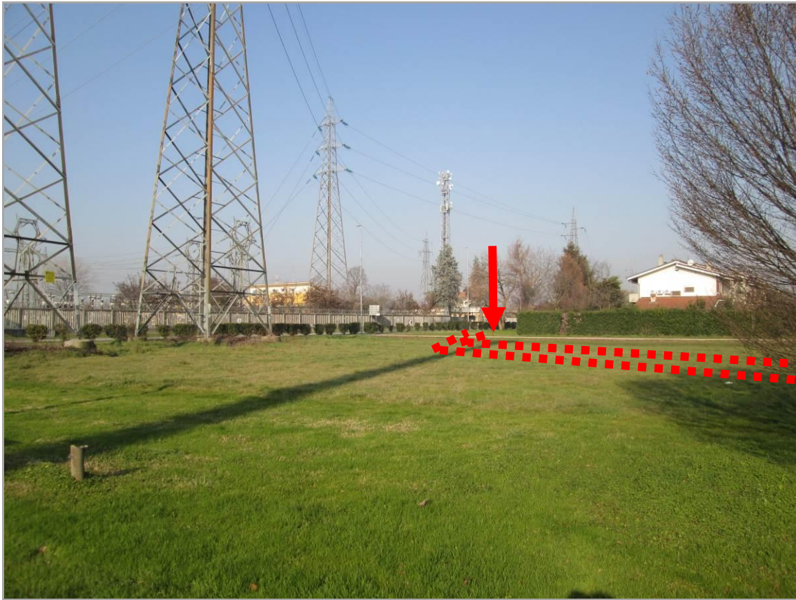
Figura 33 - Uscita TOC n. 6 e tratto in avvicinamento alla TOC n. 7 in ingresso alla S.E. Baggio