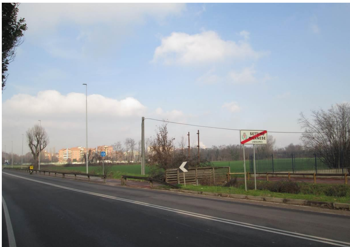
Figura 28 – Primo tratto di via Edison sottopassato dalla TOC n 5