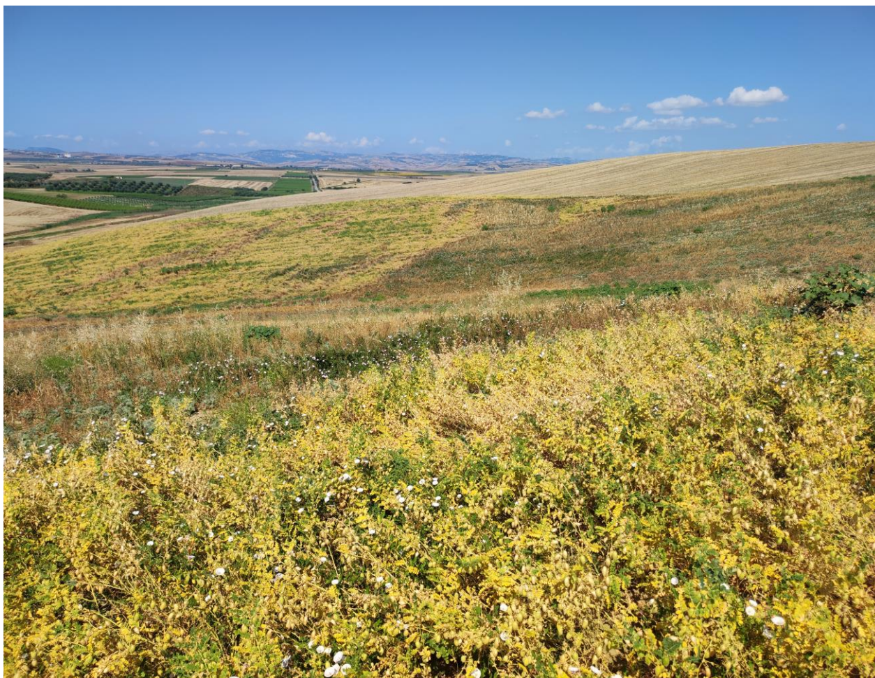
Particolare coltivazione agricole in atto (ceci)

Per quanto attiene le condizioni pedologiche si ricorda che l'intero Tavoliere è caratterizzato da un piano alluvionale originato da un fondo di mare emerso costituito da strati argillosi, sabbiosi e anche calcarei del Pliocene e del Quaternario, che hanno dato luogo a terre di consistenza diversa e anche di non facile lavorazione.