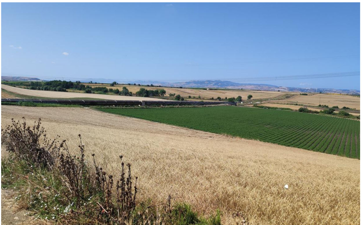
Particolare di coltivazioni agricole in rotazione