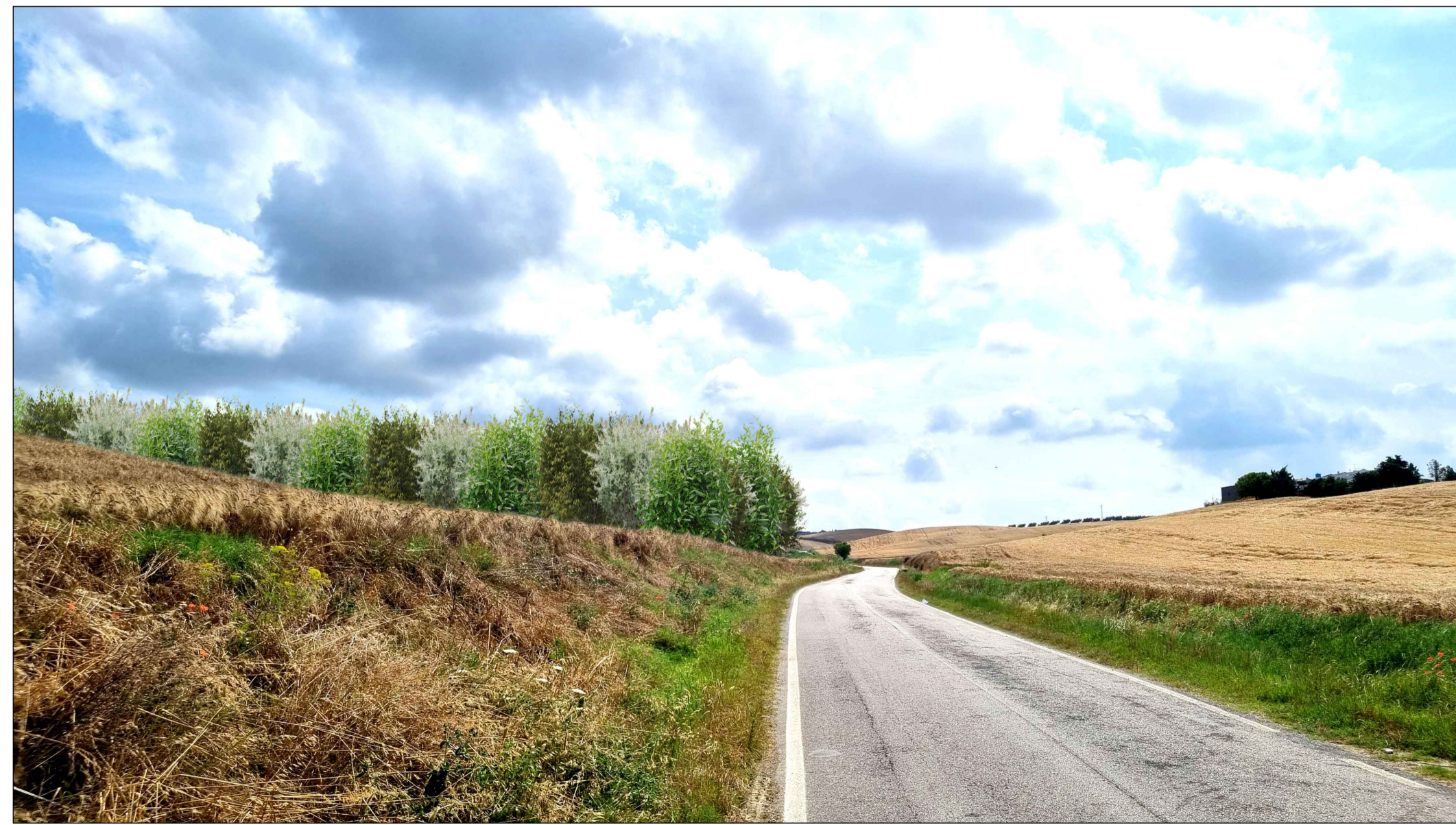
FOTOINSENERIMENTO 3 - STATO DI PROGETTO