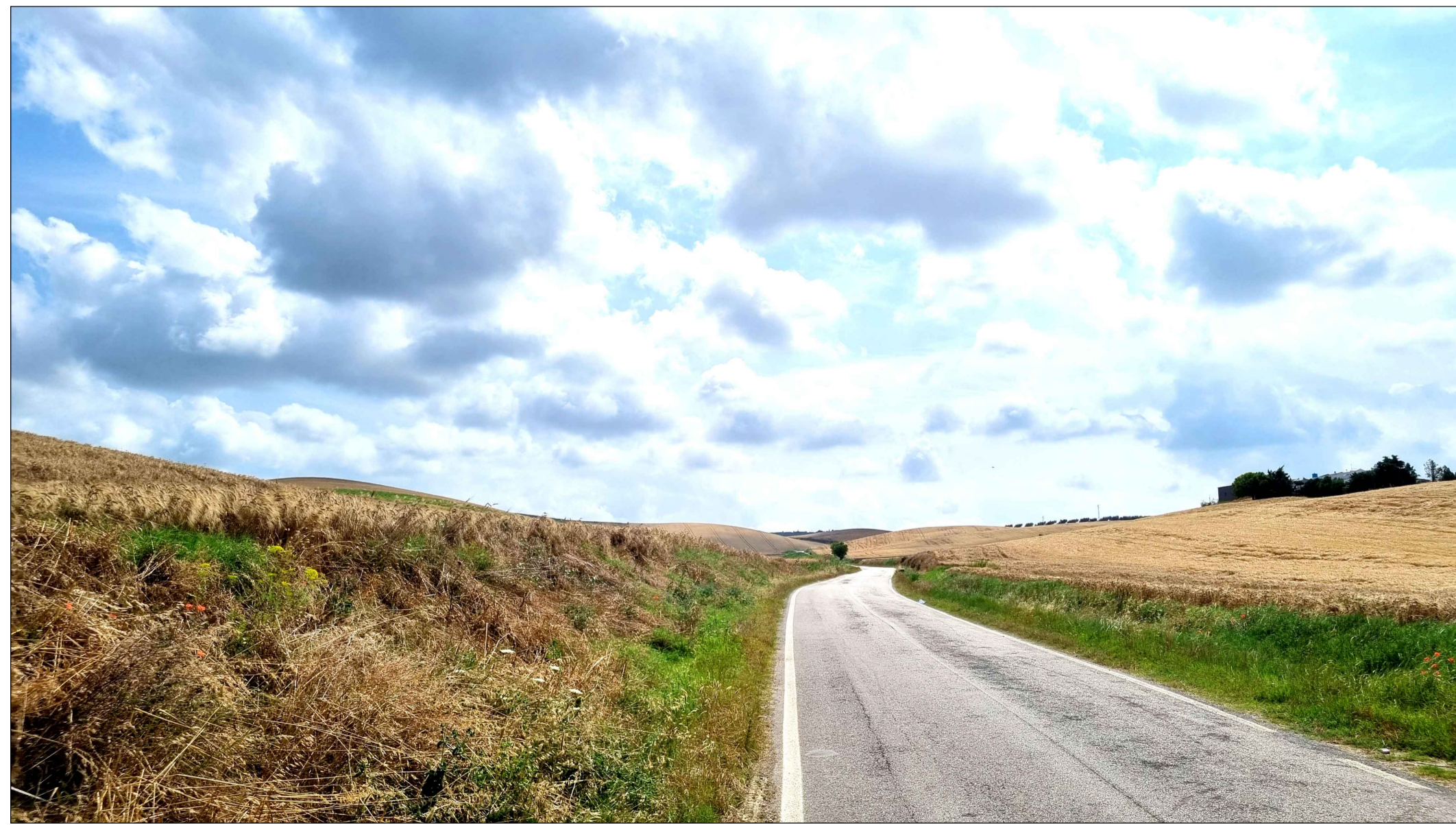
FOTOINSENERIMENTO 3 - STATO DI FATTO