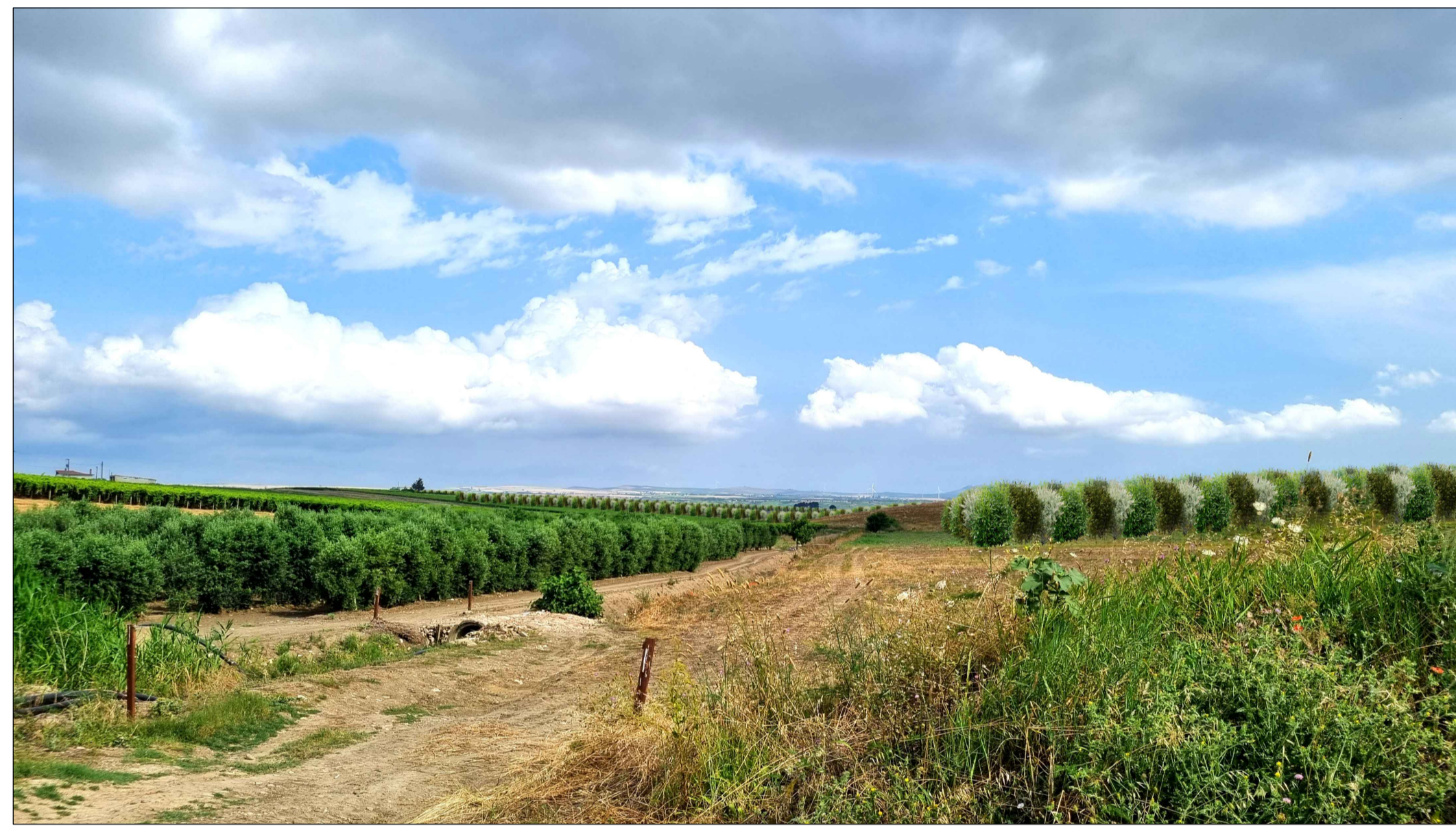
FOTOINSERIMENTO 10 - STATO DI PROGETTO