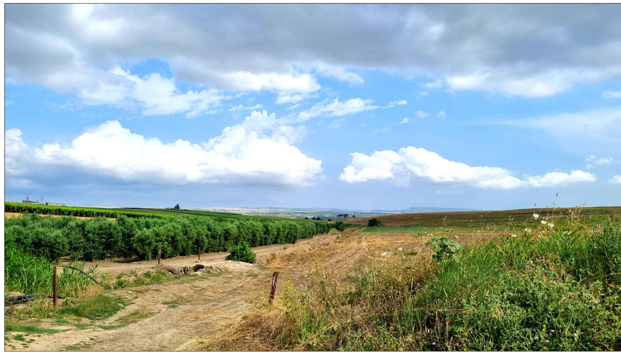
FOTOINSERIMENTO 10 - STATO DI FATTO