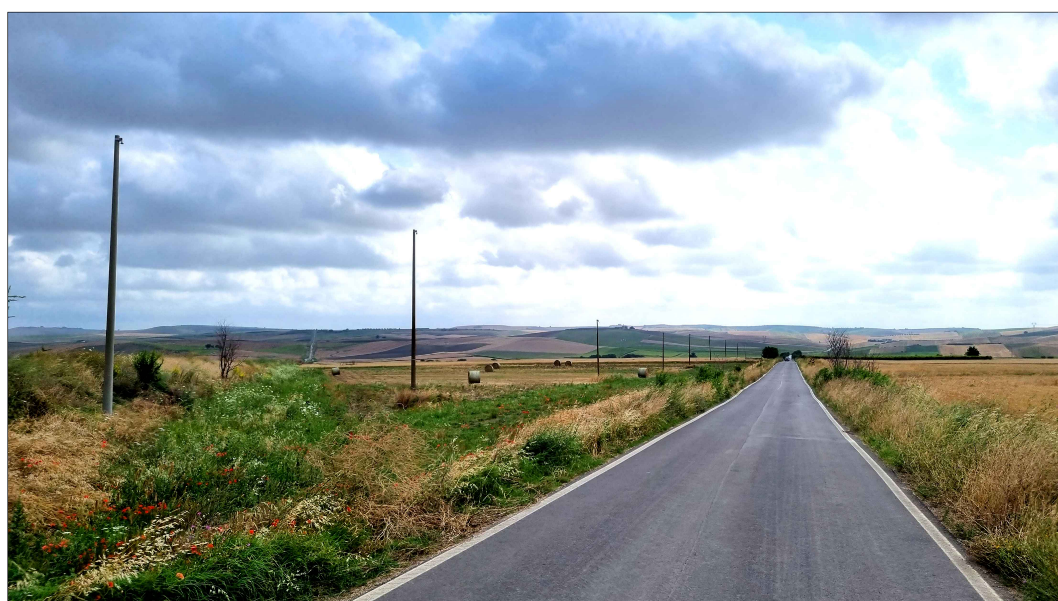
FOTOINSERIMENTO 11 - STATO DI FATTO