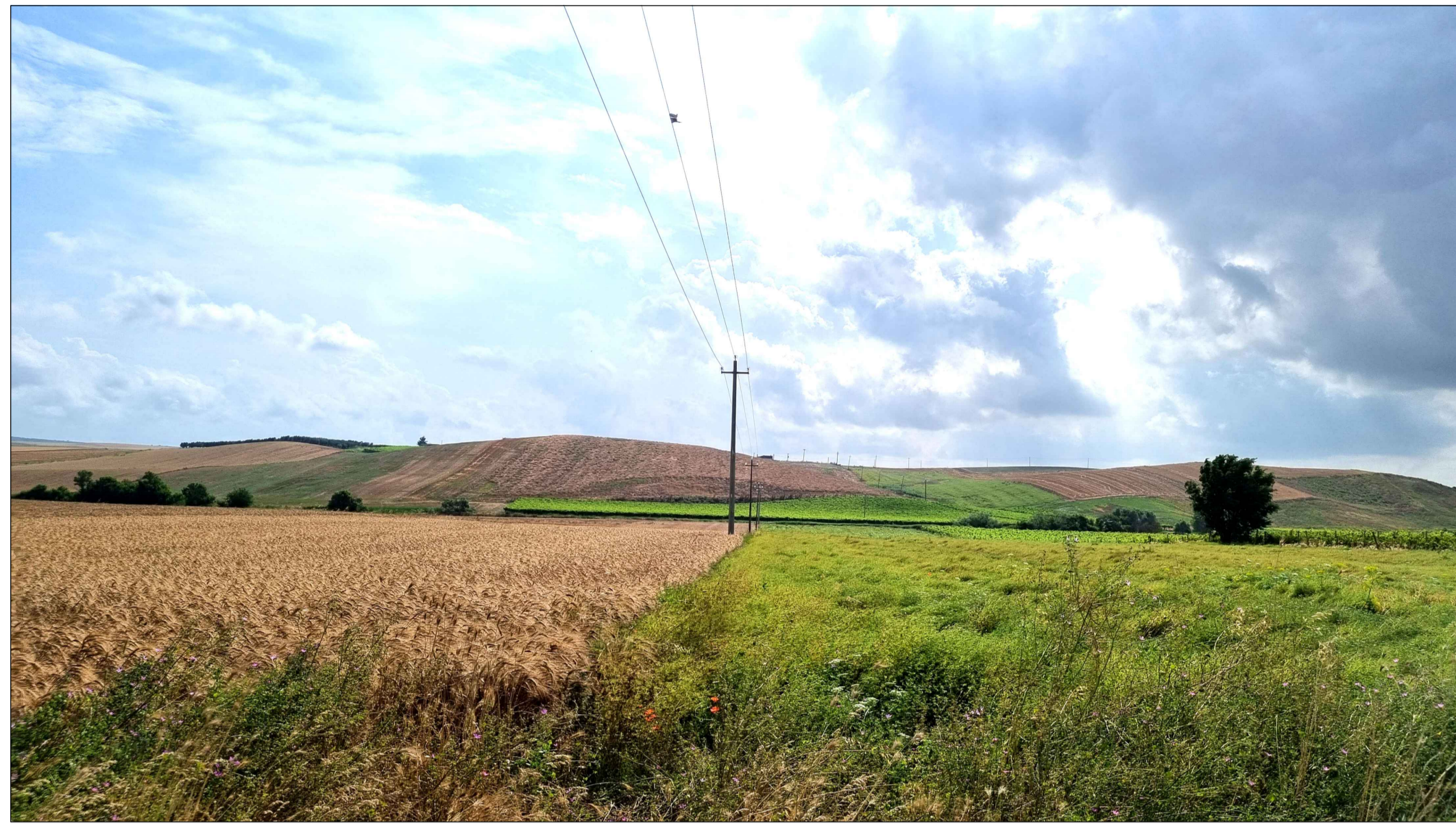
FOTOINSERIMENTO 9 - STATO DI FATTO