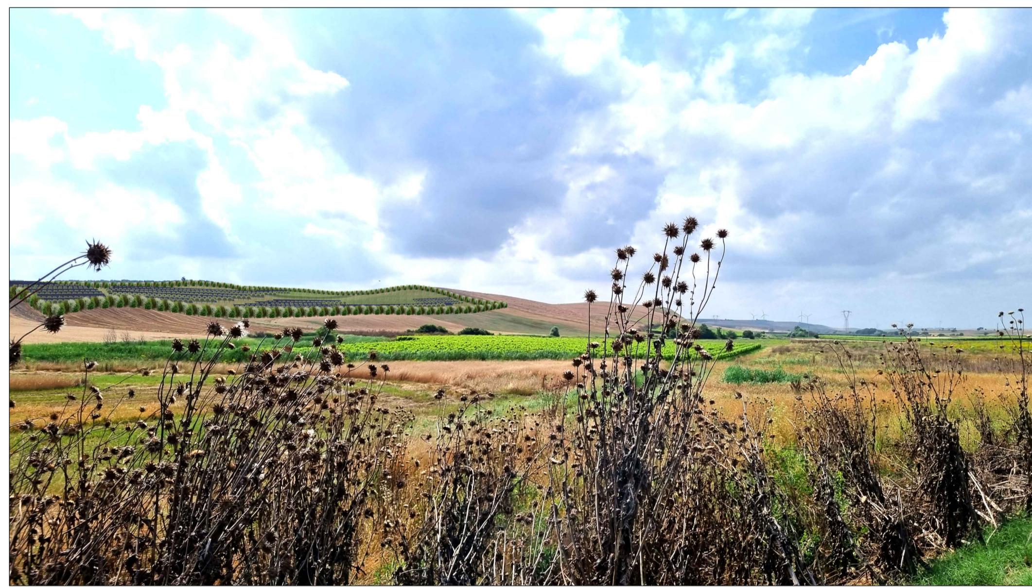
FOTOINSENERIMENTO 13 - STATO DI PROGETTO