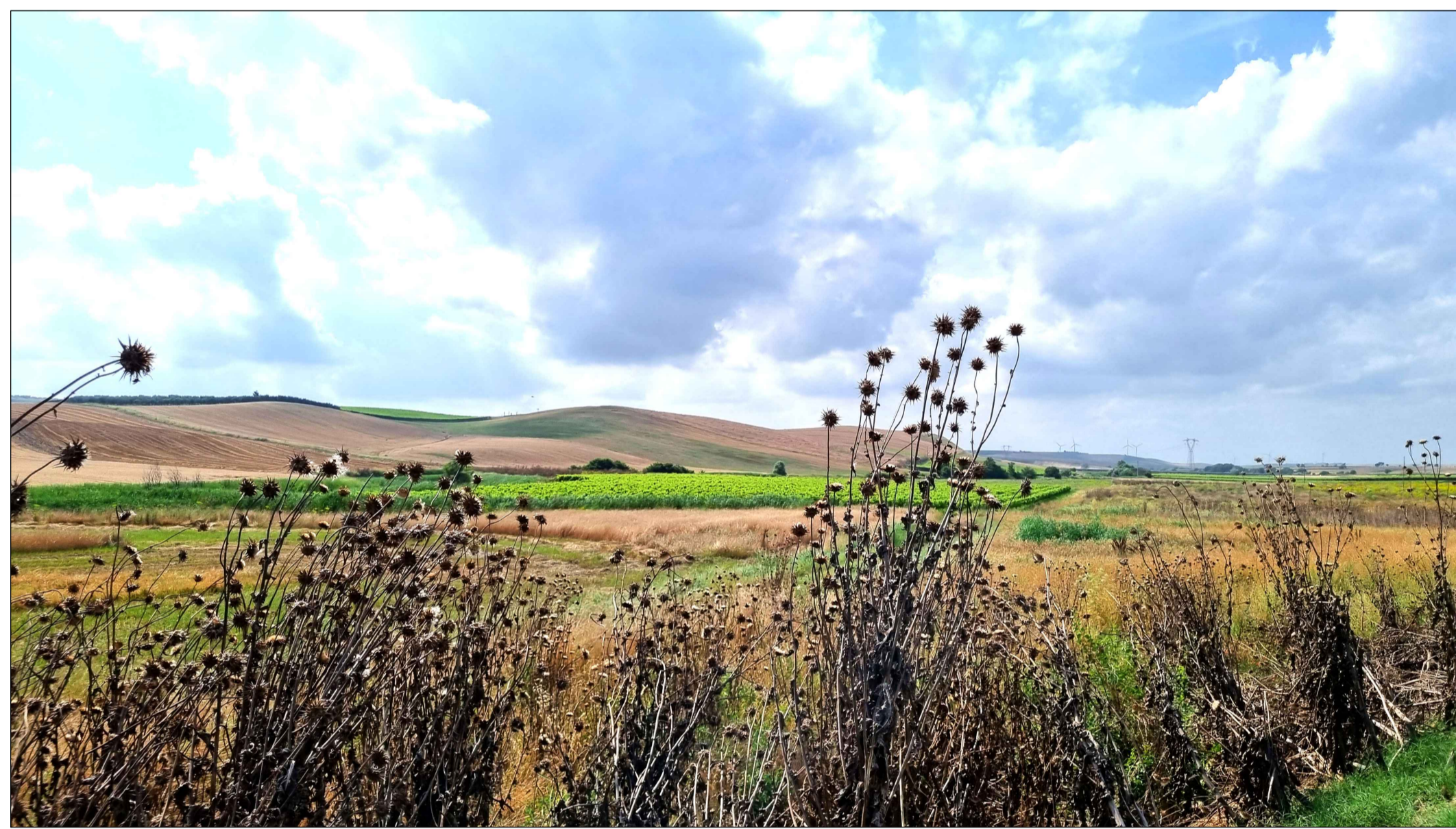
FOTOINSENERIMENTO 13 - STATO DI FATTO