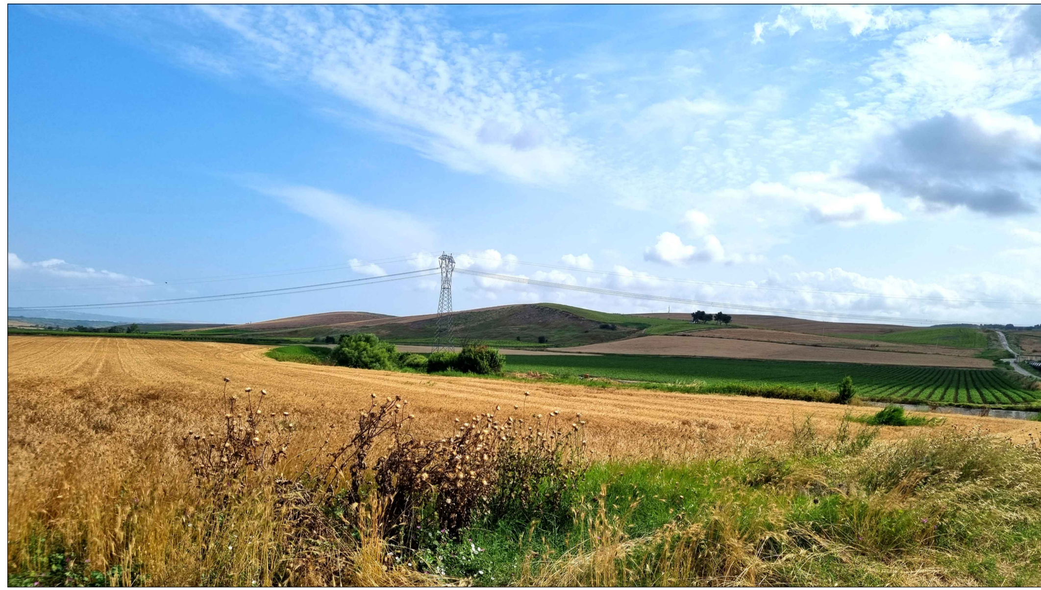
FOTOINSENERIMENTO 12 - STATO DI FATTO