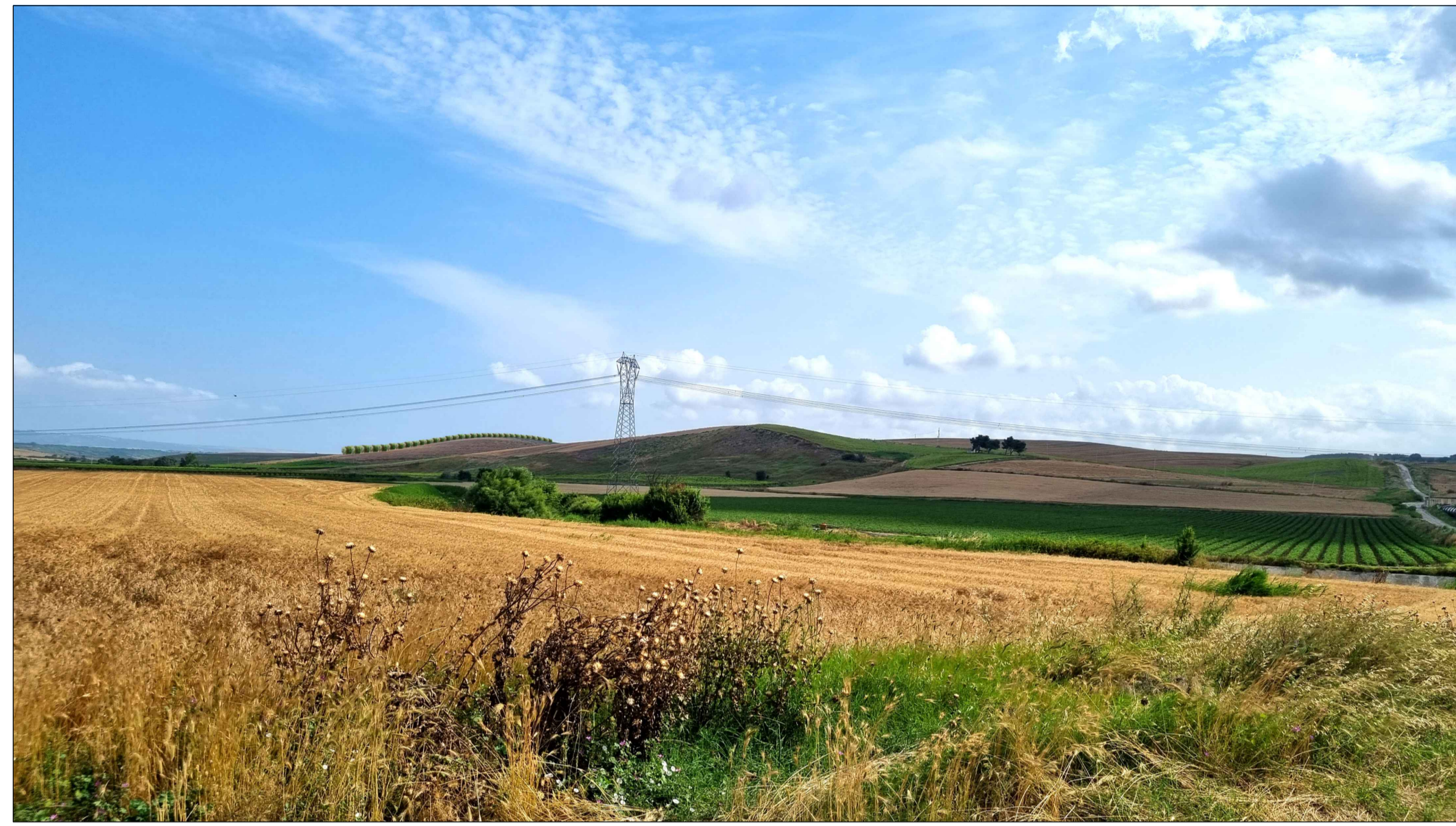
FOTOINSENERIMENTO 12 - STATO DI PROGETTO