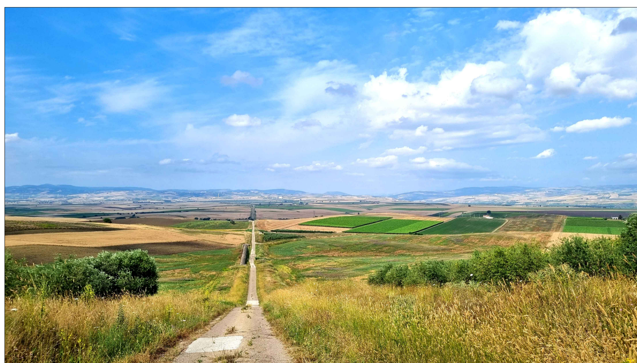
FOTOINSENERIMENTO 14 - STATO DI FATTO