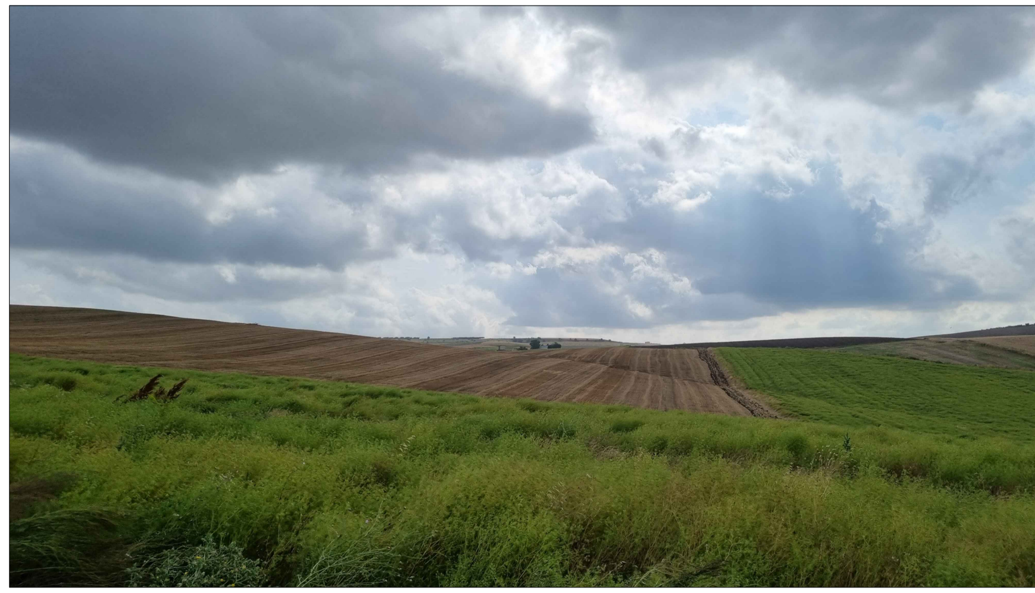
PUNTO DI PRESA FOTOGRAFICA 4