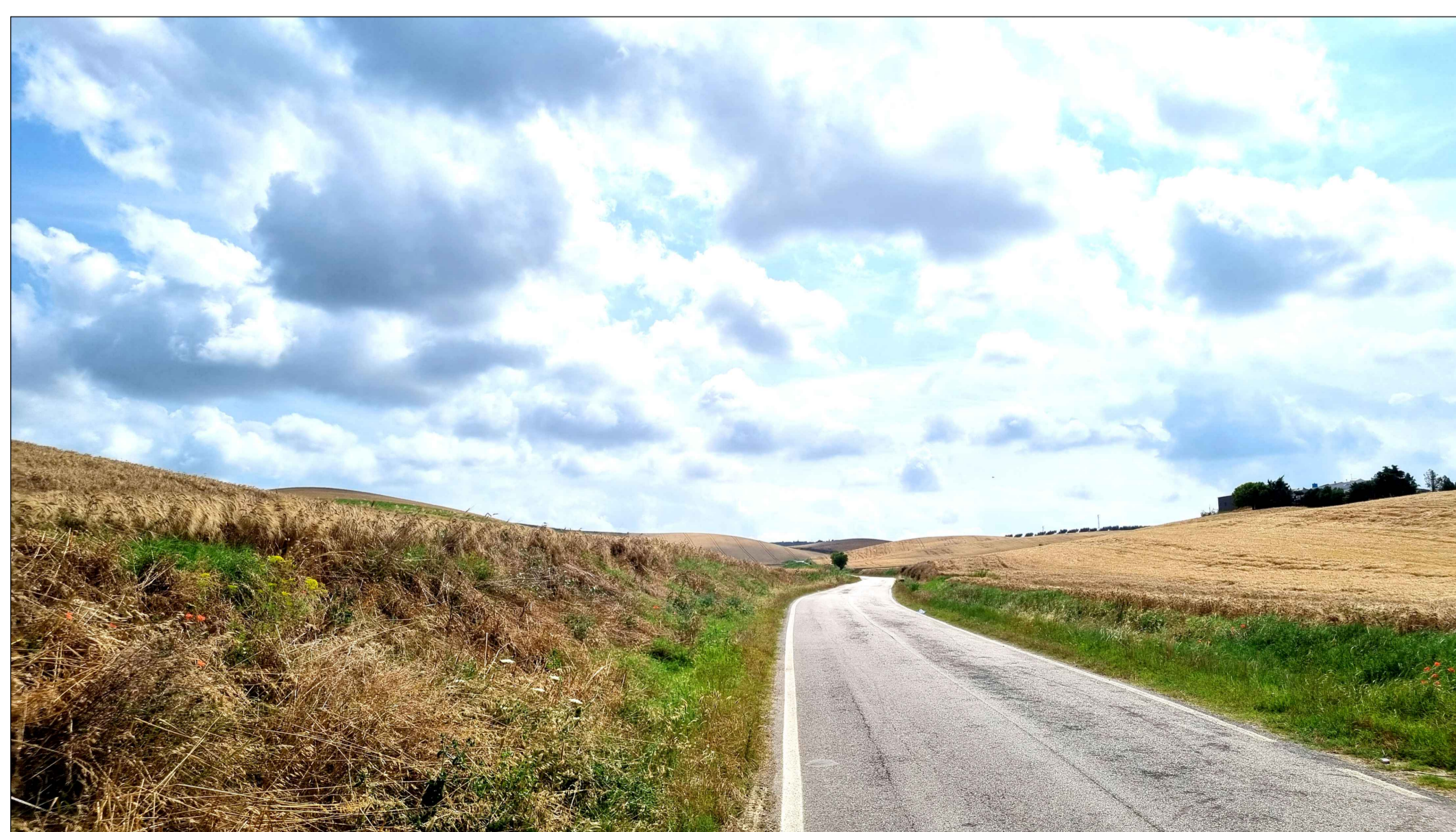
FOTOINSENERIMENTO 3 - STATO DI FATTO