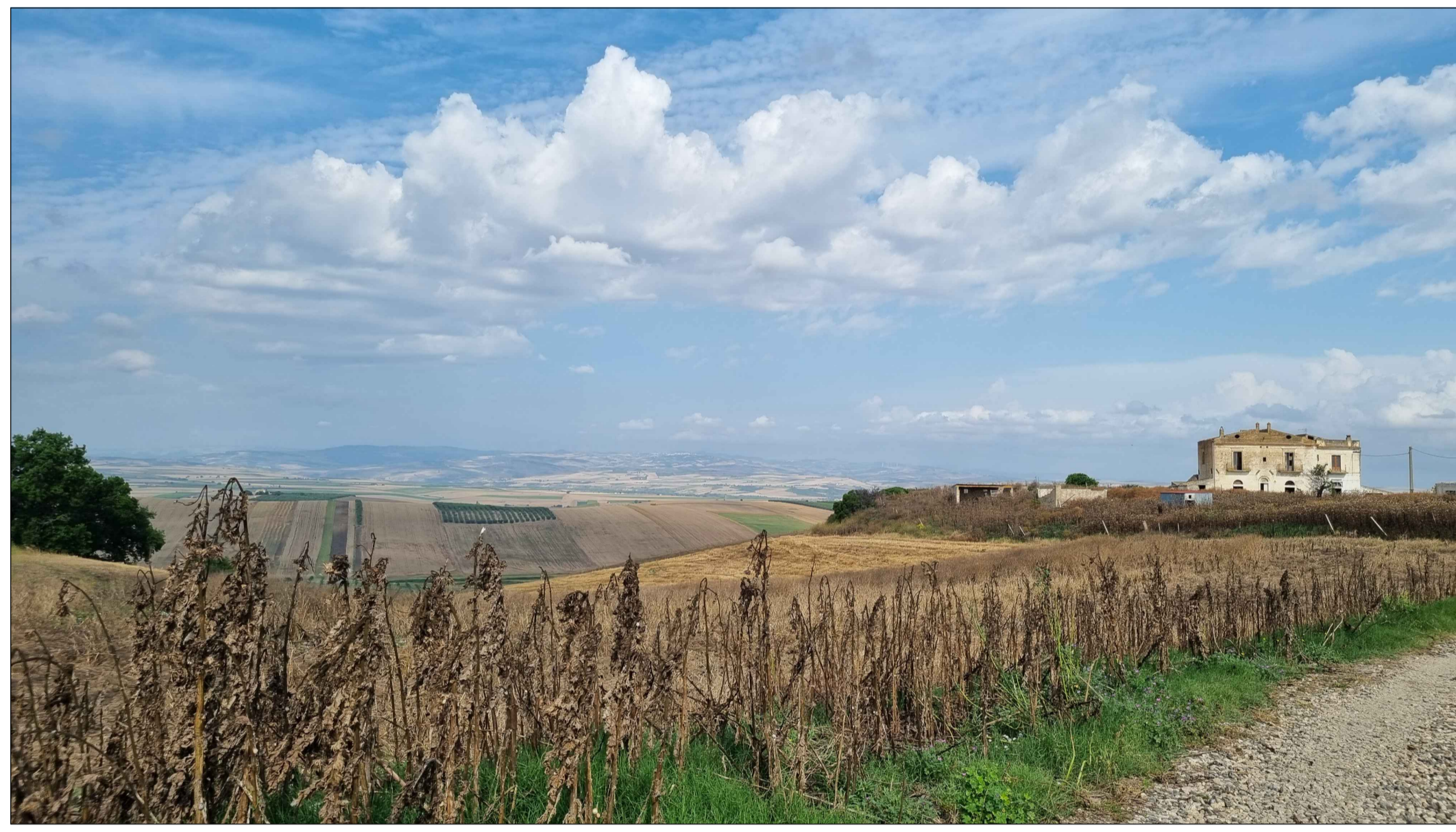
PUNTO DI PRESA FOTOGRAFICA 2