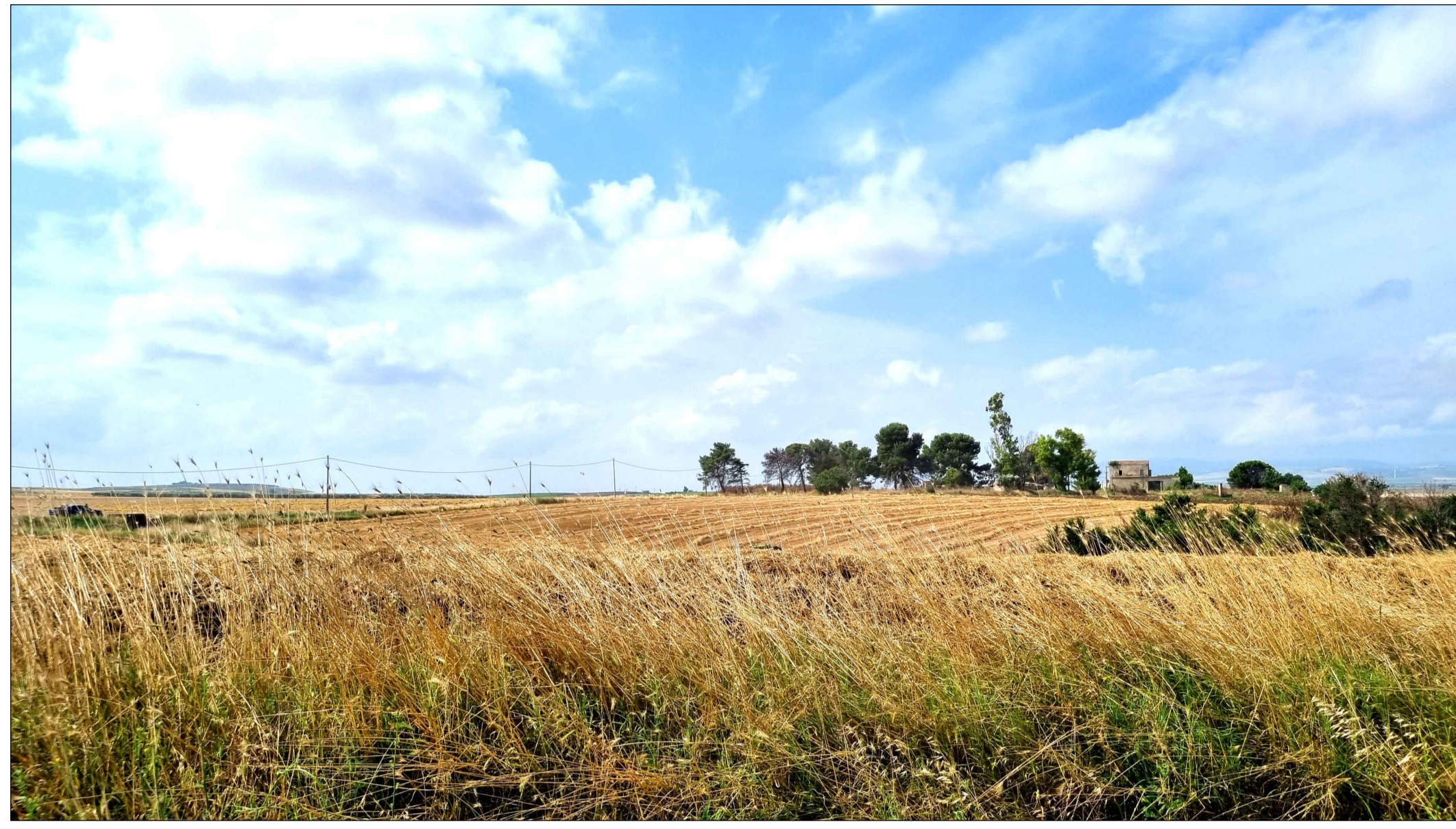
FOTOINSENERIMENTO 1 - STATO DI FATTO