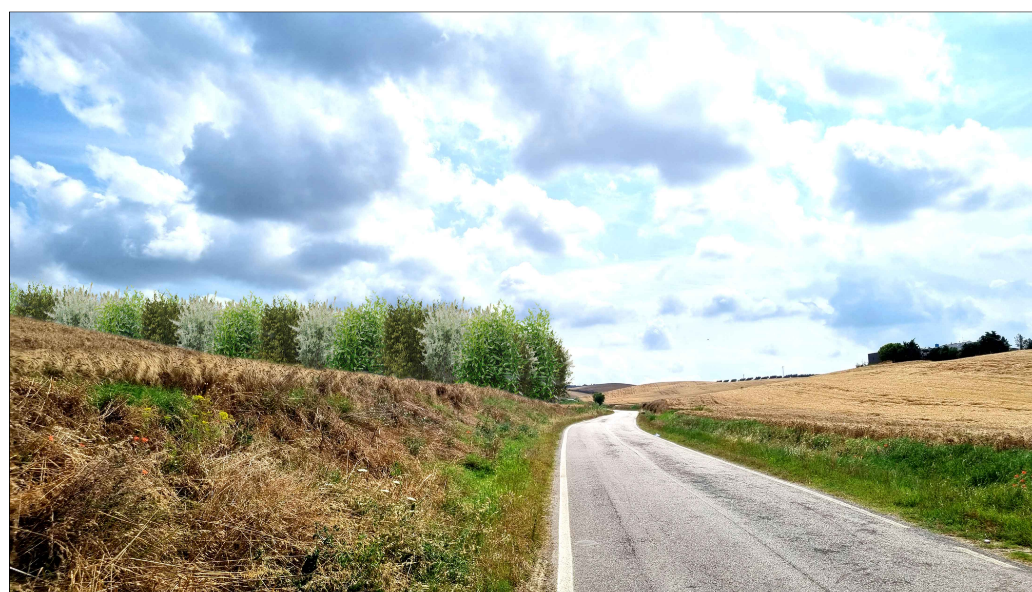
FOTOINSENERIMENTO 3 - STATO DI PROGETTO