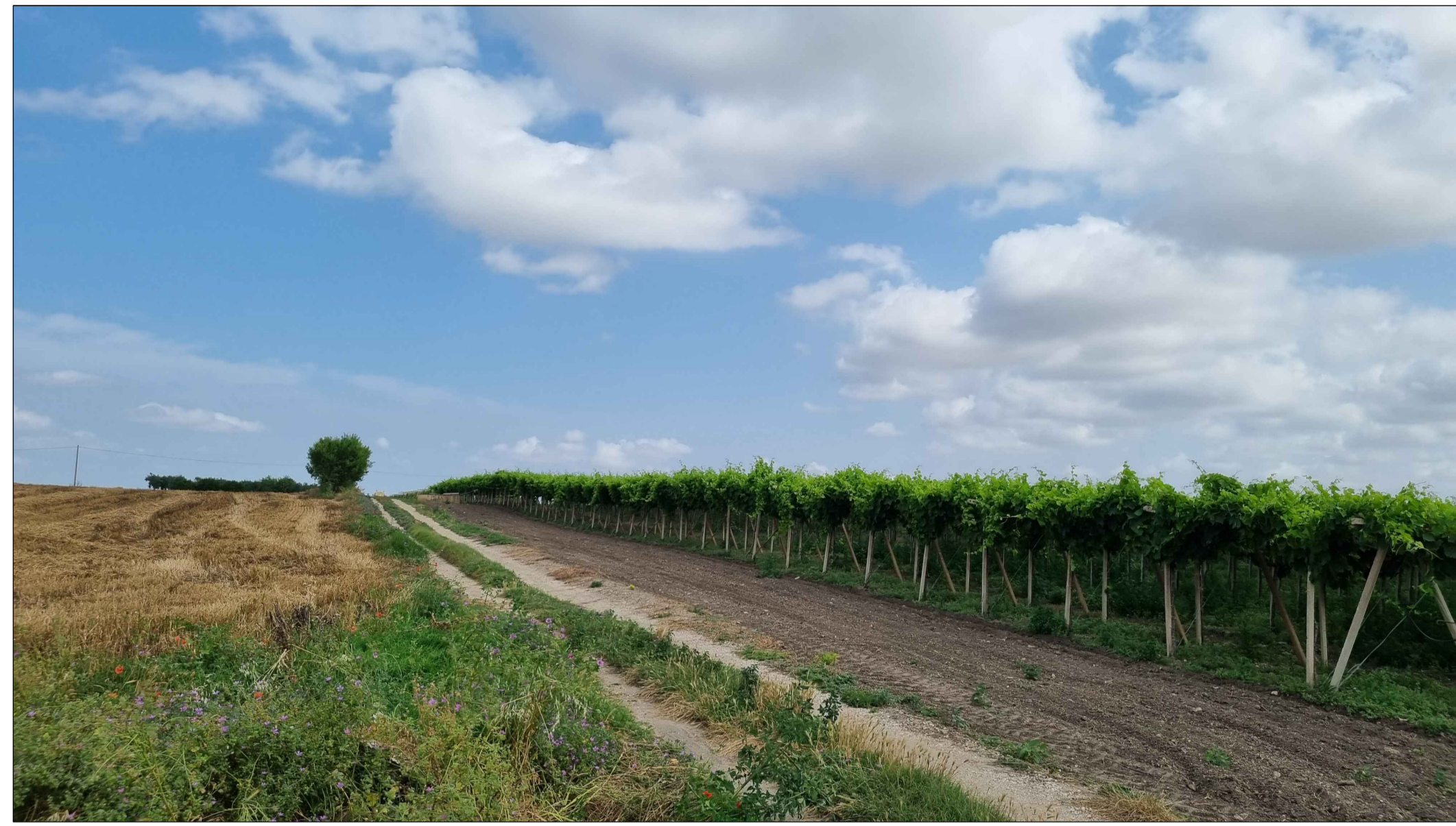
PUNTO DI PRESA FOTOGRAFICA 7