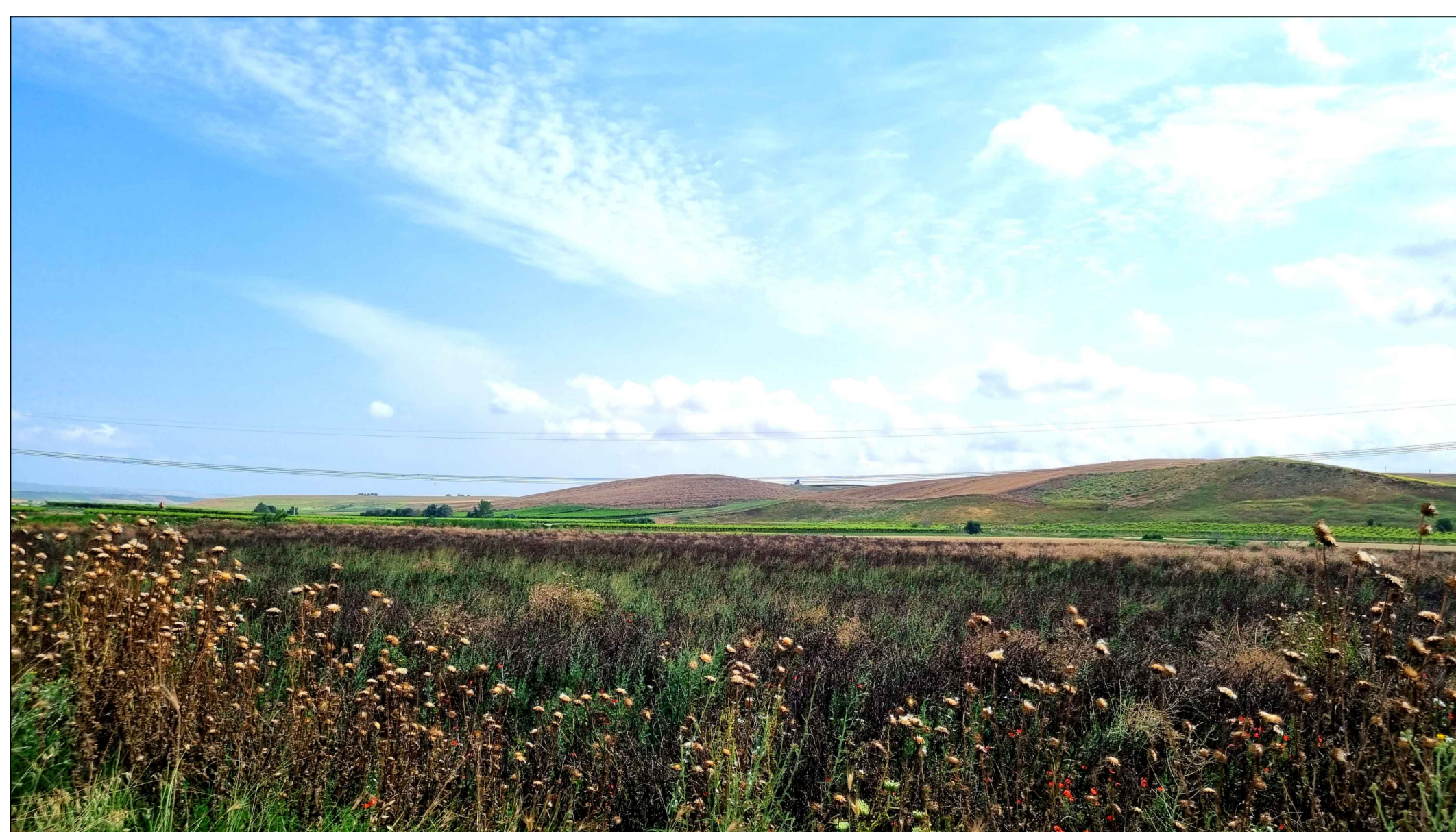
FOTOINSERIMENTO 8 - STATO DI FATTO