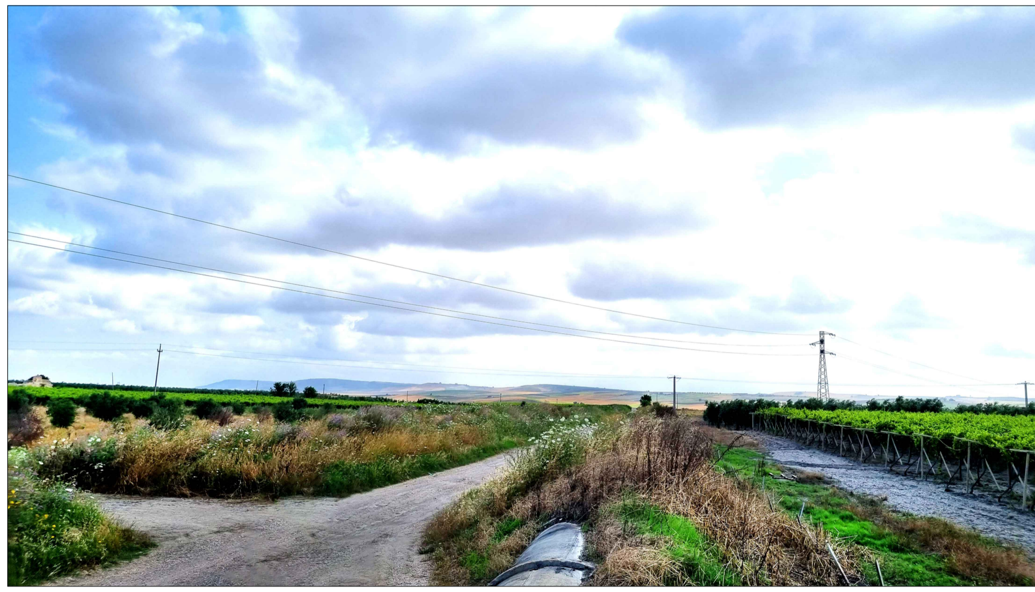
FOTOINSERIMENTO 6 - STATO DI FATTO