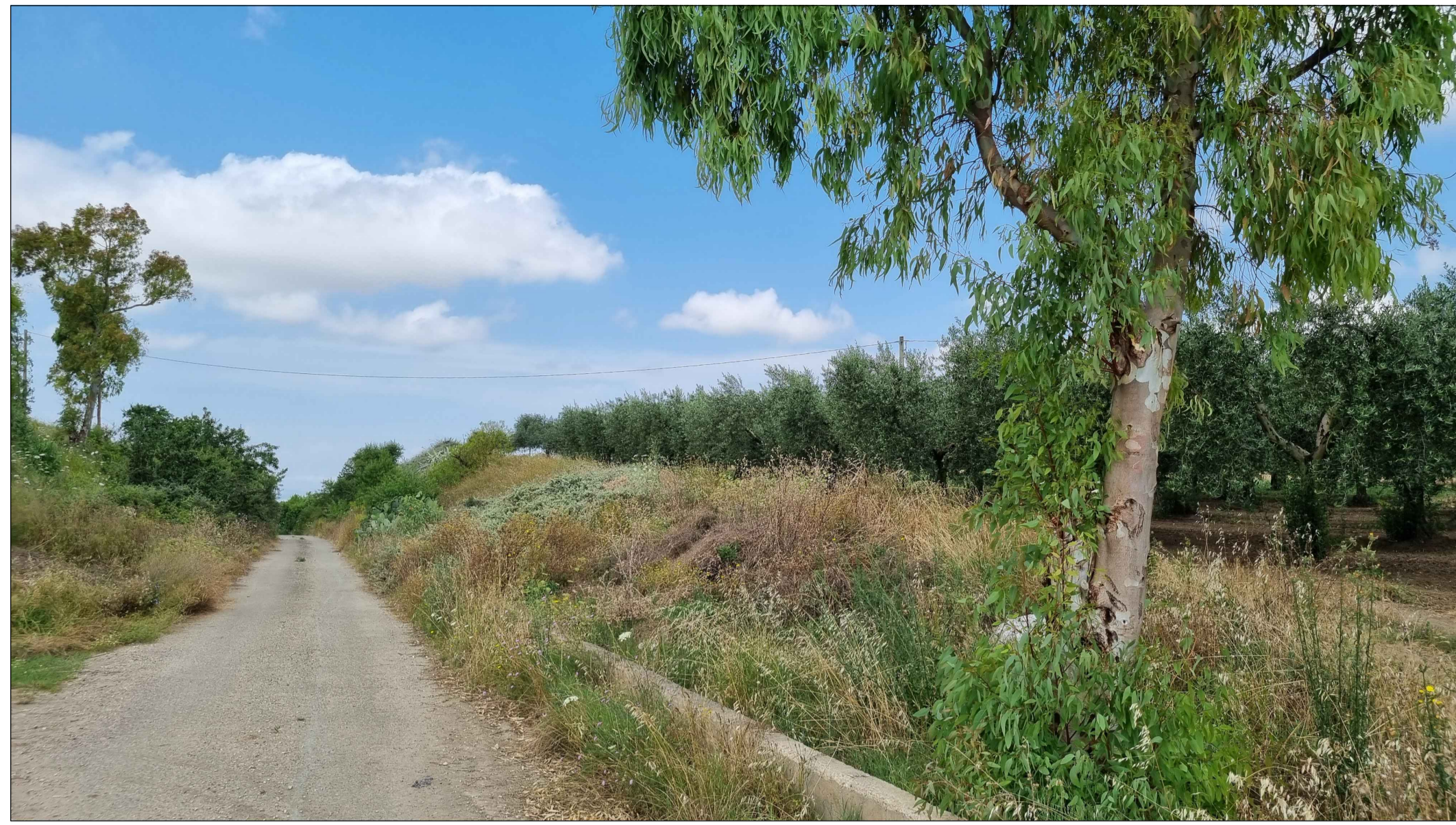
PUNTO DI PRESA FOTOGRAFICA 5