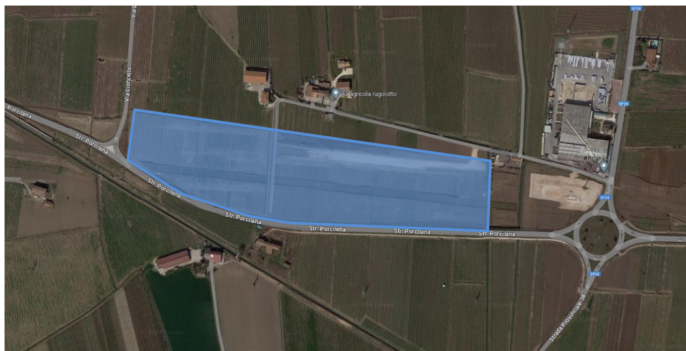
Figura 1-1 – Rappresentazione dell'area di cantiere

Il proporzionamento ed i requisiti igienico sanitari e di sicurezza posti alla base della progettazione sono in linea con gli standards previsti nelle leggi nazionali e regionali del settore: in particolare, in analogia a quanto già adottato per la realizzazione di altre tratte di alta velocità già funzionanti, sono state adottate le tipologie di campi e cantieri logistici seguendo le Linee Guida emesse dai coordinamenti Regionale quali: "NIR – Nota Interregionale redatte dalle Regioni Emilia Romagna-Toscana (fissate in occasione della realizzazione della linea AV Firenze-Bologna)" e "NIR – Conferenza delle Regioni e delle Province Autonome – Integrazione e aggiornamento".