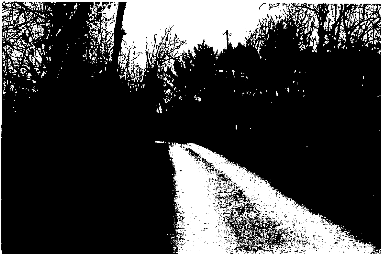
Foto - Tratto di via Pelosa in comune di Quinto di Treviso (data 16 gennaio 2014)