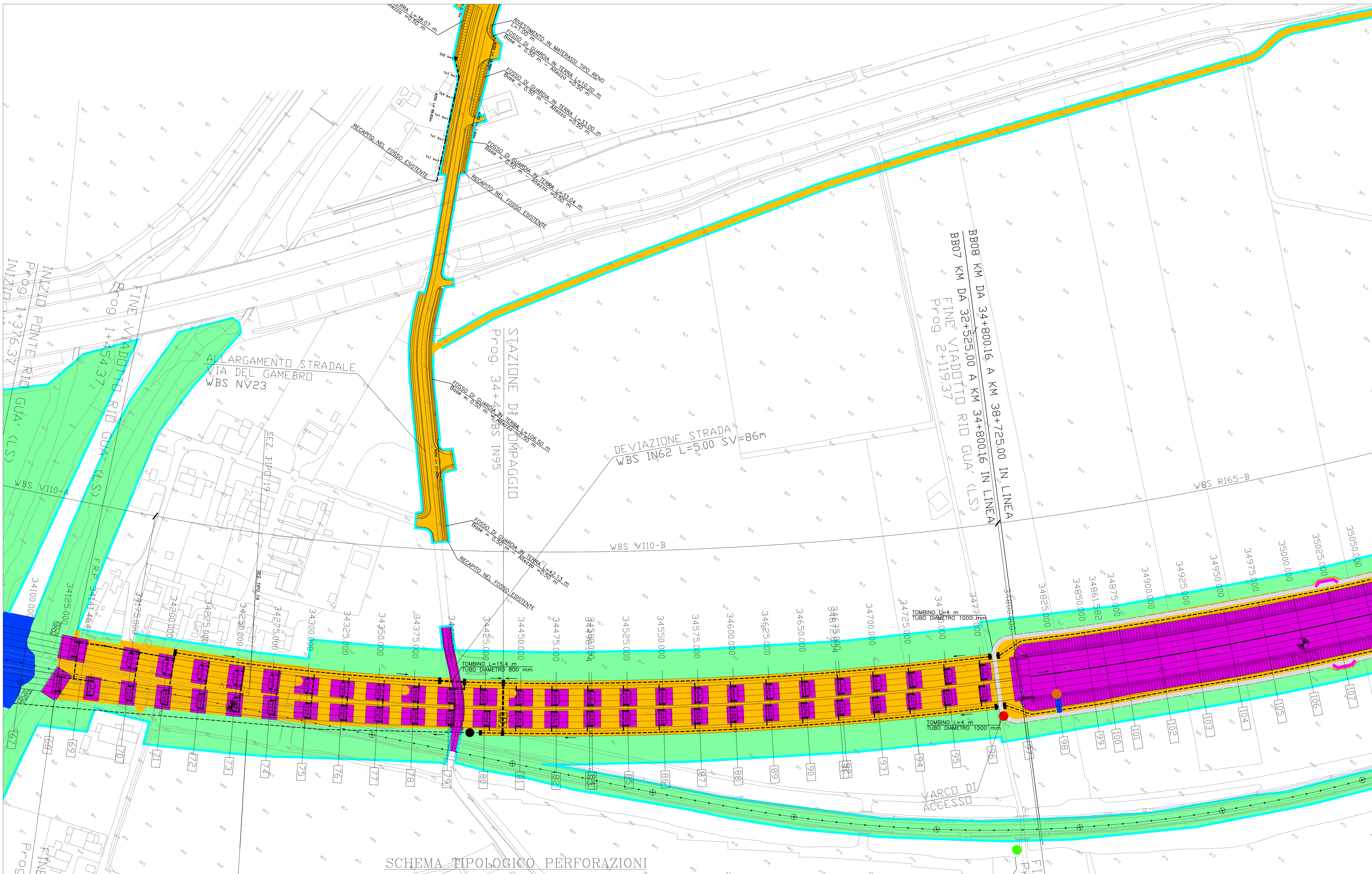
SCHEMA TIPOLOGICO PERFORAZIONI