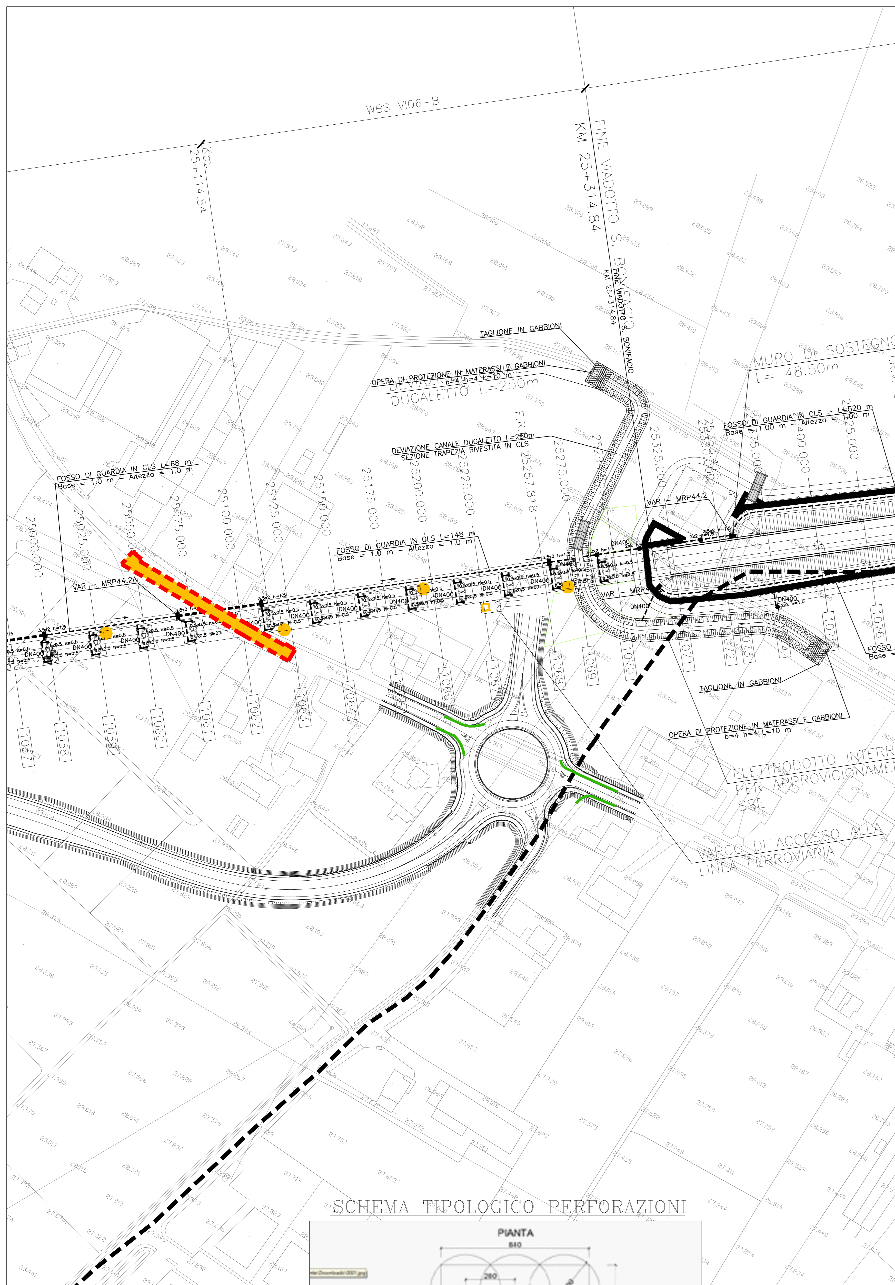
SCHEMA TIPOLOGICO PERFORAZIONI