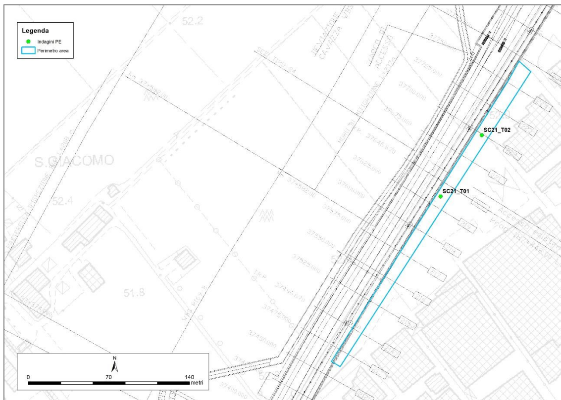
Figura 2 – Punti di indagine realizzati nella fase di Progetto Esecutivo.