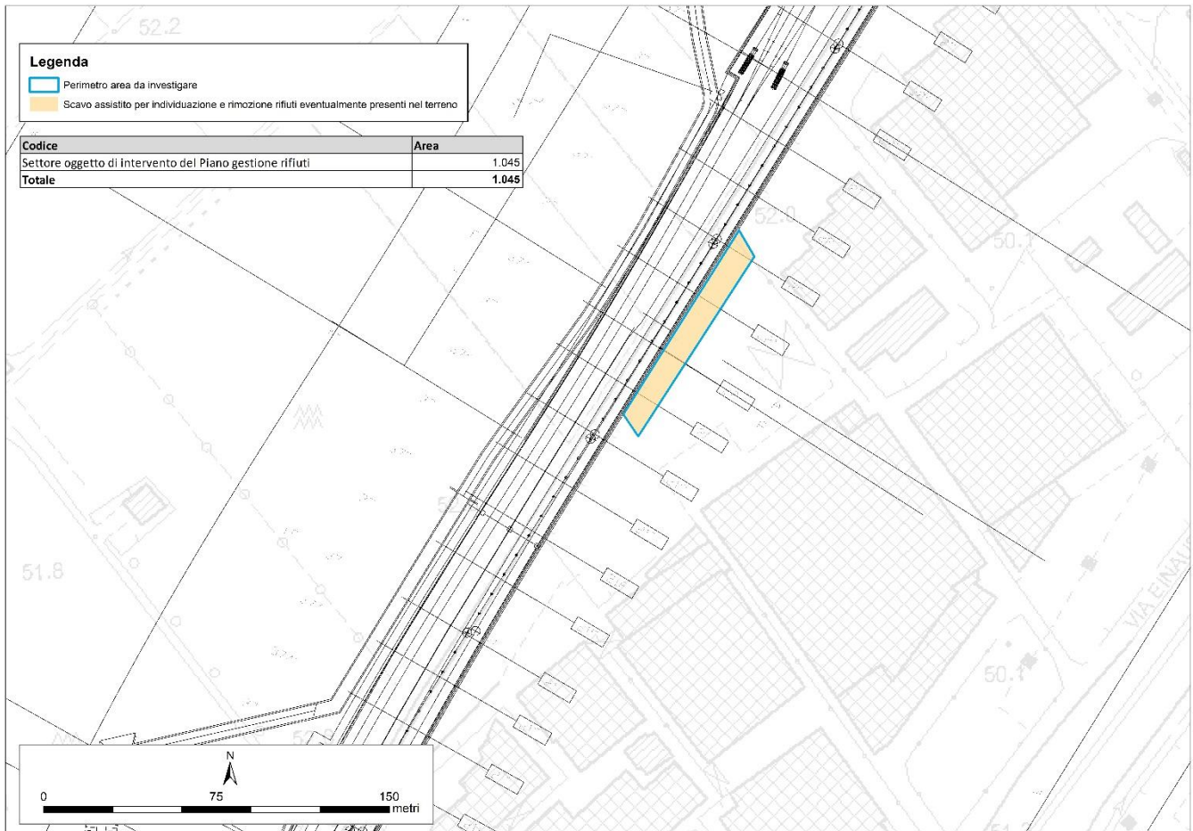
Figura 3 – Perimetrazione dei settori per le procedure di rimozione e smaltimento dei rifiuti.