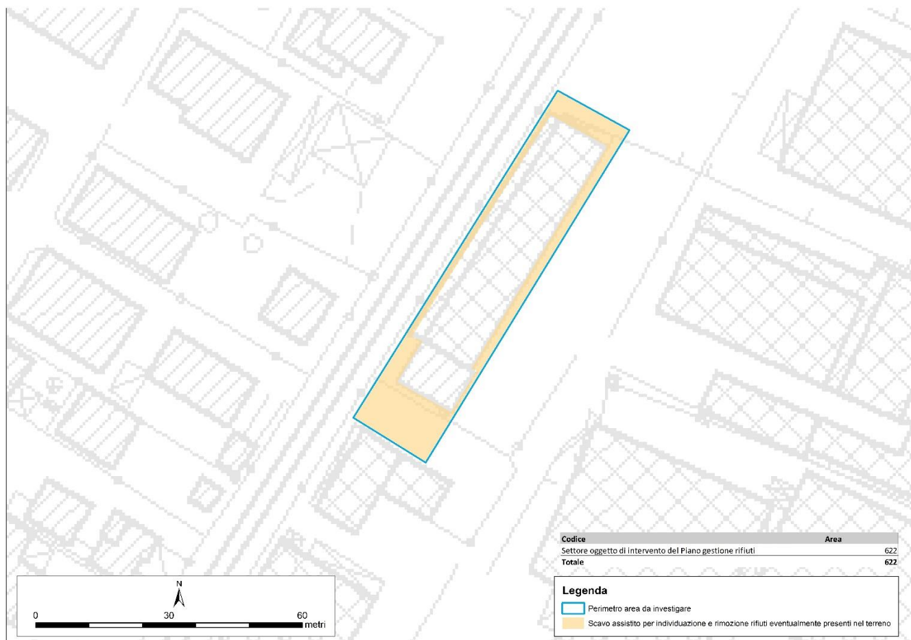
Figura 3 – Perimetrazione dei settori per le procedure di rimozione e smaltimento dei rifiuti.