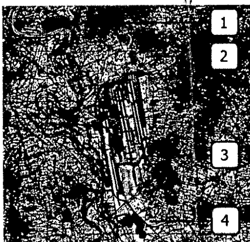
Figura 4-1 Aree di intervento per il ripristino della brughiera

Con la “Documentazione Novembre 2012” SEA propone di ricostruire la brughiera in 4 diverse zone vicine all’aeroporto identificate in Fig. 4-1