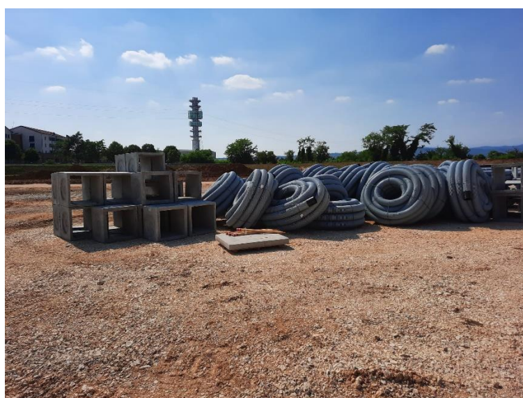
Figura 4.4 – Approvvigionamento materiali per realizzazione del Campo Base Verona est (CB 1.1)