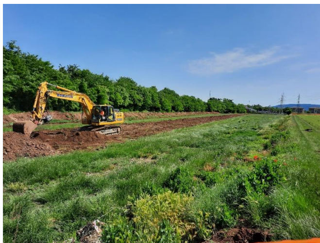
Figura 4.1 – Scavi di splateamento presso la WBS FA10- Sottostazione elettrica (pk 33+000)