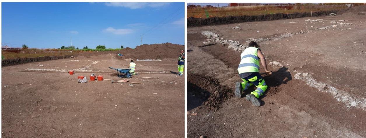
Figura 4.2 – Assistenza allo scavo di splateamento presso l'Area 14 (da pk 18+200 a pk 20+600)