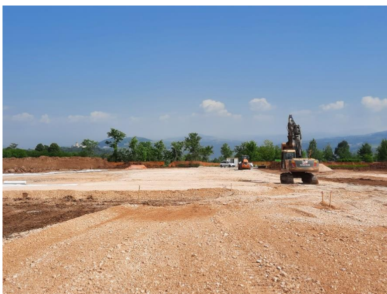
Figura 4.3 – -Realizzazione Piani posa per realizzazione del Campo Base Verona est (CB 1.1)