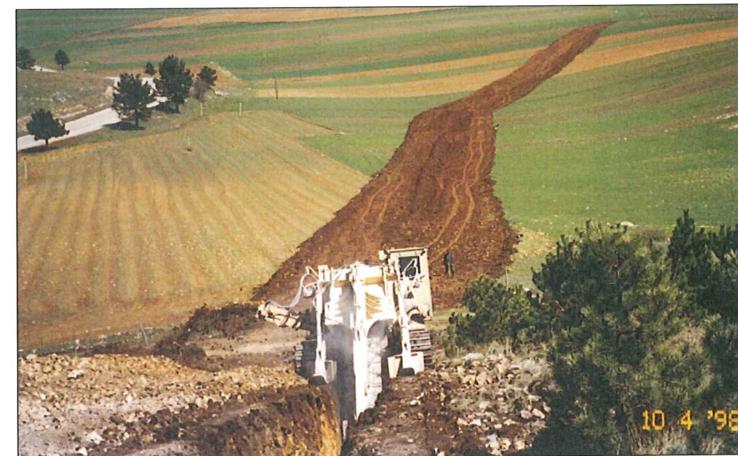
SCAVO DELLA TRINCEA