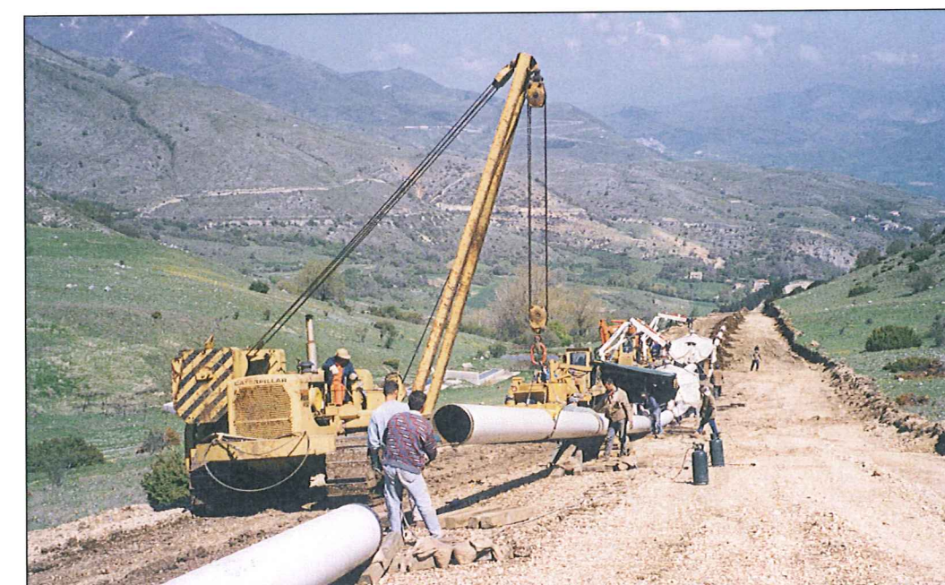
SFILAMENTO E ASSIEMAGGIO