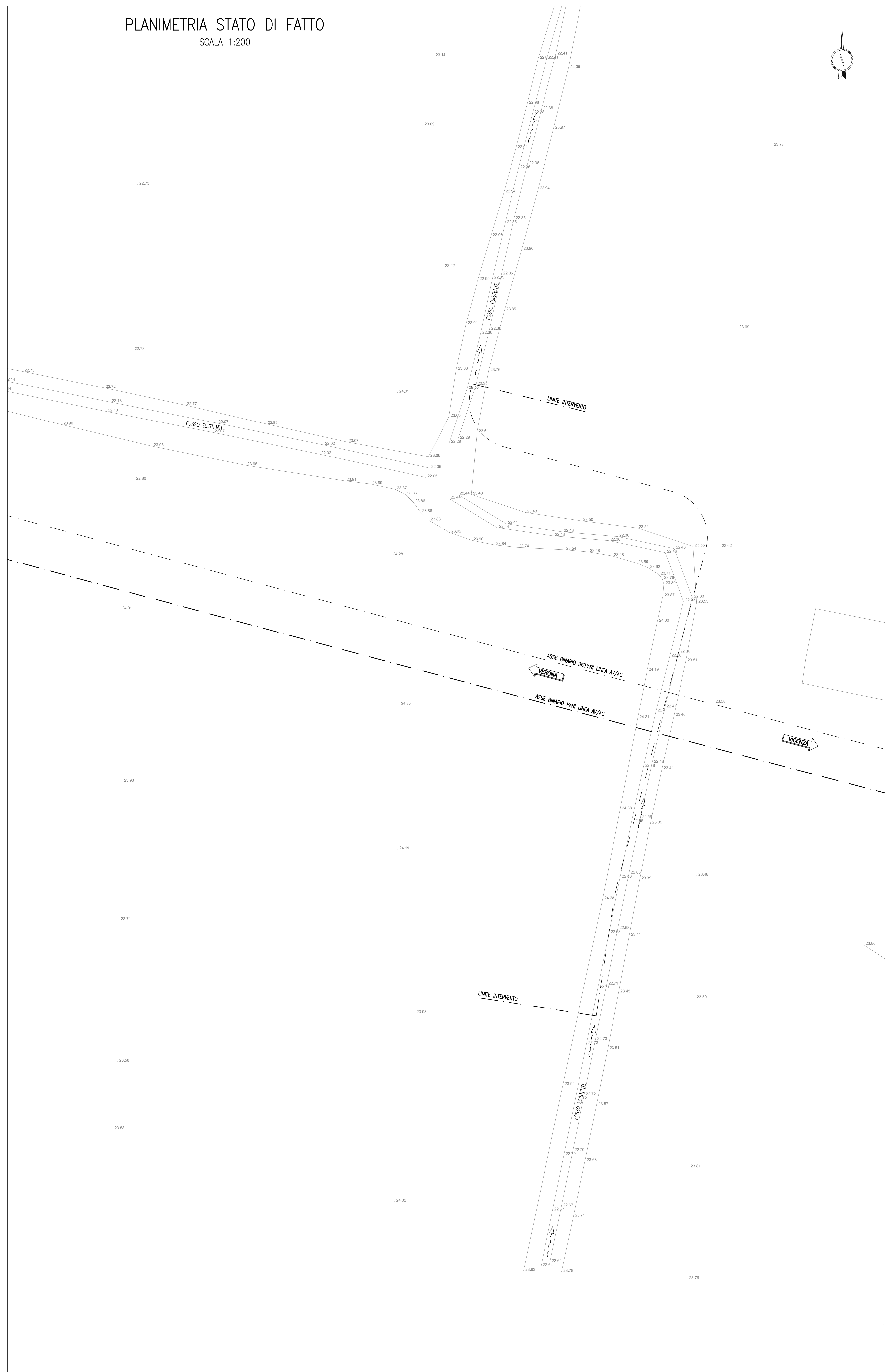
PLANIMETRIA STATO DI FATTO SCALA 1:200