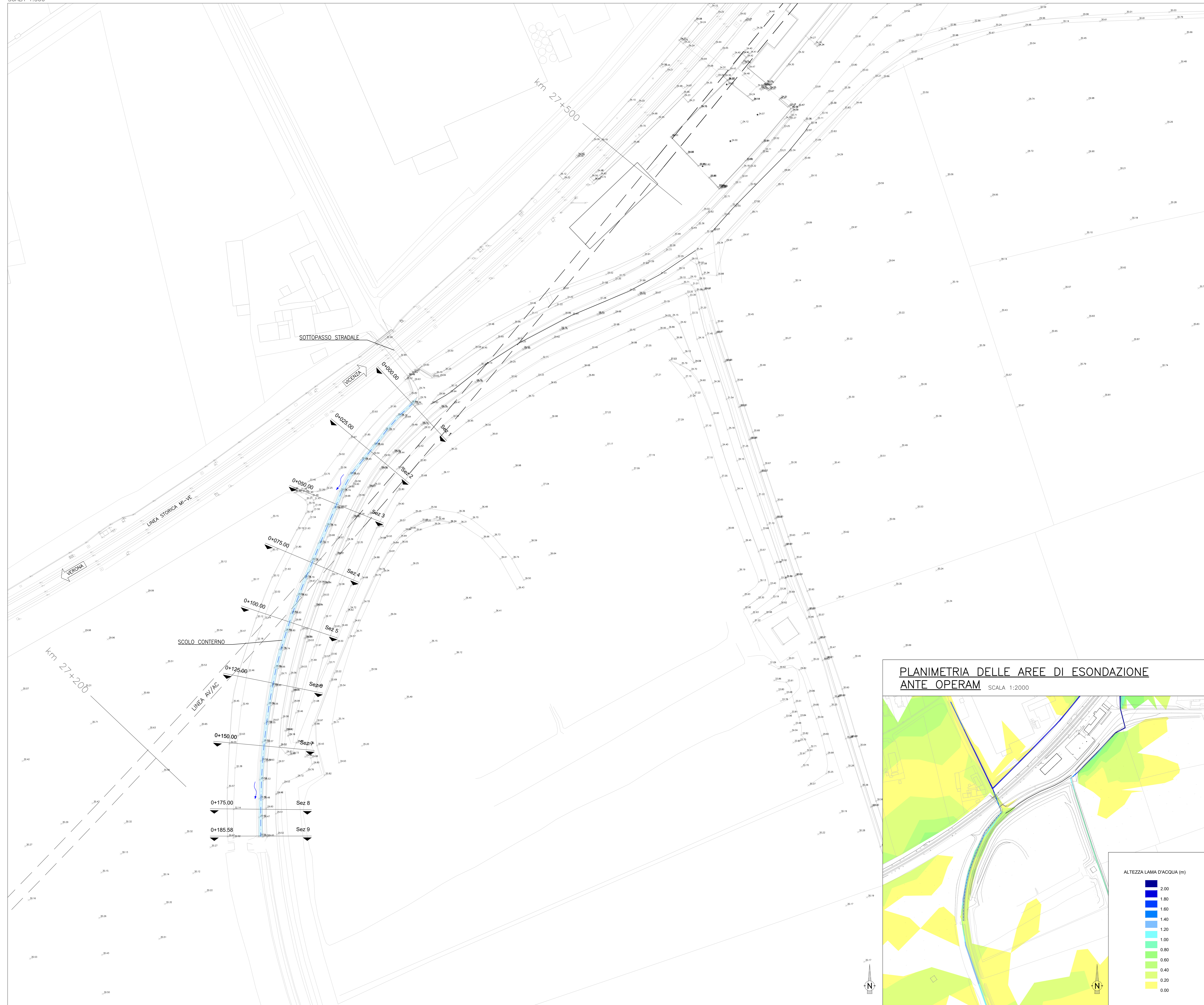
PLANIMETRIA DELLE AREE DI ESONDAZIONE ANTE OPERAM SCALA 1:2000