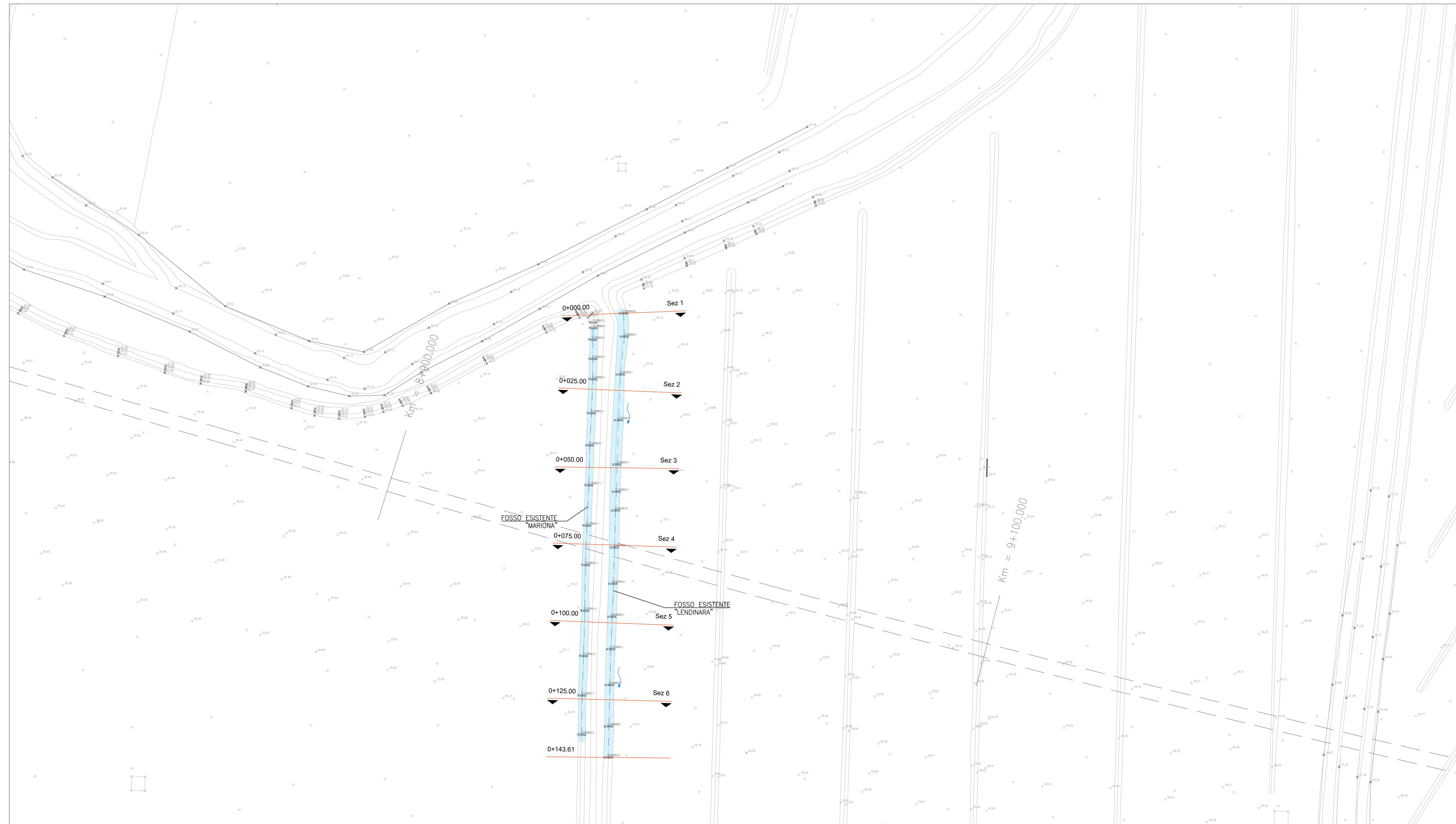
PLANIMETRIA DELLE AREE DI ESONDAZIONE ANTE OPERAM SCALA 1:2000