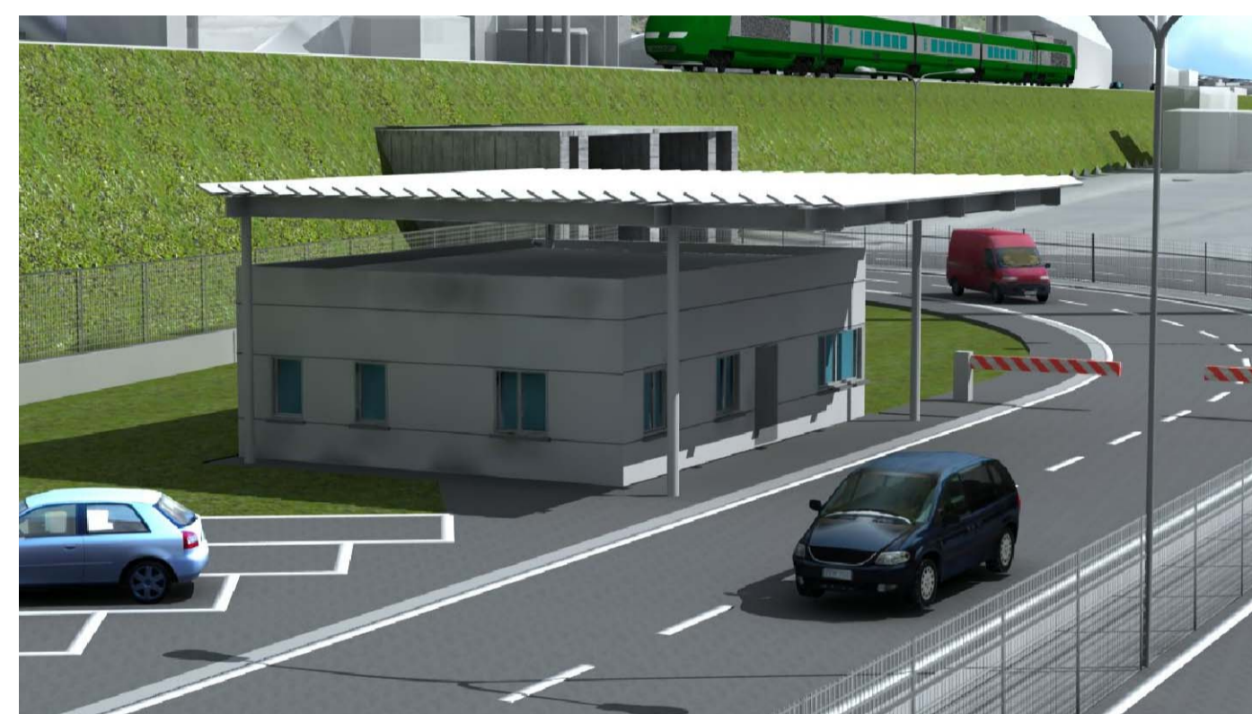
VISTA 2 - POSTO DI GUARDIA