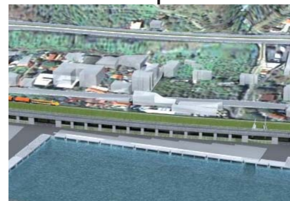
Strutture di banchina (su diaframmi) Elaborato n. N002