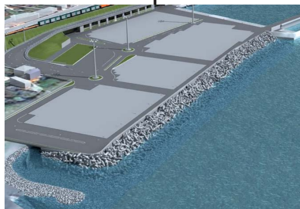
Opere a scogliera Area Sud Elaborato n. N006