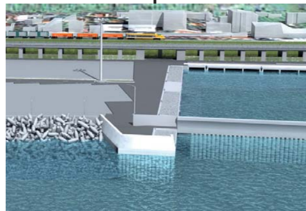
Strutture di banchina (su pali) Sperone Elaborato n. N004