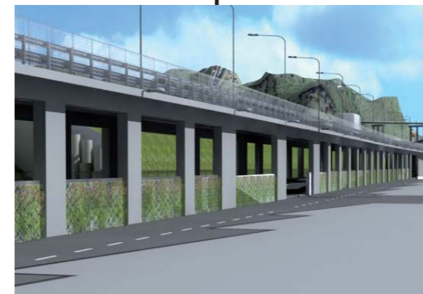
Impalcato di accesso Elaborato n. N007