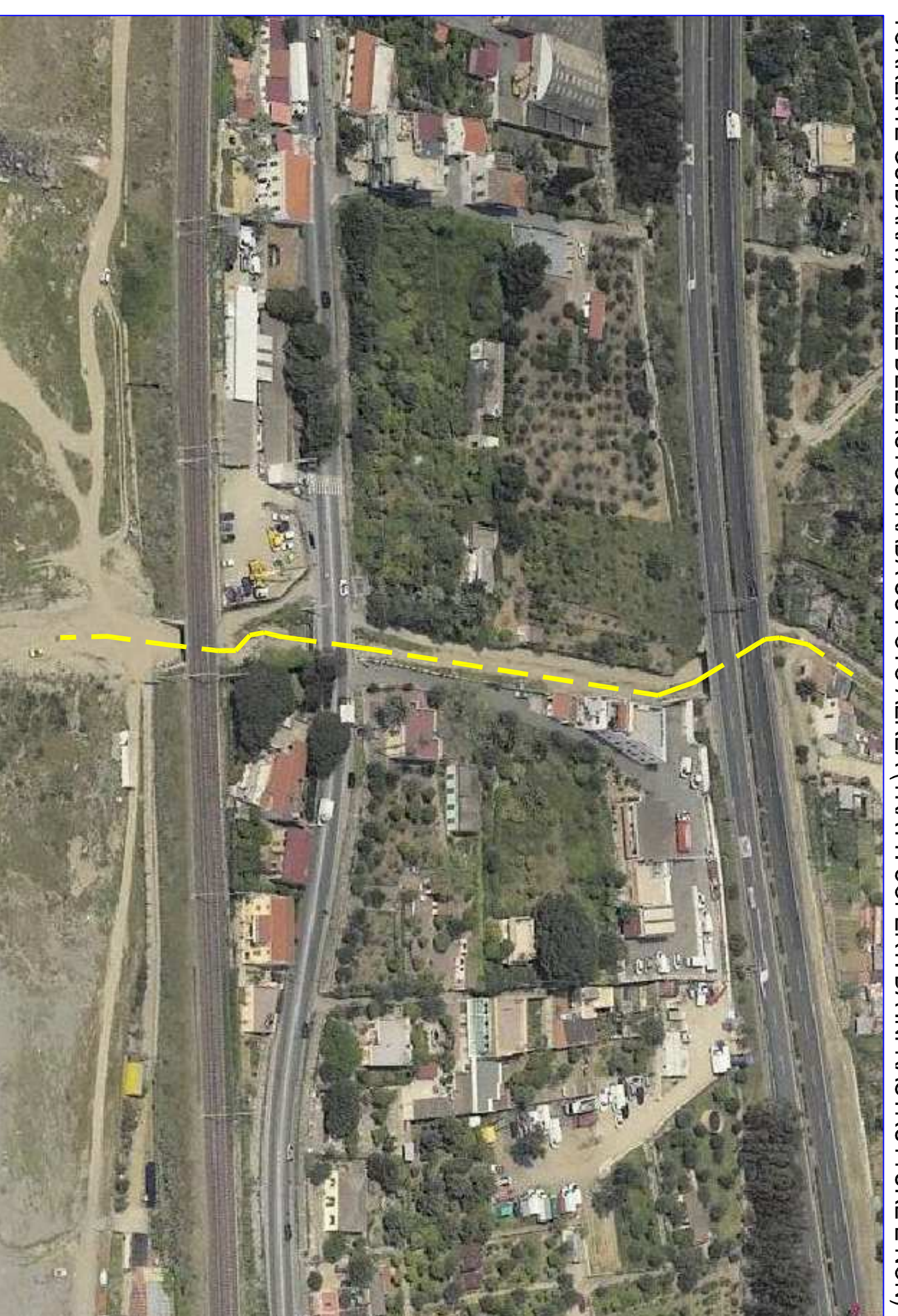
TORRENTE GUIDARA A VALLE DELL'AUTOSTRADA SU FOTO AEREA (TRATTI COPERTI DA INFRASTRUTTURE E NON)