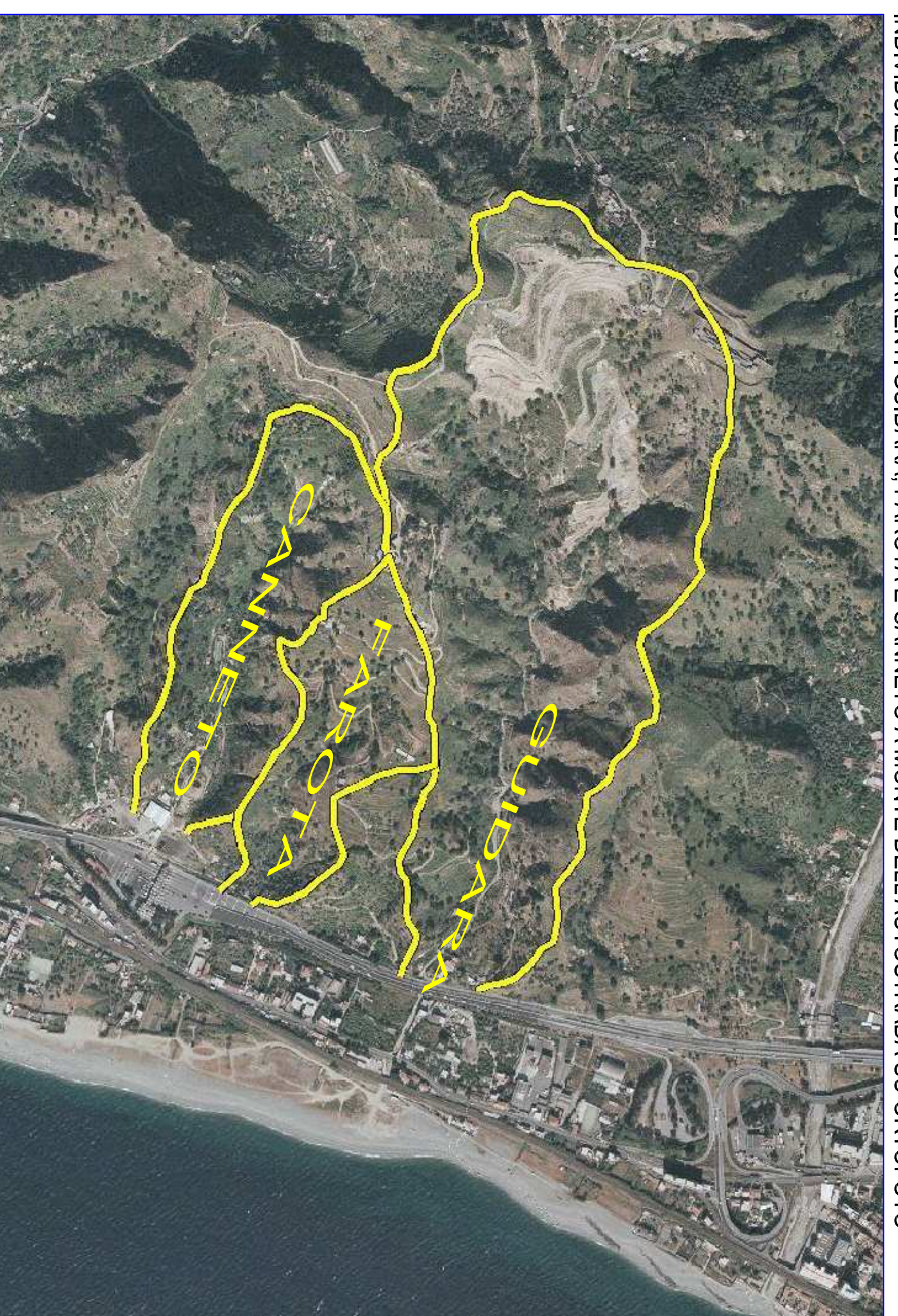
INDIVIDUAZIONE DEI TORRENTI GUIDARA, FAROTA E CANNETO A MONTE DELL'AUTOSTRADA SU ORTOFOTO