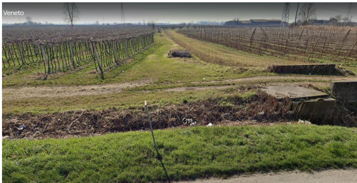
Vista pozzetti della diramazione canale Maestro a sud della Strada Porcilana

L'intervento in oggetto prevede la demolizione del tratto intubato interferente con il rilevato della linea AV/AC, a partire dal ciglio lato Nord della Strada Porcilana e per una lunghezza di circa 50m.