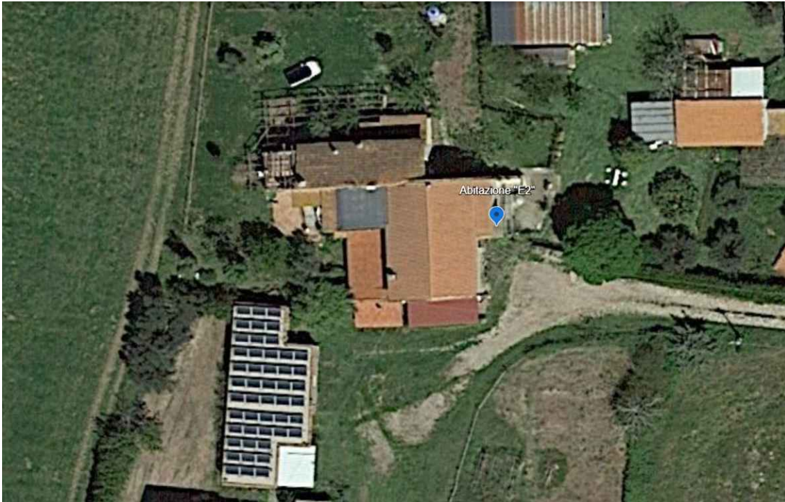
Particolare vista zenitale punto di scatto fotografico E2 - Coordinate: Lat. 42°27'45.53"N – Long. 11°50'50.06"E