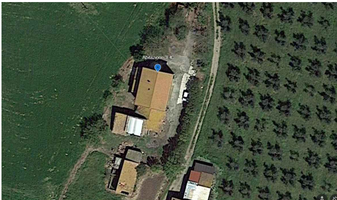
Particolare vista zenitale punto di scatto fotografico E4 - Coordinate: Lat. 42°27'37.74"N – 11°51'9.91"E