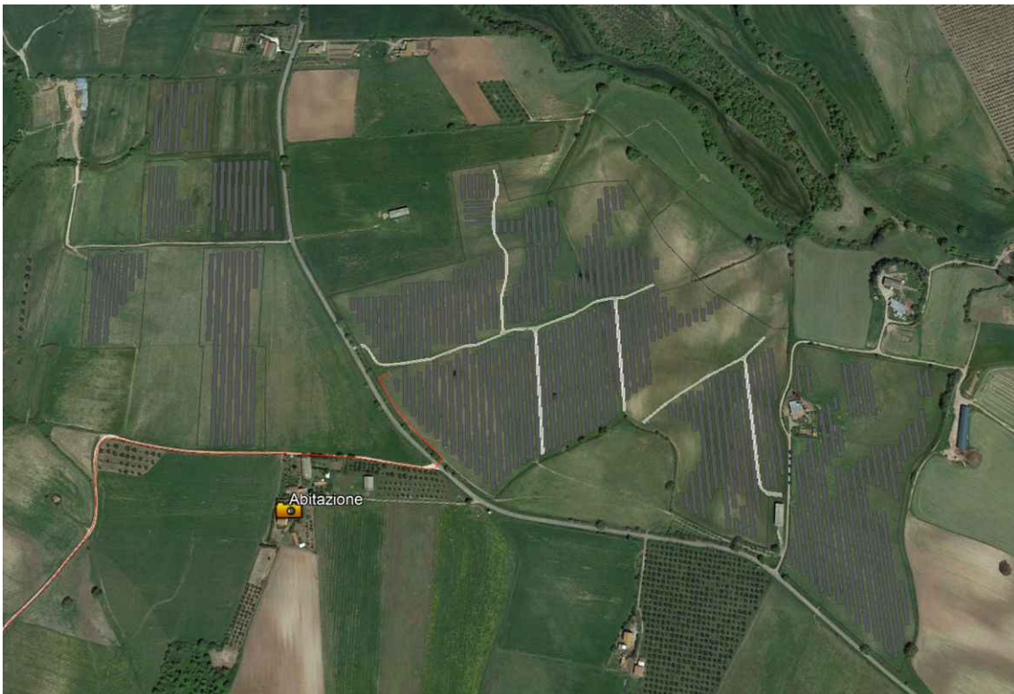
Vista zenitale punto di scatto fotografico E1 - Coordinate: Lat. 42°27'44.00"N– Long. 11°50'49.23"E