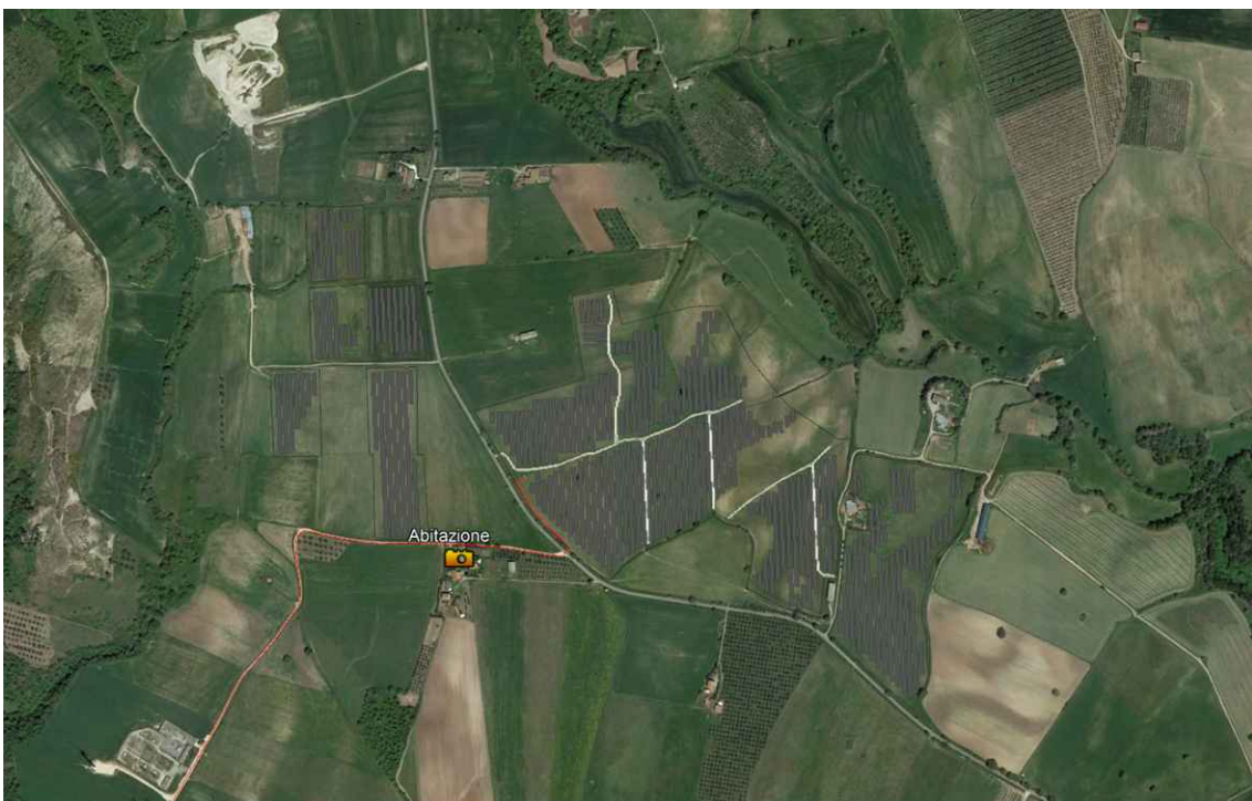
Vista zenitale punto di scatto fotografico E2 - Coordinate: Lat. 42°27'45.53"N – Long. 11°50'50.06"E