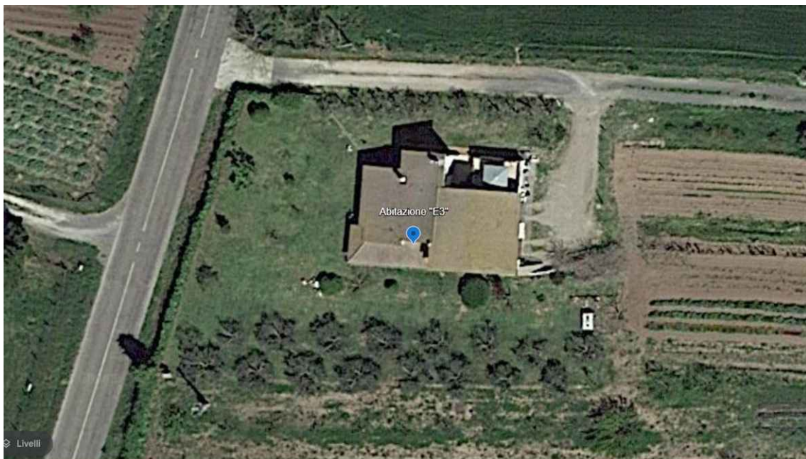
Particolare vista zenitale punto di scatto fotografico E3 - Coordinate: 42°28'9.12"N– Long. 11°50'51.85"E