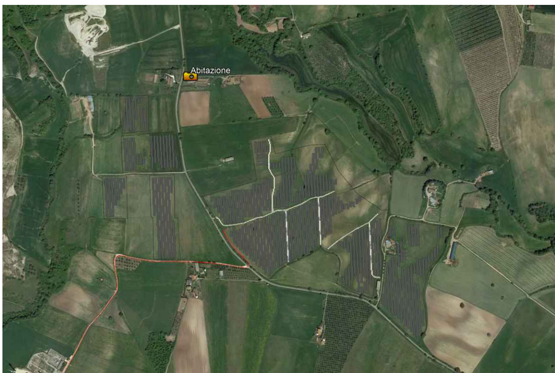
Vista zenitale punto di scatto fotografico E3 - Coordinate: 42°28'9.12"N– Long. 11°50'51.85"E