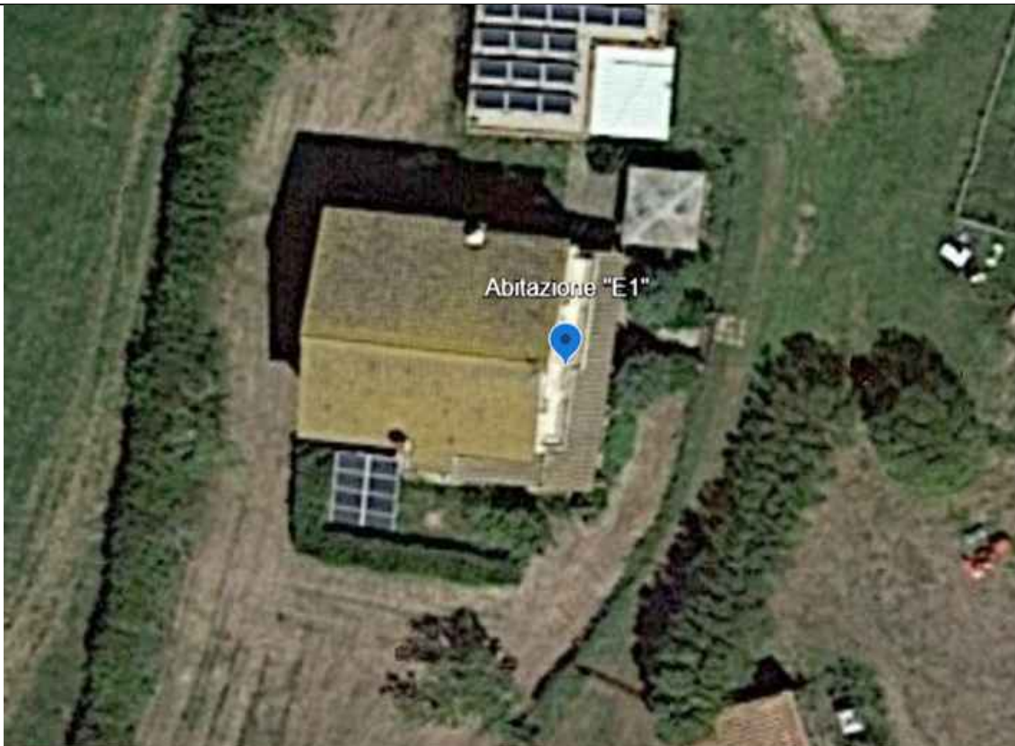
Particolare vista zenitale punto di scatto fotografico E1 - Coordinate: Lat. 42°27'44.00"N– Long. 11°50'49.23"E