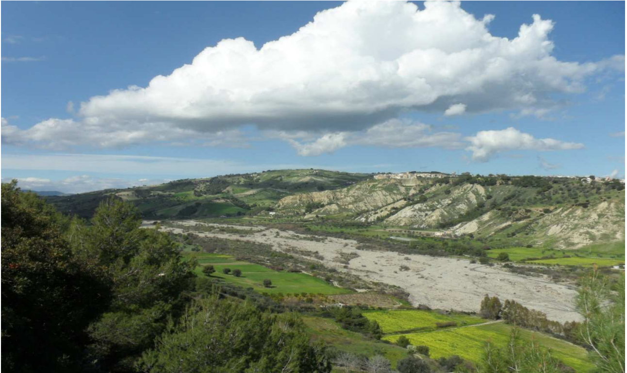
Fiumara Straface: prog. Def. viadotto lung 686 m h 56 m -prog. Prelim.viadotto lung 454 m h 14 m