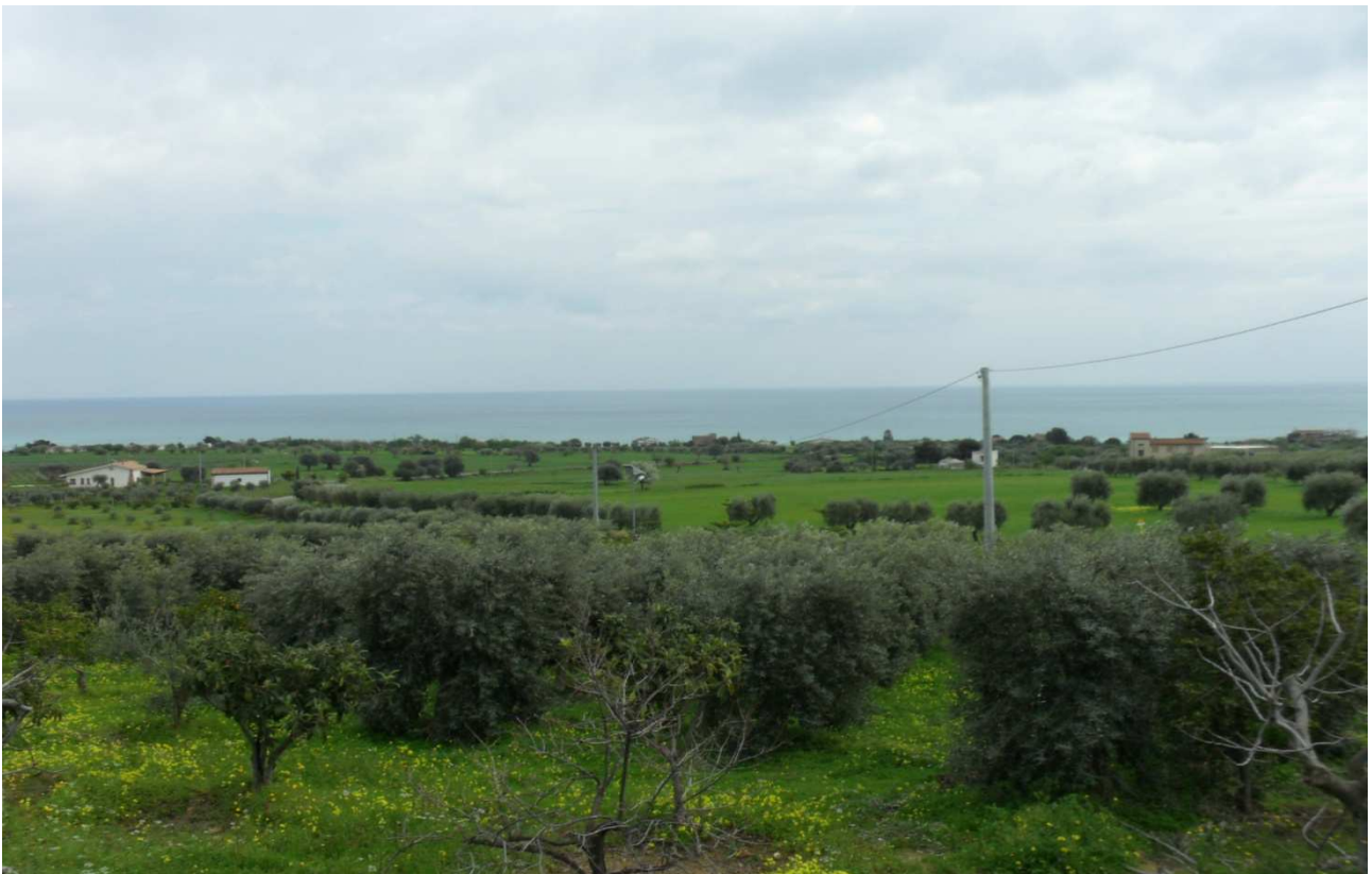
C.da Lista: prog. Def. tratto in superficie lung 1452 m -prog. Prelim. Galleria naturale lung 680m + Svincolo Amendolara (soppresso su richiesta comune di Amendolara Delibera Cons Com n° 10 del 28/07/04)