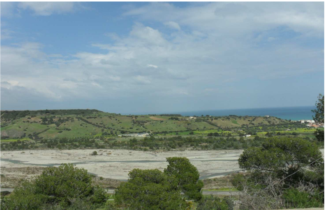
Fiume Ferro: prog. Def. viadotto lung 537 m h 31 m - prog. Prelim. viadotto lung 548 m h 13 m