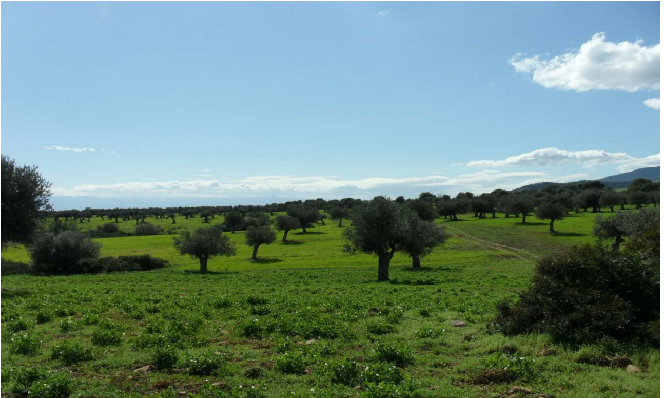
Celogreco (uliveti secolari): prog. Def.galleria artif e in superficie -prog. Prelim. tutto in galleria naturale