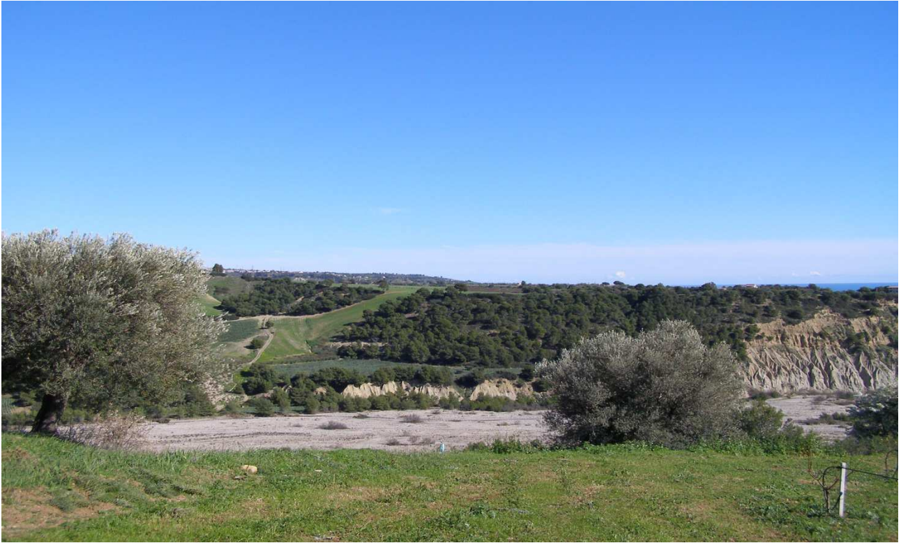
Torrente Avena: prog. Def. viadotto lung 695 m h 84 m - prog. Prelim. viadotto lung 362 m h 18 m