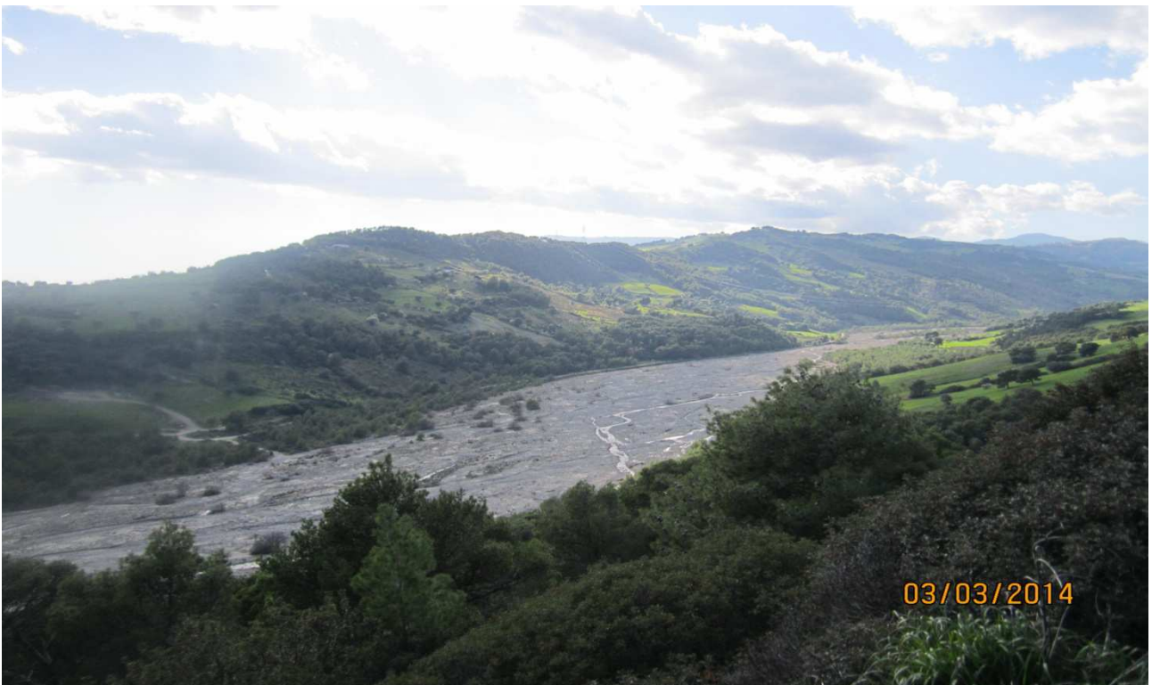
Torrente Avena: prog. Def. Viadotto lung 695 m h 84 m -prog. Prelim. viadotto lung 362 m h 18 m