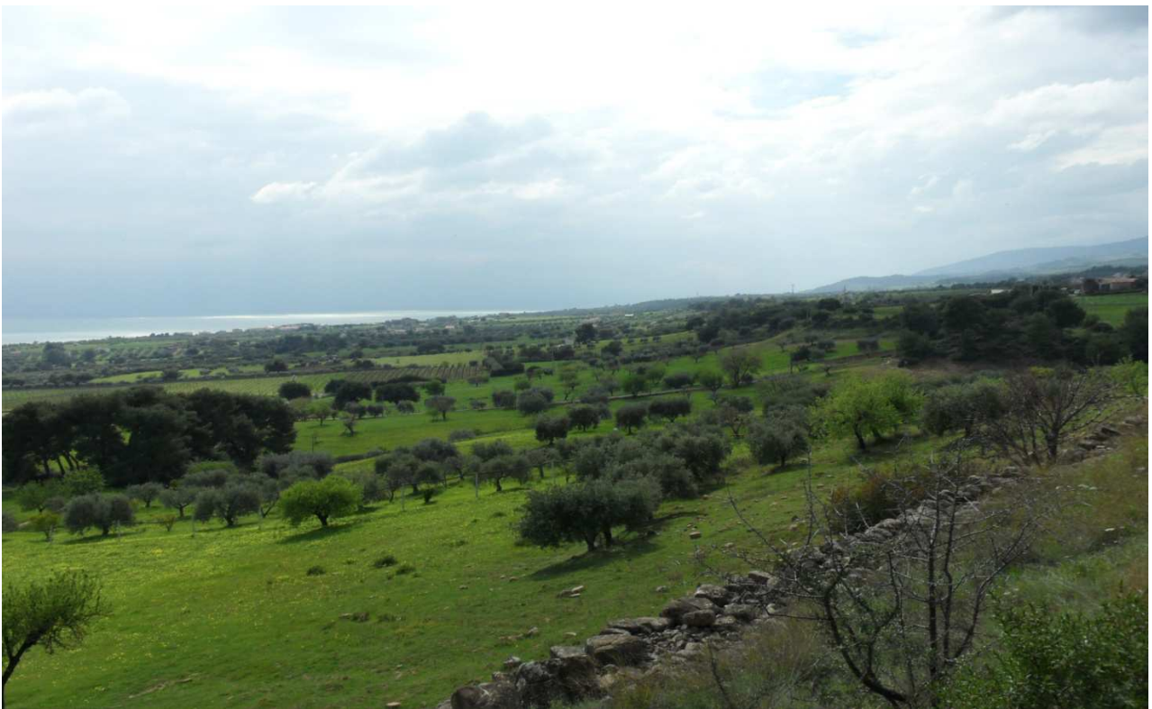
c.da Taviano: prog. Def. tratto in superficie lung 1411 m - prog. Prelim. galleria naturale lung 1354 m