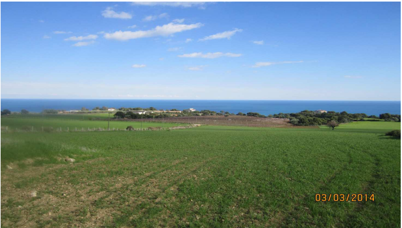
Stillitano: prog. Def. In superficie lung 628 m - prog. Prelim. tutto in galleria naturale