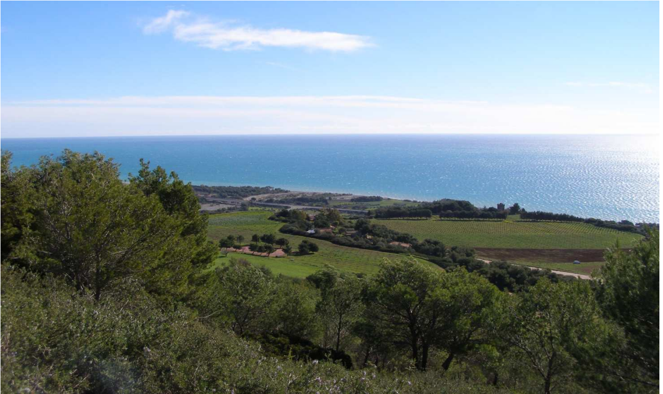
Torre di Albidona/Schiavi: prog. Def. Galleria art. lung 200m, in superf 1 863m -prog. Prelim tutto in galleria