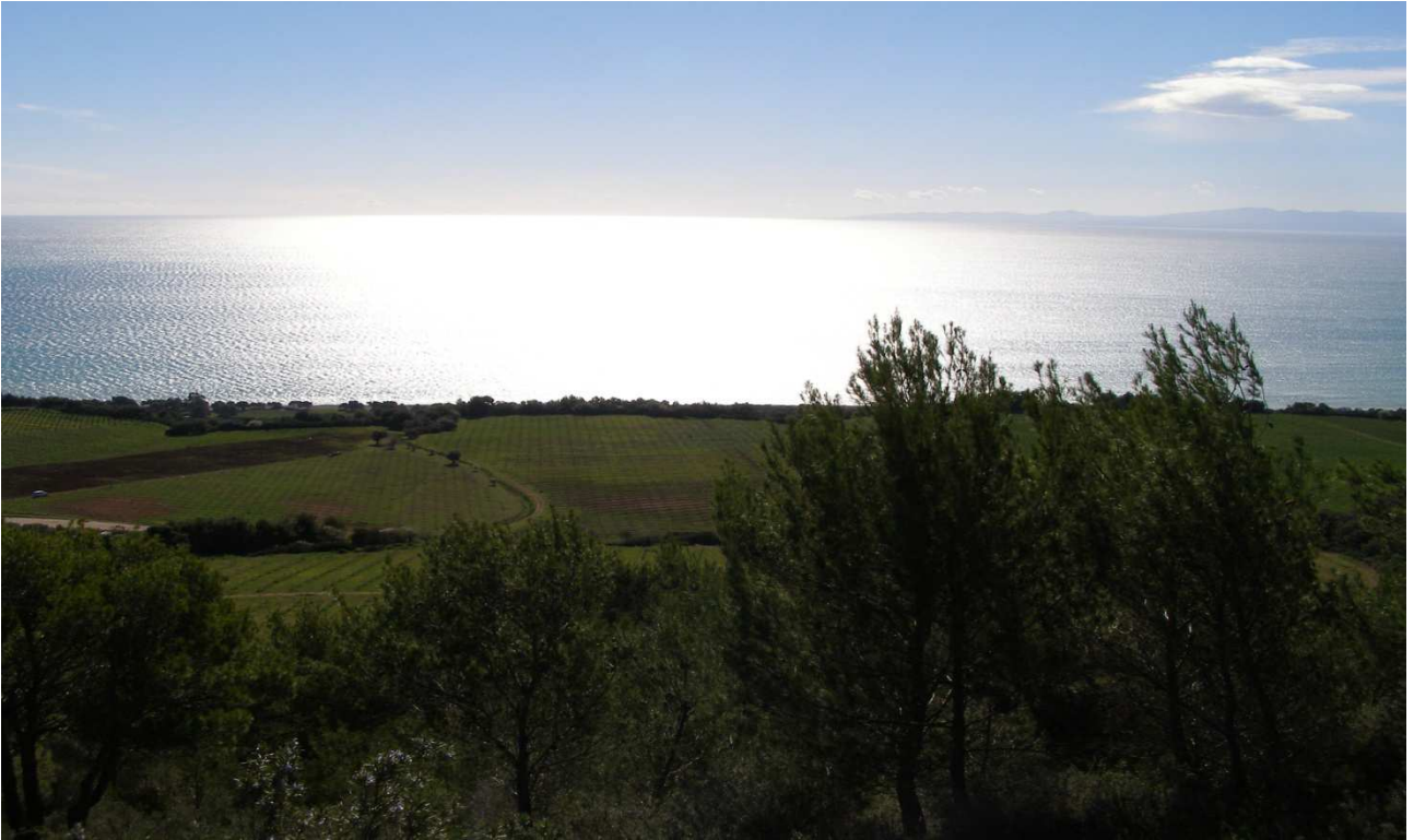
Torre di Albidona/schiavi: prog. Def. Galleria art. 200m, in superf 863 m. prog. Prelim. tutto in galleria nat