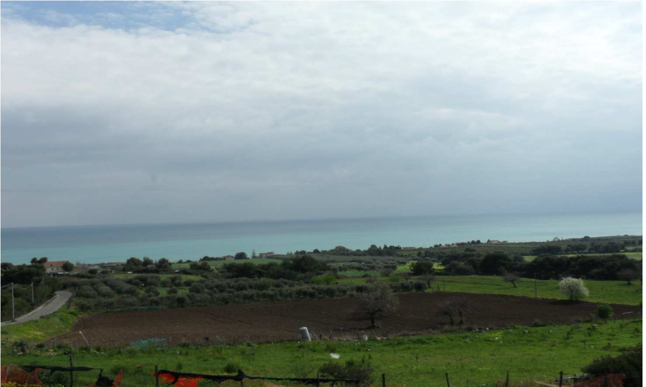
c.da Taviano: prog. Def. tratto in superficie lung 1411 m - prog. Prelim. galleria naturale lung 1354 m