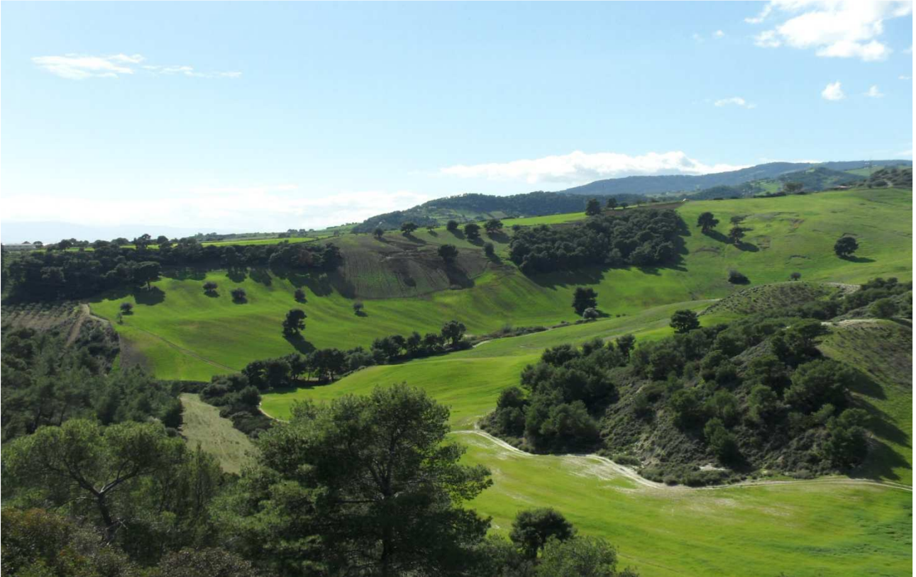
Stillitano: prog. Def. viadotto lung 300 m h 62 m -prog. Prelim. scatolare lung 218 m h 7 m