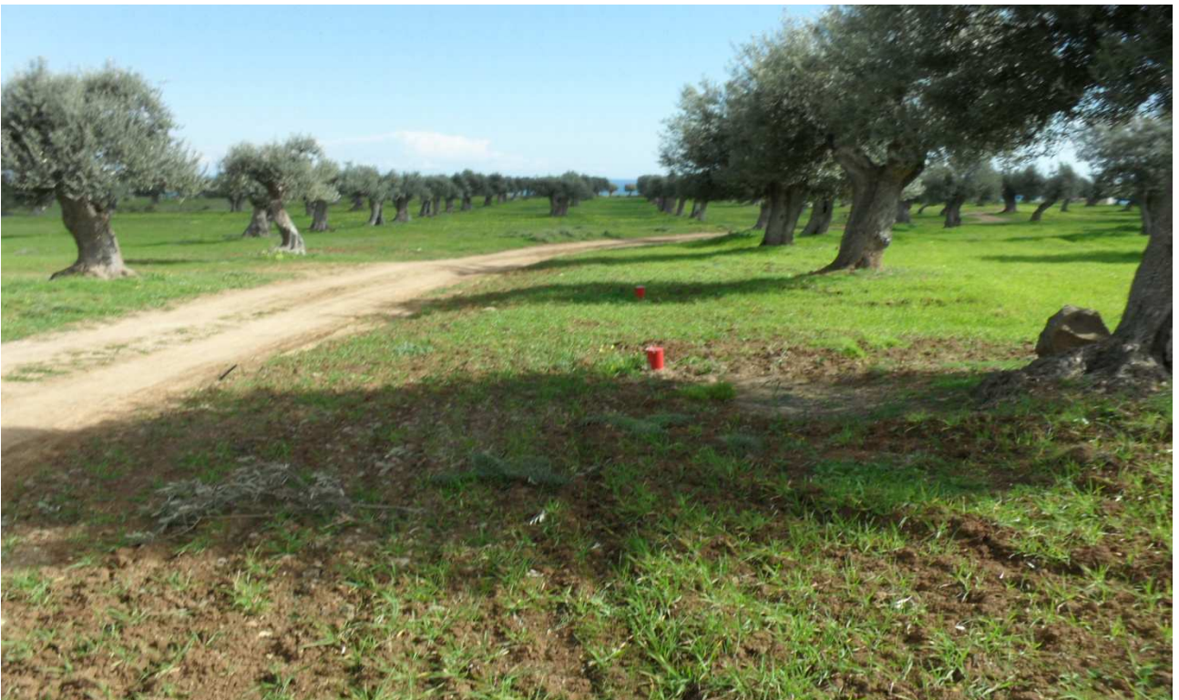
Celogreco (uliveti secolari): prog. Def.galleria artif e in superficie -prog. Prelim. tutto in galleria naturale