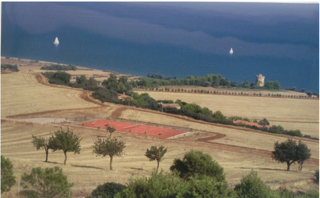
Torre di Albidona/schiavi: prog. Def. Galleria art. lung 200 m in sup 863m -prog. Prelim tutto in galleria nat