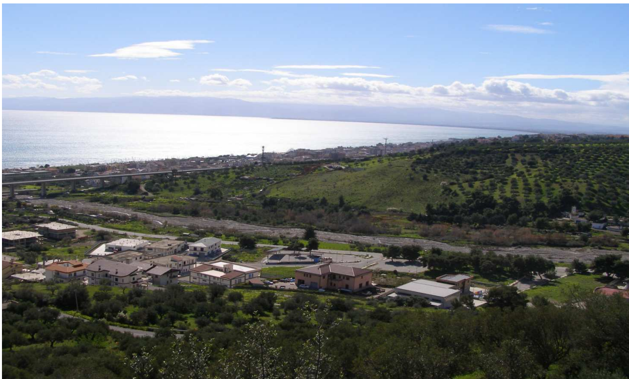
fiume Pagliaro: prog. Definitivo viadotto lung. 640 m h 57 m- prog. Preliminare viadotto lung. 522 m h 35m