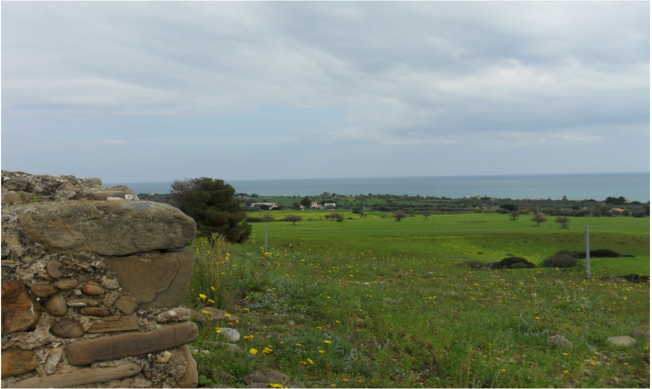
C.da Lista: prog. Def. tratto in superficie lung 1452 m -prog. Prelim. Galleria naturale lung 680m + svincolo