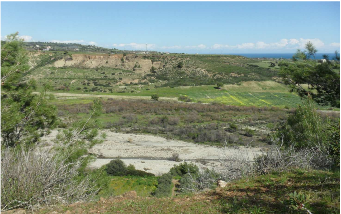
Fiumara Straface: prog. Def. viadotto lung 686 m h 56 m -prog. Prelim.viadotto lung 454 m h 14 m