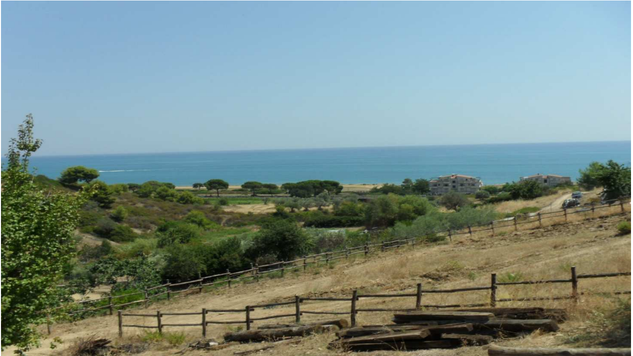
Canale della Donna: prog. Def. viadotto lung 90 m h 22 m-prog. Prelim. viadotto lung 101 m h 14 m