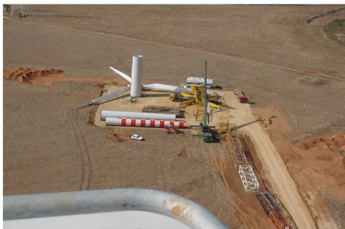
Figura 1 – Piazzola per il montaggio dell'aerogeneratore

le sezioni della torre, la navicella, il mozzo e l'ogiva. Lungo un lato della piazzola, su un'area idonea, si prevede area stoccaggio blade, in seguito calettate sul mozzo mediante una idonea gru, con cui si prevede anche al montaggio dell'ogiva. Il montaggio dell'aerogeneratore (cioè, in successione, degli elementi della torre, della navicella e del rotore) avviene per mezzo di una gru tralicciata, posizionata a circa 25-30 m dal centro della torre e precedentemente assemblata sul posto; si ritiene pertanto necessario realizzare uno spazio idoneo per il deposito degli elementi del braccio della gru tralicciata. Parallelamente a questo spazio si prevede una pista per il transito dei mezzi ausiliari al deposito e montaggio della gru, che si prevede coincidente per quanto possibile con la parte terminale della strada di accesso alla piazzola al fine di limitare al massimo le aree occupate durante i lavori.