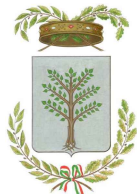
PROVINCIA DI ORISTANO