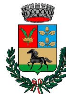
COMUNE DI ASSOLO