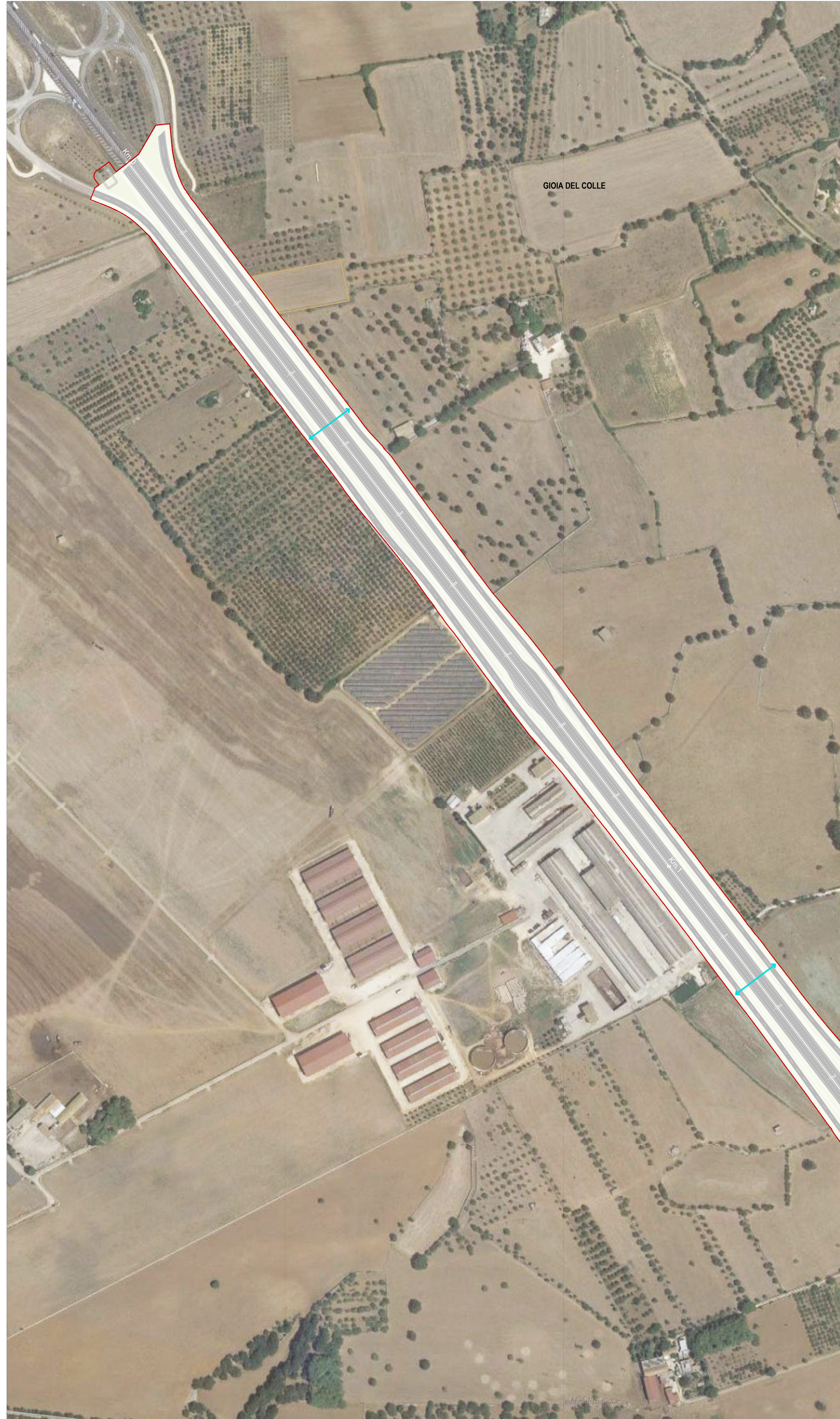
01 STRALCIO PLANIMETRICO 01 1:2000