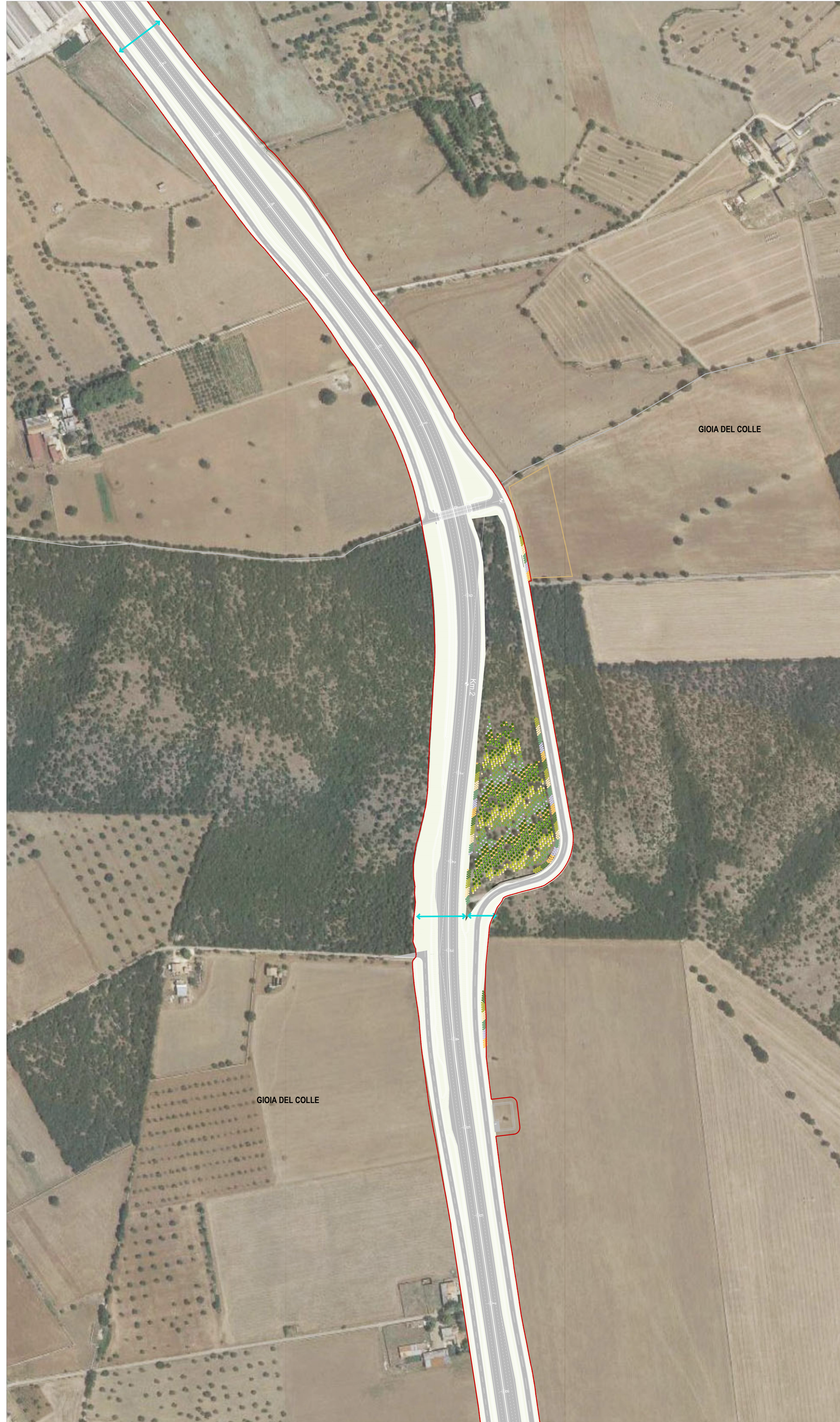
02 STRALCIO PLANIMETRICO 02 1:2000