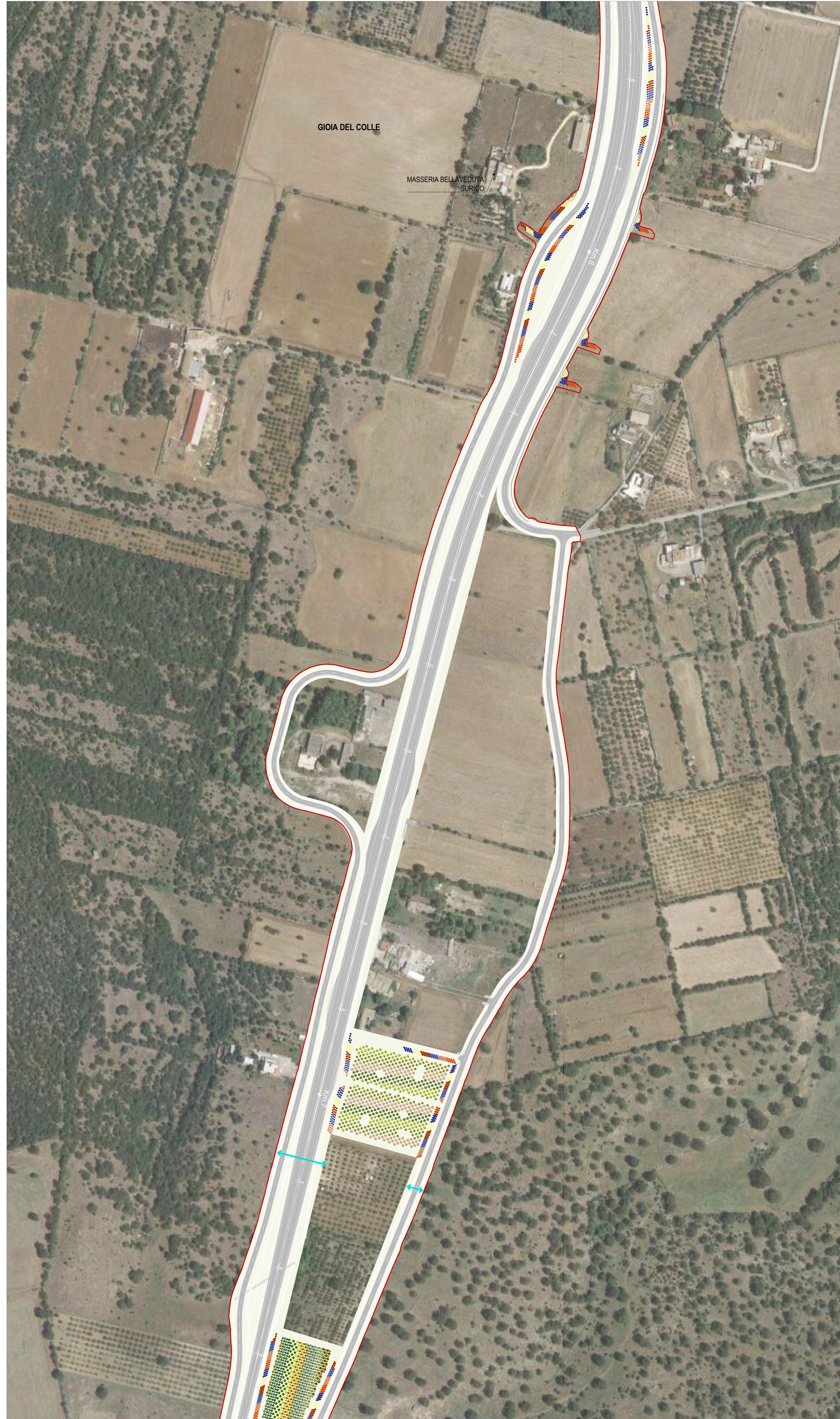
05 STRALCIO PLANIMETRICO 05 1:2000