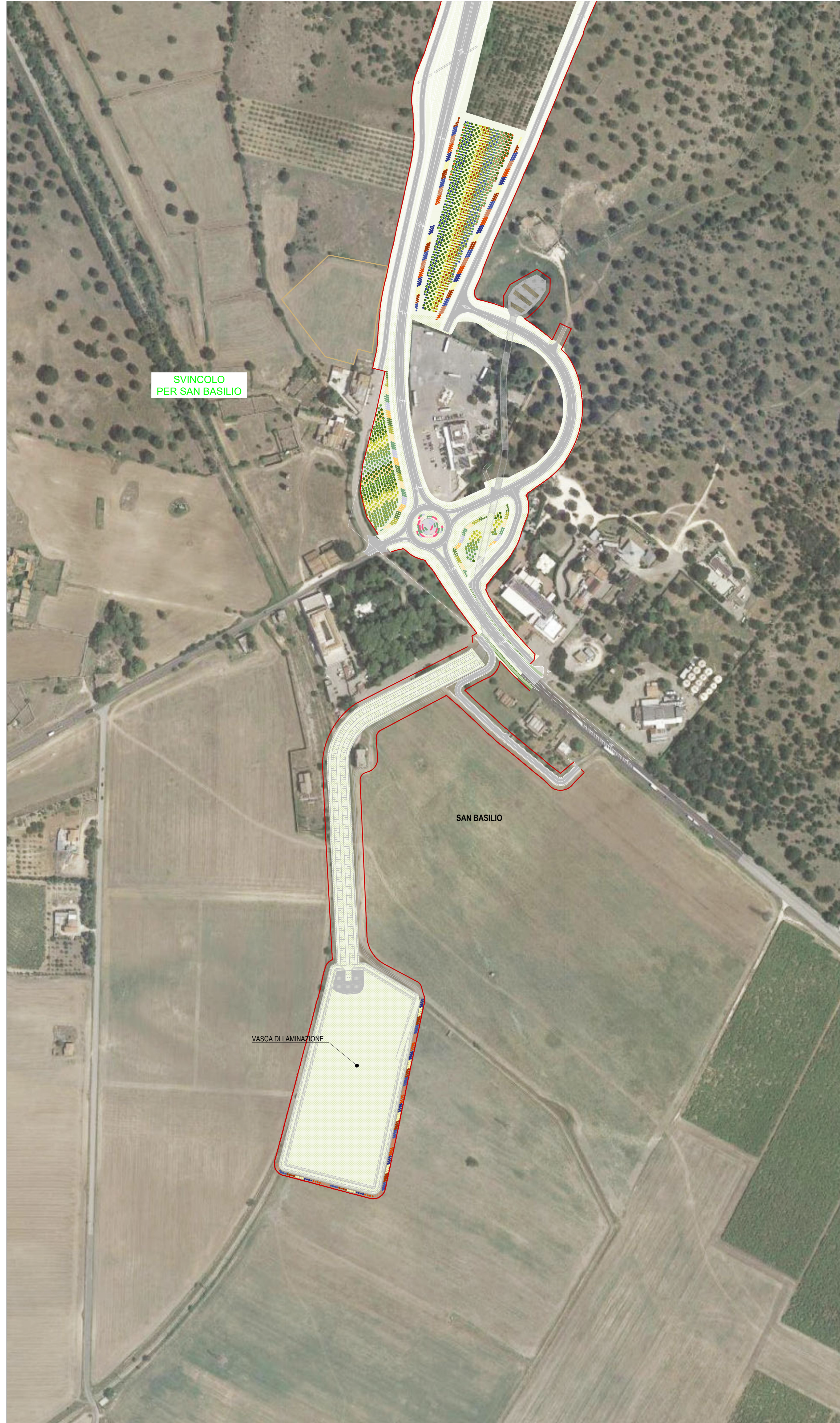
06 STRALCIO PLANIMETRICO 06 1:2000