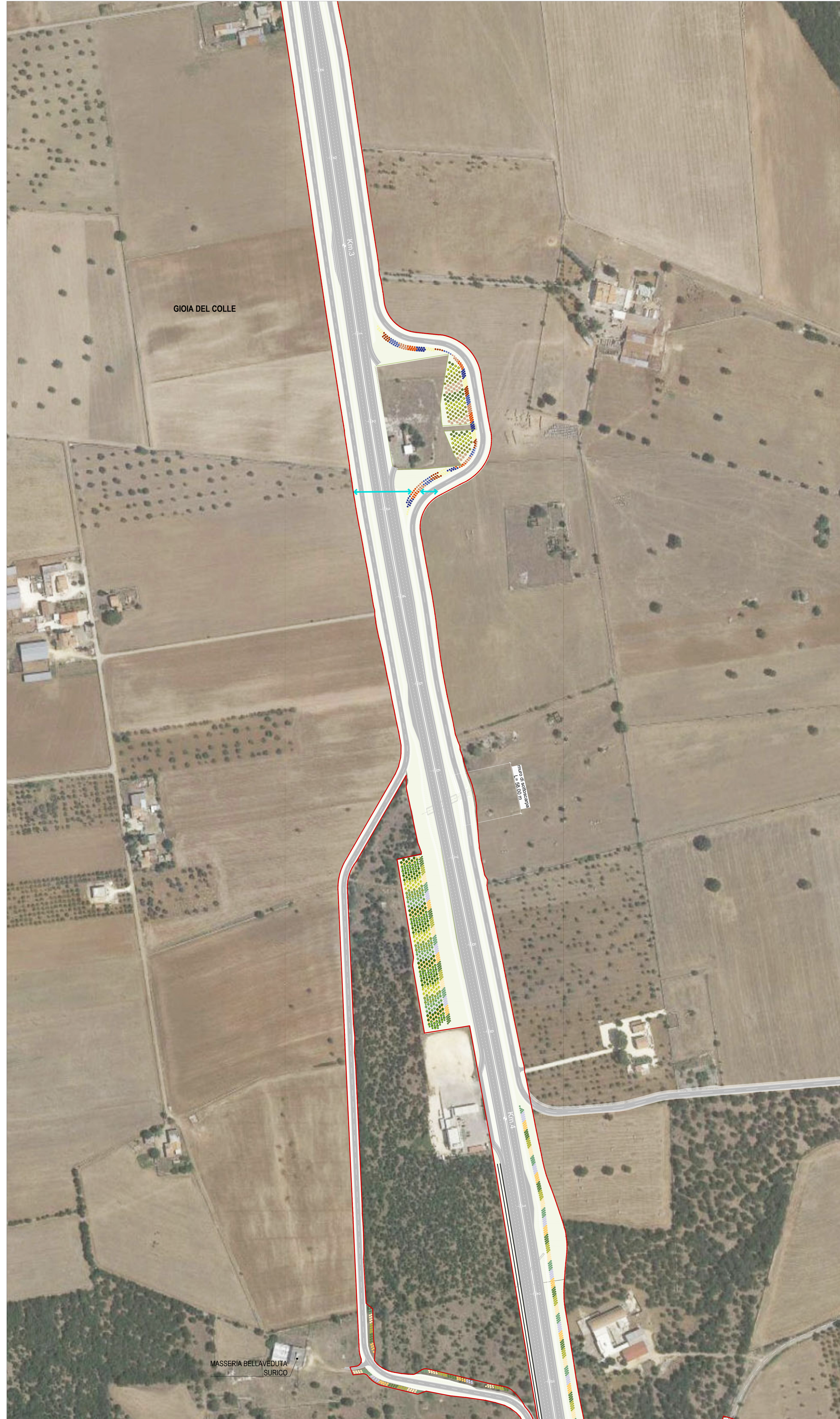
03 STALCIO PLANIMETRICO 03 1:2000