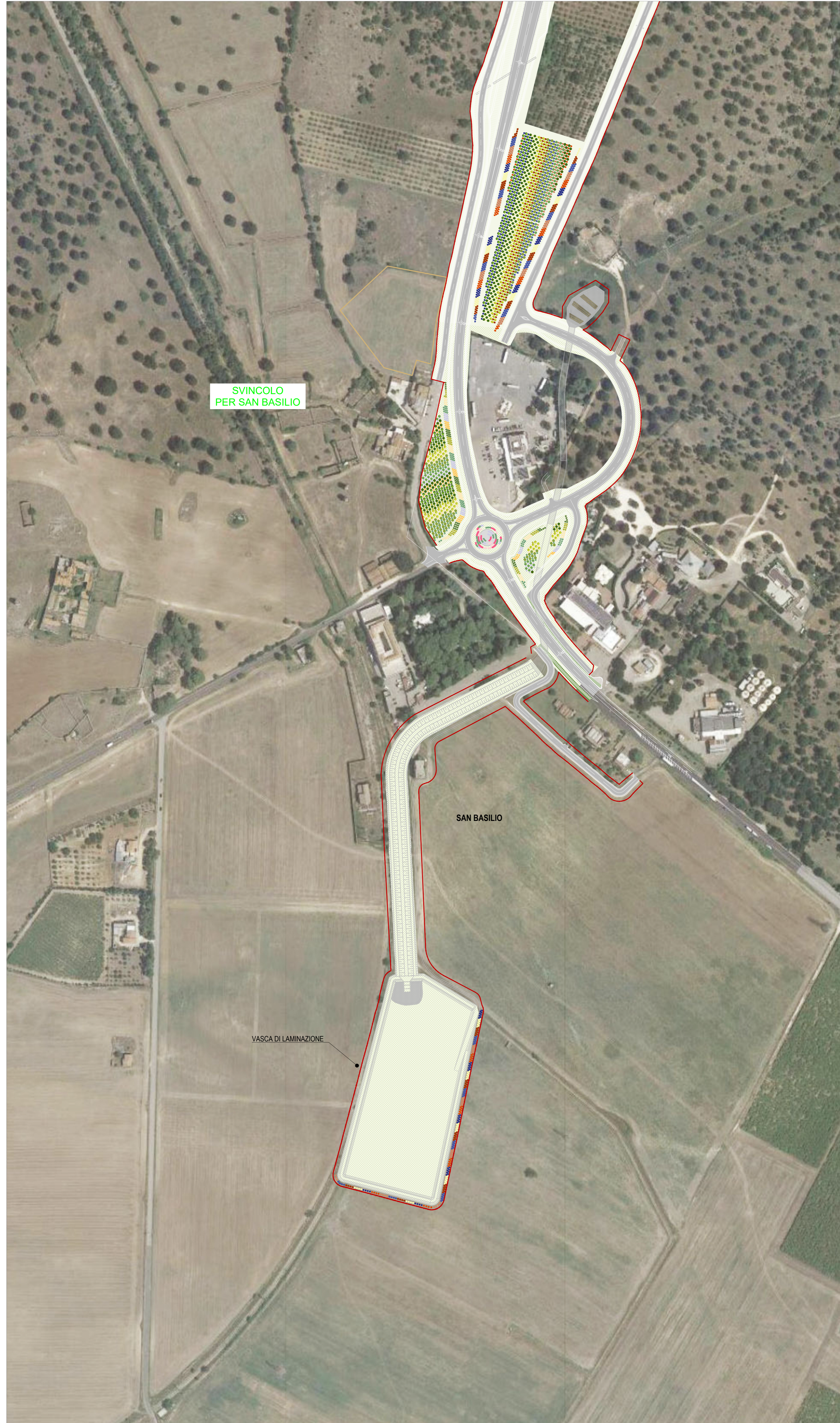
06 STRALCIO PLANIMETRICO 06 1:2000