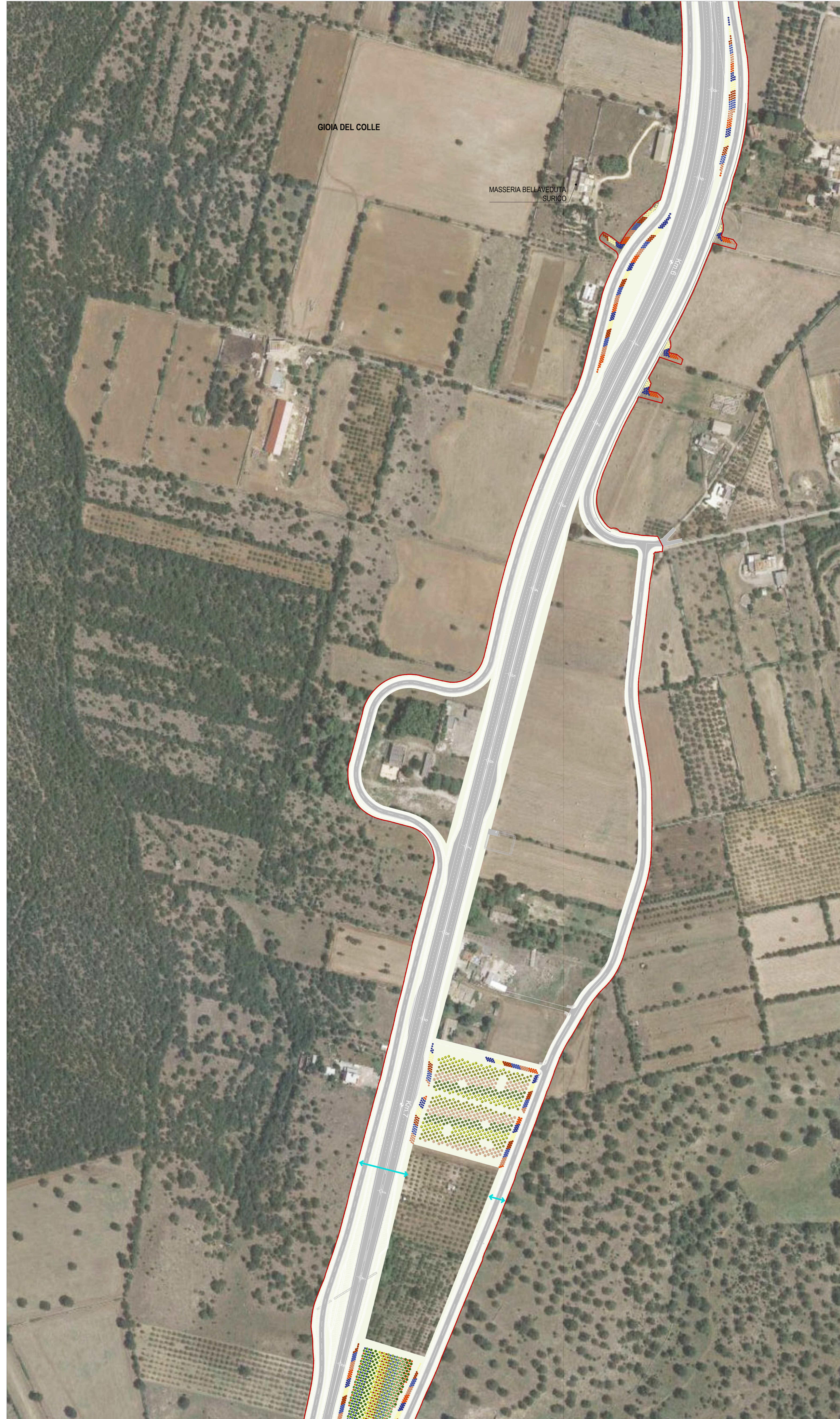
05 STRALCIO PLANIMETRICO 05 1:2000