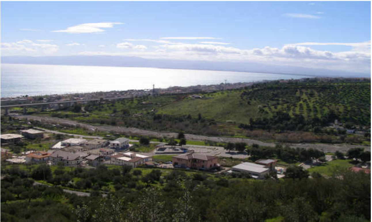
fiume Pagliaro: prog. Definitivo viadotto lung. 640 m h 57 m - prog. Preliminare viadotto lung. 522 m h 35m