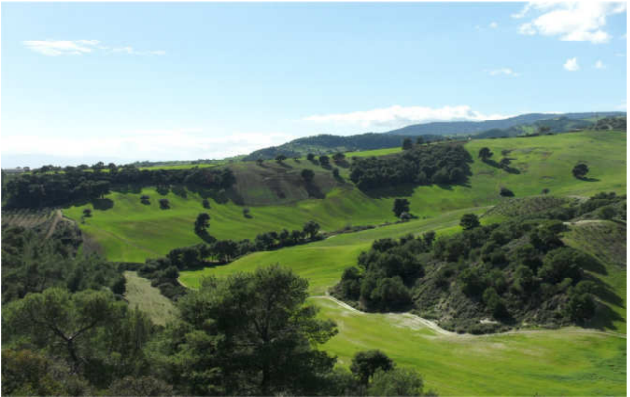
Stillitano: prog. Def. viadotto lung 300 m h 62 m -prog. Prelim. scatolare lung 218 m h 7 m