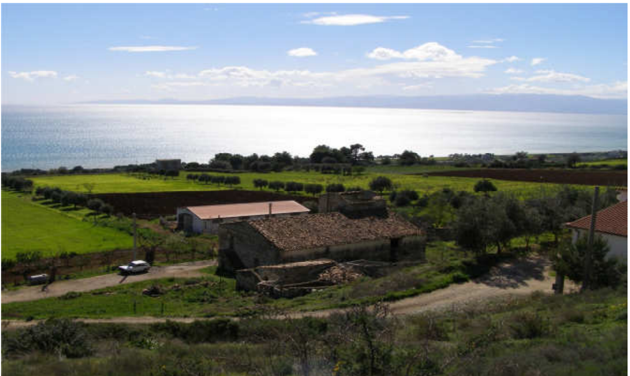
Rovitti: prog. Def. In superficie lunghezza 863 m -prog. Prelim. tutto in galleria