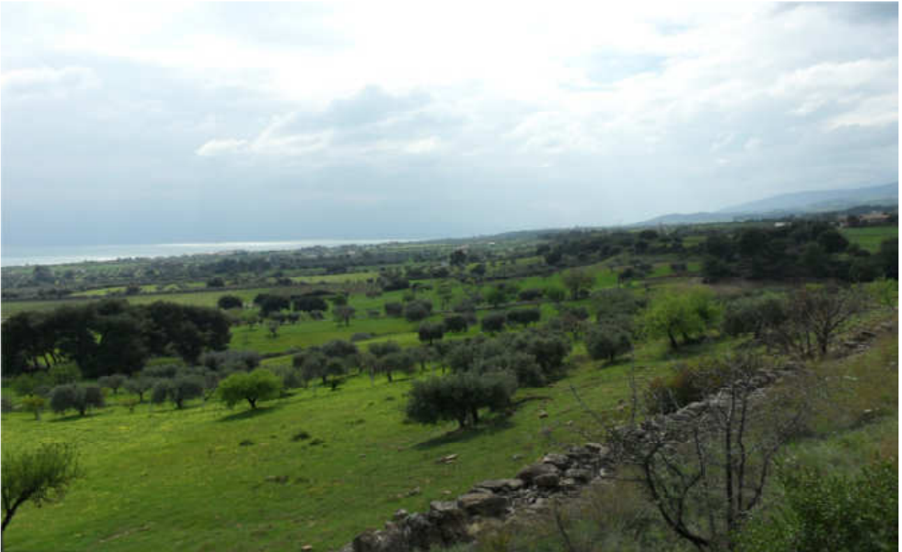
c.da Taviano: prog. Def. tratto in superficie lung 1411 m - prog. Prelim. galleria naturale lung 1354 m