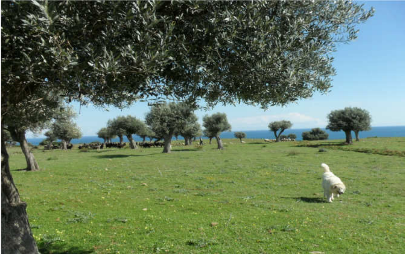
Celogreco (uliveti secolari): prog. Def.galleria arte e in superficie -prog. Prelim. tutto in galleria naturale