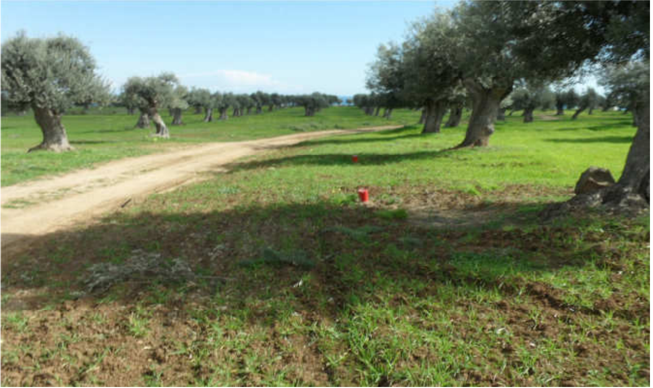
Celogreco (uliveti secolari): prog. Def.galleria artificie in superficie -prog. Prelim. tutto in galleria naturale