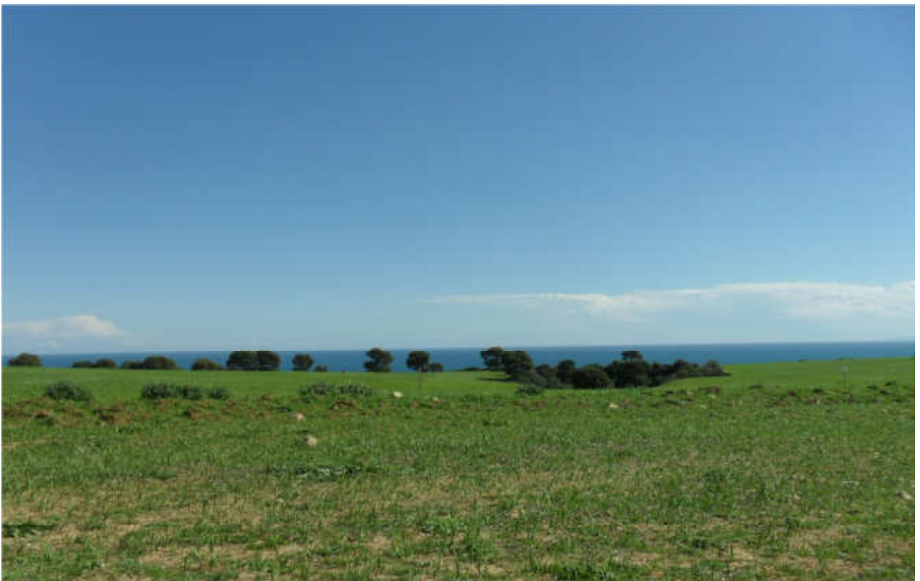
Potresimo: prog. Def. in superficie e in gallerie artificiali -prog. Prelim. tutto in galleria naturale