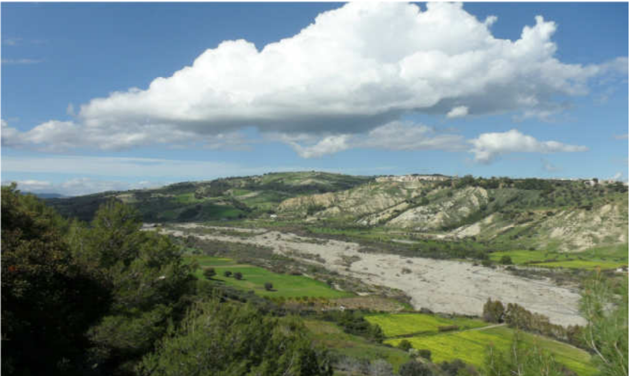
Fiumara Straface: prog. Def. viadotto lung 686 m h 56 m -prog. Prelim.viadotto lung 454 m h 14 m