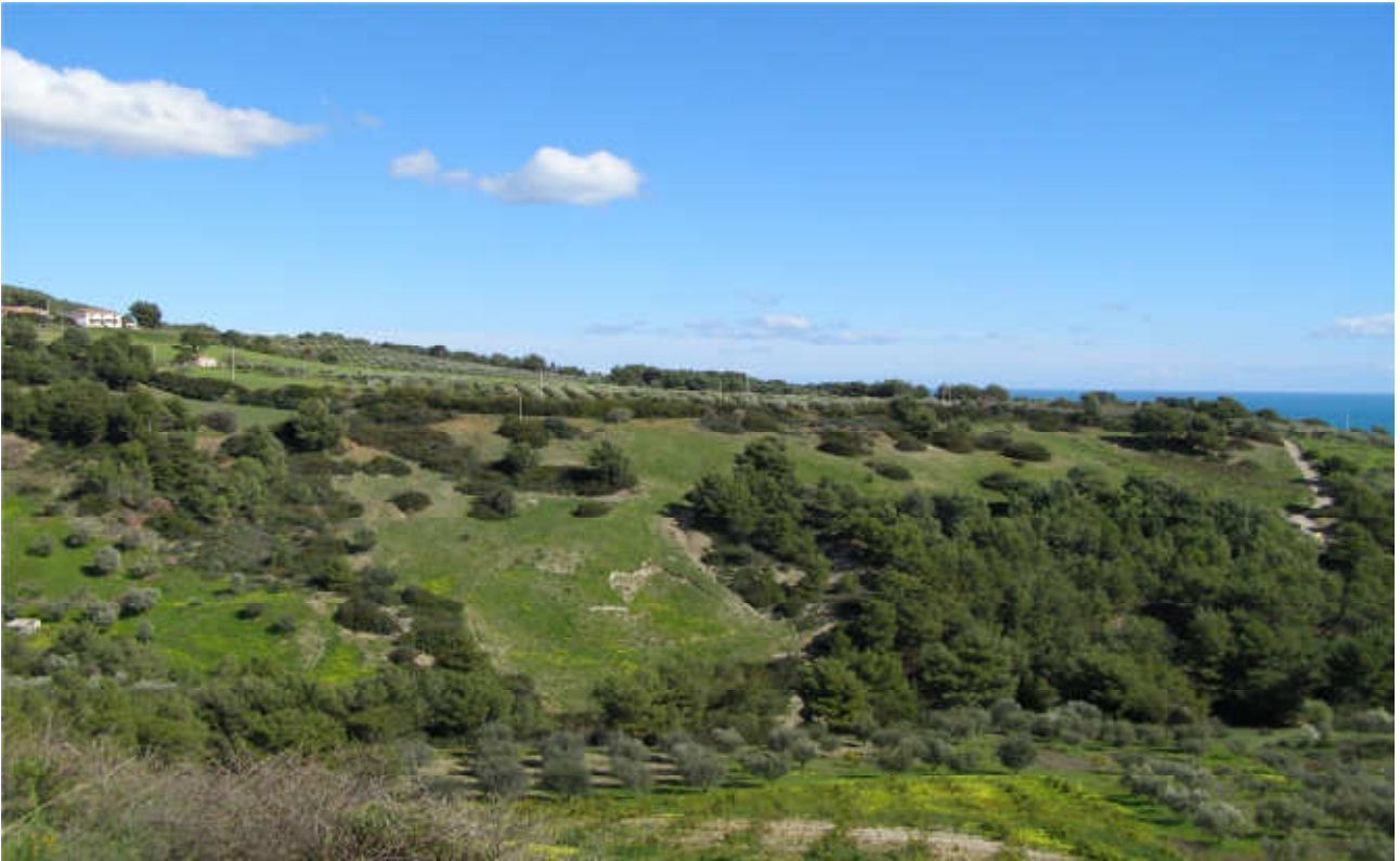
Canale Forno: prog. Def. viadotto lunghezza 420 m h 60 m -prog. Prelim. viadotto lung 216 h 29 m