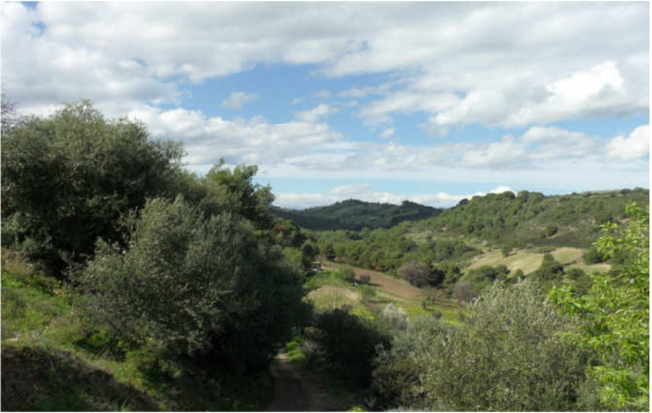
Canale Potresimo-Celogreco: prog. Def. viadotto lung 270 m h 55 m -prog. Prelim.scatolare lung 86 h 8 m