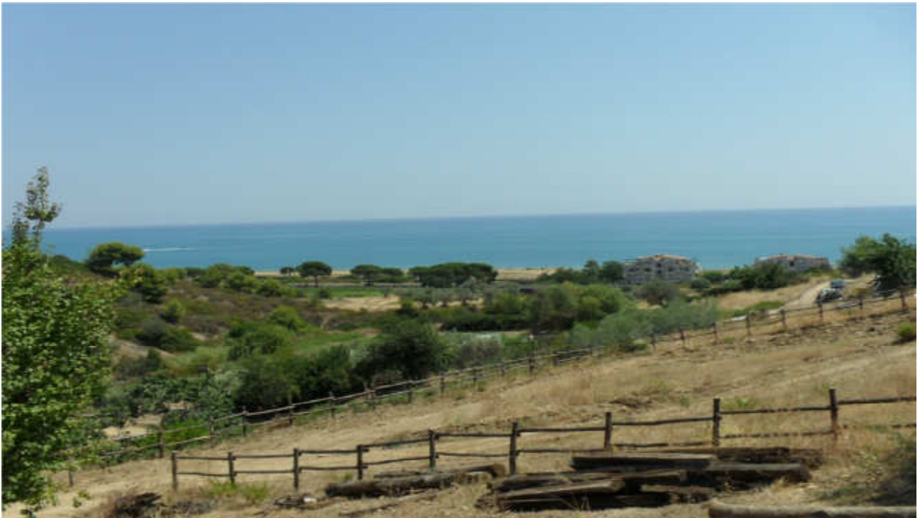
Canale della Donna: prog. Def. viadotto lung 90 m h 22 m-prog. Prelim. viadotto lung 101 m h 14 m