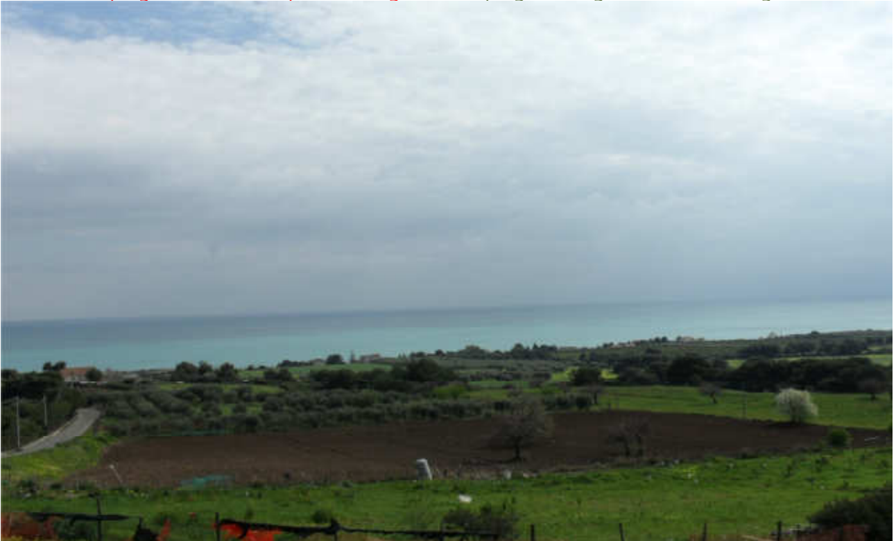
c.da Taviano: prog. Def. tratto in superficie lung 1411 m - prog. Prelim. galleria naturale lung 1354 m