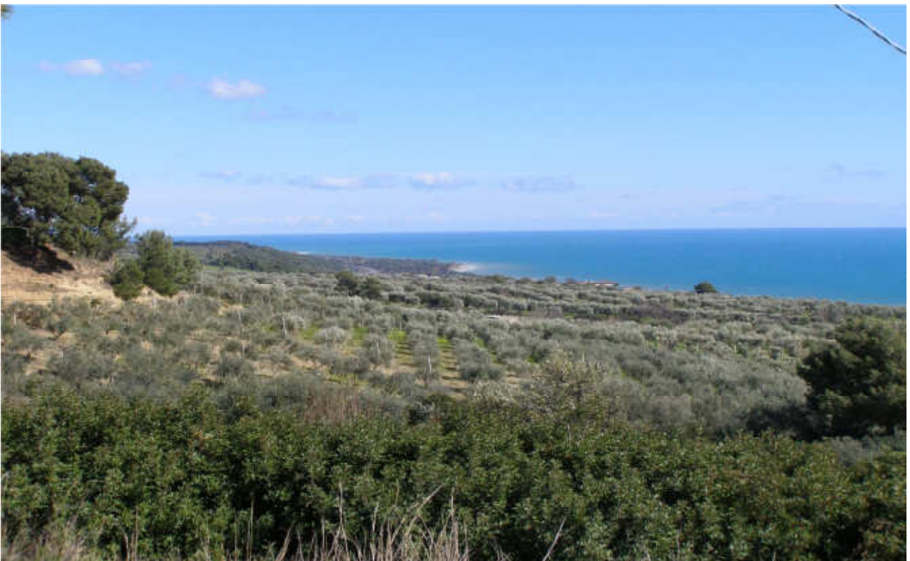
Svincolo di Albidona: prog Definit in superficie lung 1 155 m -prog Prelim 580 m in gallerie, 580 m fuori terra