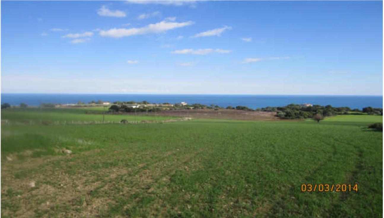
Stillitano: prog. Def. In superficie lung 628 m - prog. Prelim. tutto in galleria naturale