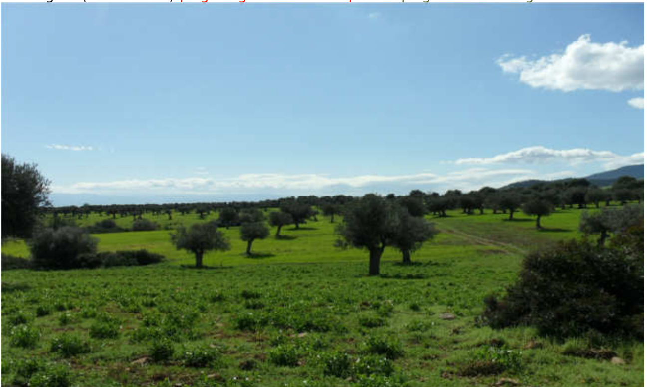
Celogreco (uliveti secolari): prog. Def.galleria arte e in superficie -prog. Prelim. tutto in galleria naturale