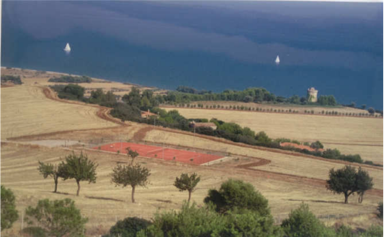
Torre di Albidona/schiavi: prog. Def. Galleria art. lung 200 m in sup 863m -prog. Prelim tutto in galleria nat