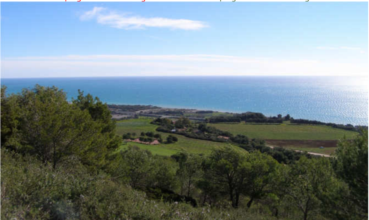
Torre di Albidona/Schiavi: prog. Def. Galleria art. lung 200m, in superf I 863m -prog. Prelim tutto in galleria