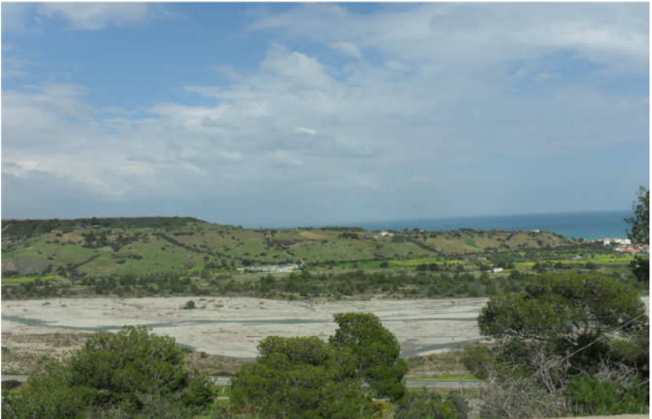
Fiume Ferro: prog. Def. viadotto lung 537 m h 31 m - prog. Prelim. viadotto lung 548 m h 13 m