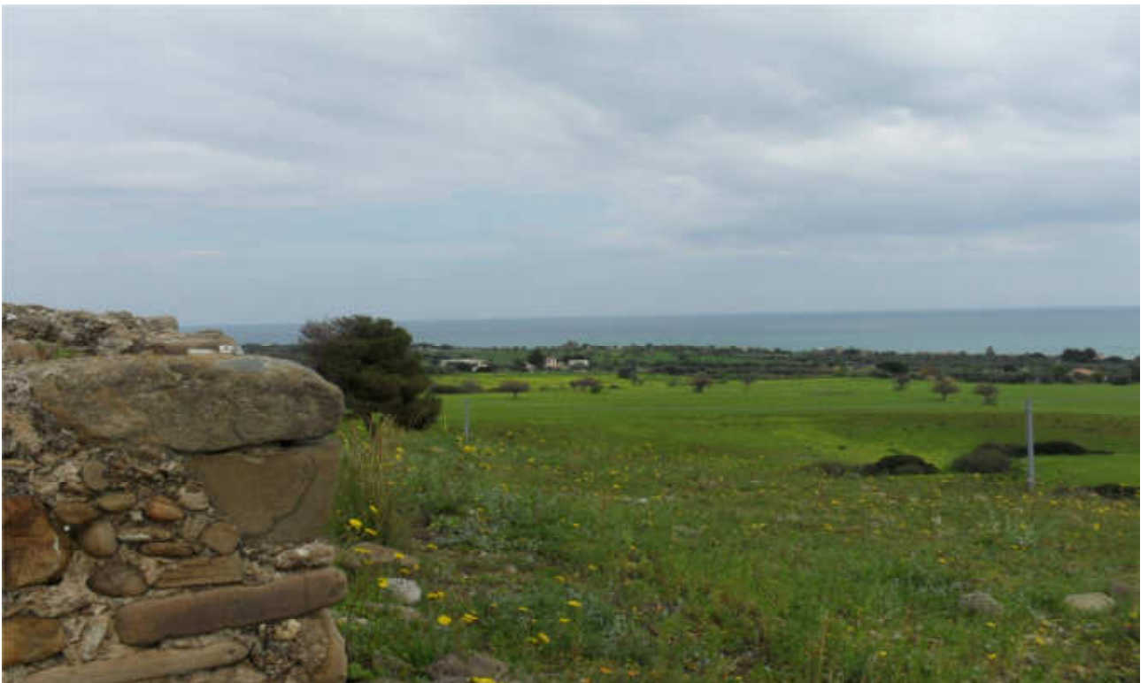
C.da Lista: prog. Def. tratto in superficie lung 1452 m -prog. Prelim. Galleria naturale lung 680m + svincolo