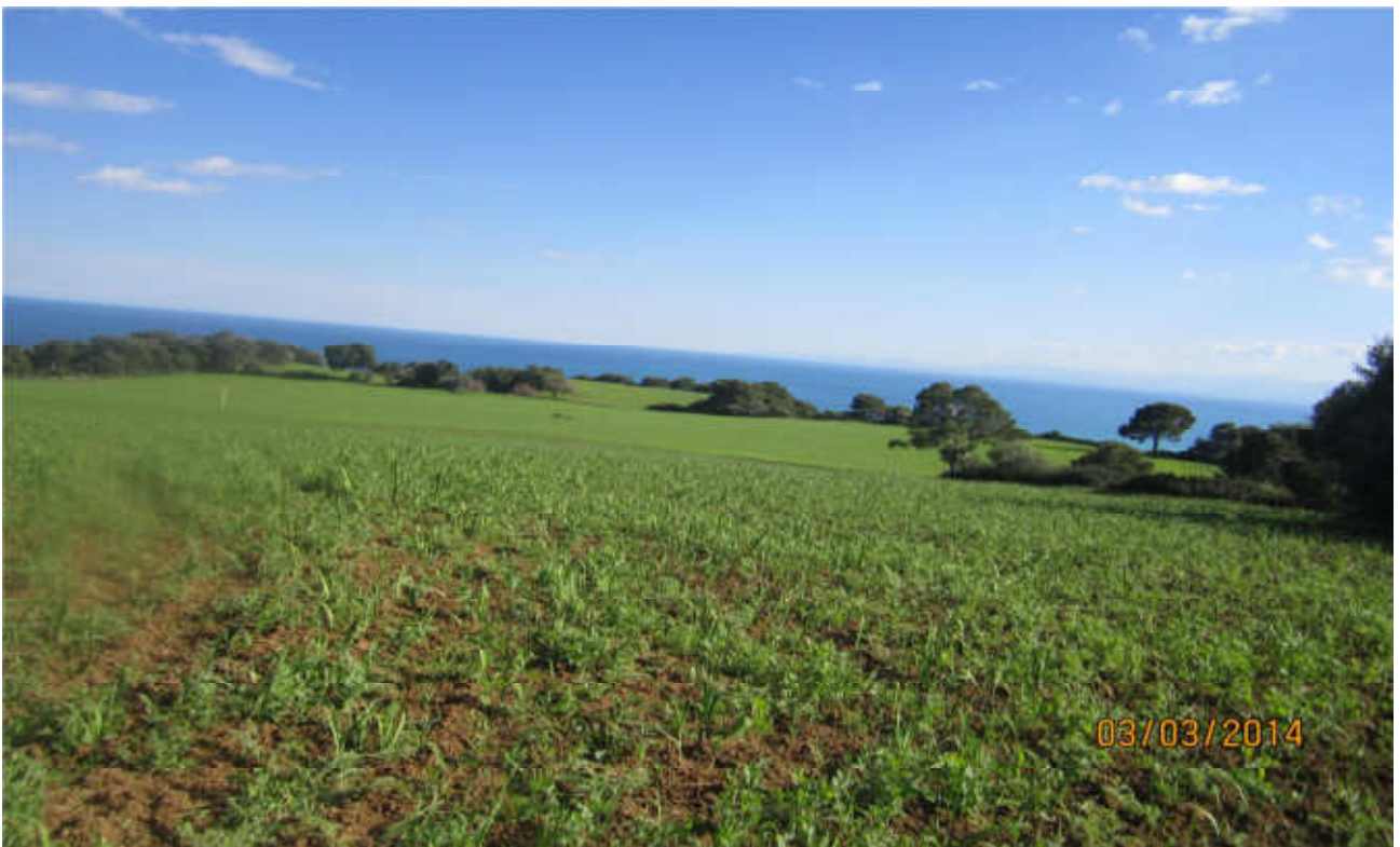
Stillitano: prog. Def. In superficie lung 628 m -prog. Prelim. tutto in galleria naturale