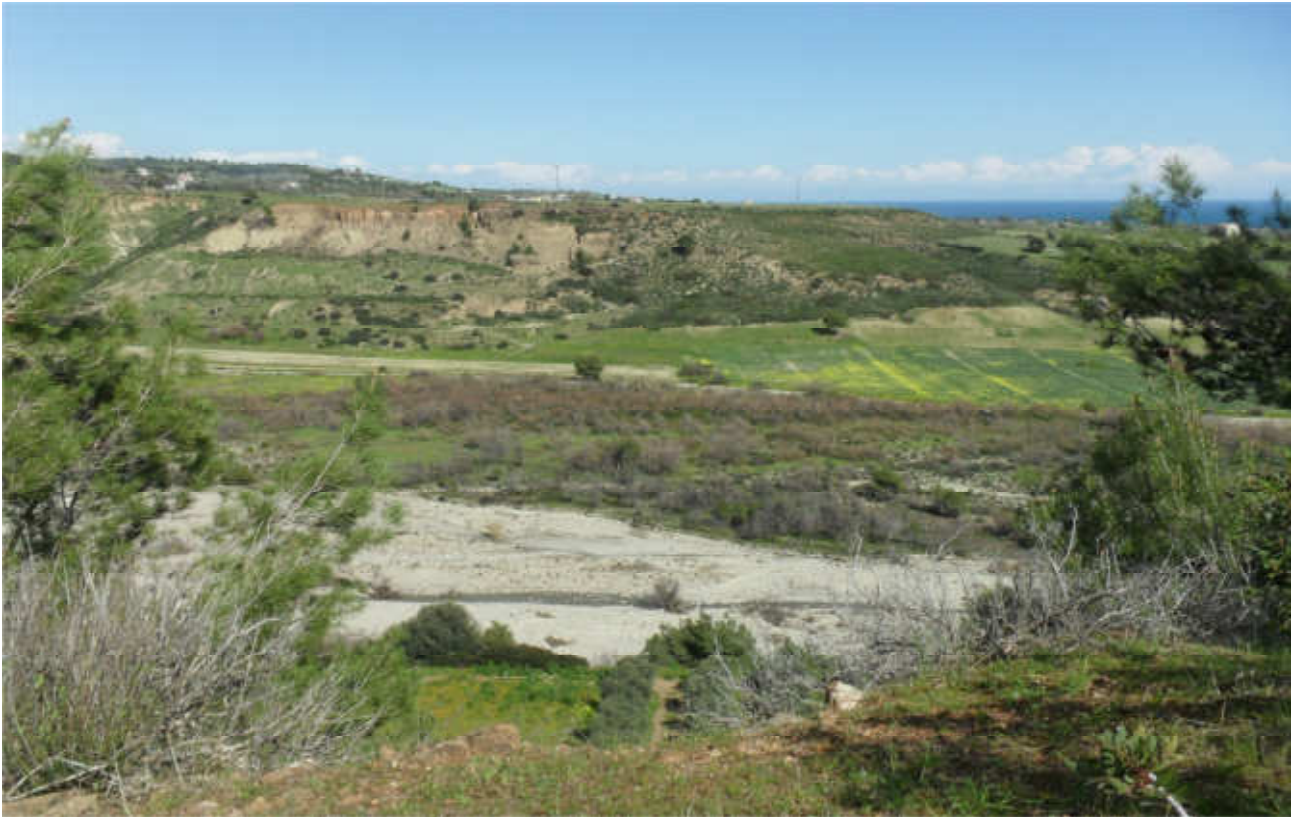
Fiumara Straface: prog. Def. viadotto lung 686 m h 56 m -prog. Prelim.viadotto lung 454 m h 14 m