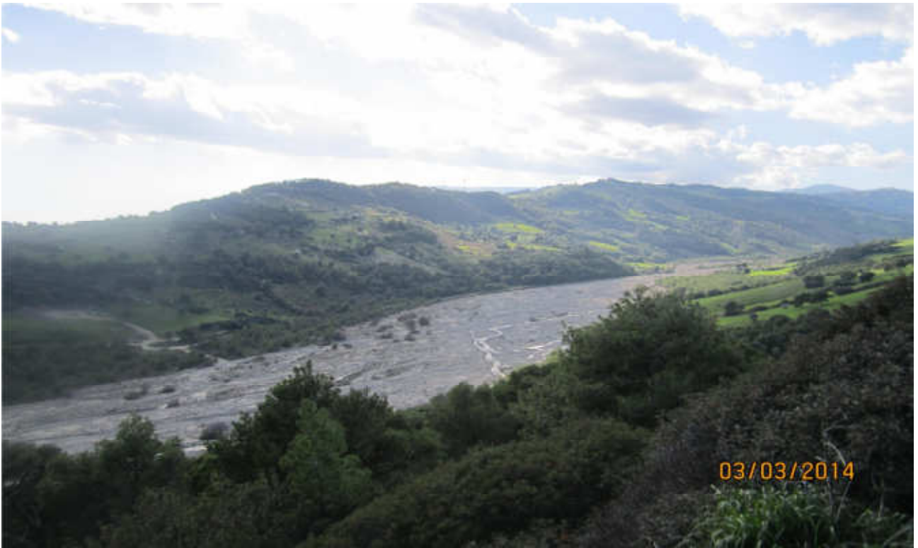
Torrente Avena: prog. Def. Viadotto lung 695 m h 84 m -prog. Prelim. viadotto lung 362 m h 18 m