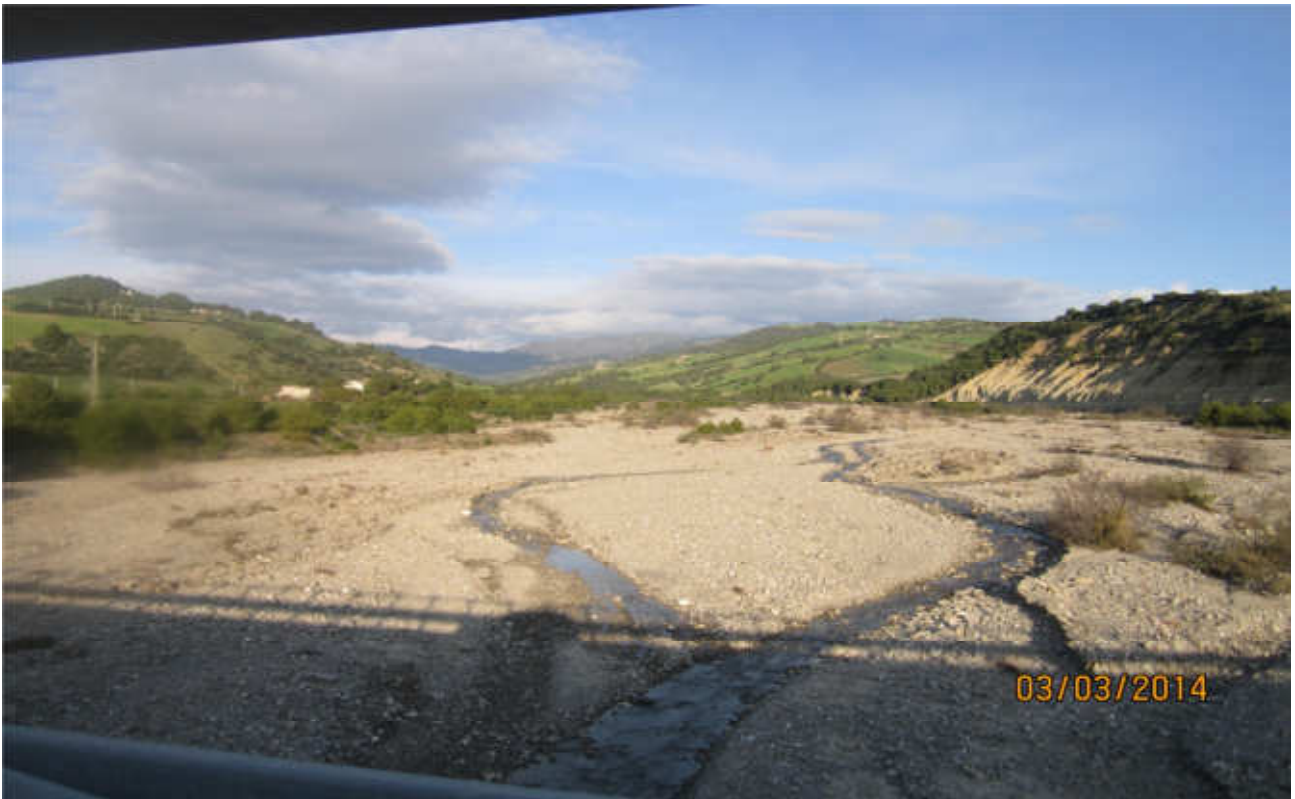
Torrente Avena: prog. Def. viadotto lung 695 m h 84 m -prog. Prelim. viadotto lung 362 m h 18 m