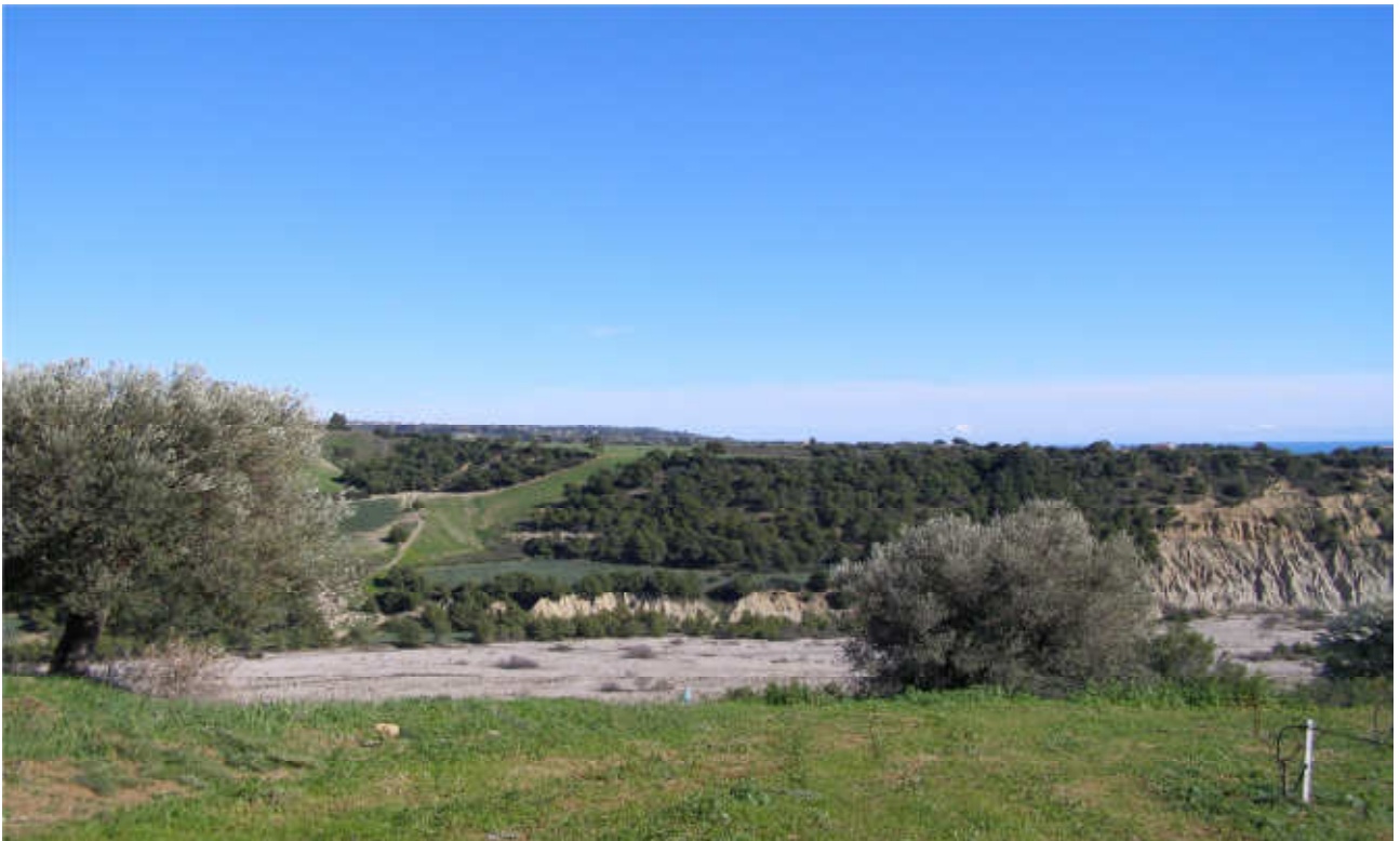
Torrente Avena: prog. Def. viadotto lung 695 m h 84 m - prog. Prelim. viadotto lung 362 m h 18 m