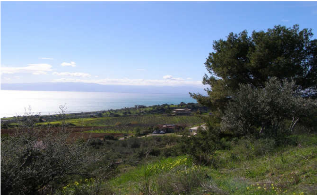
Rovitti: prog. Def. fuori terra lunghezza 863 m -prog. Prelim. tutto in galleria