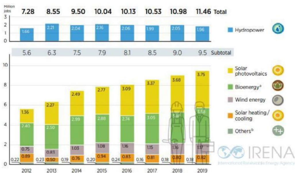
Figura1: Dati occupazionali nel settore rinnovabile negli ultimi anni

L'industria del solare fotovoltaico mantiene il primo posto, con il 33% della forza lavoro totale delle energie rinnovabili. Nel 2019, l'87% dell'occupazione globale nel fotovoltaico si è concentrato nei dieci paesi in testa distribuzione mondiale e nella produzione di attrezzature.