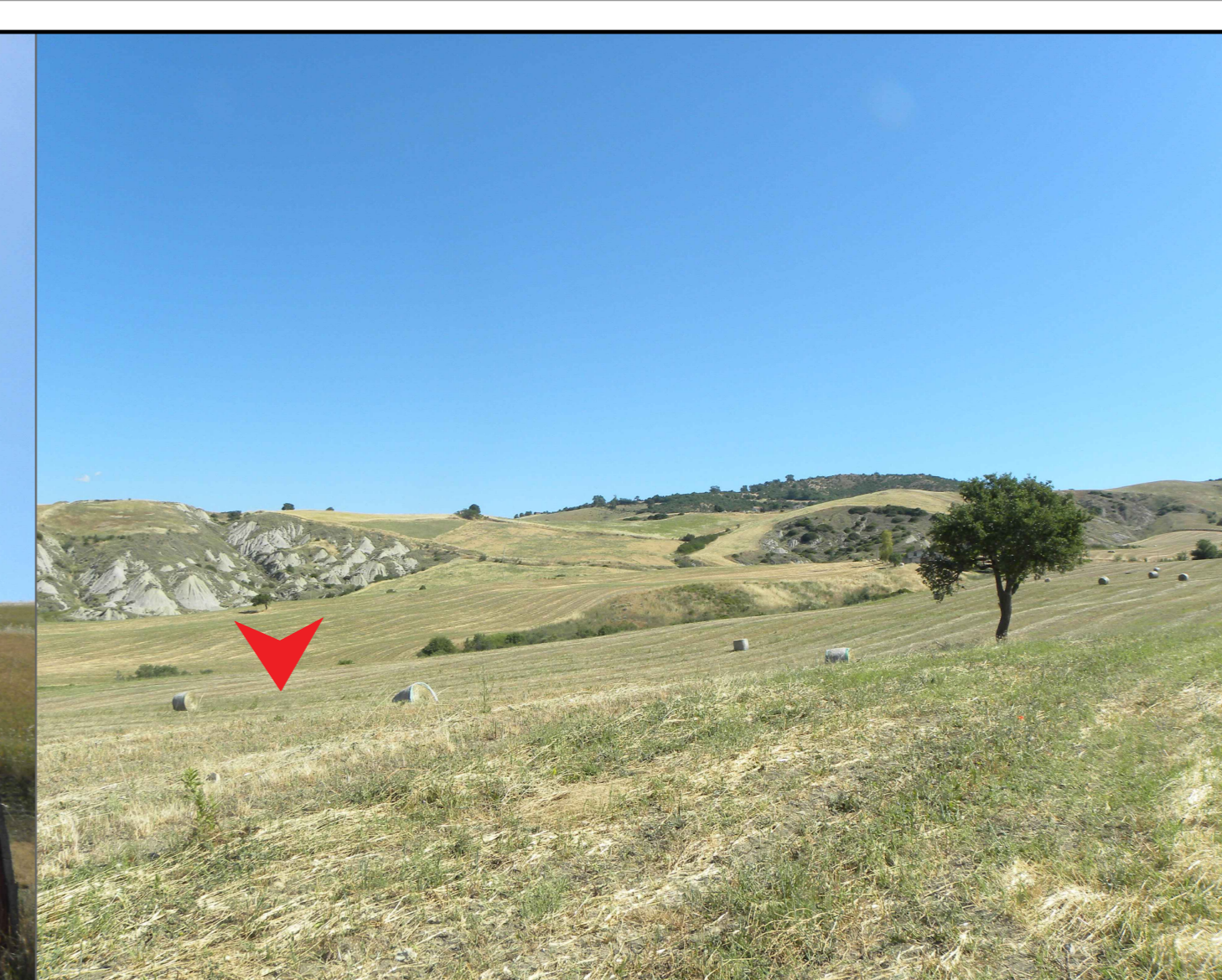
3. Vista della parte Sud della Subarea 2