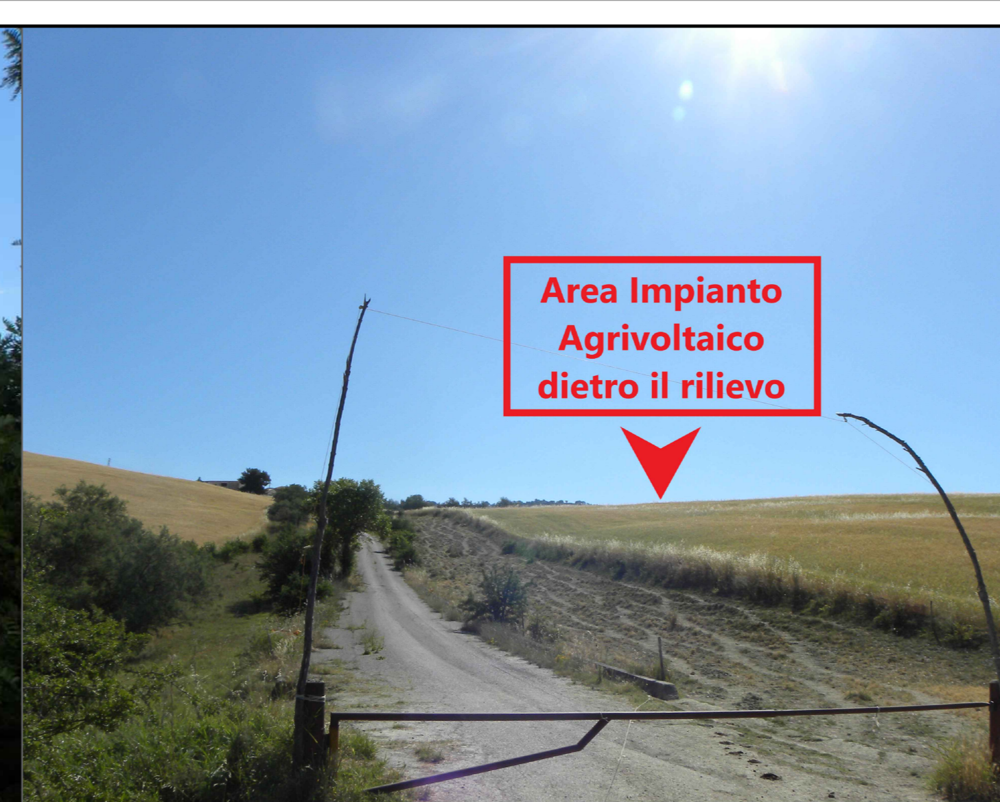
2. Vista dalla Diga di Monte Cotugno