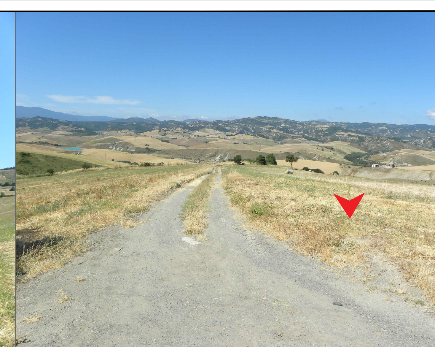
4. Vista della parte Nord della Subarea 2