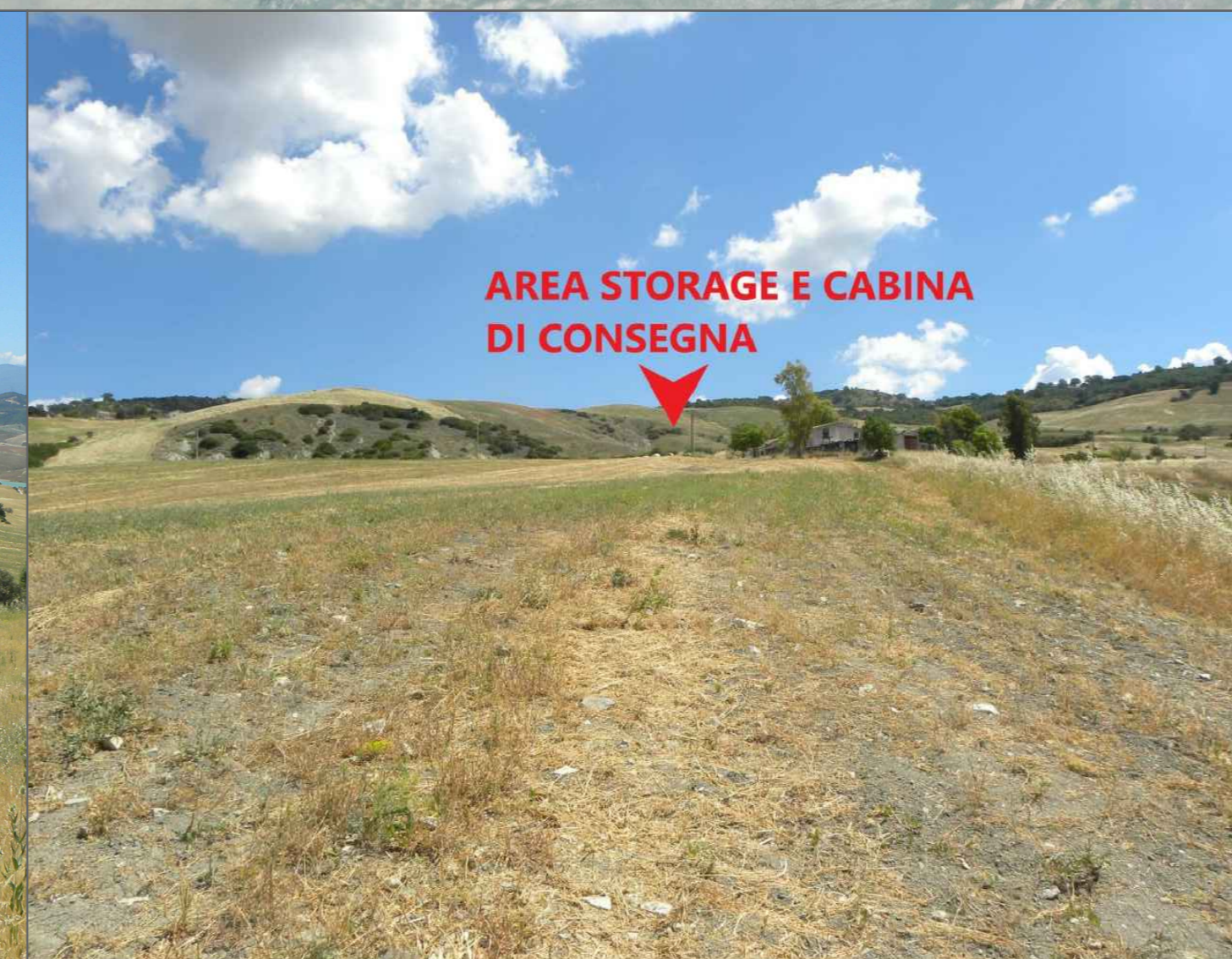
8. Vista della parte Ovest della Subarea 4