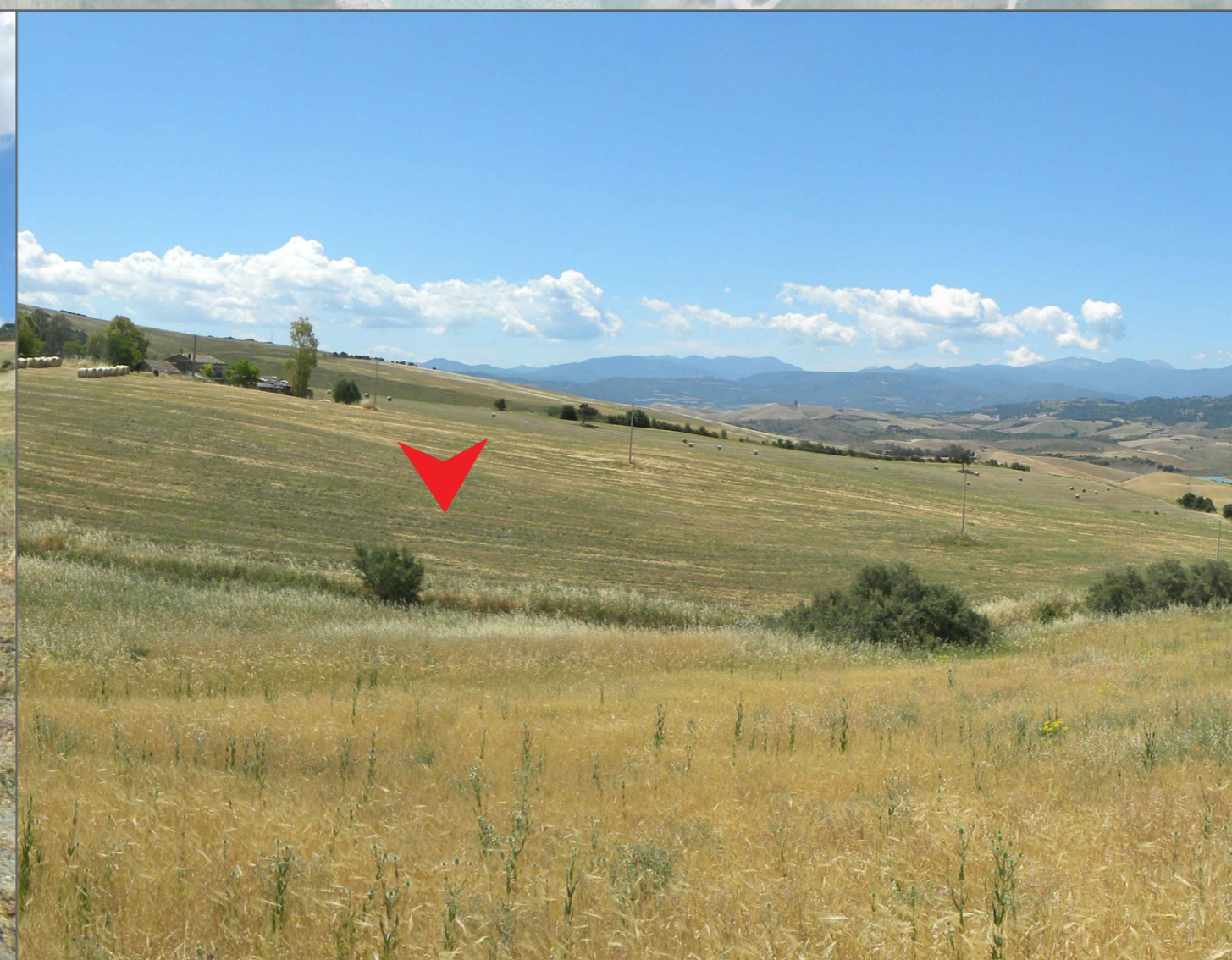
7. Vista dalla strada comunale definita locale