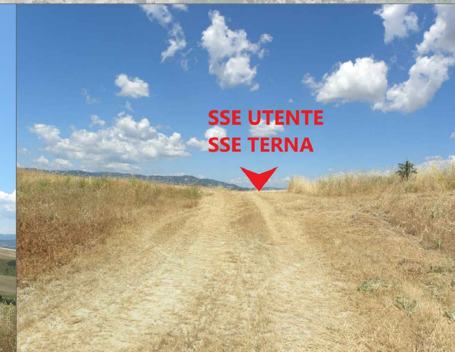
10. Vista dall'area della futura SSE UTENTE