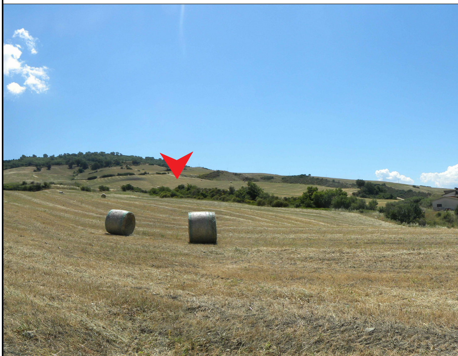
5. Vista della parte Nord della Subarea 1