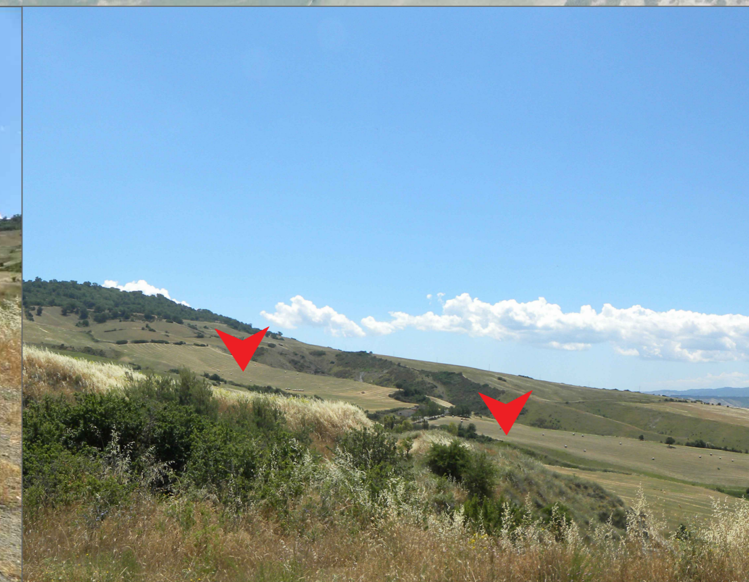
9. Vista dalla SSE UTENTE