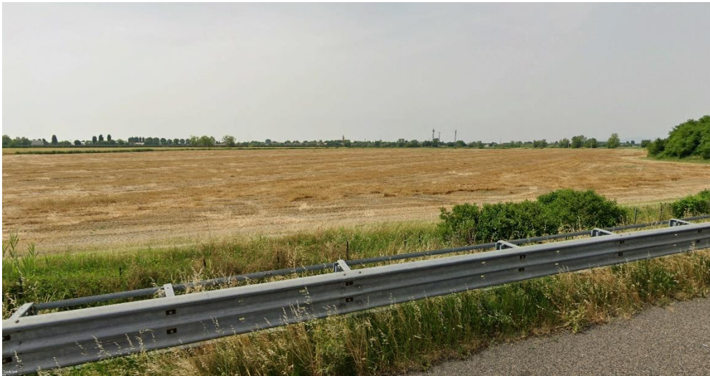
Figura 3 - Foto 2