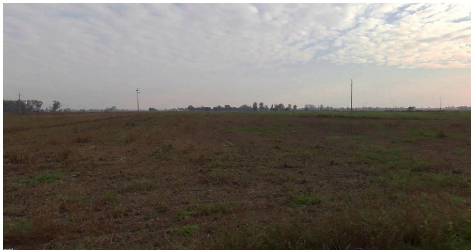
Figura 6 - Foto 5