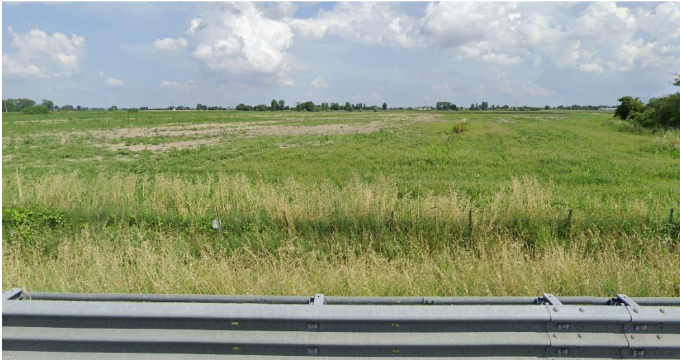
Figura 4 - Foto 3