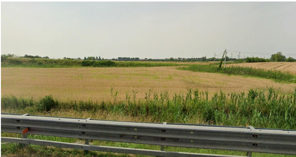
Figura 5 - Foto 4