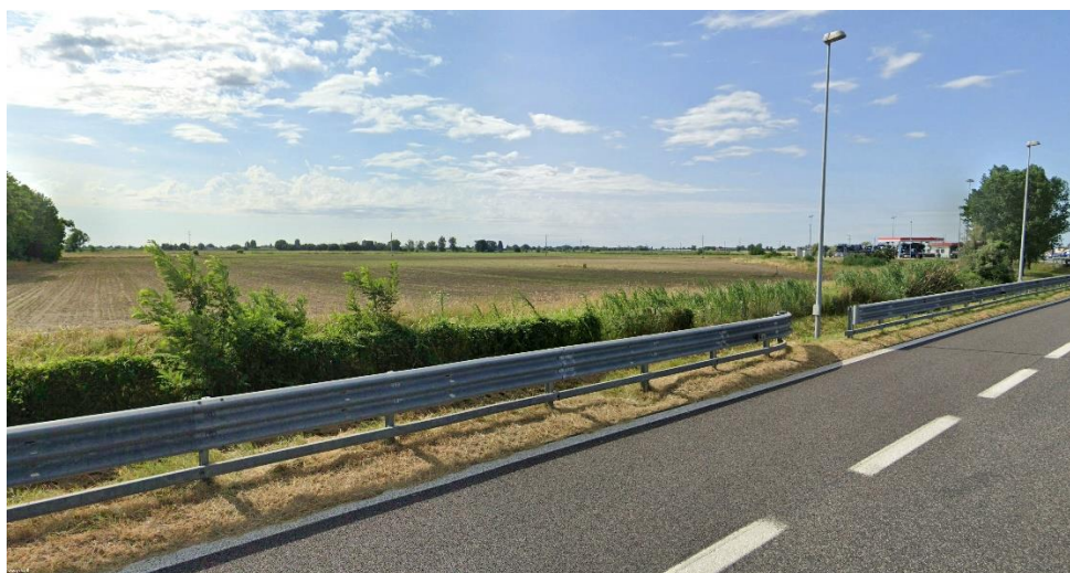
Figura 7 - Foto 6

Non risultano presenti opere o manufatti sulla porzione di terreno destinata all'installazione dell'impianto fotovoltaico.