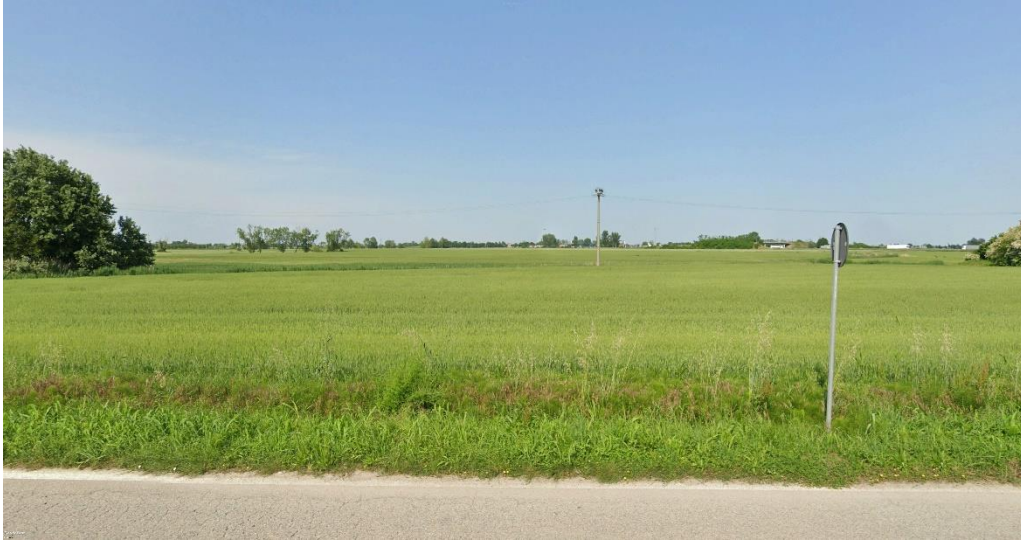
Figura 2 - Foto 1