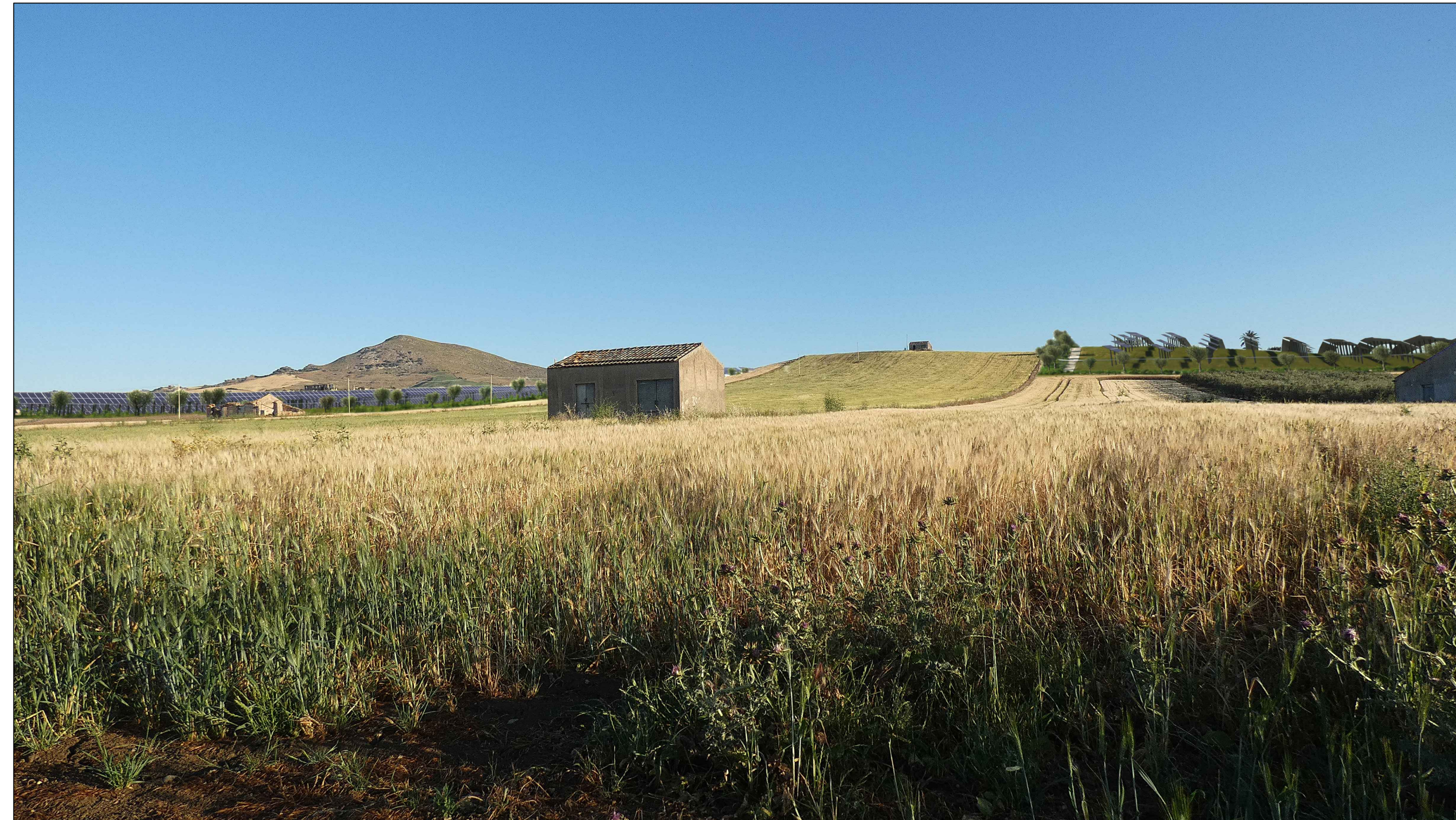
Fotosimulazione stato di progetto