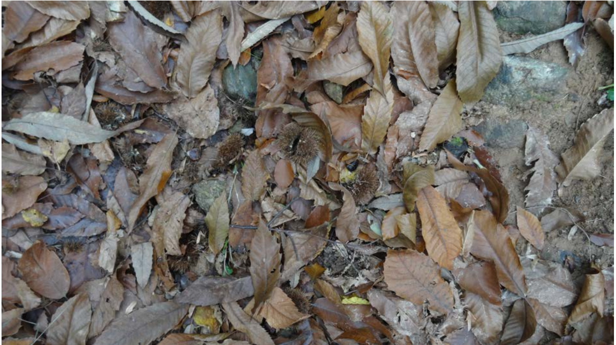
Foto 3.3/B lettiera del bosco di castagno