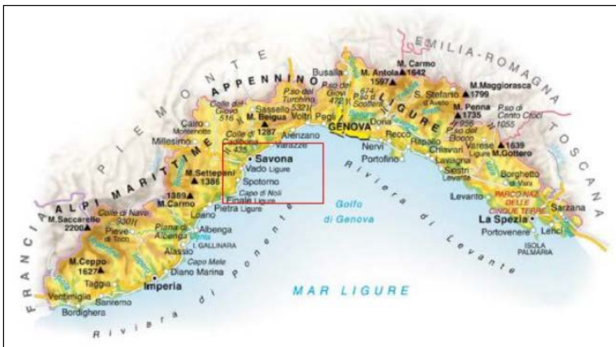
Fig. 2/A Localizzazione del progetto FSRU Alto Tirreno e Collegamento alla Rete Nazionale Gasdotti

La FSRU riceverà gas naturale liquefatto (GNL) dalle navi cisterna di GNL che trasferiranno il prodotto in modalità STS (Ship-To-Ship). Il GNL sarà quindi rigassificato a bordo della FSRU e il gas verrà esportato a terra attraverso una nuova condotta DN 650 (26”) fino all’impianto PDE e da qui ai relativi collegamenti fino alla Rete Nazionale Gasdotti.