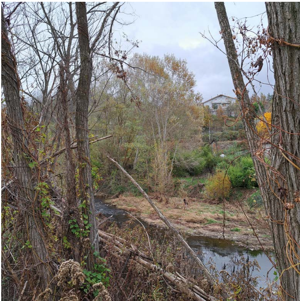
Foto 3.3/G formazione ripariale con salice bianco in destra idrografica del fiume Bormida di Spigno

Nei tratti più disturbati la vegetazione si riduce ad una copertura erbacea composta da specie ubiquitarie che in alcuni tratti si arricchisce della presenza di arbusti a spiccata mesofilia tra cui la berretta da prete, il sambuco, la sanguinella ( Cornus sanguinea ) e della robinia.