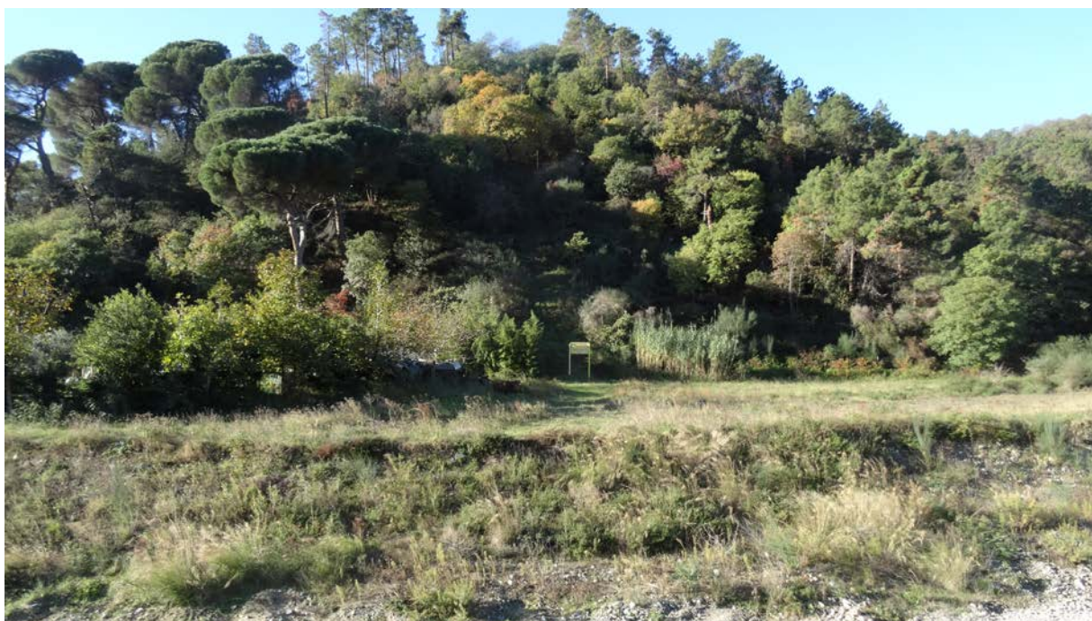
Foto 3.3/E bosco a dominanza di pini nella risalita dal torrente Quazzola

Nella prima parte del tracciato si riscontra una vegetazione a dominanza di pino marittimo, cui si accompagnano altre specie arboree sempreverdi tra cui il pino domestico ( Pinus pinea ) e il pino d'aleppo ( Pinus halepensis ) e latifoglie sempreverdi come il leccio, con caducifoglie come l'orniello, l'acero di monte, la roverella, l'acero campestre, l'alloro e numerosi elementi arbustivi, tra i quali dominano la ginestra dei carbonai e l'erica arborea con il corbezzolo e l'ilatro comune.