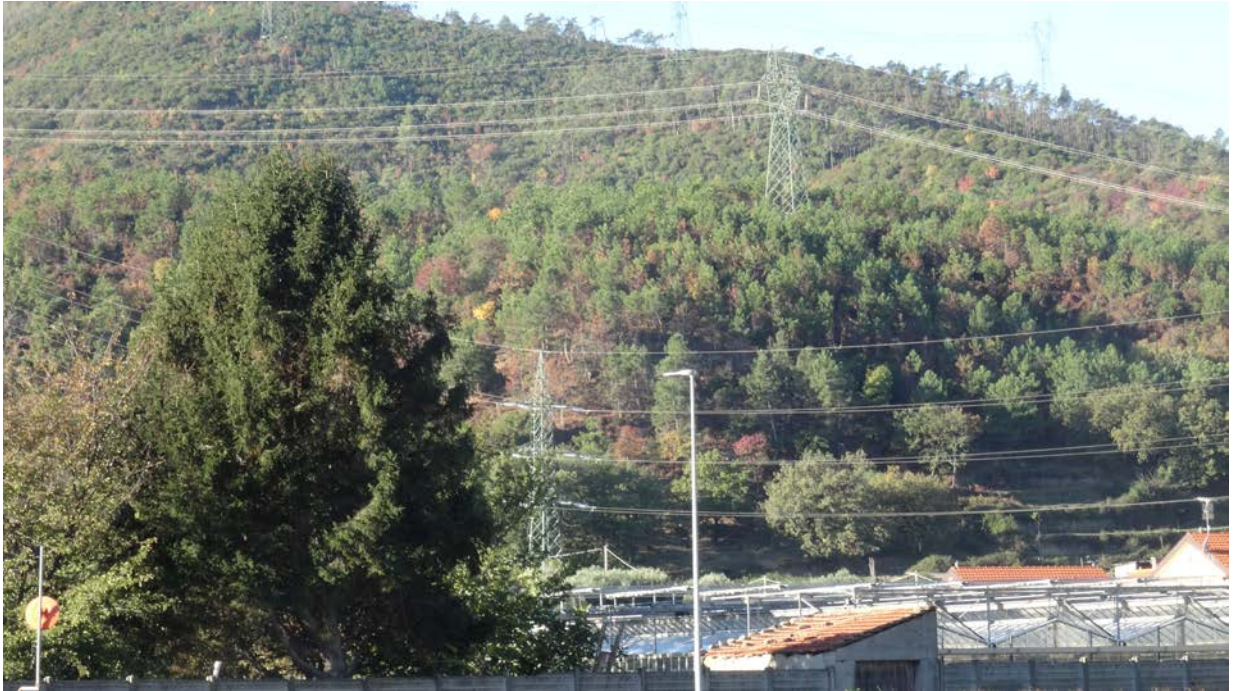
Foto 3.3/F la vegetazione presente in destra idrografica del torrente Quiliano