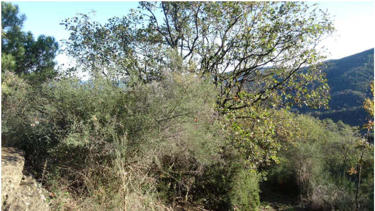
Foto 3.3/C aspetto di bordo del querceto a roverella

Nella fascia climatica collinare spesso si riscontrano querceti misti in cui vegeta in modo costante la roverella ( Quercus pubescens ), indicando una condizione di minore mesofilia rispetto alle cerrete. La dominanza della roverella si può ricondurre anche a fattori edafici, per il fatto che la specie predilige crinali e versanti meglio drenati. Il cerro ( Quercus cerris ) può essere comunque presente e, in alcuni casi, si nota la presenza della rovere ( Quercus petraea ) e del leccio ( Quercus ilex ). Solitamente in queste fitocenosi sono diffusi anche l'orniello ( Fraxinus ornus ) e il carpino nero ( Ostrya carpinifolia ), il nocciolo, l'acero campestre ( Acer campestre ), l'acero di Ungheria ( Acer obtusatum ) ed anche individui di pino marittimo. Lo strato arbustivo solitamente è ben sviluppato con la presenza di numerosi elementi della macchia mediterranea come il corbezzolo ( Arbutus unedo ), l'ilatiro comune ( Phillyrea latifolia ) il cisto rosso ( Cistus creticus ssp. eriocephalus ), l'erica arborea e una notevole presenza di ginestra dei carbonai ( Cytisus scoparius ).