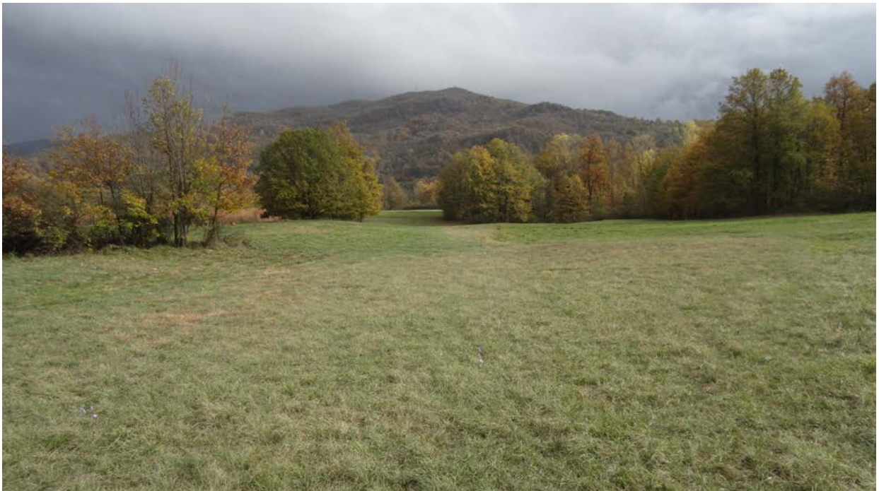
Foto 3.3/I prateria sinantropica in prossimità dell'impianto terminale

Queste aree, una volta terminati i lavori, saranno oggetto di inerbimento per accelerare il recupero ed il rapido ritorno alla medesima destinazione d'uso del suolo presente nella fase ante-operam.