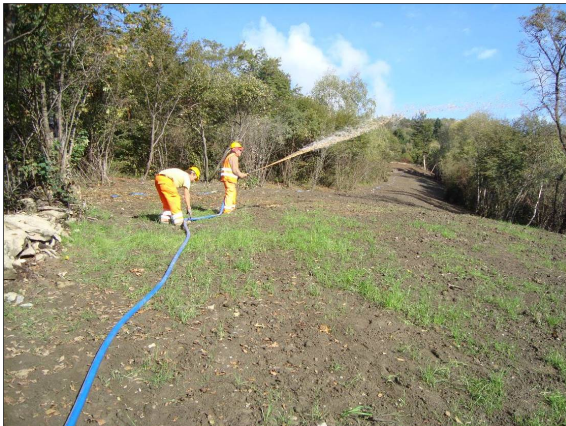
Foto 6.2/A - Distribuzione del miscuglio di semi per l'inerbimento e dei fertilizzanti mediante idrosemina

La tecnica di copertura e protezione del terreno con resine o altre sostanze accelera il processo di applicazione, in quanto in un'unica soluzione vengono distribuiti contemporaneamente sementi, concimi e resina, quest'ultima con funzioni di collante.