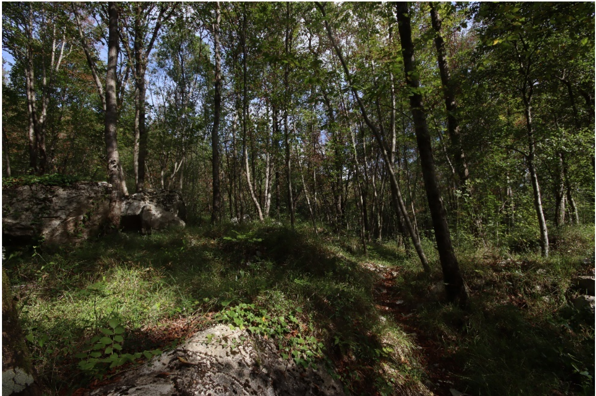
Foto 3.3/D orno-ostrieto

In questa tipologia vegetazionale rientrano le cenosi boschive che si sviluppano nel piano collinare e submontano riferibili a boschi misti a dominanza di carpino nero e orniello ai quali si accompagnano, a seconda delle esposizioni più o meno termofile, la roverella, il leccio, la rovere, l'acero campestre e il castagno, con uno strato arbustivo e erbaceo ben sviluppato. Spesso la variabilità dei querceti e degli ostrieti è legata, oltre che alle condizioni stazionali, anche alla modalità di gestione selvicolturale.