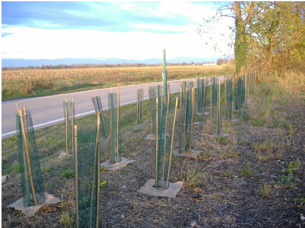
Fig. 6.5.2/A Shelter di rete in plastica per la protezione individuale delle piantine impiegate nel rimboschimento (altezza shelter 1 metro per piante alte 0,6-0,8m; altezza shelter 1,5 metri per piante alte 1,5 m)

Per ogni protezione è richiesta l'applicazione di tre tutori di sostegno e di ancoraggio in bambù, di 3 – 3,5 cm di diametro. Essi devono avere un'altezza tale da garantire la funzionalità della protezione, la resistenza agli eventi atmosferici (neve, vento, ecc.) e la difesa da danni da animale.