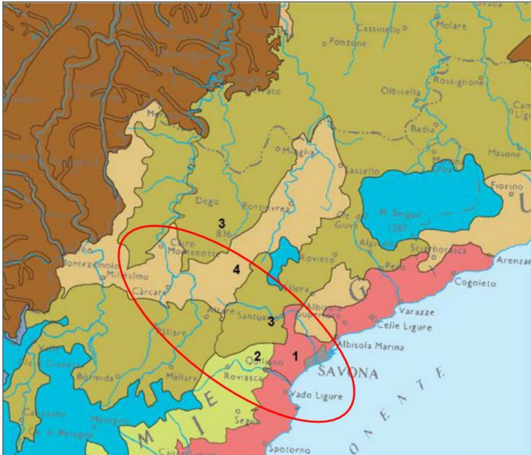
Fig. 3.1/A stralcio della Carta delle Serie di Vegetazione d'Italia (Blasi, 2010) – in rosso l'area interessata dal progetto

In linea generale, la vegetazione del settore costiero presenta principalmente fitocenosi appartenenti alla Classe Quercetea ilicis , spesso in contatto catenale con formazioni più mesofile delle classi Querceto-Fagetetea e Rhamno-Prunetea , che colonizzano prevalentemente i versanti più freschi esposti a Nord e i fondivalle mesofili, più freschi e umidi.