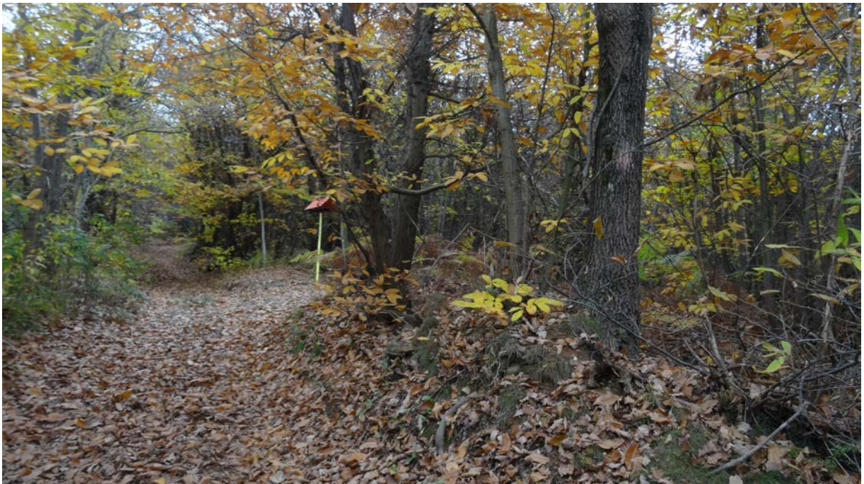
Foto 3.3/A Aspetto di castagneto lungo il tracciato

L'attuale tipologia dei boschi di castagno è legata, come nella maggior parte delle altre Regioni italiane, alle alterne vicende di abbandono del castagneto da frutto e successive ceduazioni, vasto fenomeno iniziato già dai primi del 1900 per ragioni fitosanitarie e socioeconomiche; tali vicende hanno permesso l'instaurarsi di estesi fenomeni di invasione da parte di numerose latifoglie autoctone e la costituzione di popolamenti irregolari, per composizione, strutture e stadi di sviluppo. I castagneti acidofili sono popolamenti che si instaurano su substrati silicei (arenarie, scisti, serpentiniti, conglomerati silicei) o suoli acidificati, con predominanza di specie acidofile come il brugo ( Calluna vulgaris ), il mirtillo ( Vaccinium myrtillus ) e la ginestra tuberculosa ( Genista pilosa ).