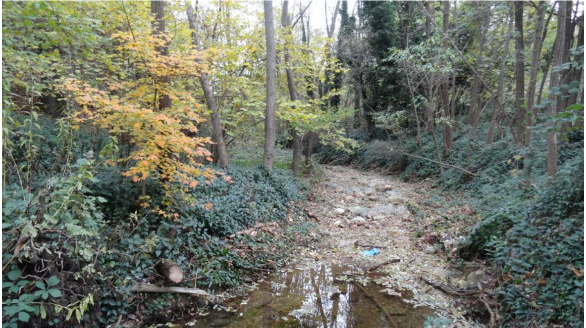
Foto 3.3/H aggruppamento a robinia in una formazione ripariale con presenza di ontano nero, acero campestre e nocciolo lungo il Rio Femmina morta