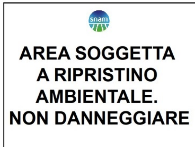
Fig. 6.5.3/A Cartello Monitoro

In alto al centro in colore blu si riporta il logo della Snam Rete Gas, (Fig. 6.5.3/A); attualmente in essere in tutti i cantieri Italia per analoghi lavori.