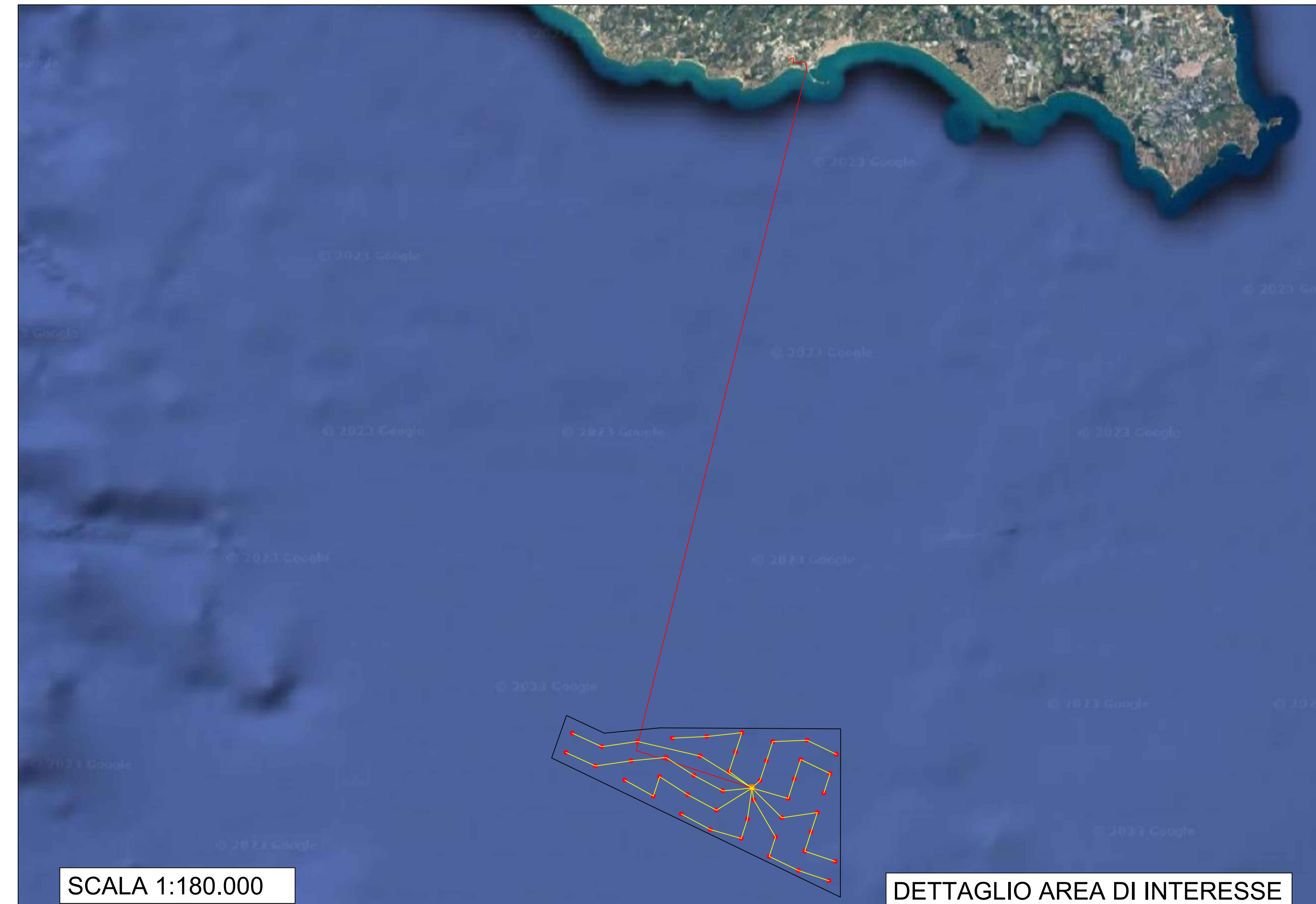
DETTAGLIO AREA DI INTERESSE