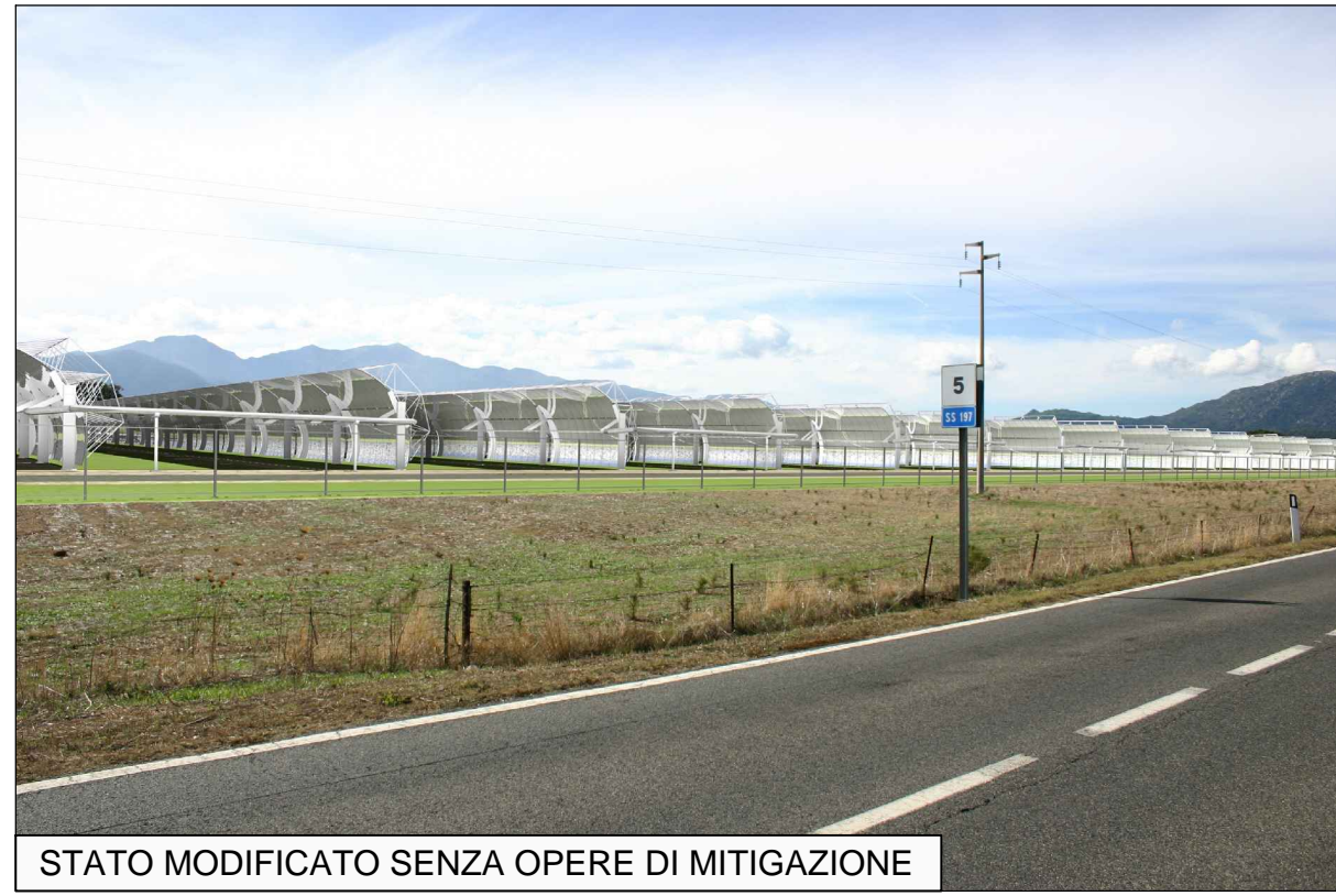
STATO MODIFICATO SENZA OPERE DI MITIGAZIONE