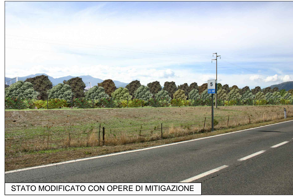
STATO MODIFICATO CON OPERE DI MITIGAZIONE