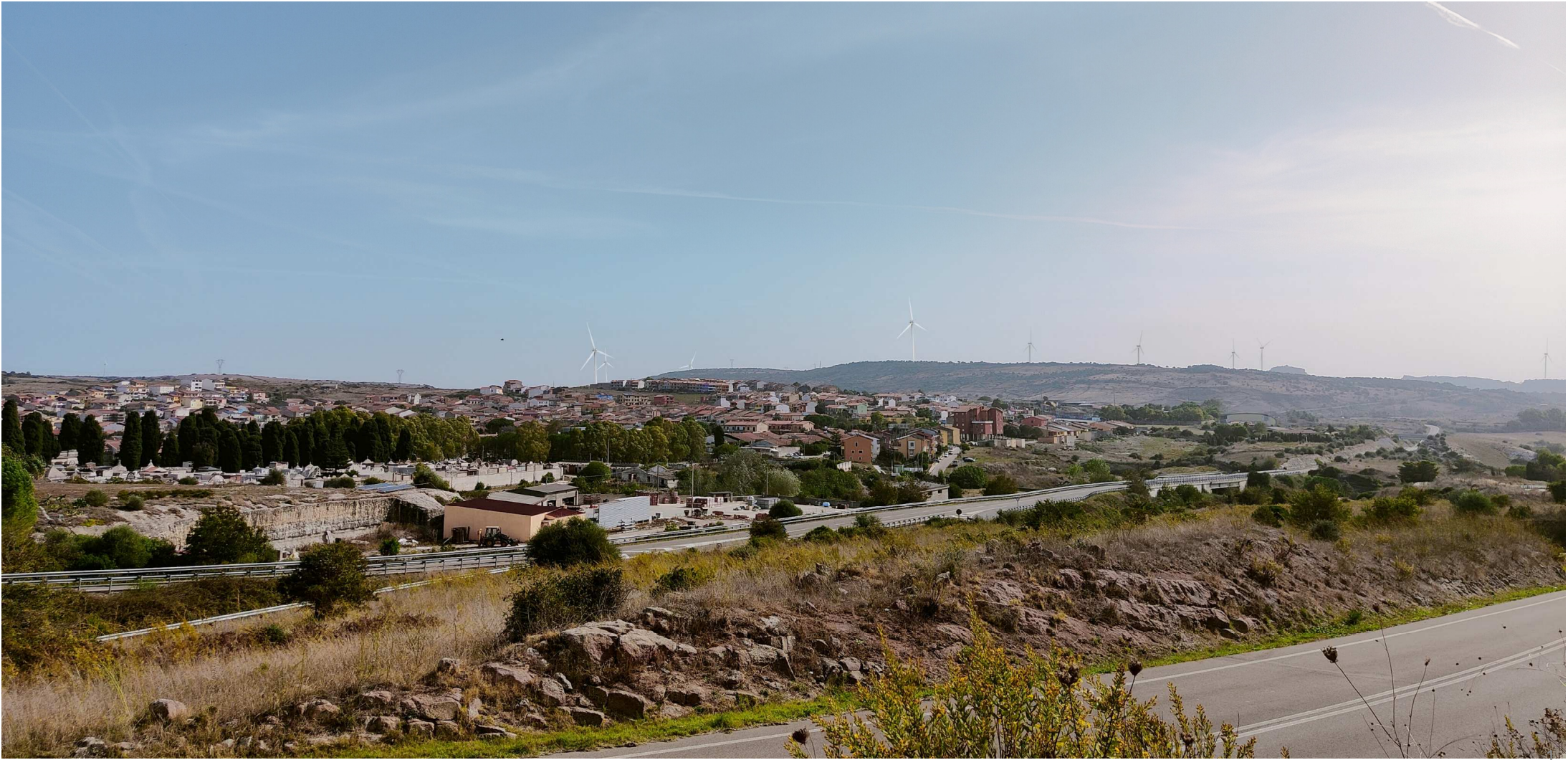
QQR- WND- 018- ELB026