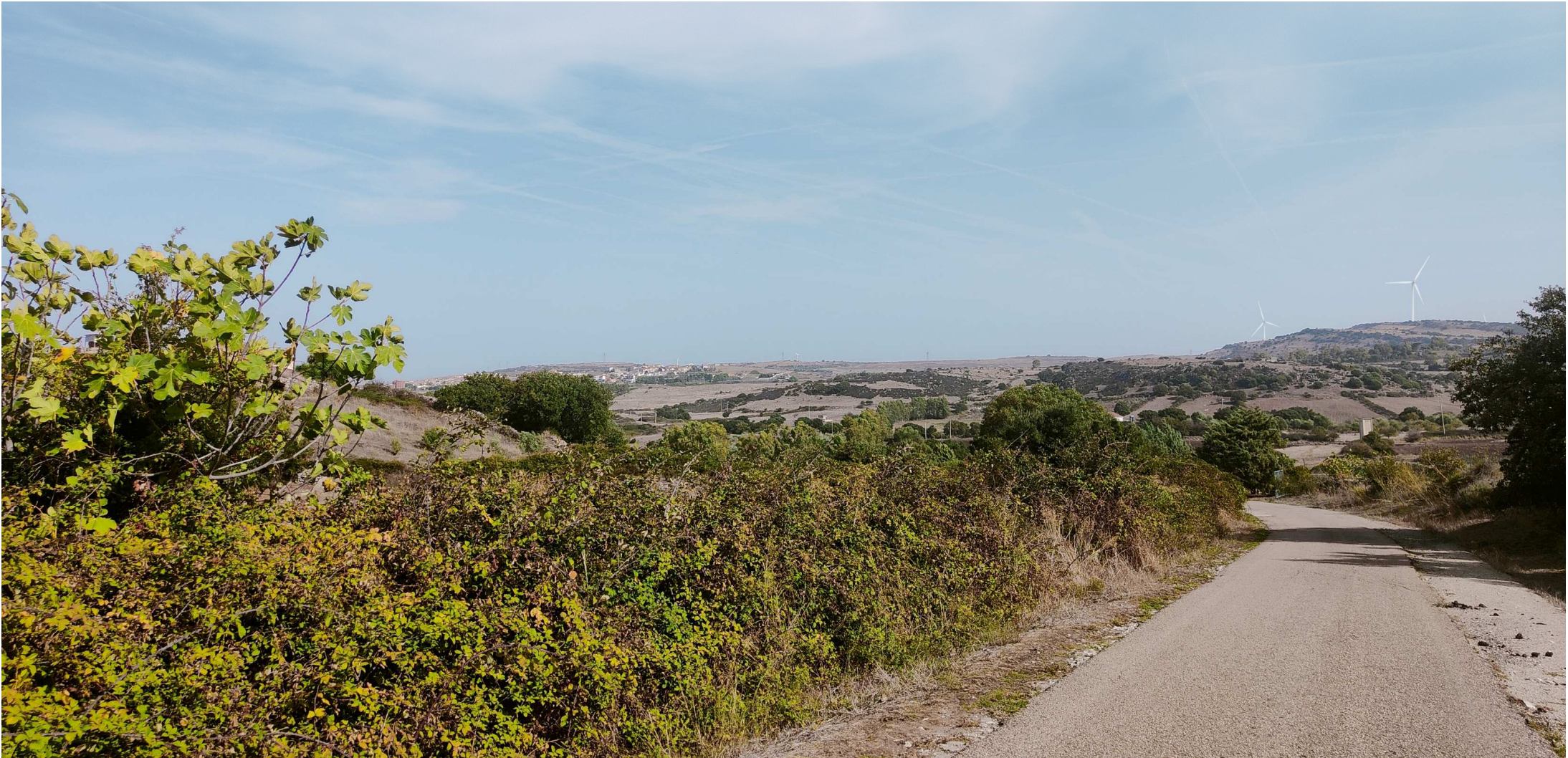
QQR- WND- 018- ELB026