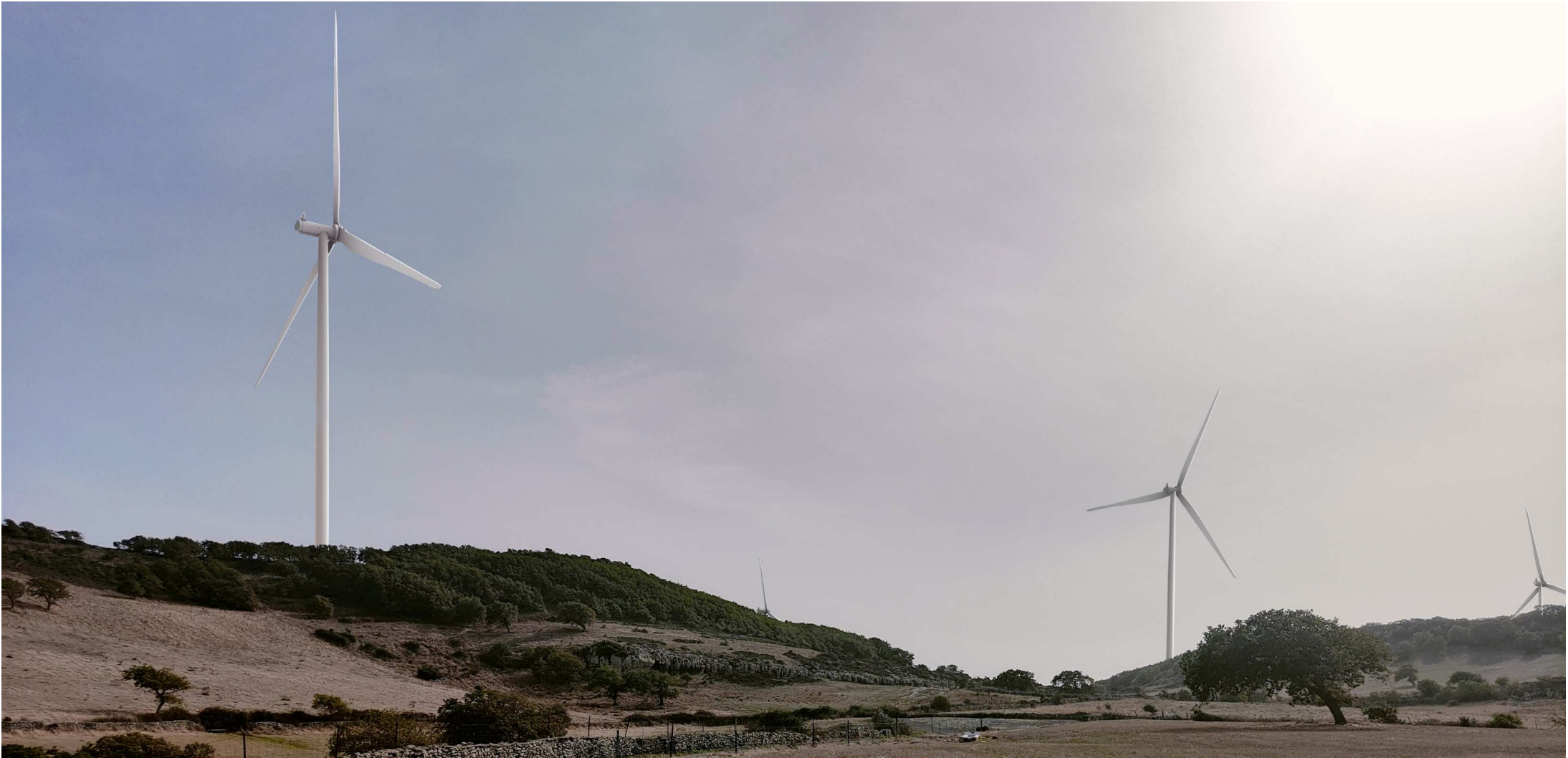
QQR- WND- 018- ELB026