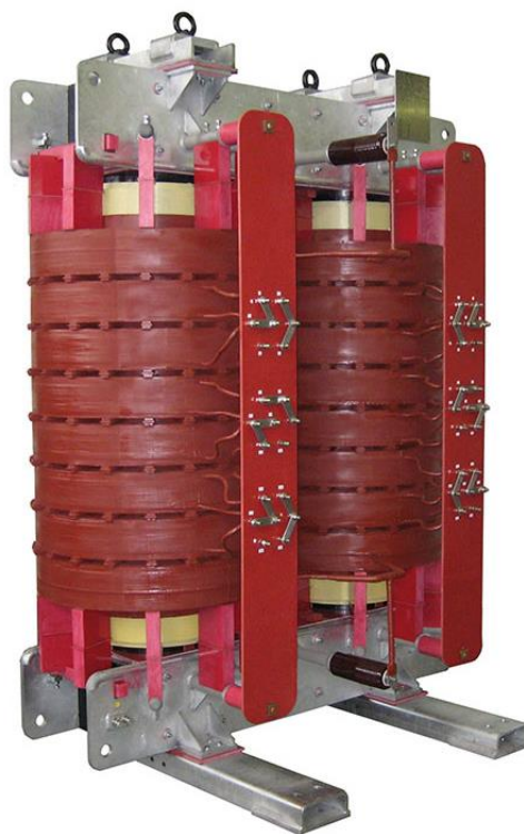
Figura 1 - Reattanza SHUNT per linea 36kV

In corrispondenza della potenza attiva P=0 ed in assenza di regolazione di tensione, l'impianto dovrà minimizzare gli scambi di potenza reattiva con la RTN al fin di non influire negativamente sulla corretta regolazione della tensione. Per fare ciò si è previsto l'utilizzo di reattanze shunt gestite con neutro isolato da terra opportunamente dimensionate per garantire in grado di compensazione tra il 110% ed il 120% della massima potenza reattiva.